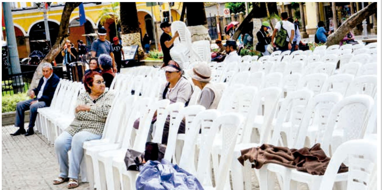
PASIÓN POR LA RETRETA. Un conjunto de sillas para asistir a la interpretación de la retreta municipal ayer en la plaza principal, como cada primer jueves de mes. Pese a que el evento se realizaría en la noche, ya desde la mañana dejaba la gente alguna prenda en señal de que el lugar está reservado. ¡Cómo gusta la retreta!

ENVÍE SU FOTO PARA PUBLICARLA EN ESTA SECCIÓN A: fotografia@lostiempos-bolivia.com