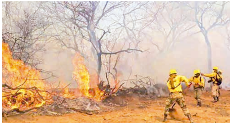
Bomberos controlan un incendio en la Chiquitanía, en 2023.

Los incendios en Bolivia se incrementaron desde inicios del milenio, el promedio anual es de 3,7 millones de hectáreas quemadas entre 2001 y 2020 según el último reporte de la Fundación Amigos de la Naturaleza (FAN) y Wildlife Conservation Society (WCS). La mayoría de las zonas quemadas es territorio indígena.