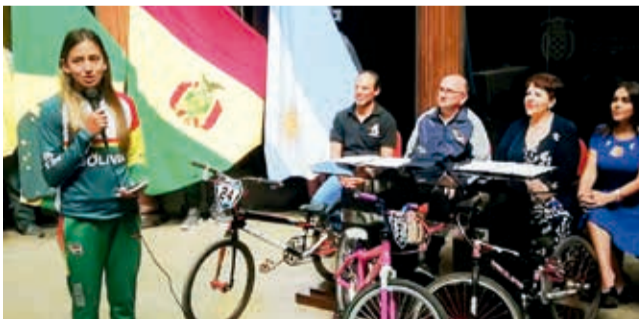
Presentación de la Copa Latina de BMX, ayer. HERNÁN ANDÍA

Bicicross. Con la presencia de más de 150 ciclistas, este fin de semana se realizará el primer y segundo round en La Tamborada