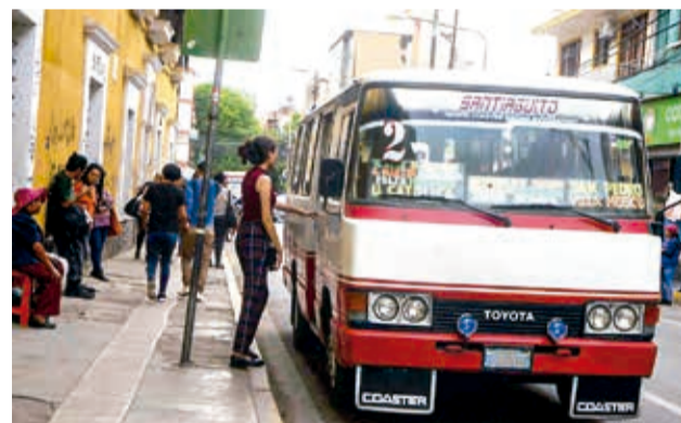
Vehículos que prestan el servicio público. DANIEL JAMES

“Efectivamente, son 10 meses de apertura de cambio de nombre y rubro de sitios y lugares legalmente establecidos. Este viernes termina el ingreso y, una vez que los comerciantes presentan, te-