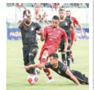
Partido entre Guabirá y Real Santa Cruz.

El duelo entre Albos y Azucareros se jugará desde las 15:00 en el estadio Ramón Aguilera Costas; mientras que el partido entre el Inmobiliario y el cuadro tarijeño se disputará desde las 20:30, en el mismo escenario deportivo.