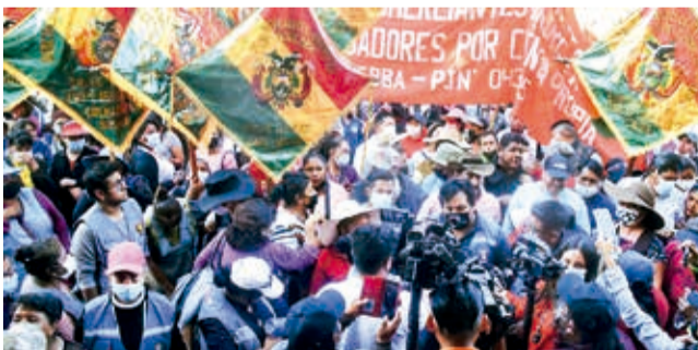
Una marcha de comerciantes (archivo).

Alcances. La Intendencia informó que se concluyeron 4 mil trámites y que sólo unos 200 fueron observados en los últimos 10 meses