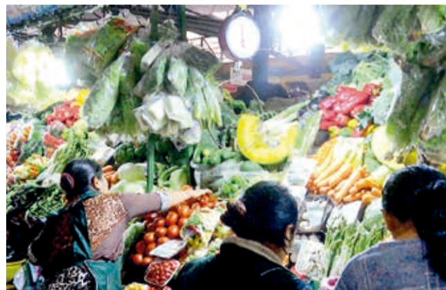
Productos de consumo básico en un mercado. HERNÁN ANDÍA

Variación. Los productos que más subieron fueron el tomate y la cebolla; el que más bajó, el transporte interdepartamental.