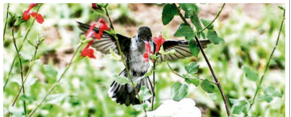
Un colibrí revolotea en el parque Fidel Anze, en el norte de la ciudad.

Tampoco existe una resolución específica de cambio de uso de suelo, menciona. Ante esto, los arquitectos rechazan la construcción. Tras una inspección en febrero, por el proceso que inició un grupo de activistas, la Alcaldía insistió en que cumple con la Ley de Alianza Público Privadas (APP) y que se trata de un área de equipamiento.