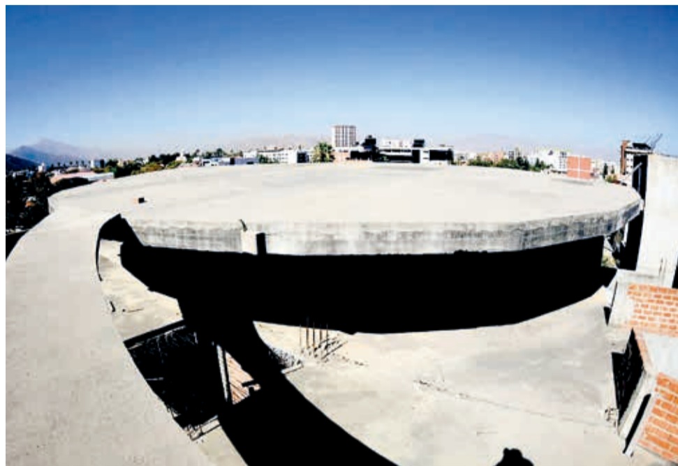
El helipuerto que se hizo en el hospital del niño y ahora será demolido. CARLOS LÓPEZ

La tercera línea aborda la valoración del helipuerto. Indicó que se estudian cuatro tecnologías para su retiro y se invertirán 200 mil bolivianos.