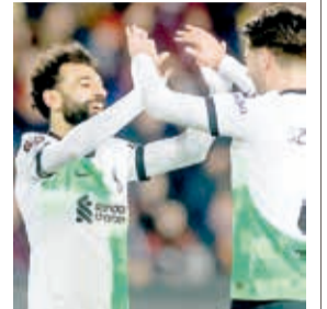
Mohamed Salah (izq.) felicitando a Dominik Szoboszlai por su gol.