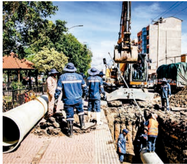
El inicio de los trabajos para el colector del sur.