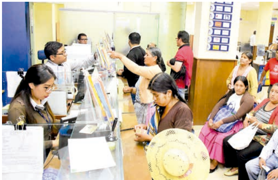
Clientes en una entidad financiera de Cochabamba. CARLOS LÓPEZ

De acuerdo con el estudio "Brechas de género en la inclusión financiera", del Grupo Credicorp, el 12 por ciento de las mujeres bolivianas alcanzó un nivel óptimo de inclusión financiera, tan sólo un punto porcentual más que el año pasado (11 por ciento). Por su parte, los hombres registraron un 17 por ciento en el mismo nivel, alcanzando igualmente sólo un punto porcentual más que en la evaluación anterior (16 por ciento). La inclusión financiera es evaluada por Credicorp a través de indicadores de acceso, uso y calidad percibida.