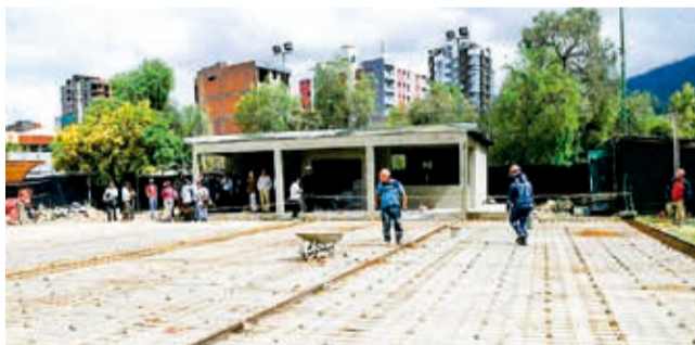
Las canchas de pádel en el parque del Arquitecto. C. LÓPEZ

Proyecto. La Alcaldía de Cochabamba afirma que el espacio en el que se construyen las canchas son áreas de equipamiento