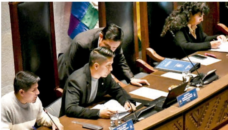
Andrónico Rodríguez preside una sesión en la Cámara de Senadores.