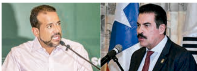
Luis Fernando Camacho y Manfred Reyes Villa. ESM

La propuesta de Mesa señala que en las primarias pueda votar, de manera voluntaria, cualquier ciudadano inscrito en el Padrón Electoral y no sólo