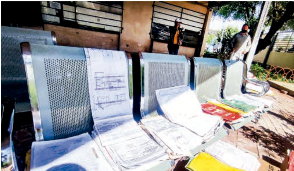
La documentación que se remojó por la inundación en la av. 6 de Agosto. DANIEL JAMES