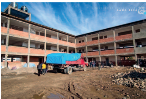
Construcción de la moderna infraestructura educativa supera los Bs. 6 millones

Además, se incluye un Área Académica con talleres de gastronomía, gabinete de computación, taller de peinados, taller de corte y confección, laboratorio de biología, laboratorio de química, laboratorio de física y salón múltiple. En el primer piso se encuentran 14 aulas y en el segundo piso hay cuatro aulas.