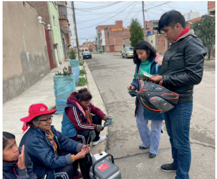
Los voluntarios aprovecharon cada espacio para hacer conocer sobre la Hora del Planeta

Durante el sábado 9 y domingo 10 de marzo, se recorrió distintos lugares para la socialización, pero principalmente, los