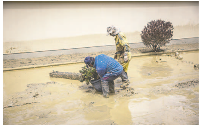
Dos personas levantan una planta de en medio de una calle inundada de barro tras el desborde de un río en La Paz

En este contexto, actualmente rige una alerta roja del Servicio Nacional de Meteorología e Hidrología