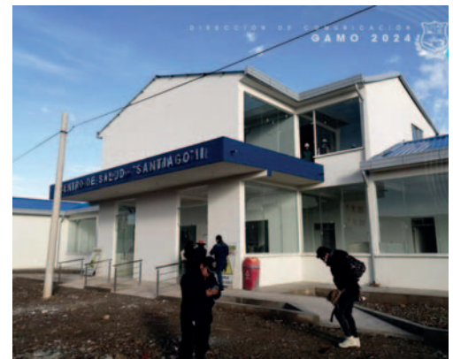
Centro de Salud Santiago II está próximo a concluirse

Durante la inspección al Centro de Salud Dios es Amor, que tiene una inversión de más de siete millones de bolivianos, se verificó que la obra tiene un avance físico del 41% y un avance financiero del 27%.