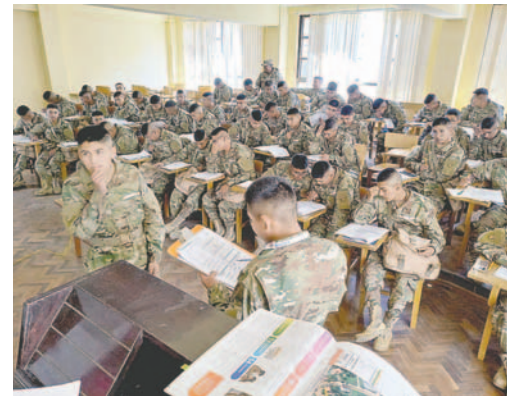
Rumbo al Censo, premilitares fueron capacitados

Para las capacitaciones, el INE implementó una plataforma semipresencial con el objetivo de garantizar el aprendizaje del agente censal en la obtención de datos censales de calidad, siguiendo estándares internacionales. El contenido de la plata-