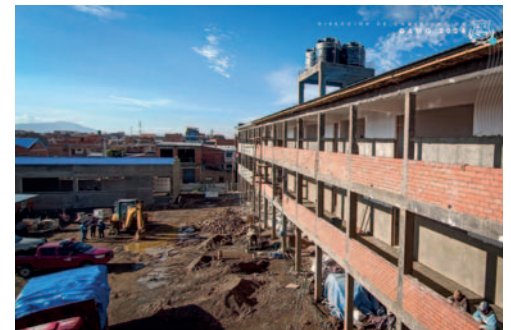
Obra tiene un avance físico del 73%

pla la construcción de una nueva infraestructura en un área de más de 3 mil metros cuadrados. La planta baja consta del Área Administrativa, que incluye dirección, secretaría, sala de reuniones, archivo y cocineta.