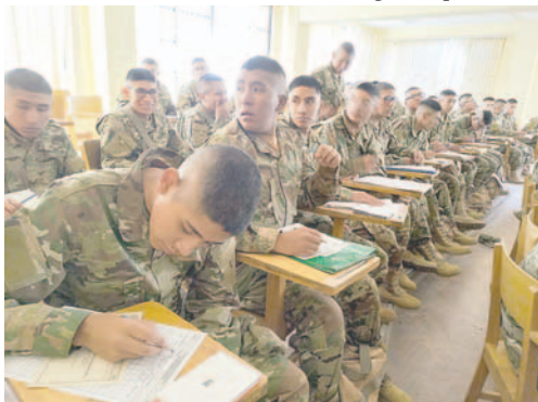
Premilitares colaborarán como censistas /INE

El cuestionario consta de 59 preguntas distribuidas en siete capítulos: Ubicación de la vivienda, Tipo de vivienda, Características de la vivienda con personas presentes, Emigración internacional, Mortalidad, Listado de personas y, finalmente, Características de cada persona.