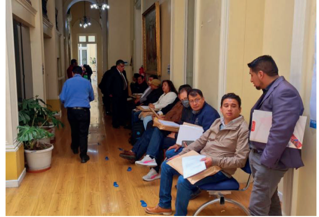
En esta jornada se instalará una sesión para la revisión de los documentos de los postulantes

tularon para el Consejo de la Magistratura (CM).