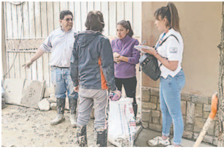
Galenos brindan atención médica y apoyo emocional a familias