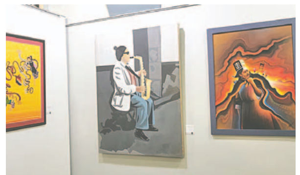
El arte de Sucre en las paredes de la Galería Valerio Calles /LA PATRIA

"Este personaje si existe y era un señor que vivía en la calle y era el contraste a la ciudad, una ciudad decorada, limpia y todo lo demás y