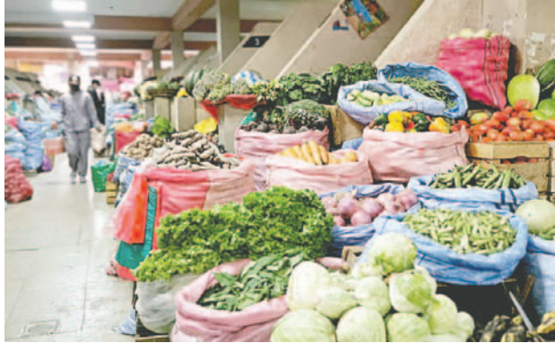
Piden inspecciones al interior de los mercados para controlar el precio de la canasta familiar

En los operativos de la Unidad de Defensa Al Consumidor para el control de pasajes, los ciudadanos pidieron que los gendarmes ingresen también hasta los centros de abasto, donde desde