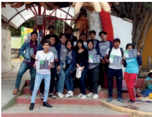
Socialización en inmediaciones del Zoológico

baterías de vehículos y otras similares a excepción de televisores de cuerpo ancho, refrigeradores y otros que tengan químicos, no se podrán recoger en esta campaña.