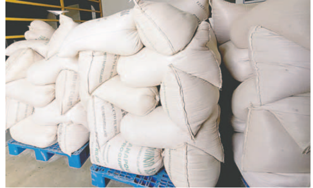
Algunos productos como la harina no rebajaron su precio

En el caso del fideo, LA PATRIA pudo evidenciar que la bolsa surtida que antes costaba entre 68 hasta 70 bolivianos, ahora está en 72 a 75 bolivianos, varios comerciantes refirieron que son los nuevos precios con los que les entregaron sus proveedores.