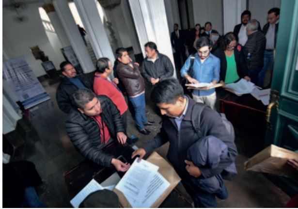
El domingo finalizó la primera fase con la postulación de 715 profesionales

En tanto, desde la Comisión Mixta de Justicia Plural detallaron que 91 profesionales presentaron sus documentos para el Tribunal Agroambiental (TA) y 184 personas se pos-