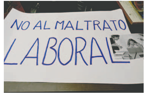
Carteles de funcionarios que se declaran en emergencia