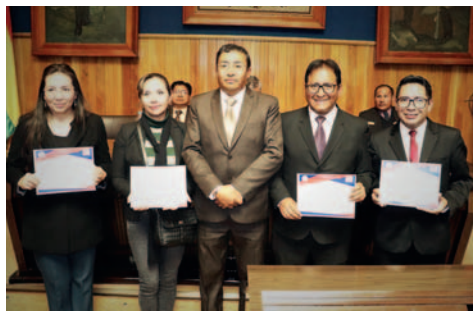
Docentes de la UTO que fueron reconocidos por indexar artículos de investigación en revistas internacionales

“Lo más valioso en esta oportunidad es la presencia de quienes invierten su tiempo adicional a la cátedra, a la investigación. Conocemos muy de cerca que muy lentamente estamos creciendo en la investigación, por ello nuestra preocupación para buscar medios para que podamos seguir”, re-