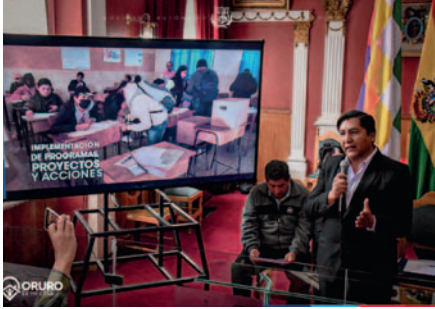
GAMO presentó avances rumbo al Censo