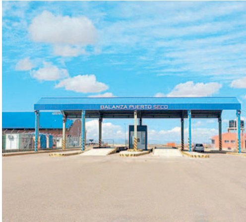
El Puerto Seco es un proyecto que está siendo impulsado por autoridades de Oruro y el sector privado

“Hemos puntualizado que en 13 años, desde el 2005 al 2021, solo se ha invertido unos Bs. 14.000.000. Sin embargo, ya en la gestión del gobernador (Johnny Vedia) en más de dos años, se ha invertido más de Bs. 34.000.000, con el propósito de reactivar Puerto Seco y ponerlo en marcha. Ya estamos conso-