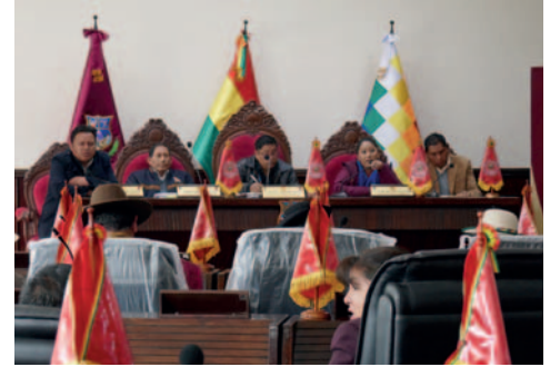
Las dos principales cabezas del directorio de la ALDO se presentaron en la sesión

Luego de varios minutos, se logró instalar la sesión ordinaria prevista