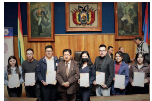
Las autoridades destacan el trabajo efectuado por docentes y egresados

“Esta actividad pretende premiar tres competencias de investigación, además, es el momento perfecto para felicitar a