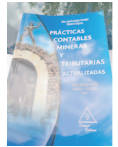
El libro contiene información muy interesante en el ámbito minero

En el libro, Flores destaca que las grandes empresas mineras privadas enseñan cómo trabajar en el sector público a pesar de las limitaciones existentes. La Corporación Minera de Bolivia (Comibol) enfrenta dificultades por la falta de recursos para nuevas inversiones y exploraciones mineras, viendo agotarse rápidamente las existentes. Para garantizar la sostenibilidad del sector, es necesario abordar esta