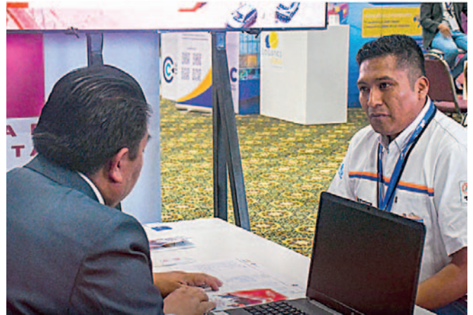
Personal de la Gobernación de Oruro socializa proyecto de Puerto Seco para nuevos inversores

“Es un importante espacio donde nosotros estamos dando a conocer las características y beneficios del Puerto Seco y de esta manera captar socios estra-