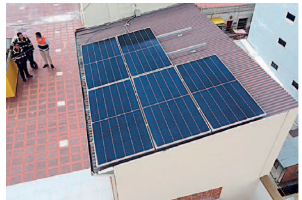
ENDE DeOruro incentiva este tipo de iniciativas para optimizar el uso de energía

La generación distribuida es impulsada por el Gobierno a través de ENDE Corporación,