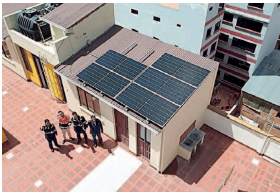
Los paneles fueron colocados en la parte alta de las edificaciones

Este ciudadano tomó la iniciativa de instalar en sus dos edificios, ubicados en la ciudad de Oruro, dos sistemas fotovoltaicos con una capacidad de generación de 2 kW y 4 kW. Para este fin, fue asesorado por una de las empresas especializadas en instalación de estos sistemas, autorizada por ENDE.