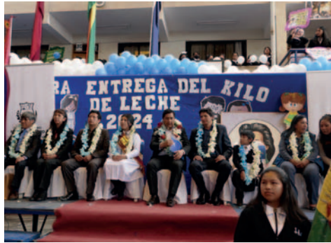
Kilo de leche llega los estudiantes de Oruro

través de todos los padres de familia para incentivar el consumo de leche, por eso el GAMO hace la entrega de un kilo de leche, que se les dará a cada uno de los estudiantes para que puedan tener una mejor alimentación en sus hogares”, manifestó.