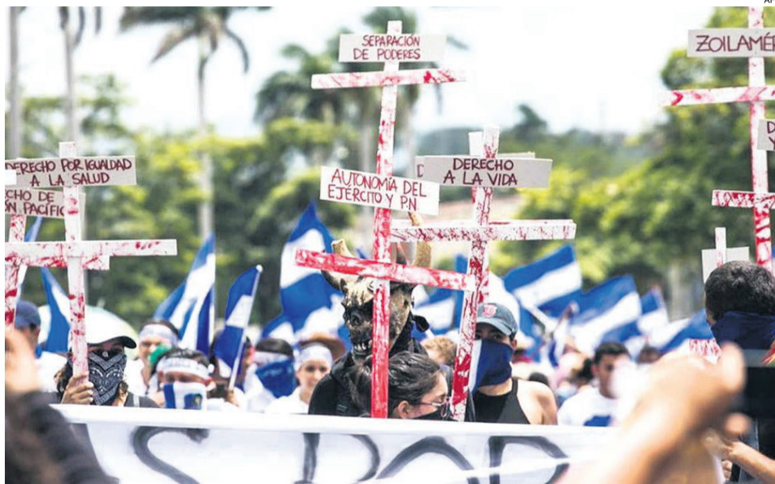
Durante 2023 hubo un aumento exponencial de patrones de violaciones para incapacitar a la oposición

“Durante 2023 ha habido un aumento exponencial de patrones de violaciones centrados en incapacitar cualquier tipo de oposición a largo plazo”, según el documento, que fue rechazado de plano por el gobierno de Nicaragua, que lo tildó de “irreal e irracional”. “El presidente Ortega, la vicepresidenta Murillo