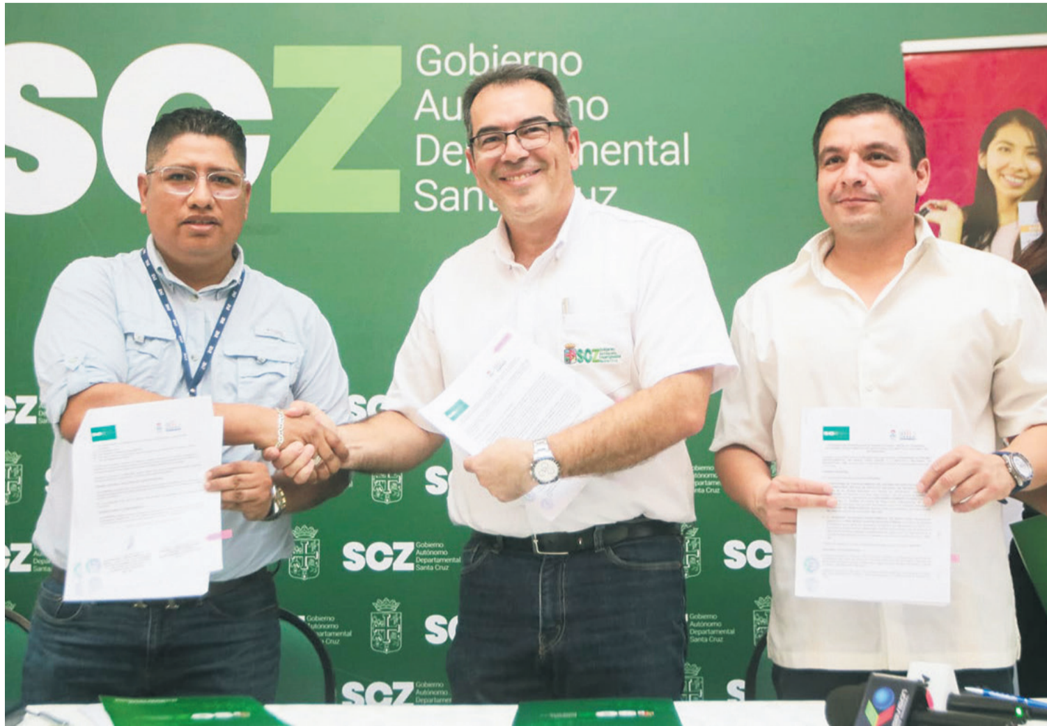
El INE y la Gobernación cruceña firmaron un convenio de cara al Censo Nacional de Población y Vivienda 2024, a realizarse el 23 de marzo