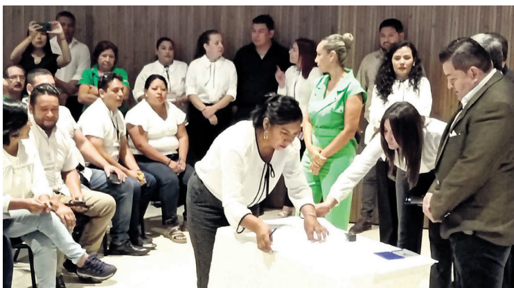
El alcalde Jhonny Fernández durante la rendición de cuentas