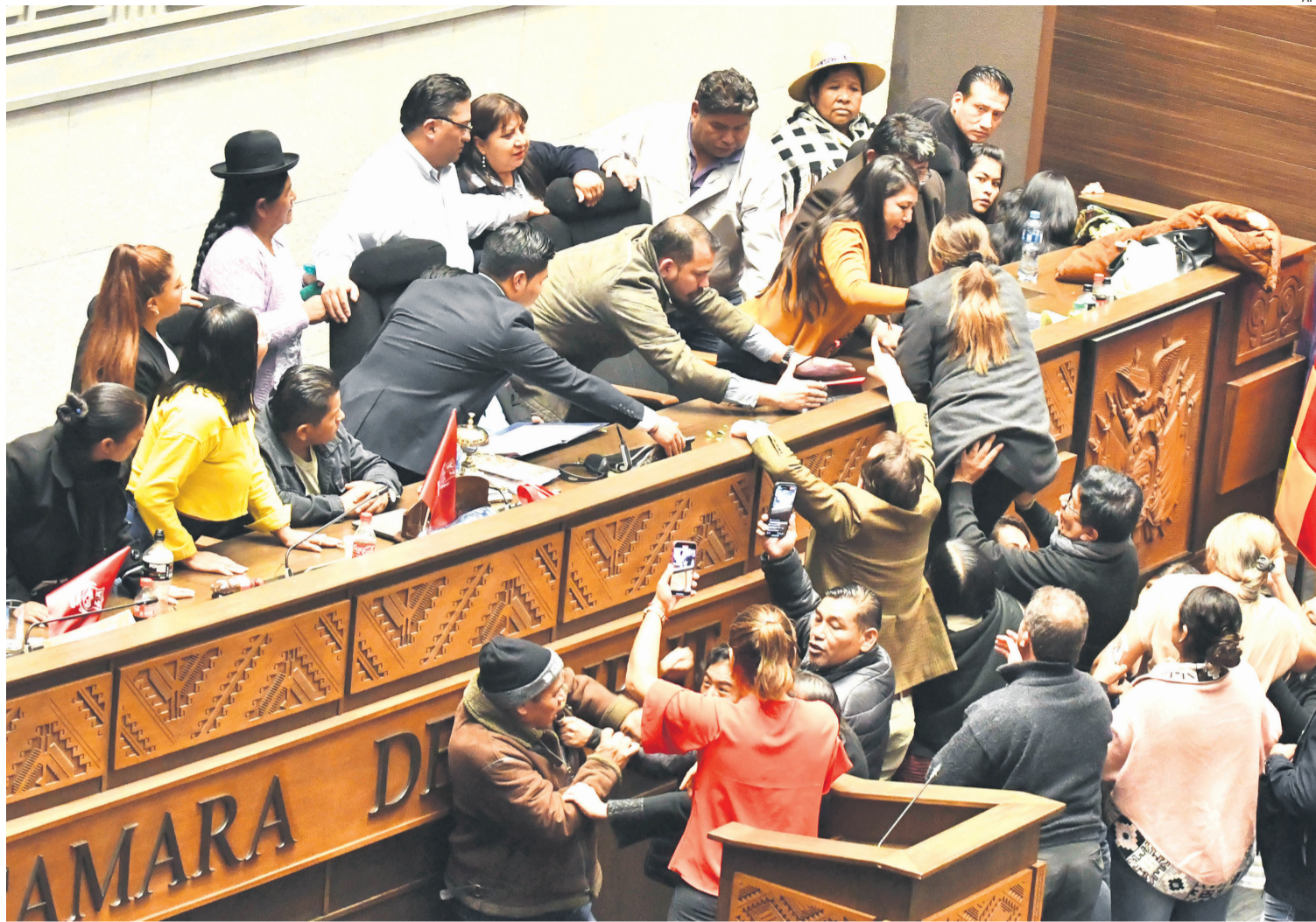
Diputados, varones y mujeres más los funcionarios de Israel Huaytari, se enfrascan en una batalla campal. Fue ayer.

EN EL LEGISLATIVO HUBO DESCONTROL Y VIOLENCIA