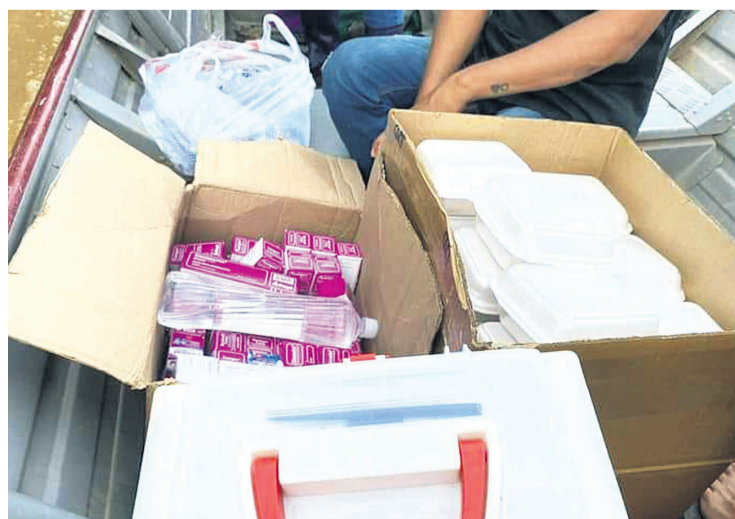
También distribuyen medicamentos en lanchas

De acuerdo con el informe oficial, de las 1.179 familias que dejaron sus hogares, 997 están en viviendas de familiares o amigos y 277 se encuentran en los alber-