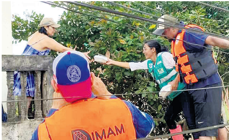
Hay personas que permanecen en sus casas, otras donde parientes o albergues