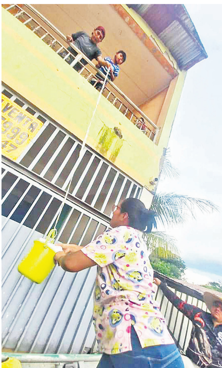
En medio de la corriente se desplaza la ayuda a los hogares

Este jueves el Comité de Emergencia Departamental (COED) aprobó la declaratoria de emer-