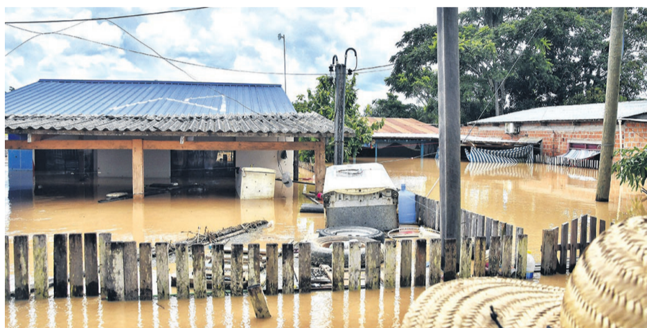
Los cobijeños están con esperanza de que las aguas descendan rápidamente

Tres unidades educativas y un centro de salud quedaron en medio del agua. Hay tres comunidades rurales de Cobija que también están muy afectadas.