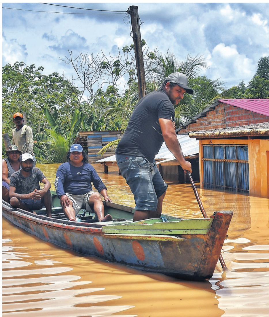
Las calles se mantienen anegadas y los pobladores hacen lo posible para desplazarse