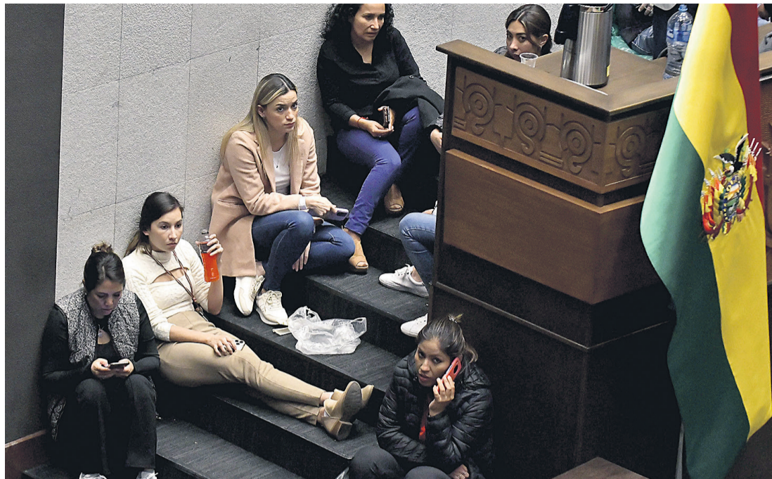
Las diputadas de oposición hacen vigilia en la testera por más de 50 horas.