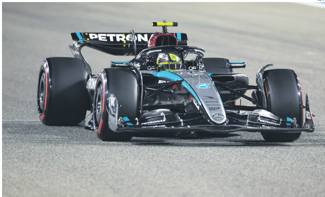
Lewis Hamilton tuvo un buen desempeño en la segunda sesión de ensayos que se llevaron a cabo ayer en el inicio de la temporada