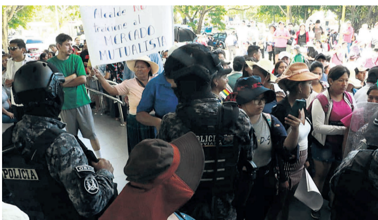
Comerciantes del Mutualista exigen defender los predios del mercado