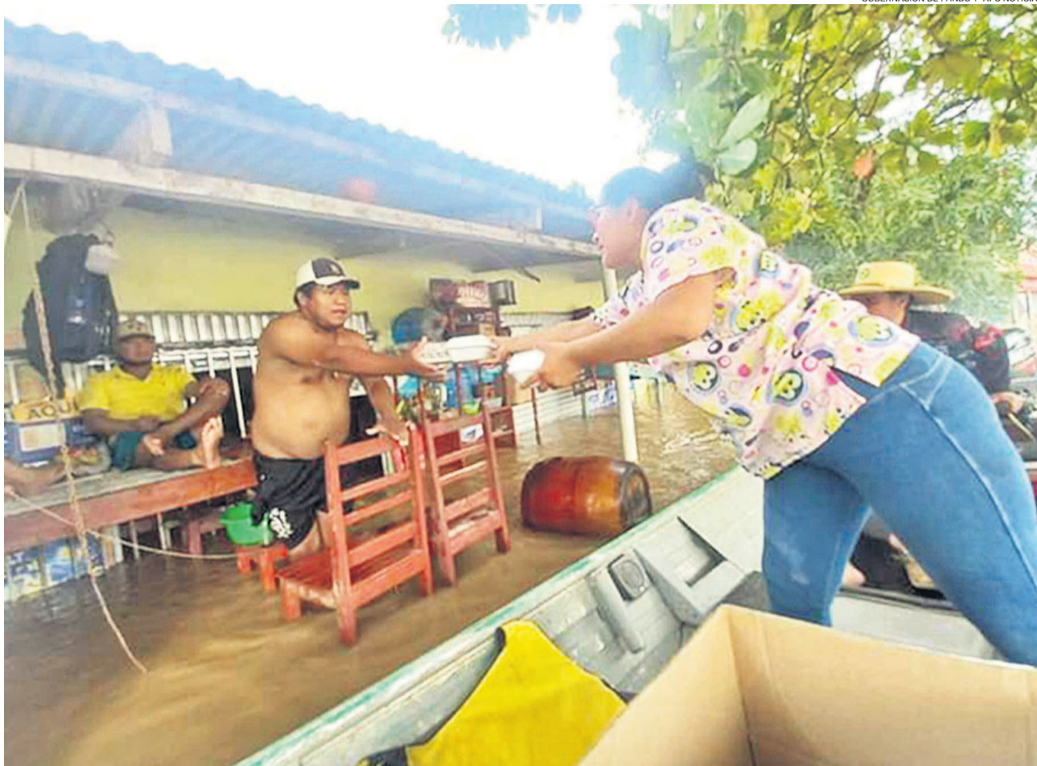
Algunas familias se dan modos para mantenerse en sus viviendas en medio del agua. Las brigadas se desplazan para entregar alimentos