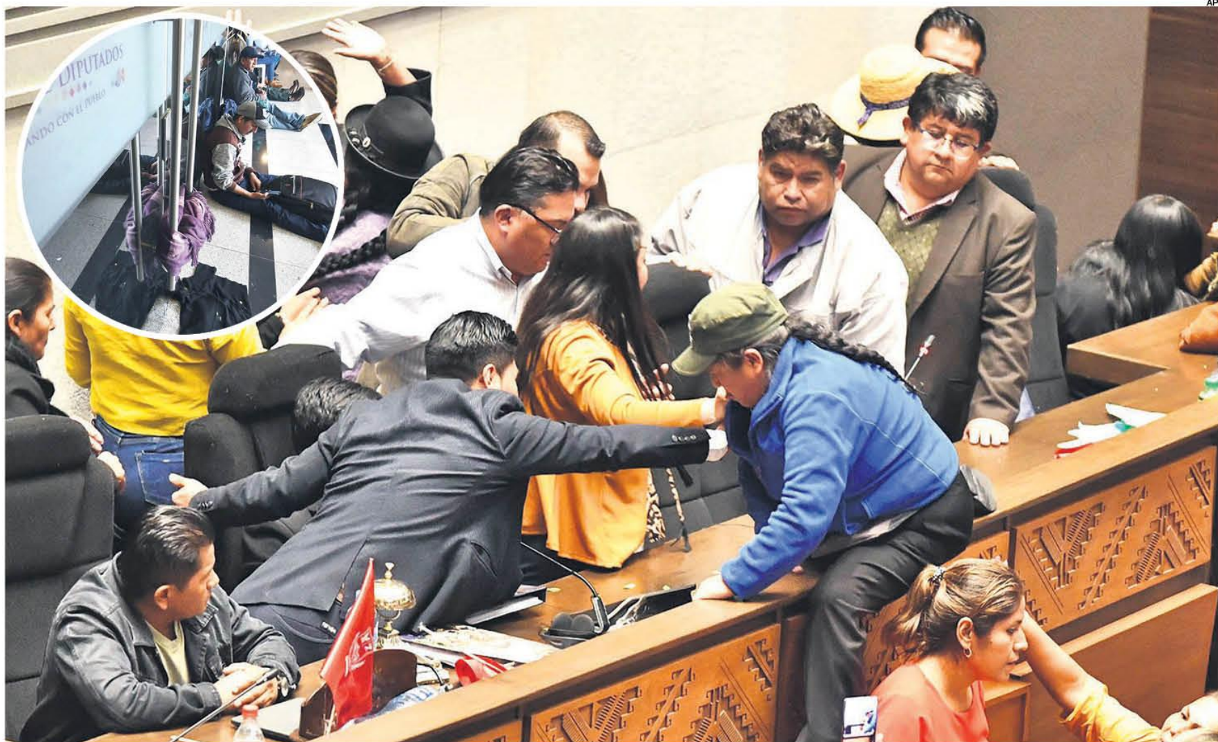
NUEVAS AGRESIONES. En la noche hubo otra trifulca de los diputados. Se instaló la sesión después de que movimientos sociales dejaran encadenada una puerta por la tarde (foto en el círculo)

TOMA VIOLENTA. GRUPOS AFINES A ARCE PRETENDIERON ENCADENAR LOS ACCESOS