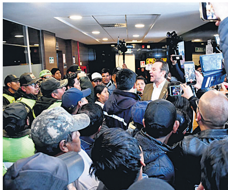
Un momento de tensión en medio de la toma del Legislativo.

En medio de la toma de la Cámara de Diputados y la intervención violenta de grupos afines al Gobierno, ayer se conoció que se instruyó el cambio de jefe de seguridad policial del Legislativo.