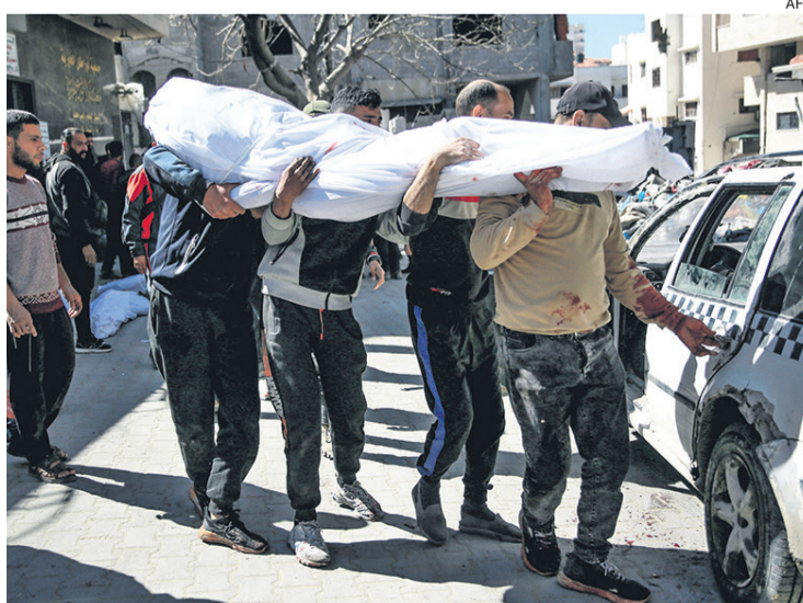
Consejo de Seguridad se reúne de emergencia; lo calificó de “masacre”

El secretario de Defensa de Estados Unidos, Lloyd Austin, afirmó a su vez que más de 25.000 mujeres y niños palestinos murieron en Gaza