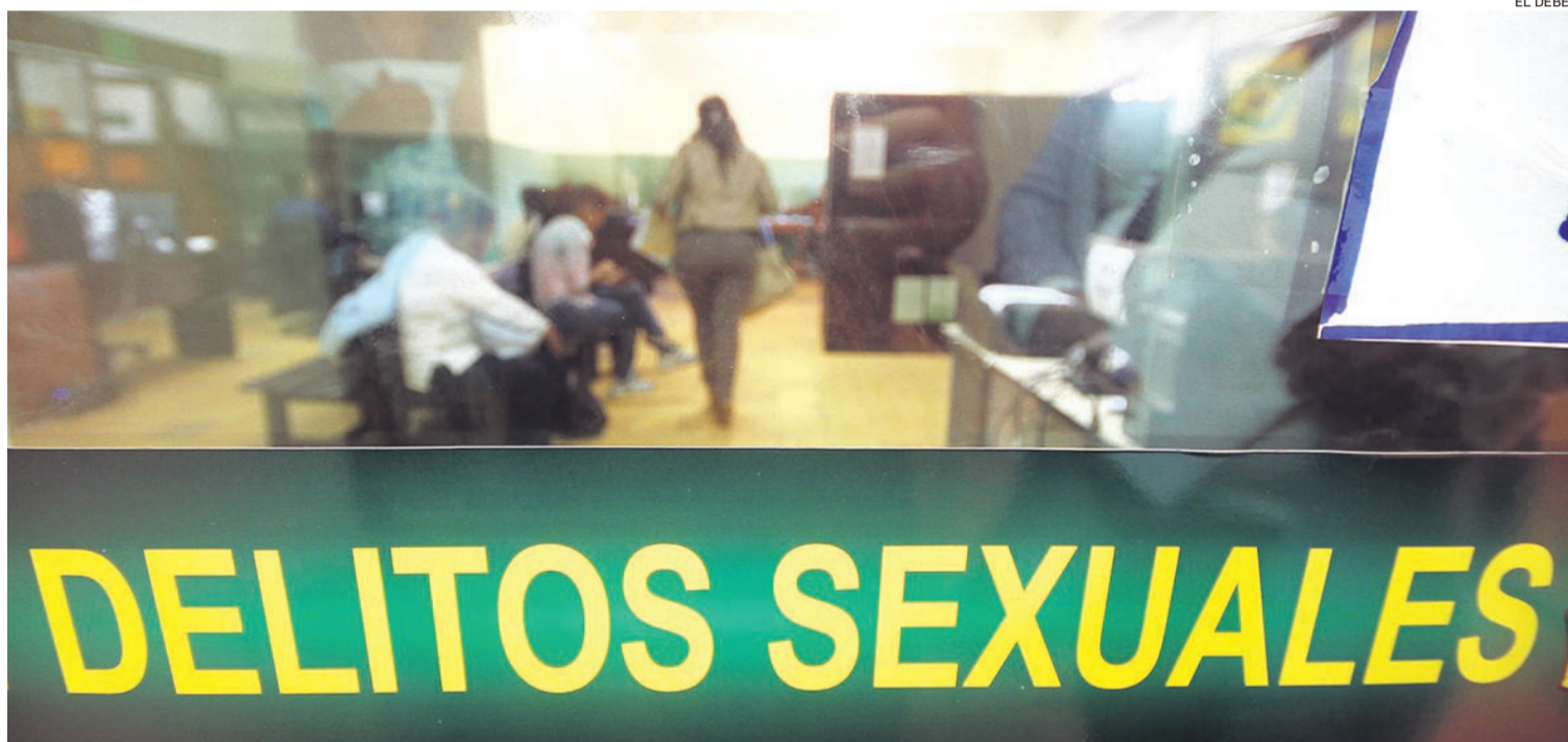
La Fuerza Especial de Lucha Contra la Violencia y la Fiscalía investigaron el hecho hasta la captura de dos de los agresores

Una madre revela el drama que está viviendo después de irse a la Argentina en busca de mejores días y regresar a ver a sus cinco hijos. Descubrió que su niña de 11 años fue violada por su padrastro y otro hombre del entorno familiar