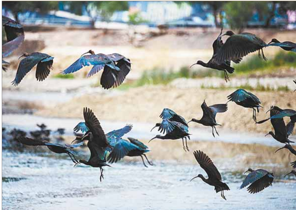
RETORNO. Más de 500 aves de 28 especies retornaron a la laguna Alalay luego de recuperarse.

“Sí, la población ya puede observar la laguna Alalay totalmente transformada. Han desaparecido los malos olores y ahora se puede observar la llegada de más aves. En noviembre no había agua y había malos olores. Ahora