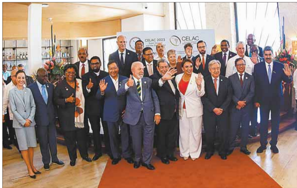
MANDATARIOS. La foto oficial de la cumbre de la Celac en San Vicente y las Granadinas, ayer.

Países gobernados por la derecha enviaron figuras de menor nivel, como Ecuador, representado por su embajadora en San Salvador.