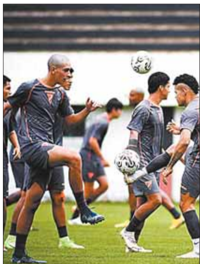
Los jugadores de Always Ready.

La Conmebol oficializó las fechas y horarios de la tercera fase de la Copa