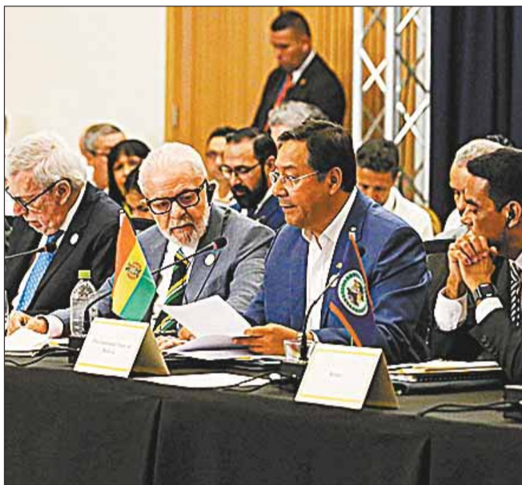
DISCURSO. La intervención del presidente Luis Arce en la Celac.

Calificó esto como "actos de provocación" para quebrantar la