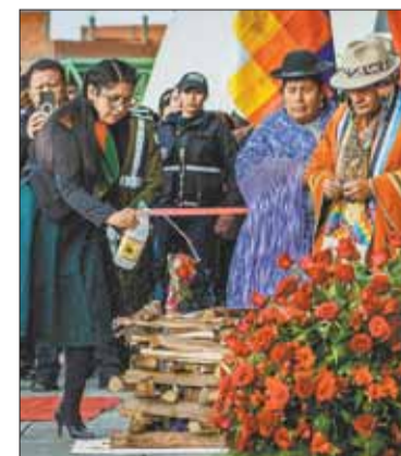
Las actividades por el aniversario.

Al día siguiente, el miércoles, habrá un desfile cívico militar. Y, por primera vez, se realizará la Feria Internacional del Libro que durará 10 días.