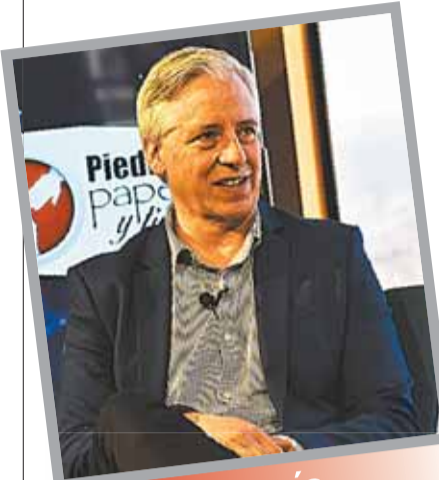
archivo la razón