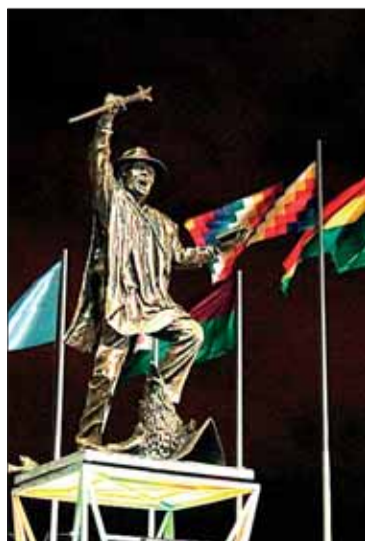
La obra homenajea a “El Mallku”.

El distribuidor El Mallku es uno de los primeros regalos por el aniversario