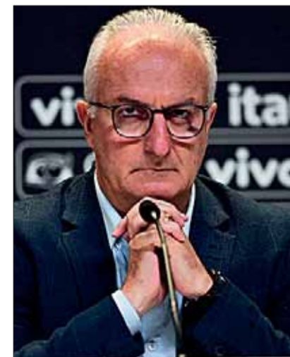
Dorival Júnior, DT de Brasil.

Delanteros: Endrick (Palmeiras), Gabriel Martinelli (Arsenal, ING), Raphinha (Barcelona, ESP), Richarlison (Tottenham, ING), Rodrygo (Real Madrid, ESP), Savinho (Girona, ESP) y Vinicius Jr (Real Madrid, ESP).