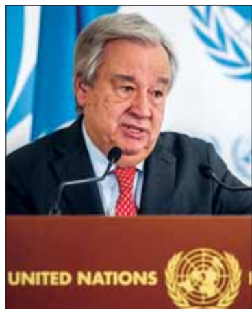
António Guterres, titular de la ONU.

Destaca la negociación en Colombia y el conflicto entre Venezuela y Guyana