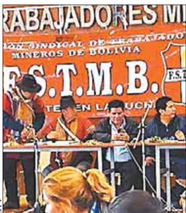
La conferencia de ayer.

NACIONAL. Pacto de Unidad hizo la convocatoria para mayo, en la ciudad alteña