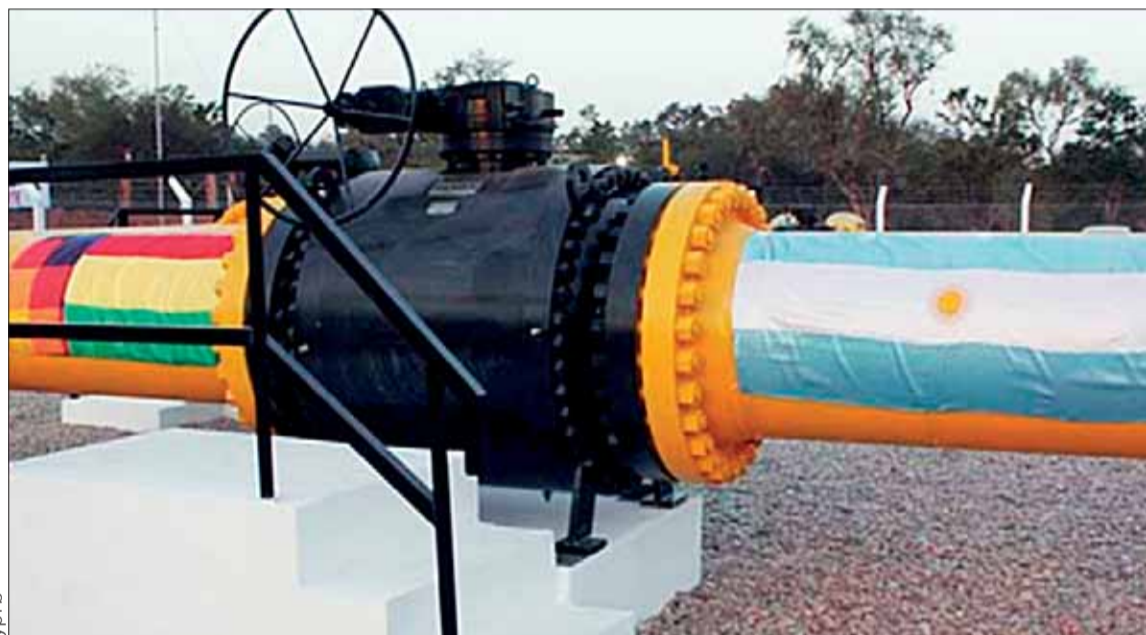
CONTRATO. El gasoducto que transporta el carburante desde territorio boliviano hacia Argentina.

El 22 de febrero, la dirigencia de la COB, en reunión con el presidente Luis Arce, presentó el pliego petitorio. El año pasado, el Gobierno y la COB acordaron un incremento salarial de 5% al salario mínimo y 3% al haber básico.