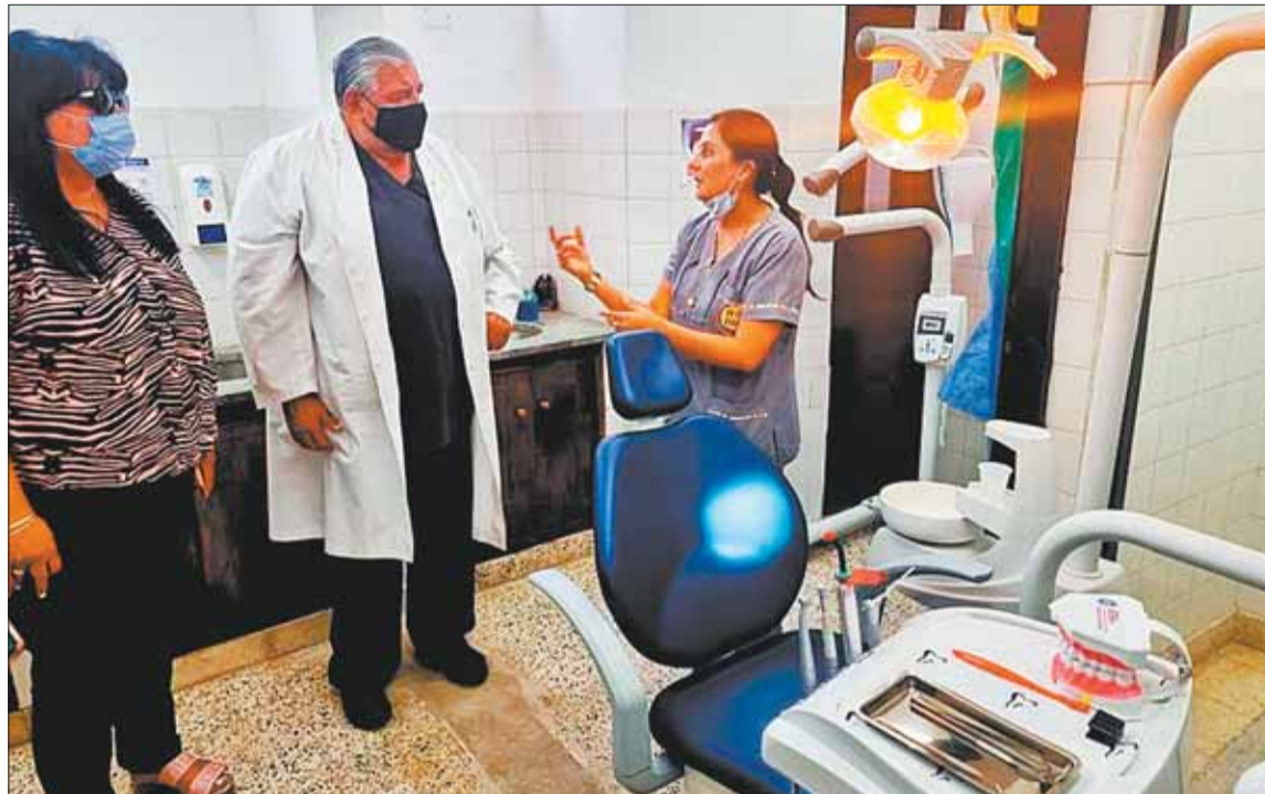
SALUD. La atención hospitalaria en el Policlínico Regional de Salta, en territorio argentino.

Por decreto, según la publicación, el gobierno provincial de Sal-