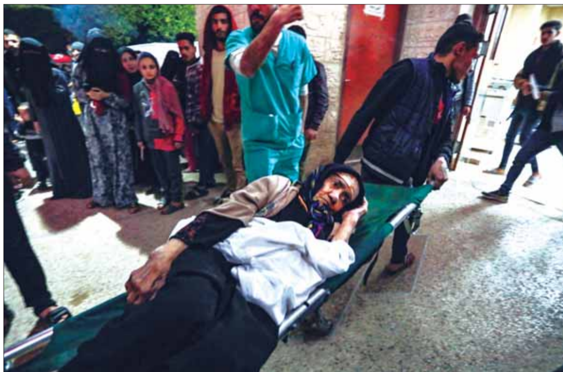
CAOS. Heridos ingresan a un centro hospitalario en Gaza, tras los bombardeos realizados ayer por Israel.

Mundo. Se espera un alto el fuego hasta antes del inicio del Ramadán