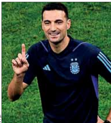
Lionel Scaloni, DT de Argentina.