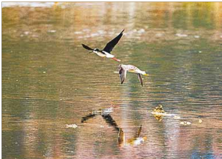
LIMPIEZA. En el lugar se realizó el dragado y ahora luce remozado.

Unas 500 aves, de 28 especies, retornaron al espejo de agua