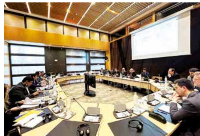
Reunión de autoridades bolivianas y francesas. MHE

Las compañías cuentan con la tecnología que puede