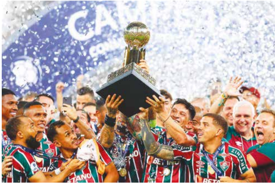
Jugadores de Fluminense festejan el título de la Recopa Sudamericana.

Pero en la primera mitad el tricolor abusó de los pases y le faltó profundidad y velocidad ante un equipo ecuatoriano