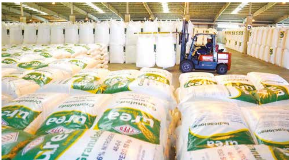
La producción de urea en la planta Marcelo Quiroga Santa Cruz.

La urea puede ser utilizada como fertilizante en cultivos de hortalizas, frutales, pasturas y ornamentales.