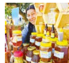
La oferta de la Feria Apícola. HERNAN ANDIA