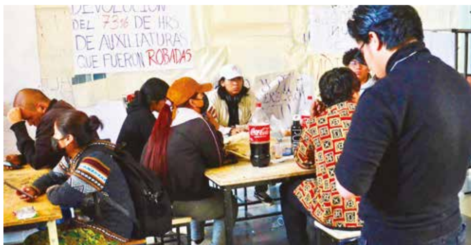
La vigilia de los censistas por el cobro en Arquitectura de la UMSS, el lunes.