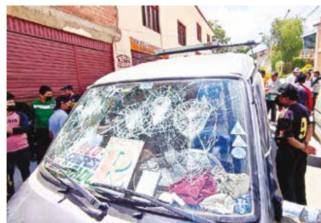
Lanzaron piedras y palos contra los trufis. DANIEL JAMES

Los conductores afectados piden la reparación de sus motorizados y denunciaron que incluso se llevaron su renta al sustraer sus monederos. Asegura que viven del día y ahora no podrán salir a trabajar. La cámara de seguridad de una casa filmó uno de los ataques y se ve a un grupo que se baja de un taxi y arremete sin más contra los minibuses que estaban en la parada.