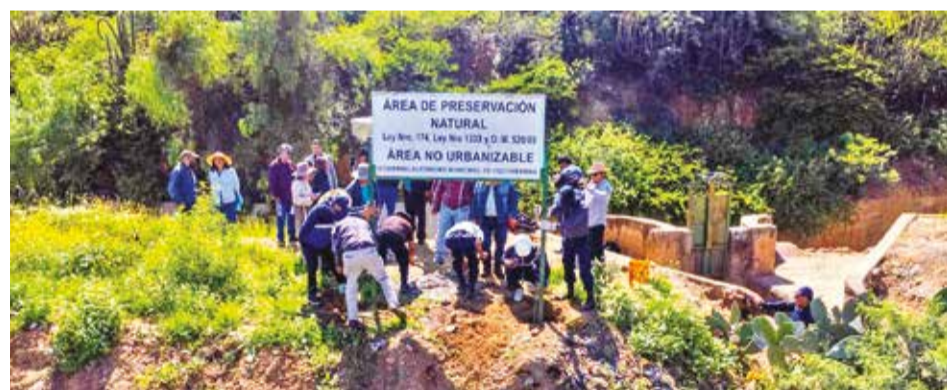
Los letreros para advertir que el sitio es un área protegida en San Pedro. GAMC

La Alcaldía tiene previsto considerar el pedido en el Comité de Transporte.