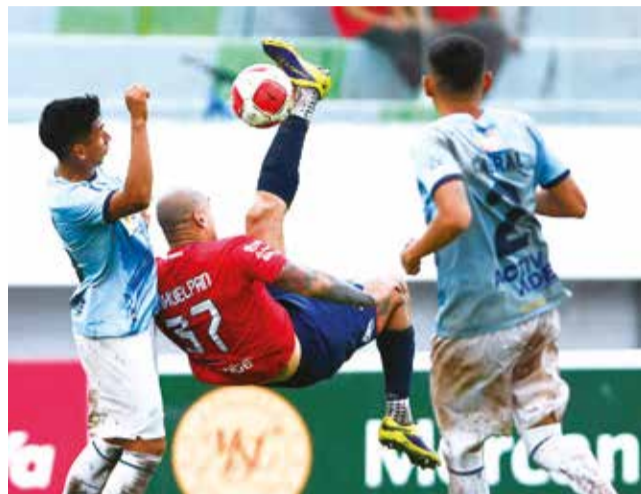
Clásico valluno entre Aurora y Wilstermann, el fin de semana pasado en el estadio Félix Capriles. DANIEL JAMES

San Antonio de Bulu Bulu no será parte del evento, pese a la buena predisposición del elenco tropical de jugar el campeonato,