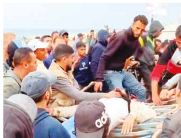
Una víctima del bombardeo israelí en Gaza.