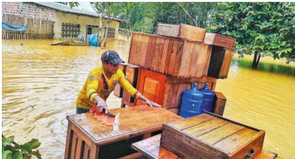
Afectados por la inundación en Cobija lidian con la crecida del río Acre.

Jóvenes, que son parte de la Asociación Protectora de Animales de Pando (APA), salen en canoas por los diferentes barrios afectados para rescatar a todos los animales afectados.