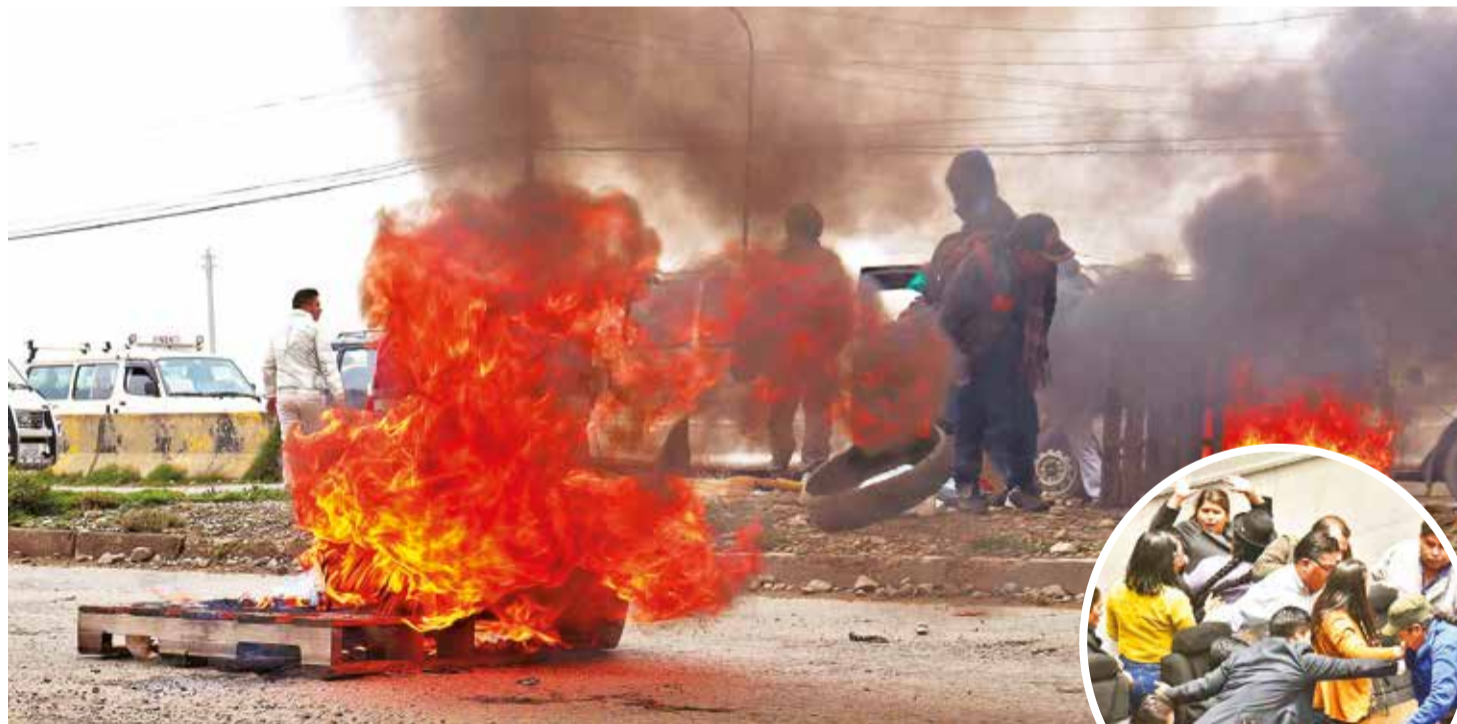
Bloqueos de vecinos de El Alto que presionan por créditos que deben ser aprobados en el Legislativo. En la foto pequeña, nueva trifulca de diputados que precedió a la reinstalación de la sesión.

Violencia. Los legisladores arcistas reinstalaron la sesión, mientras la oposición, que exige priorizar las normas de prórroga de magistrados, observó la falta de quorum. Pág. 3