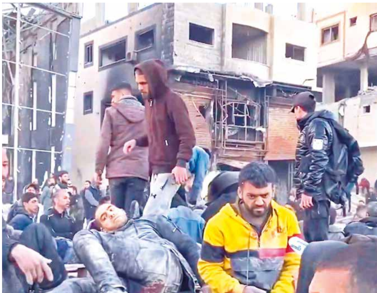
Gazatíes, víctimas del bombardeo israelí cuando esperaban alimentos, recogen a sus heridos. PIENSA PRENSA