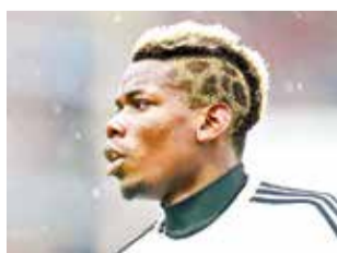
El jugador de Juventus, Paul Pogba.

El centrocampista francés del Juventus de Turín, Paul Pogba, fue sancionado con 4 años de suspensión por haber dado positivo en un test en testosterona el pasado 20 de agosto en el Udinese-Juventus; sin embargo, considera “errónea” la sanción y anunció que apelará la resolución al Tribunal Arbitral Deportivo (TAD).