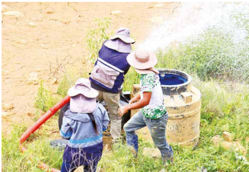
Emapas dota agua en cisternas y tanques a los afectados de Laquiña, Sacaba.

En tanto, en la zona de desastre, seis maquinarias avanzan con la limpieza del sedimento y piedras para evitar