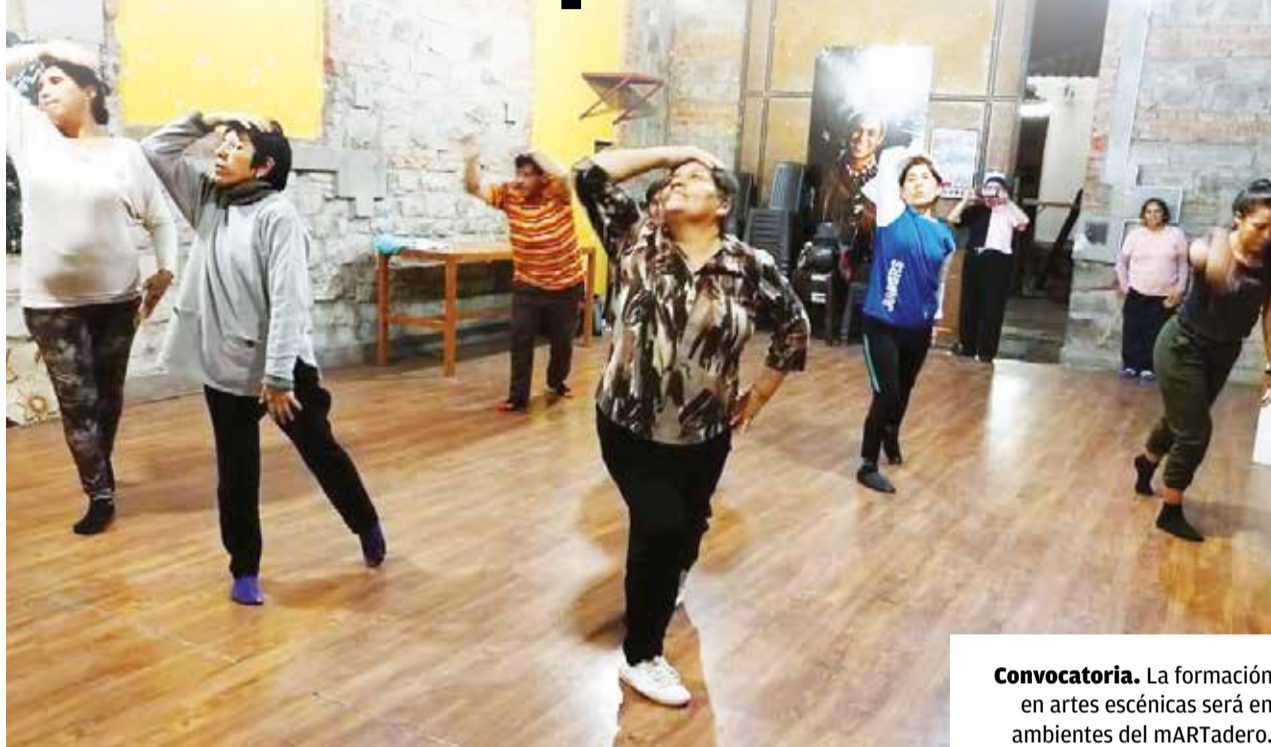
Convocatoria. La formación en artes escénicas será en ambientes del mARTadero.

Programa. A partir del lunes, el mARTadero tendrá un nuevo espacio para los adultos que deseen formarse en las artes escénicas.