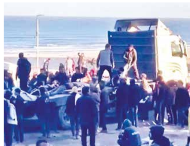
Gazatíes recogen alimento luego de varios días. PIENSA PRENSA