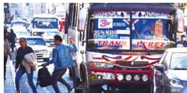
El servicio de transporte público en la ciudad. JOSE ROCHA

Proyecto. La Alcaldía convocó a una reunión al Comité de Transporte para abordar la solicitud de los choferes este viernes