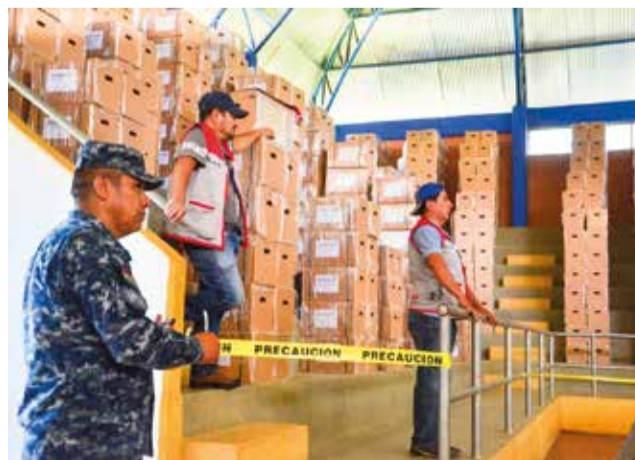
El material para el censo en Cochabamba.