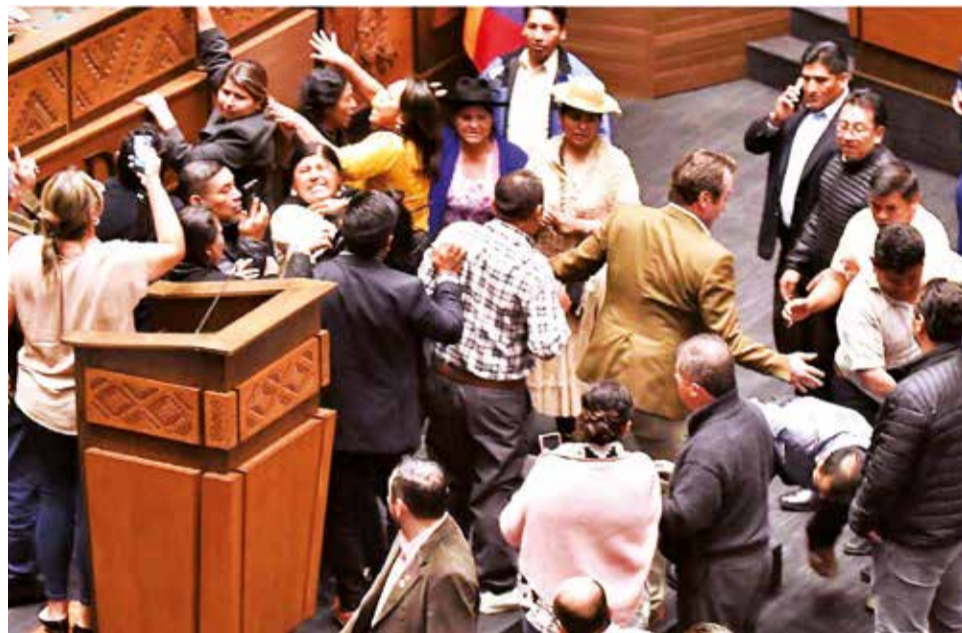
Enfrentamientos en testera de la Cámara de Diputados, ayer.

Algunos de los legisladores arremetieron contra el presidente de Diputados, Huaytari, que fue sindicado de ejercer la dictadura en esa instancia legislativa, además de tratarlos de como ladronzuelos y mentirosos, entre otros.