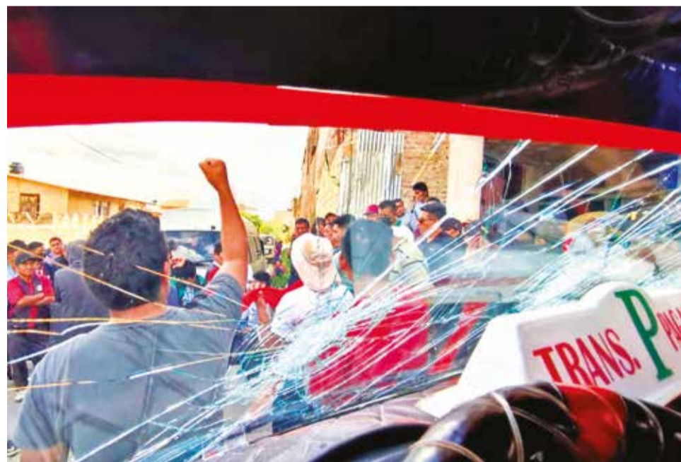
Los motorizados con los vidrios destrozados por la pelea.

Diez choferes fueron trasladados a la Felcc junto a los