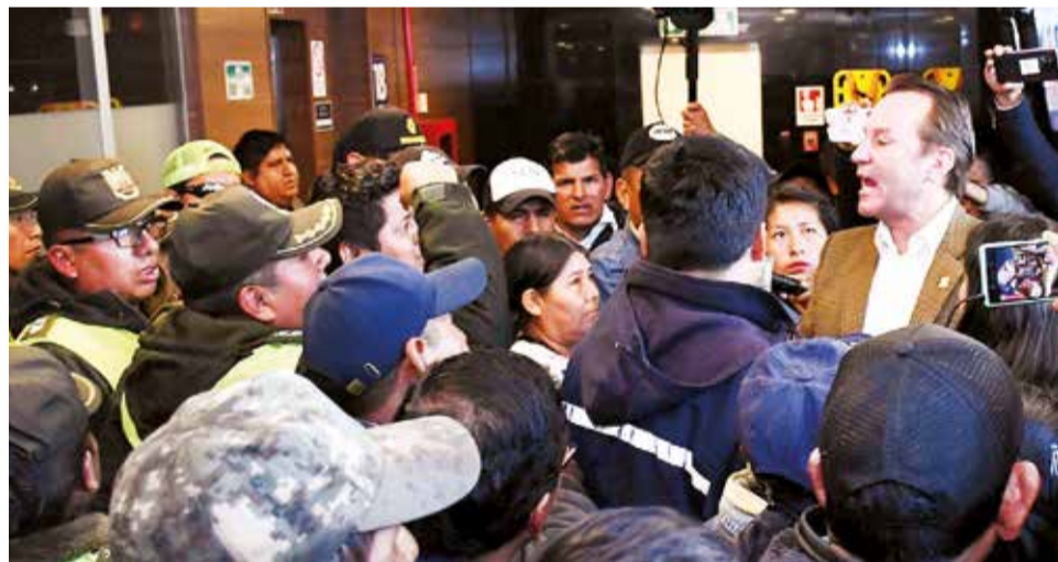
Diputados del oficialismo y la oposición pelean por el control de la sesión, ayer.