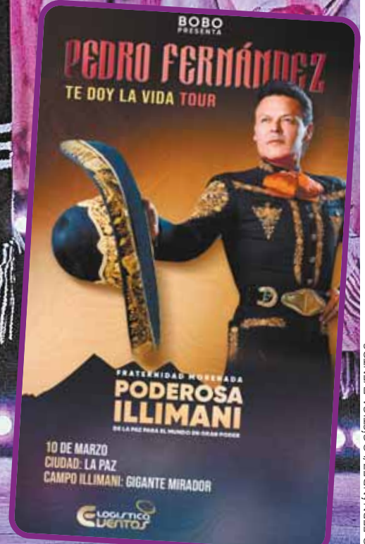
PEDRO FERNÁNDEZ/LOGÍSTICA EVENTOS