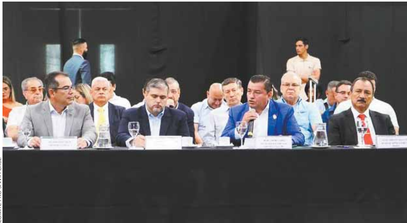
COMITÉ PRO SANTA CRUZ

Décimo: Designar una comisión para el seguimiento de los compromisos establecidos y evaluar sus resultados permanentemente.