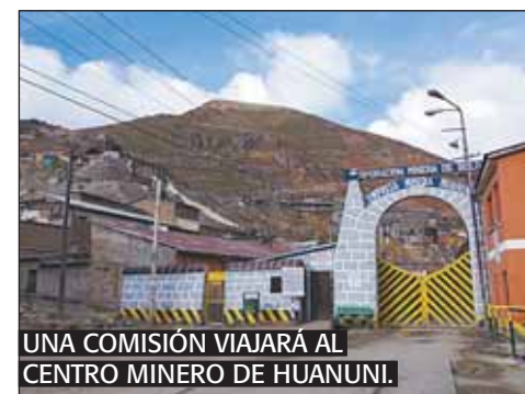
UNA COMISIÓN VIAJARÁ AL CENTRO MINERO DE HUANUNI.

En tanto avance el proceso, el Sindicato de Trabajadores Mineros de Huanuni, debe permitir el ingreso de personal de la Comibol a las oficinas de la Gerencia General y Administrativa, Gerencia Financiera y de la Gerencia de Planta.