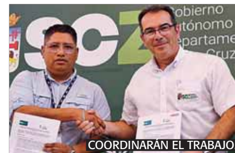
COORDINARÁN EL TRABAJO.

El gobernador convocó a la población a participar activamente como censista voluntario o abriendo su puerta.