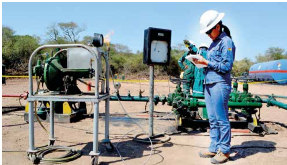
Una funcionaria de YPFB realiza la medición del gas natural que se extrae. YPFB

“Priorizamos las iniciativas para incrementar la renta