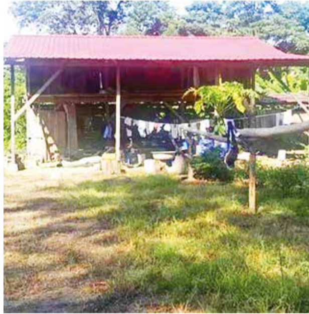
La casa donde fueron asesinados un hombre y su hijo.