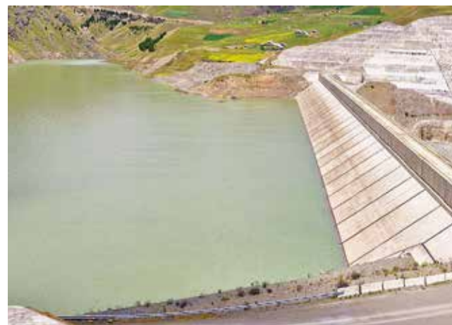
La represa de Misicuni con nivel alto de agua. MISICUNI

estadísticamente según los registros históricos de las precipitaciones pluviales, se aguarda que en este periodo lleguemos a embalsar más de 150 millones de m 3 , el 83 por ciento de almacenamiento.