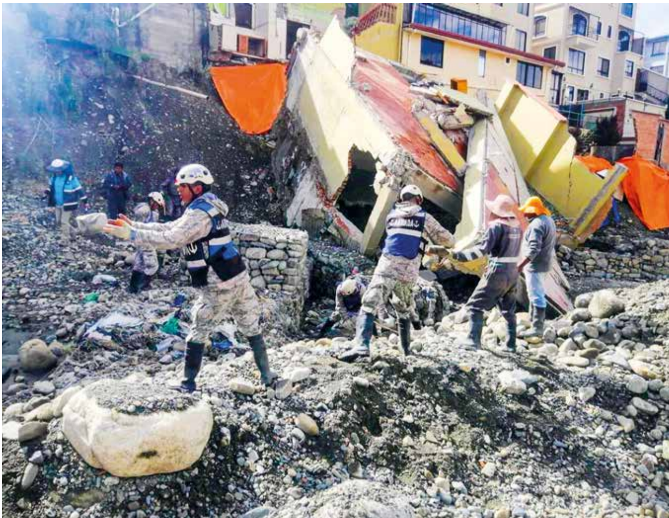
Militares trabajan en Colcha k para evitar deslizamientos, ayer.