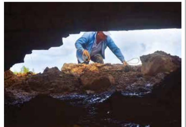
Una casa destrogada por el lodo en Laquiña.