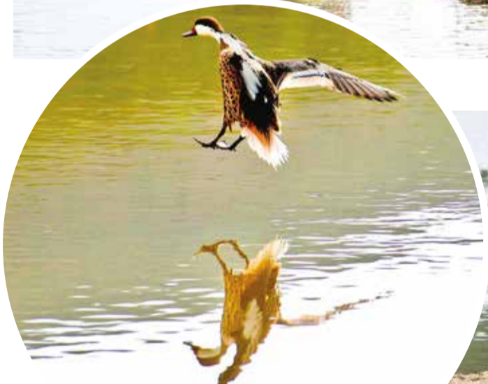
El pato pico rojo (Anas bahamensis) en Alalay.