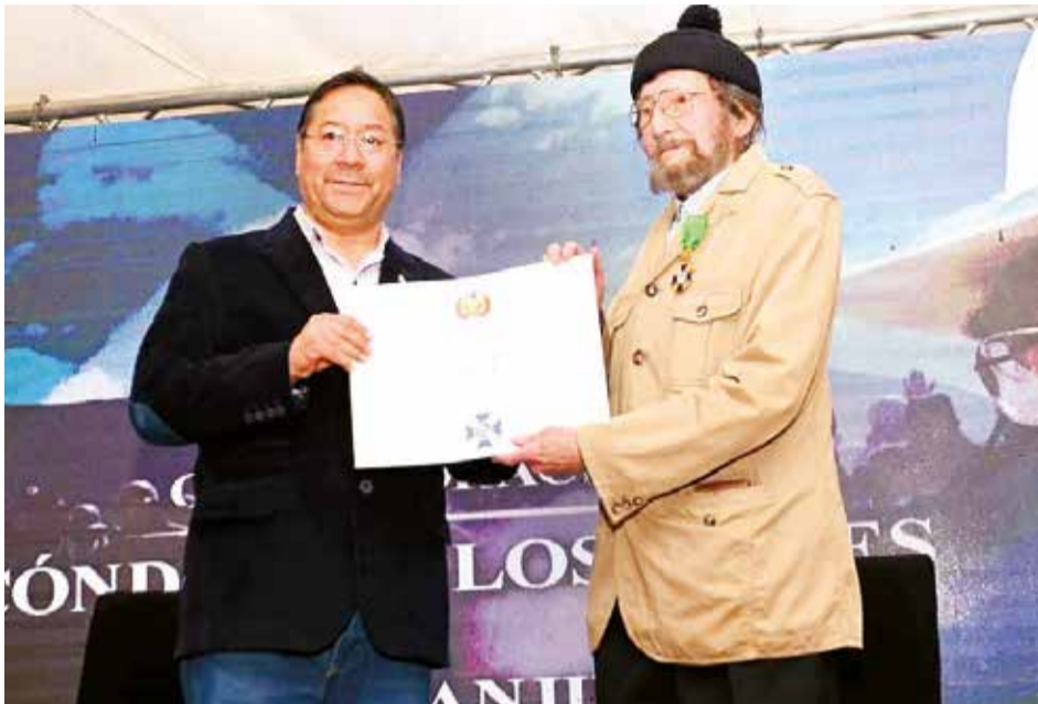
Acto. El presidente Luis Arce entrega la distinción al cineasta Jorge Sanjinés.