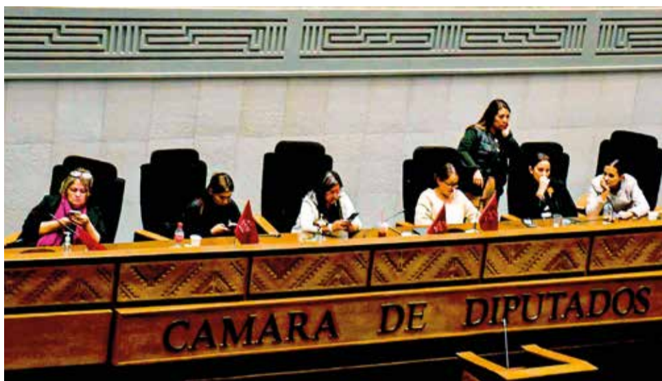
Asambleístas de la oposición ocupan la testera en Diputados para impedir la sesión.

El presidente de la Cámara de Diputados, Israel Huaytari, confirmó que solicitó al presidente de la Asamblea Legislativa Plurinacional (ALP), David Choquehuanca, que esa instancia trate y resuelva los proyectos de ley 073 (suspensión de plazos procesales) y 075 (cesar de sus funciones a los actuales magistrados del Órgano Judicial), bajo el argumento de que se cumplieron los plazos para su revisión en la Cámara de Diputados. Huaytari recaló que la iniciativa nació desde la presidencia del Senado.