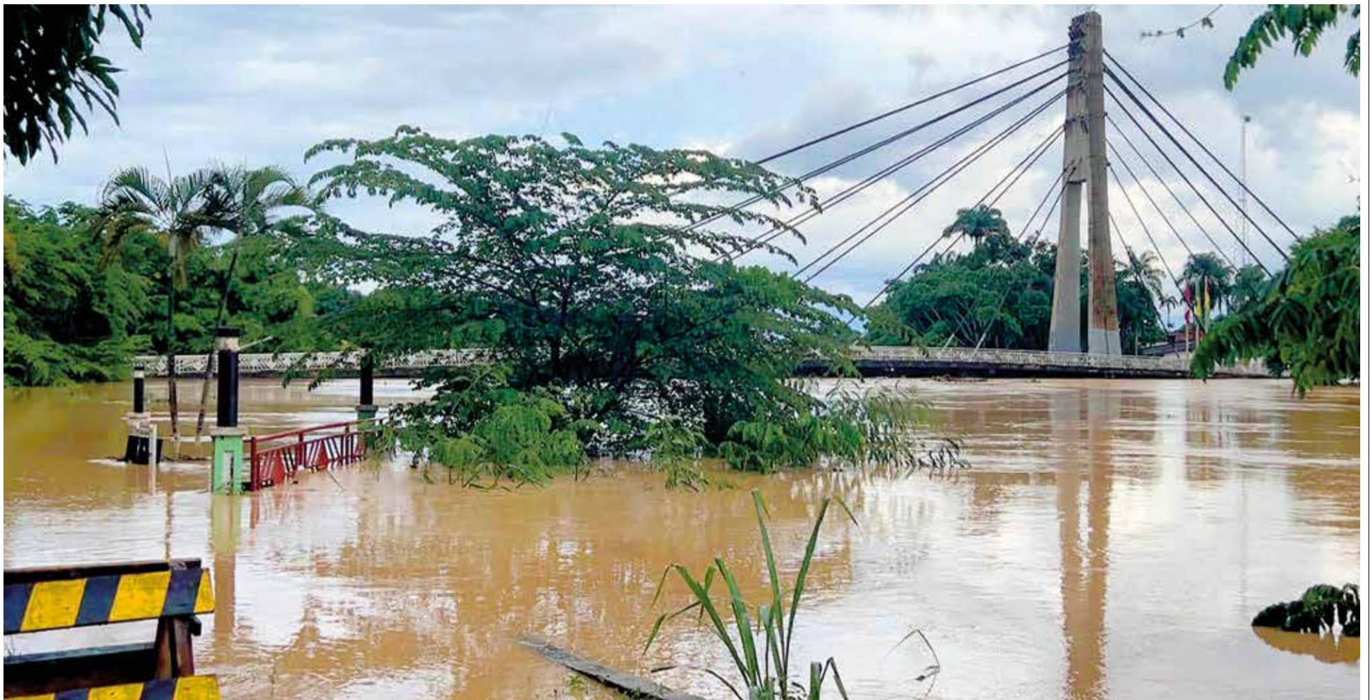
Vista panorámica del río Acre a la altura del puente de La Amistad, en el municipio de Cobija, en Pando, ayer. COBIJA CITY