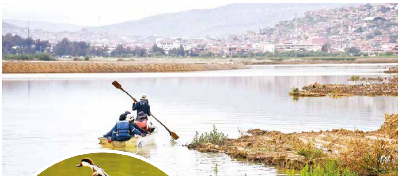
La laguna con el 50% de su nivel por las últimas lluvias.

Reproducción. Las aves acuáticas y silvestres anidan anualmente. Sin embargo, los últimos dos años hubo menos especies. Con el mejoramiento de la laguna, se busca la mayor cantidad posible