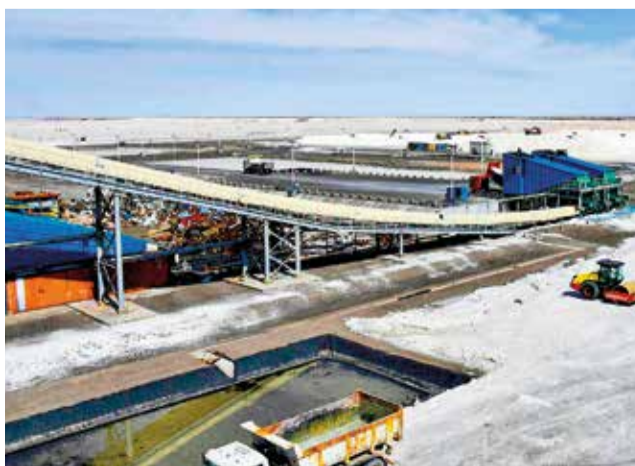
La planta de carbonato de litio en el salar de Uyuni.

“El pasado año tuvimos la visita importante de una comisión grande de países de