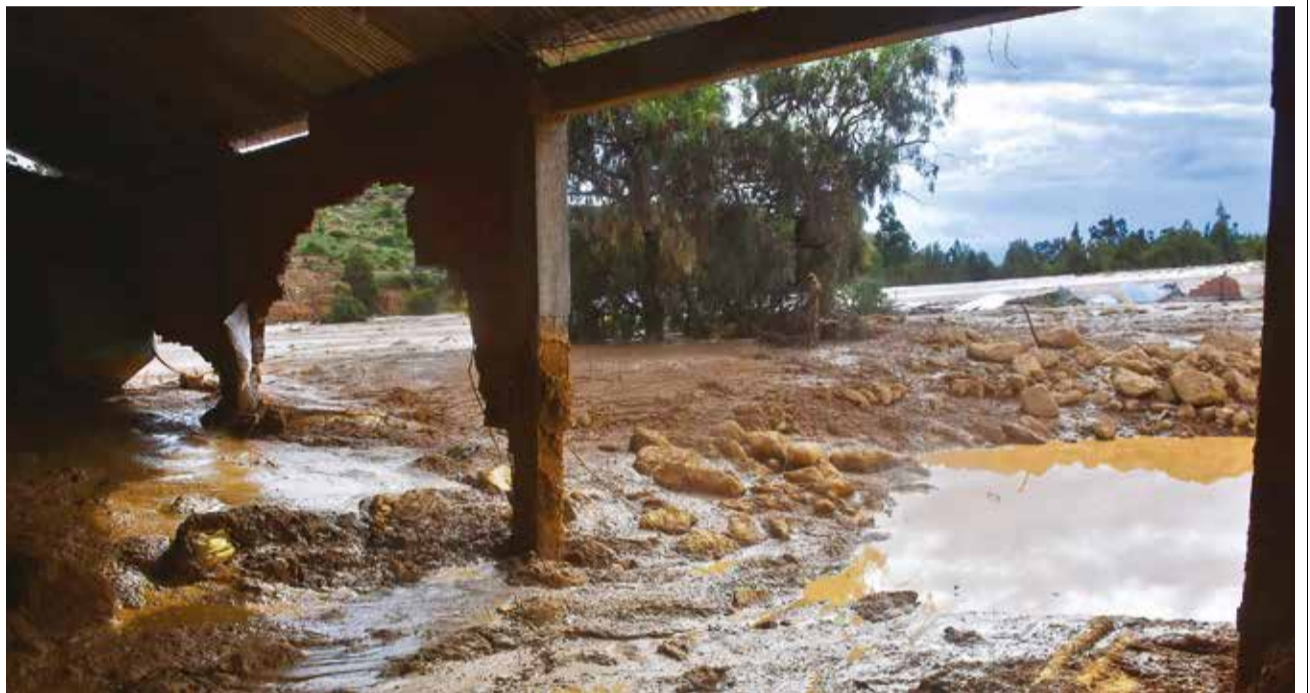
Los restos del galpón de la granja de aves que quedó sepultado en el lodo en Laquiña.

MULTIMEDIA: Escanee este QR para ver el video de la nota. www.lostiempos.com