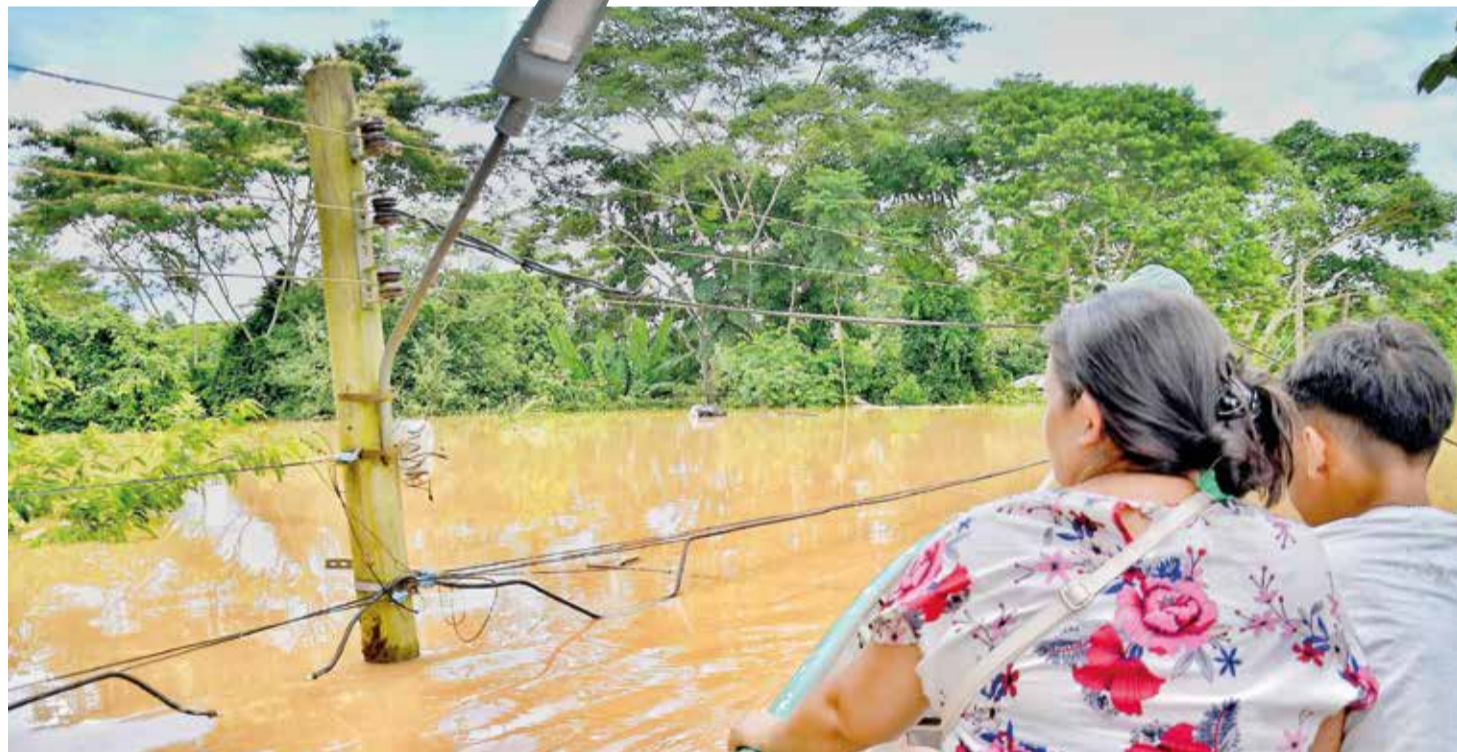
Una familia en un bote observa cómo el agua llegó a cubrir postes de alumbrado público en Cobija.

Medidas. Al menos 15 barrios quedaron bajo el agua por la crecida récord del río Acre. Guanay y La Palca buscan reponerse. En Laquiña, avanza la limpieza de lodos. Págs. 6-8