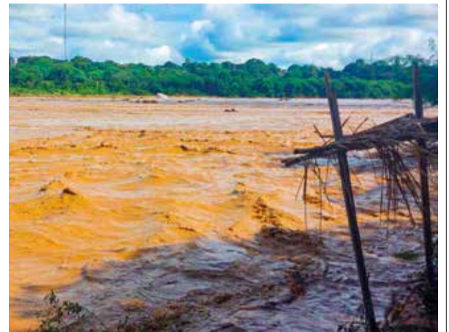
El río Pirai crece extraordinariamente.