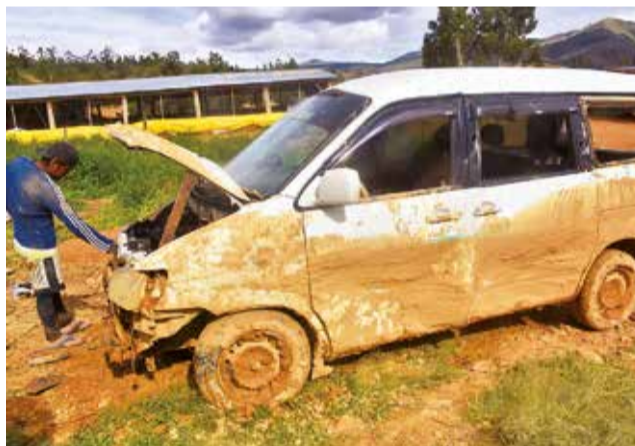
Un vehículo dañado por la mazamorra.