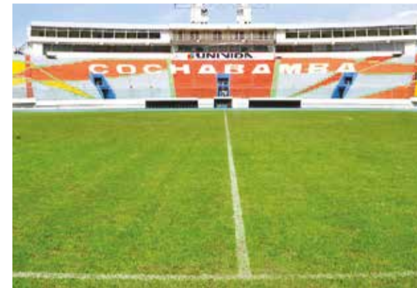
El estado del césped del Félix Capriles. HERNAN ANDIA