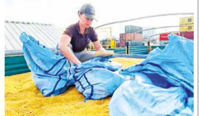
La droga incautada en Bélgica.

Los vecinos y dirigentes piden justicia y que la Policía identifique al o a los autores de este crimen.