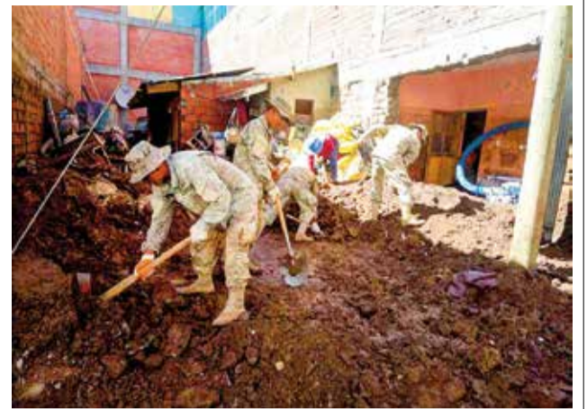
Soldados apoyan la limpieza de las calles y casas en Colcha k, ayer.