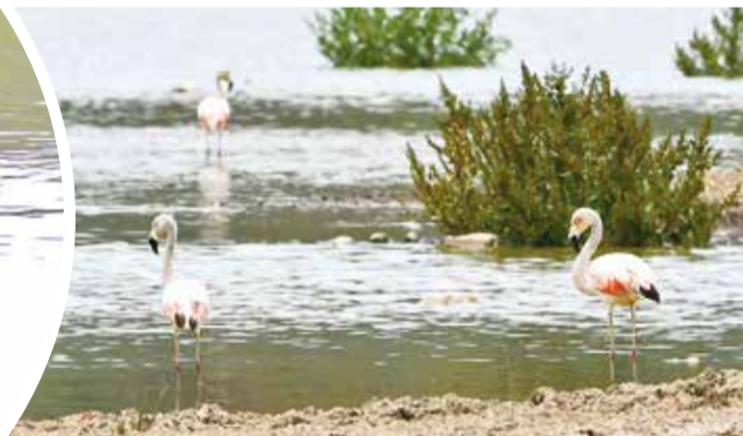
Flamencos (Phoenicopterus chilensis) en la laguna.