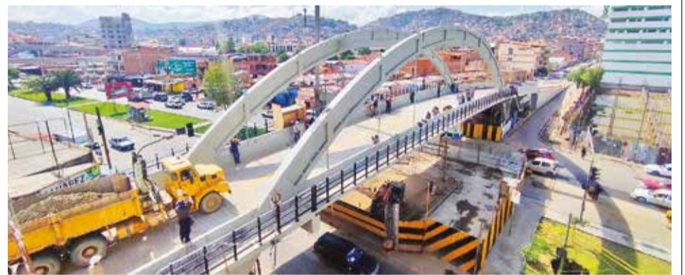
La prueba dinámica en el denominado puente caído, ayer. DANIEL JAMES

“El agua es totalmente limpia, ya hay humedad en el sector”, añadió Prudencio. Antes, la laguna se alimentaba del río Rocha, pero la contaminación y aguas servidas provocaron serios desafíos. Actualmente no ingresa agua de ese caudal.