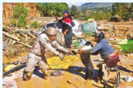
Rescate de un perro en Laquiña. JOSE ROCHA

Desastres. La zona de Laquiña en Cochabamba quedó bajo el lodo por el descuido de las lagunas; en Pando, evacúan casas, y en Colcha K, la gente seguía aislada. Págs. 6-9