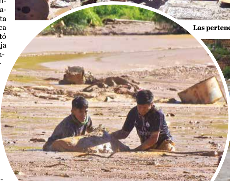
Afectados sacan sus cosas del barro.