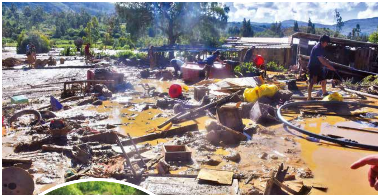
Las pertenencias regadas en medio del lodo en Laquiña.

“Son como 12 años que vivo en Laquiña y antes no ha-