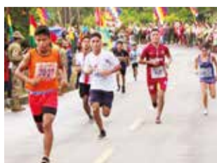
Carrera pedestre en el trópico de 2023. rkc

De acuerdo a la convocatoria, la carrera iniciará a las