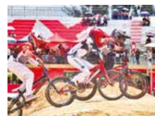
Nacional de BMX en el circuito de La Tamborada. J.R.

Con la presencia de 245 ciclistas, el lunes 4 y martes 5 de marzo, se disputarán la primera y segunda fecha del Campeonato Nacional de BMX, que se competirá en el circuito Sudamericano de bicicross de la zona de La Tamborada, al sur de la ciudad de Cochabamba. Según informó el pre-