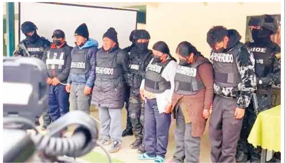
La Policía presenta a los aprehendidos, ayer en La Paz.