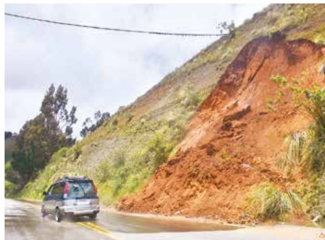
Un deslizamiento en el camino a Colomi.