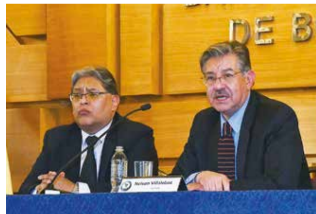
El presidente de BCB y el secretario de Asoban.

Rojas explicó que las personas jurídicas o naturales que adquieran los bonos no pagarán el Impuesto a las Transacciones Financieras (ITF), mientras que el pago de intereses y la devolución del capital serán