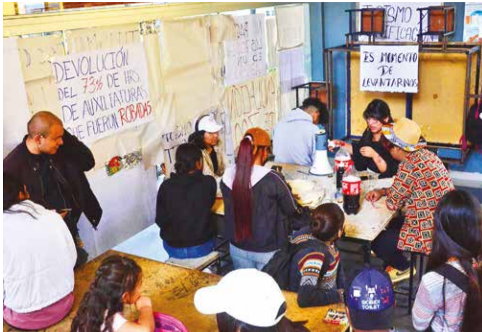
La vigilia de los censistas voluntarios que ingresan a Turismo y otras carreras. HERNAN ANDIA

Sin embargo, la fase de inscripción desató descontento en la Facultad de Arquitectura, donde se instaló una vigi-