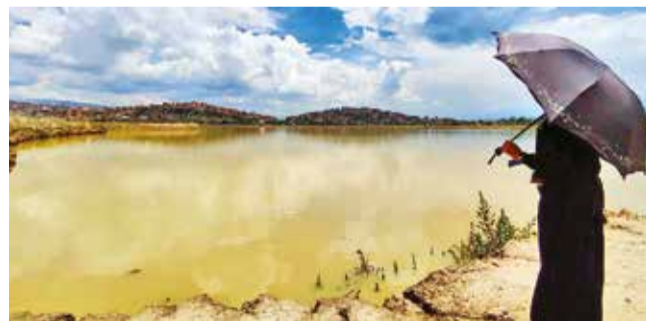
Semapa inspeccionó ayer la laguna Alalay. DANIEL JAMES

Avance. El dragado alcanzó un 95 por ciento de avance y quedan trabajos pendientes. En tanto, más de 500 aves de 25 especies vuelven