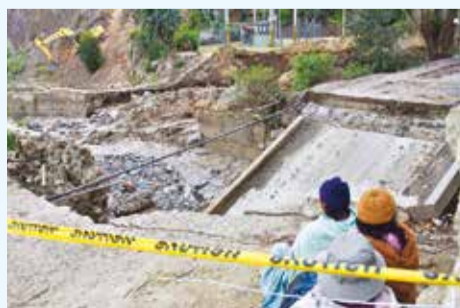
Desastre en Palca (La Paz). APG