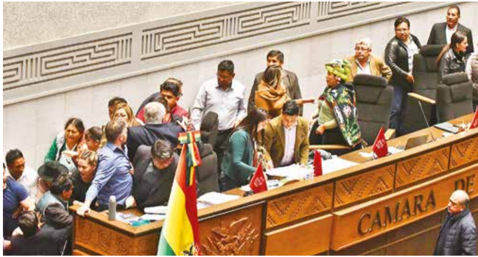
Peleas entre asambleístas en la Cámara de Diputados, el pasado jueves 22 de febrero.

El presidente Luis Arce afirmó ayer que los “malos asambleístas” del Legislativo se niegan a aprobar los proyectos de ley de créditos que se encuentran pendientes y que, en su lugar, sólo les preocupan “leyes políticas”, en alusión a las normas contra la prórroga de magistrados. “Son malos (los asambleístas que) han recibido el voto popular y hoy no quieren aprobar créditos que benefician al pueblo boliviano. Esos asambleístas quieren que se aprueben primero sus leyes que les preocupan, leyes políticas que les preocupan a ellos”, afirmó.