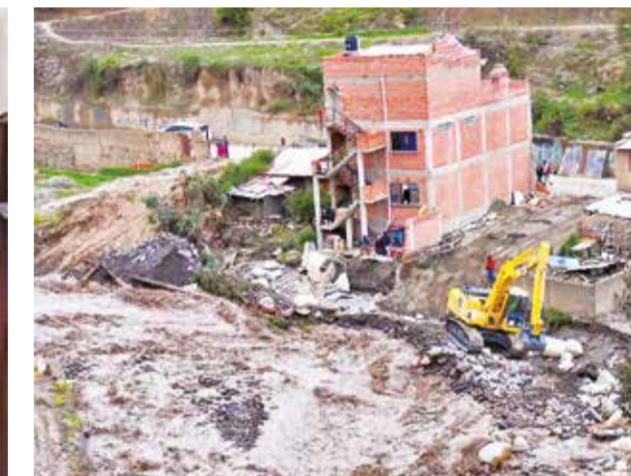
Las inundaciones afectan a varias zonas de La Paz.