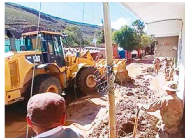
Colcha K está llena de lodo y escombros. RADIO SALAR

La Alcaldía y el Concejo Municipal de Colcha K declararon a la población de Colcha K y las comunidades aledañas de San Juan del Rosario, Mañica y Malil en estado de