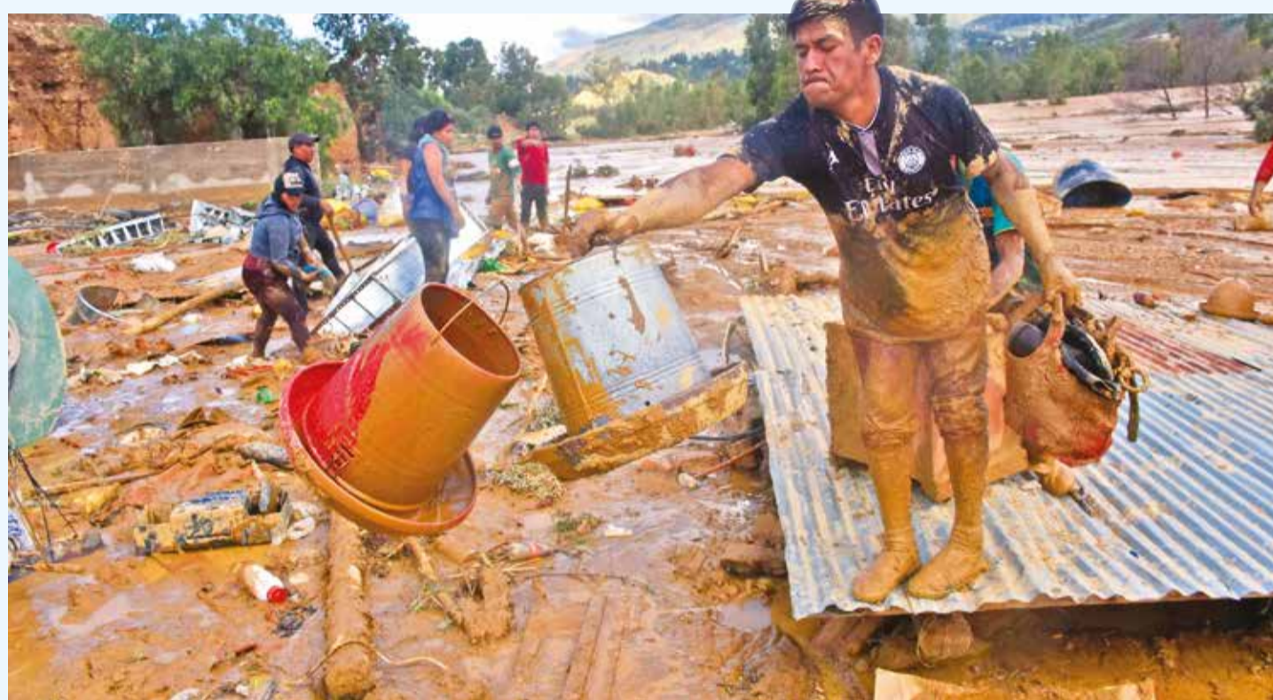
Vecinos de Laquiña buscan rescatar sus pertenencias del lodo, ayer, tras el turbión del domingo.