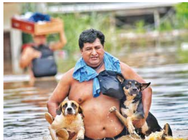
Un poblador de Cobija rescata a sus mascotas de la inundación, ayer.