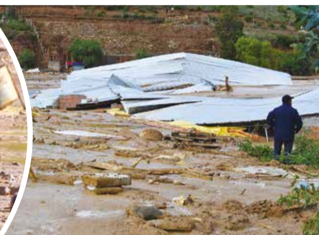
El galpón donde murieron 6 mil pollos por la riada.