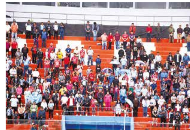
Público durante el clásico cochabambino. DANIEL JAMES