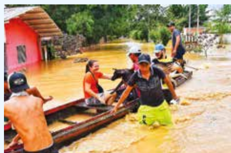
Evacuaciones en Cobija, ayer.