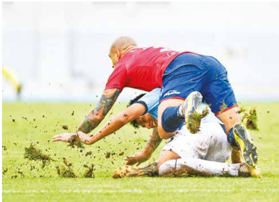
Daño en el gramado del estadio Félix Capriles tras el clásico valluno. DANIEL JAMES

“Lastimosamente, existe una gran presión de gente que en lugar de considerar el gran problema que tenemos que solucionar se de-