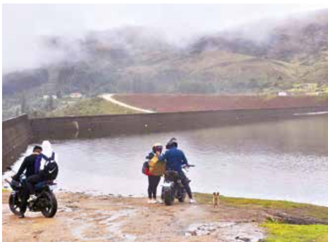
El caudal aumenta en la laguna de Corani.

Declaratoria. Los trabajos son intensos en la zona afectada por la riada. Mientras, la Alcaldía de Sacaba prevé declarar emergencia tras la cuantificación de daños y verificar el lugar donde se originó el desastre