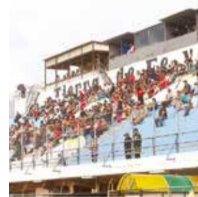
Vista del estadio de Quillacollo. DANIEL JAMES

Por esta razón, la "U" de Vinto comenzó a gestionar con sus pares del Matador y la Federación Boliviana de Fútbol (FBF) para jugar en el es-