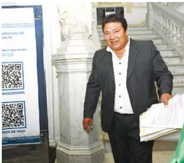
Un postulante a magistrado presenta sus documentos.

Esta labor incluye ocho etapas y el Legislativo se trazó la meta de remitir al Tribunal Supremo Electoral (TSE) la nómina de los pos-