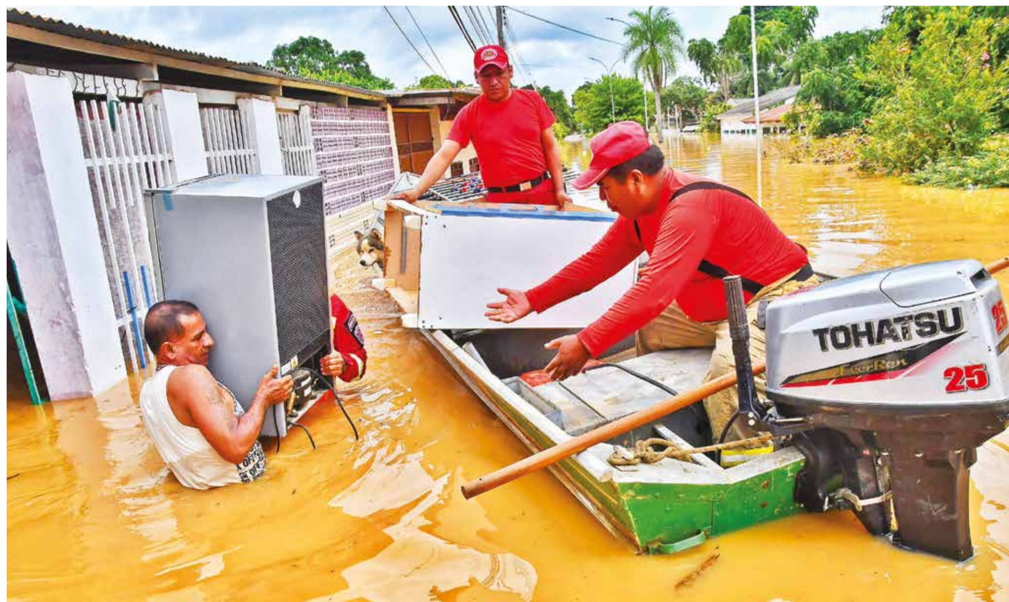
Pobladores de Cobija trasladan sus pertenencias en las calles inundadas de la ciudad por la crecida del río Acre.

Inundaciones. Hay nueve departamentos afectados por las lluvias en Bolivia; en Pando, las familias deben evacuar sus casas; en el municipio potosino de Colcha K, siguen aislados, y en La Paz se pierden puentes