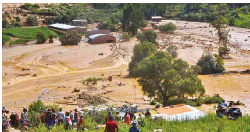
La población de Laquiña, en Chiñata (Sacaba), bajo el lodo.

Todo lo rescatado se trasladó a un sitio seguro, donde los propietarios se aproximaban para identificar algunos de sus enseres y exponerlos al sol, según pudo verificar Los Tiempos.