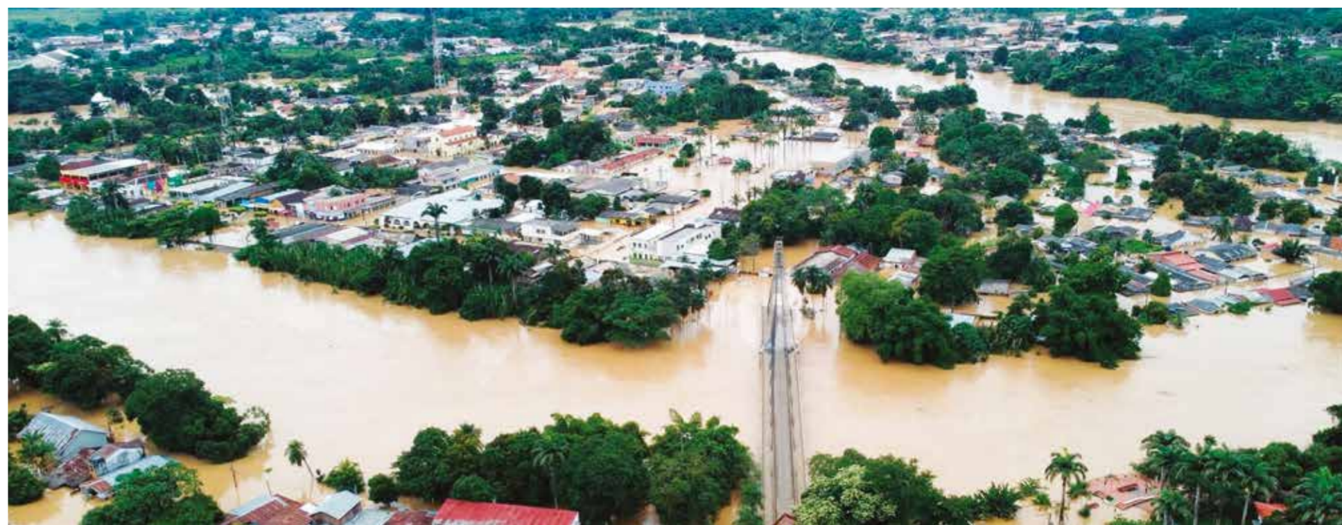
Rebalse del río Acre en Cobija deja las calles totalmente inundadas, ayer.

"Estamos llegando prácticamente a los 15 metros (del nivel del río) y es la inundación más grande desde 2012, pero esta vez no nos tomó por sorpresa, la gente estaba preparada. En el momento que el río estaba cre-