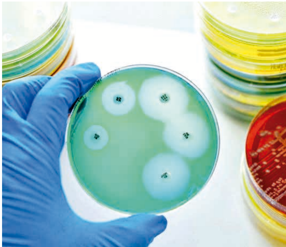
Muestra. En el laboratorio sostienen una placa para observar la proliferación de bacterias.

Durante el período estudiado, que abarca desde 2014 hasta 2021, se observó una notable reducción del 44 por