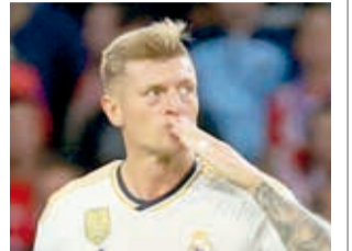
El futbolista germano Toni Kroos.

“Chicos, breve y dulce: volveré a jugar para Alemania en marzo. ¿Por qué? Porque me lo pidió el entrenador federal, me apeetece y estoy seguro de que en la Eurocopa se puede hacer mucho más de lo que la mayoría cree en este