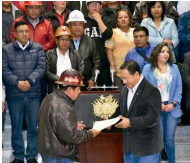
El presidente Arce recibe el pliego de la COB.

Propone también la aprobación del proyecto de ley que modifica los Límites Soli-