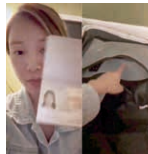
La extranjera muestra la maleta rota.