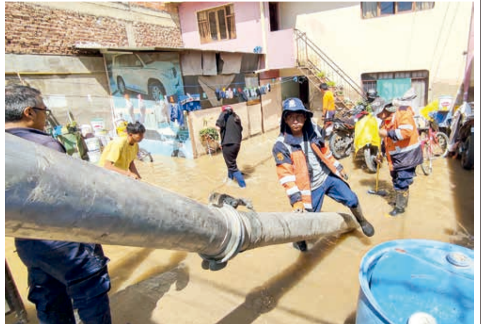
La UGR y vecinos de La Tamborada desfogan el agua turbia de una casa.

Otro de los sectores inundados fue la avenida Rubén Darío. El canal de riego de La Angostura, que bordea el cerro San Pedro, se desbordó cerca de la subida del Cristo y afectó a la ciclovías, a casas y calles cubriéndolas de lodo.