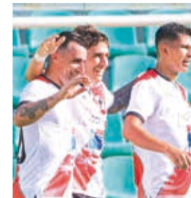
Festejo de los jugadores de Nacional Potosí.