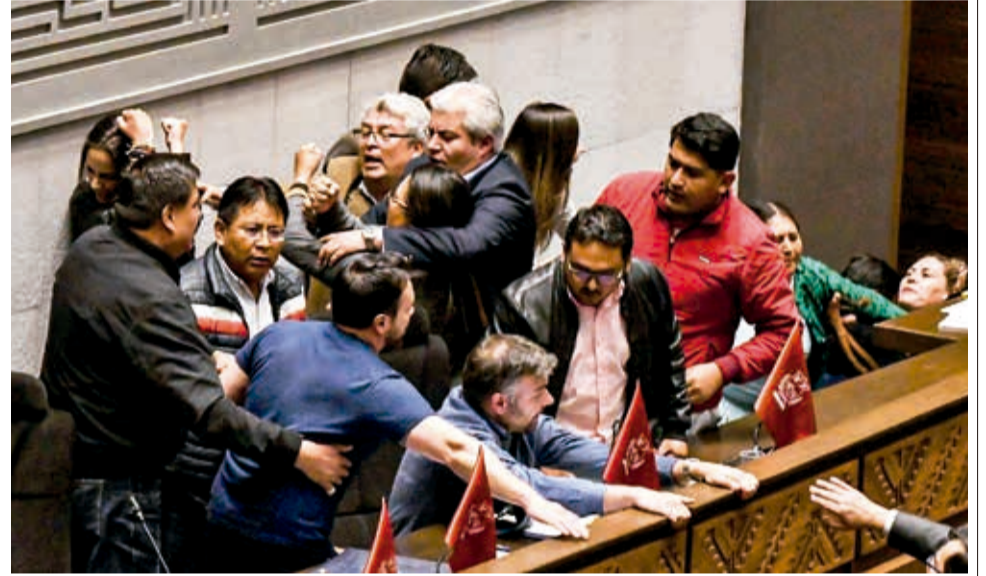
Diputados pelean en la Cámara Baja al no lograr acuerdo sobre el orden del día.

comprometió a cumplir el acuerdo, así tarde hasta el sábado. Anunció que formalizará la denuncia contra Ormachea porque se sintió agredida por él.