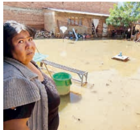
Una vecina muestra su casa inundada con agua contaminada en La Tamborada.