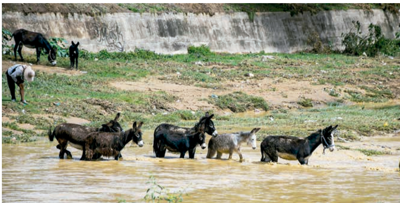
PEQUEÑA RECUA EN EL ROCHA. Una recua de burritos hace su paso por el cauce del río Rocha para beber el agua. Todos los días, pequeños grupos como éste llegan a las riberas para revitalizarse.

ENVÍE SU FOTO PARA PUBLICARLA EN ESTA SECCIÓN A: fotografia@lostiempos-bolivia.com