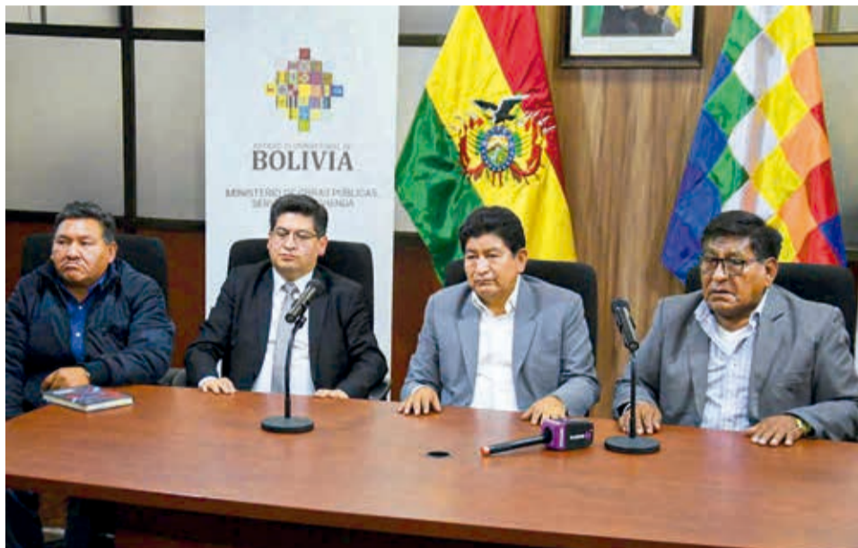
Autoridades de Gobierno y dirigentes de los choferes. APG

En Oruro, hubo enfrentamientos entre choferes y universitarios que salieron