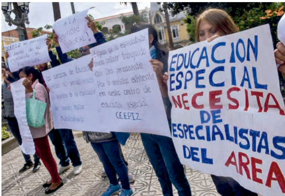
Maestros de educación especial protestan por exigencia de título de la normal. JOSÉ ROCHA

Salazar comentó que los afectados trabajan con niños y jóvenes con discapacidad y adultos mayores. “Hemos ingresado en tercera o cuarta convocatoria, cuando ningún maestro normalista quería hacerse cargo de ese subsistema”, agregó.