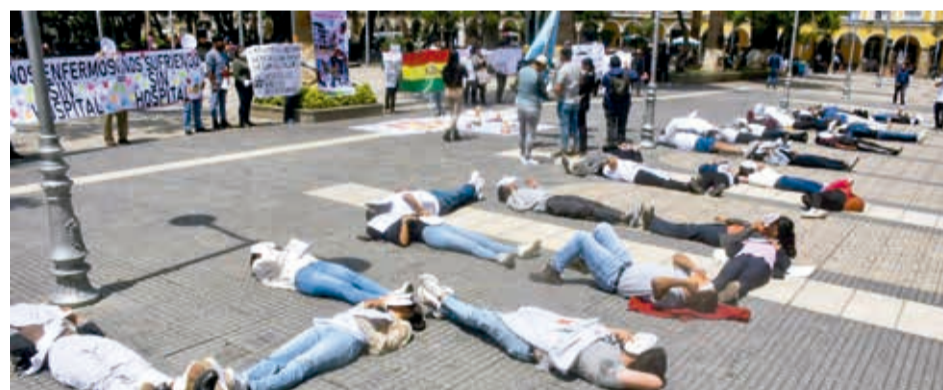
Una “alfombra humana” pide terminar el hospital del niño.

Entre tanto, los padres anunciaron que aportarán voluntariamente 50 bolivianos para habilitar una infraestructura para que los estudiantes puedan pasar clases en óptimas condiciones. Algunos bachilleres indicaron que se inscriben porque en próximos años se regularizará su funcionamiento, además por la cercanía, factores económicos y debido a que no es necesario rendir un examen de ingreso.