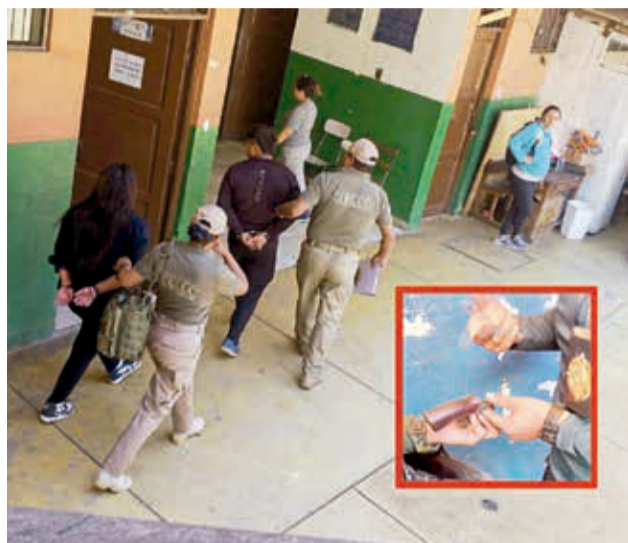
Los padres arrestados y el arma que llevó el niño a la escuela, ayer.

Un padre de familia quitó el arma al menor y se pudo constatar que la pistola