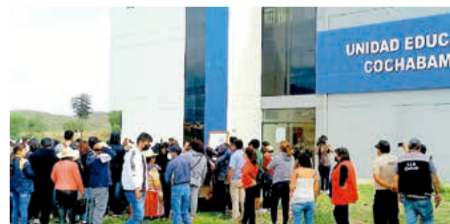
Estudiantes de la Unaaz en una escuela fiscal.

Inscritos. Mil bachilleres ya se registraron para estudiar en cuatro carreras del área de salud, pese a la denuncia en la Fiscalía