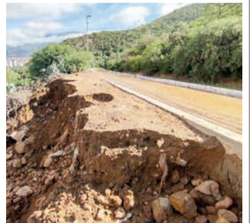
Parte del muro de la ciclovía cedió por el desborde del canal de riego.