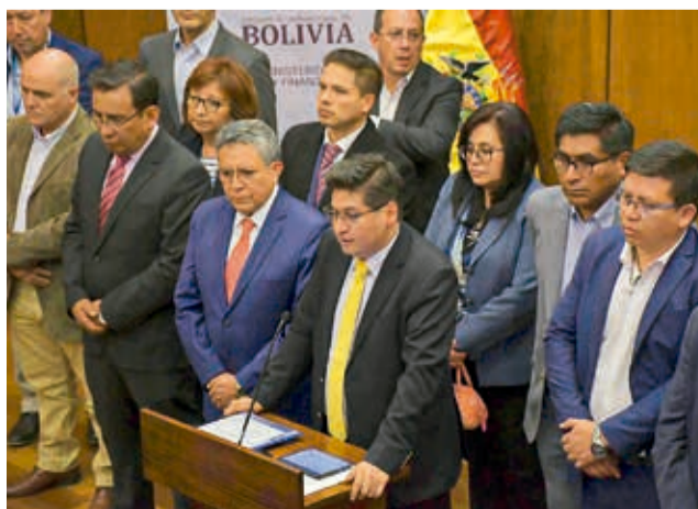
Empresarios junto a representantes del Gobierno.

“De repente, todo esto (las demoras en la liberación de exportaciones) es porque todavía falta que los ministerios