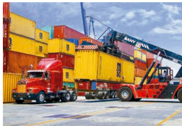
Camiones transportan carga a puertos del Pacífico. T21.COM,MX

Algo similar, acotó Quispe, ocurre con las cisternas que recogen combustible del puerto de Arica. Hasta hace unas semanas, 80 a 100 cisternas cargan diésel para trasladar el combustible a La Paz; ahora se redujo a 25 y 30. “El resto de las cisternas está en el puerto de Arica esperando diésel para transportar”, dijo.