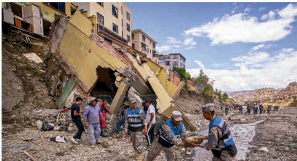
Las viviendas afectadas por las inundaciones en la zona de Irpavi, de La Paz.