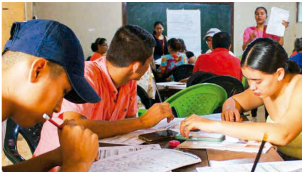
Funcionarios del INE imparten cursos de capacitación a los censistas voluntarios.