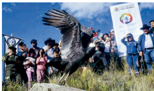
Wiñaypaq, liberada en Vacas. JOSÉ ROCHA

Desde 2016, una docena de estas aves, símbolo de la región andina, fue rescatada en Cochabamba; cinco cuentan con un rastreador GPS para su preservación.