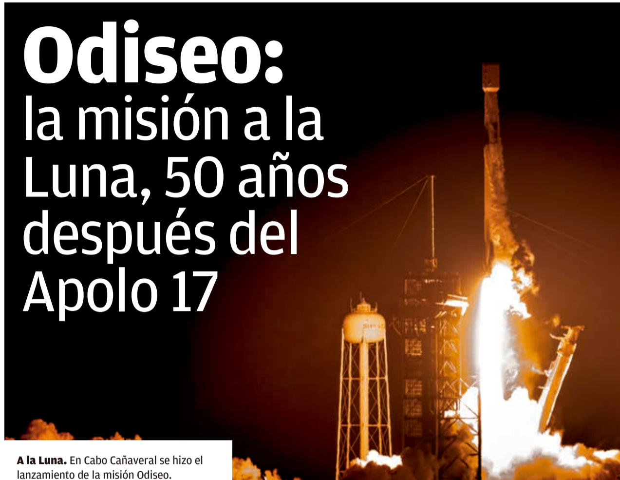
A la Luna. En Cabo Cañaveral se hizo el lanzamiento de la misión Odiseo.

Programa. La misión partió la semana pasada a la Luna y pretende aterrizar cerca del polo sur de la Luna, área que permanece sin explorar.