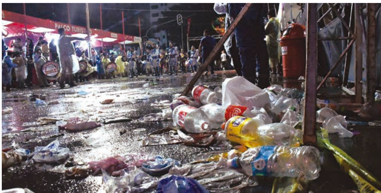
DEL CORSO A LA MUGRE. Después del espectáculo, la ruta de la entrada carnalera parecía un basural con alfombras de plásticos que flotaban en las calles convertidas en ríos por la lluvia. El público disfrutó, ensució y se fue.

ENVÍE SU FOTO PARA PUBLICARLA EN ESTA SECCIÓN A: fotografia@lostiempos-bolivia.com