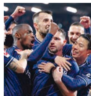
Festejo de jugadores de Bochum, ayer.

Tres derrotas consecutivas, algo impensable en un club de tal dimensión, delatan el mal momento del Bayern Múnich, superado por un equipo menor como el Bochum (3-2) y con la supervivencia en la Liga de Campeones en entredicho, en una jornada negra