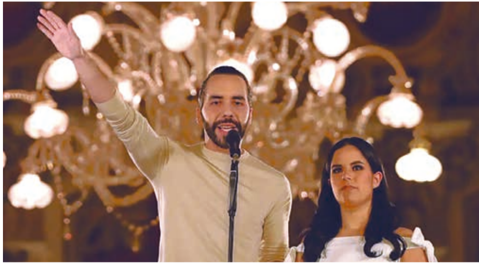
Nayib Bukele habla desde el Palacio Nacional junto a su esposa Gabriela.

El partido de centro humanista Nuestro Tiempo, que participó por primera vez en los comicios presidenciales, obtuvo 65.076 (2,04%) y las formaciones Fuerza Solidaria y Fraternidad Patriota Salvadore-