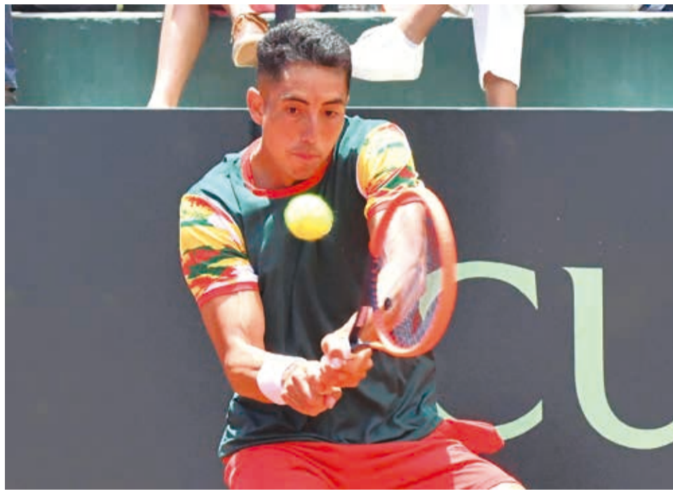
El tenista beniano Murkel Dellien.

la sexta corona en el palmarés para Murkel, en la modalidad de singles. En dobles, Dellien suma 10 títulos en global, entre torneos Challenger ATP e ITF Futures.