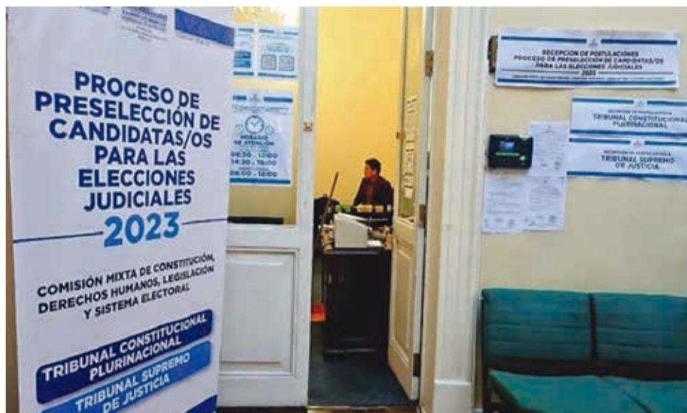
Las oficinas donde se registrarán las postulaciones. SENADO

La convocatoria exige el cumplimiento de seis requi-