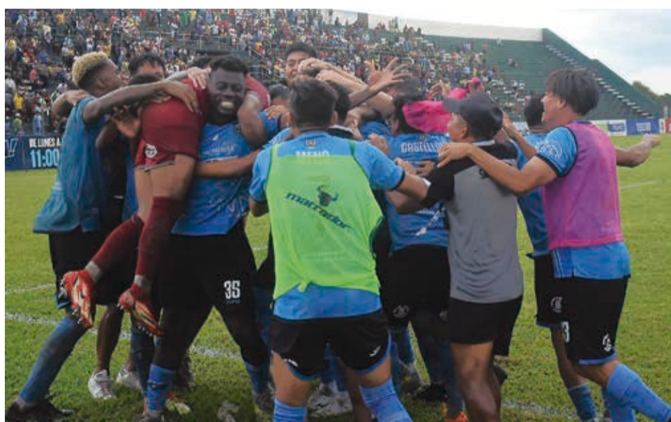
Celebración de San Antonio de Bulu Bulu, tras ganar el ascenso indirecto en Beni.

Acerca de los requisitos, todos los clubes participantes deberán contar con documentos que