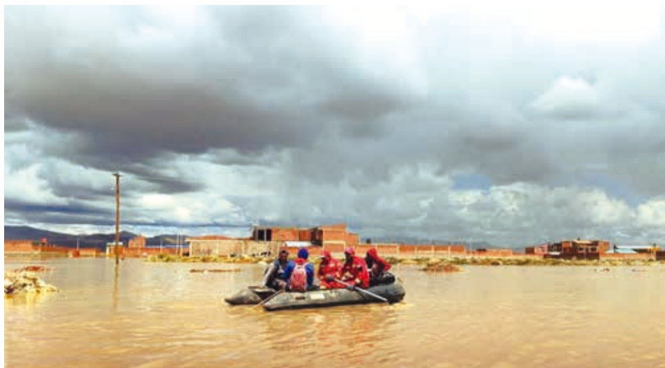
Bomberos y vecinos navegan en un bote por las calles inundadas, ayer.

El Senamhi emitió alerta meteorológica de prioridad naranja por posible desborde de ríos en siete departamentos.