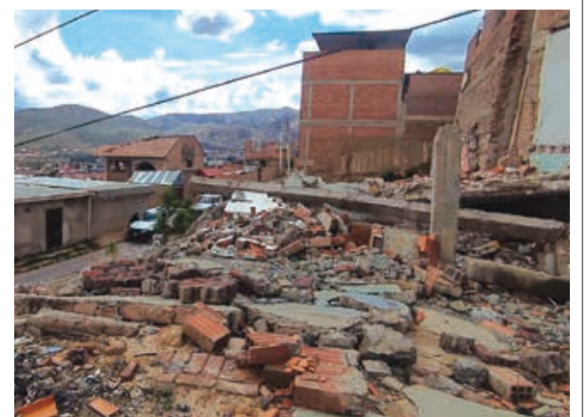
Casas en riesgo de caer en Alto Cochabamba. DANIEL JAMES