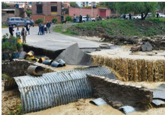
El paso vehicular inhabilitado, ayer en la av. Villazón.