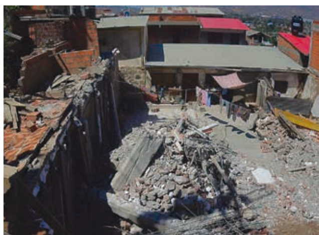
Las casas demolidas en el barrio 14 de Abril, Ticti Sur. C.L.