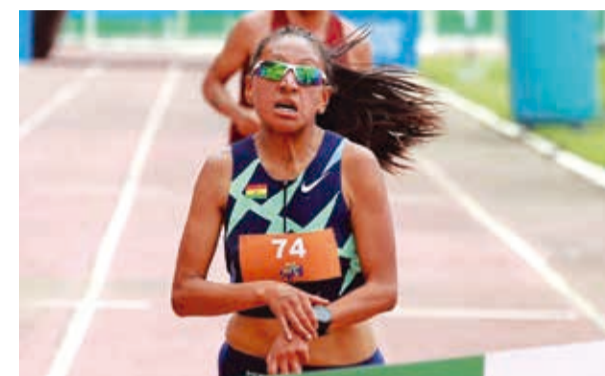
La fondista Jhoselyn Camargo (archivo). EL DEBER