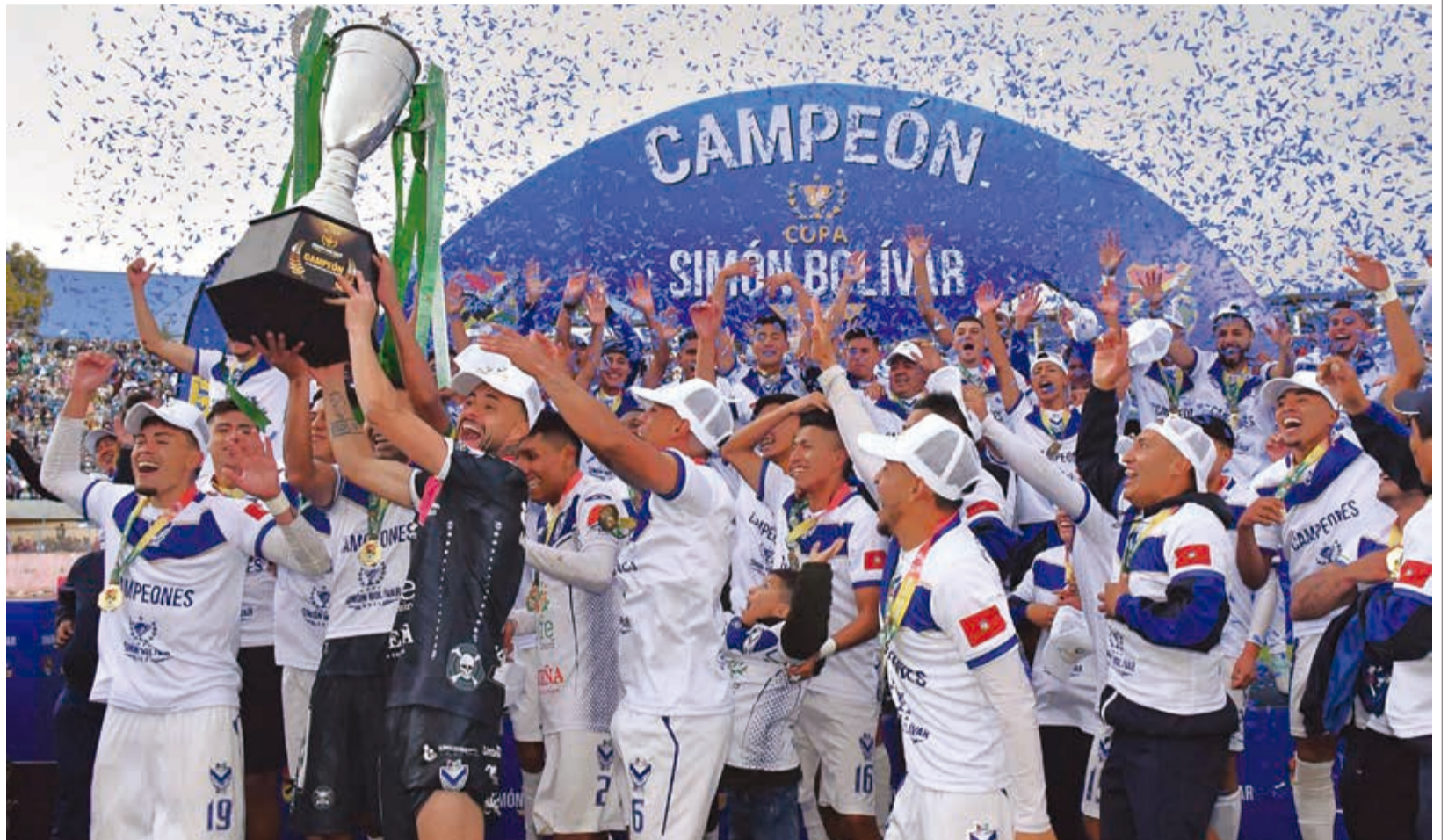
Festejos de GV San José, campeón de la Copa Simón Bolívar 2024.

en cuanto a la cantidad de clubes participantes, pero el costo de la organización de la fase I será cubierto por las asociaciones locales, mas ya no por parte de la federación. Para este año, el número de participantes variará por determinación del Consejo