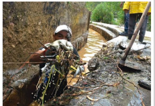
Vecinos retiraron la basura que obstruía un canal.