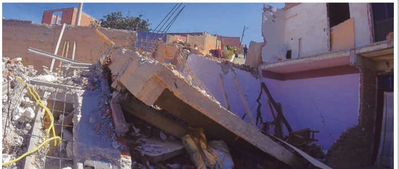
Deslizamientos en la junta vecinal Libertad, en el sur, por ser una zona de riesgo a hundimientos. JOSE ROCHA