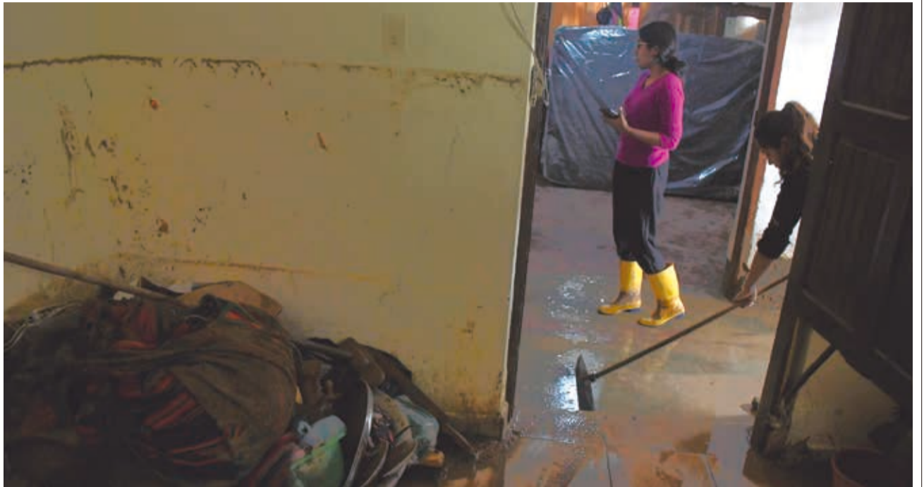
El muro de una de las casas en el barrio La Concordia, en San Pedro, cedió por el rebalse del canal.

MULTIMEDIA Escanee este QR para ver la afectación en San Pedro www.lostiempos.com