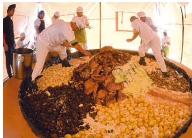
Presentan el puchero “más grande del país”. DANIEL JAMES

val Sacabeño se extenderá con el Corso este 24 de febrero, junto a más de 50 fraternidades desde las 11:00. El domingo seguirá la fiesta con los Taquipyanakus.