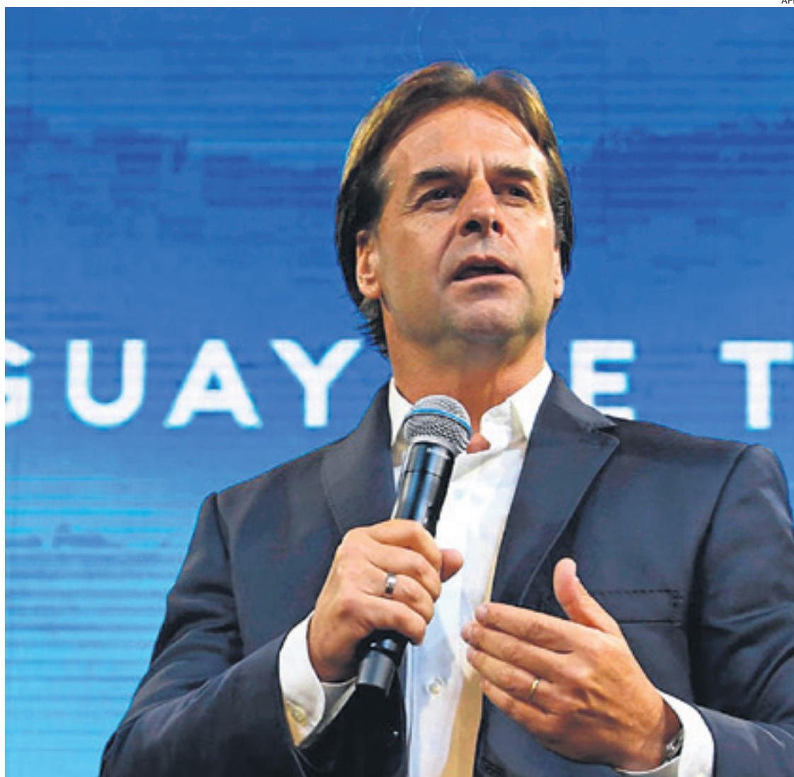
Luis Lacalle, presidente de Uruguay, país donde "se respetan las libertades políticas y libertades sociales"

A nivel mundial, Noruega, Nueva Zelanda e Islandia encabezan la clasificación del índice sobre democracias, que cierra Birmania y Afganistán.