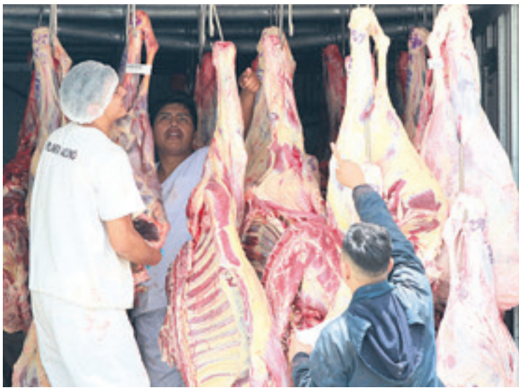
El ministro Montenegro asegura que se está exportando más carne

en esta coyuntura se incrementó entre un 25 y 30%", precisó Arze.