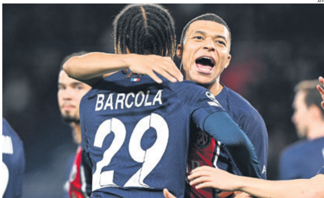
Kylian Mbappé le comunicó al París Saint-Germain que no quiere continuar en el equipo francés y su futuro estaría en el Real Madrid