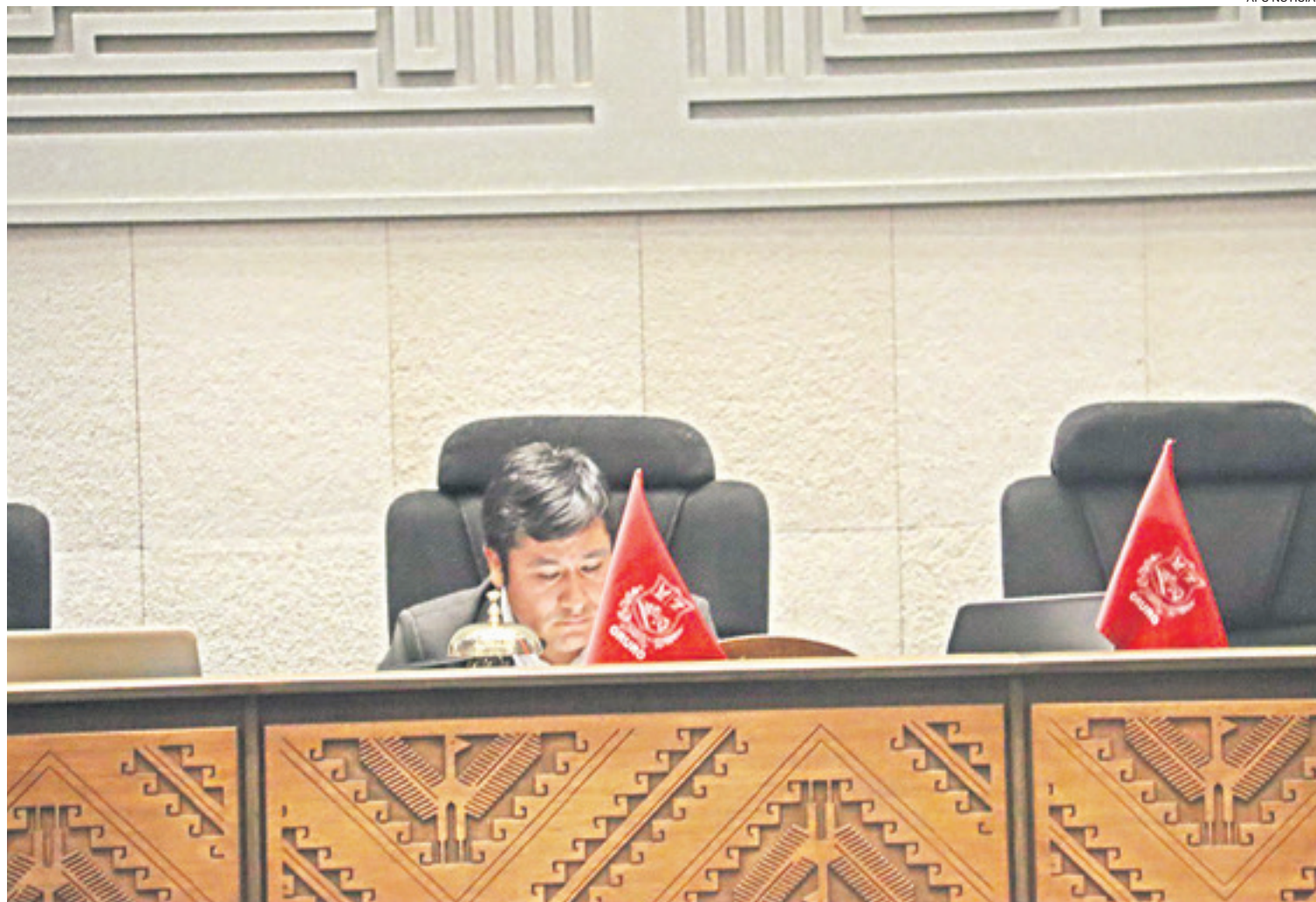
El presidente de la Cámara de Diputados, Israel Huaytari, en solitario durante una de las sesiones que se produjeron poco antes de Carnaval.

Para los opositores, hay una crisis integral dentro del masismo