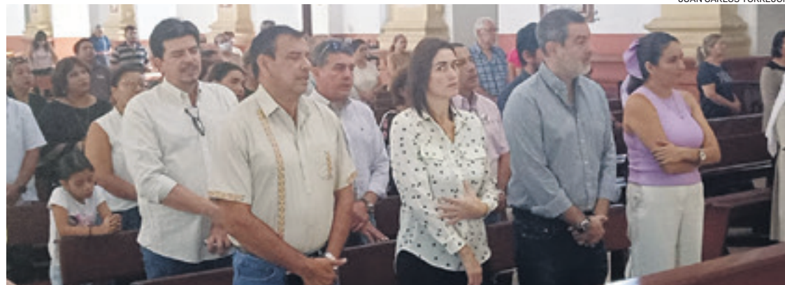
Autoridades departamentales estuvieron ayer en una misa conmemorando el cumpleaños de Camacho