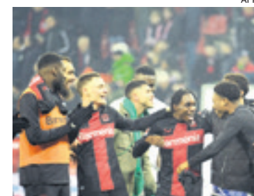
El Bayer Leverkusen enfrentará el sábado al Heidenheim por la 22a. fecha

El Bayern no solo no reaccionó, sino que volvió a perder el miércoles en el partido