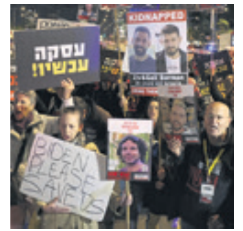
Hay protestas contra la guerra

Su sucesor, Volker Türk, visitó Venezuela en enero de 2023, cuando se acordó que la oficina operaría por dos años más. Durante su estancia animó a las autoridades a liberar a todas las personas detenidas "arbitrariamente".