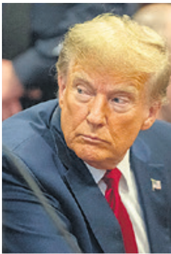
Trump cree que el caso resurge porque es candidato

El caso "nunca hubiera sido presentado" si no estuviera "postulándose" a presidente, declaró Trump en su red social Truth Social previo a la audiencia en el Tri-