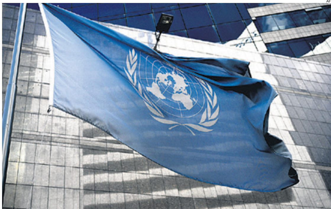
El Gobierno venezolano justifica que la oficina de DDHH ejecutaba un papel impropio y parcializado

La Oficina del Alto Comisionado en Ginebra lamentó la decisión y señaló que está "evaluando"