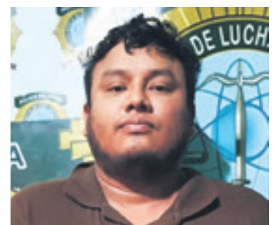
Uno de los brasileños, considerado capo del narcotráfico, fue trasladado bajo fuertes medidas de seguridad a la Felcn de Santa Cruz. Hoy serán cautelados cuatro por asesinato