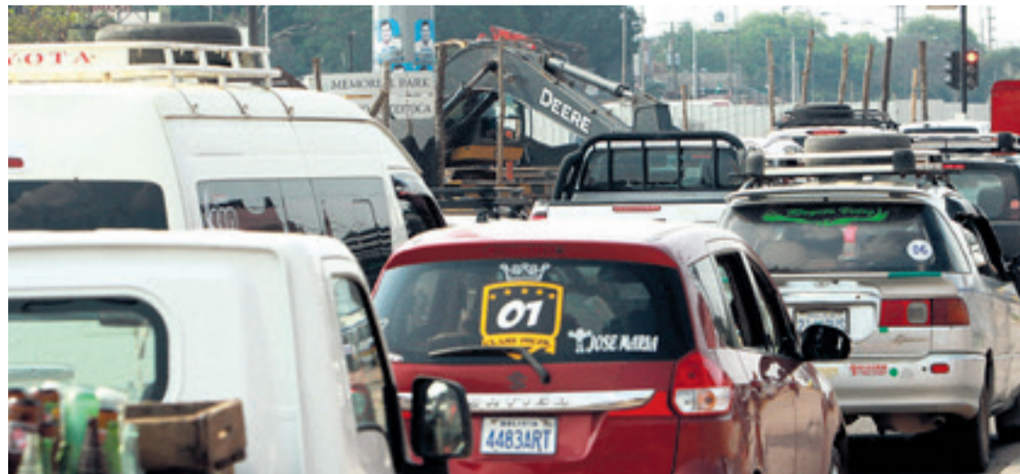
Micros, trufis y vehículos particulares llenan las vías. Conductores observan la falta de ordenamiento