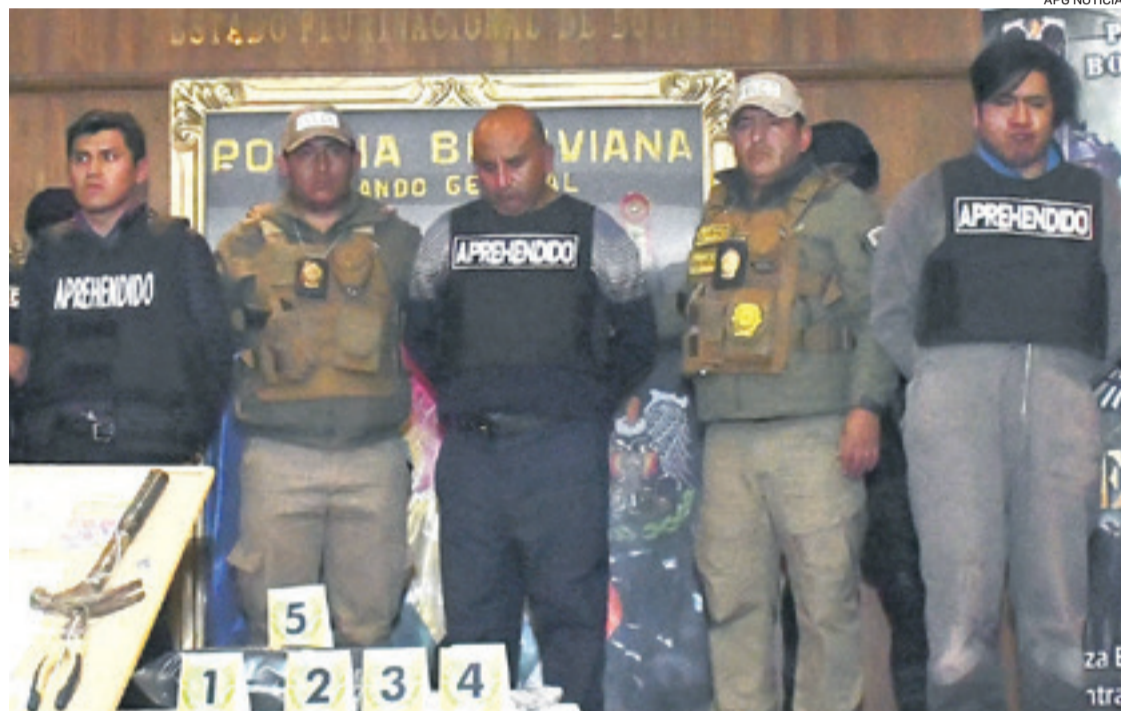
El jueves por la noche, el Gobierno presentó a los tres implicados, dos de ellos ya fueron sentenciados.

Para probarlo, el fiscal expuso hojas de papel que tenían las huellas digitales de las mujeres, y aseguró que las habían obtenido