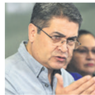
Juan Orlando Hernández

El general Augusto Heleno, ministro del gabinete de Seguridad Institucional, añadió: "Si hay que dar un golpe sobre la mesa para revertir la situación, hay que hacerlo antes de los comicios".