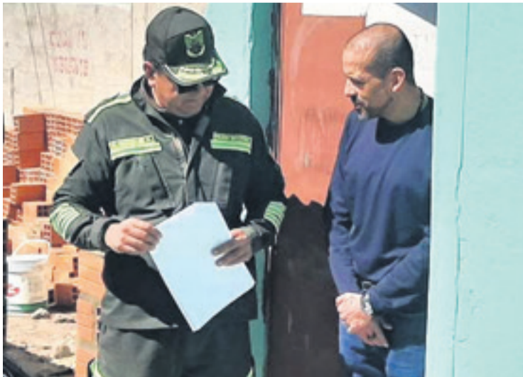
Un custodio policial le entrega una notificación al gobernador Camacho

En todo caso, el líder cívico ratificó ayer el plan de llevar adelante en marzo una “cumbre de la unidad” para resolver el “resquebrajamiento” que se dio por el conflicto de la Gobernación, entre Aguilera y el gobernador Camacho.