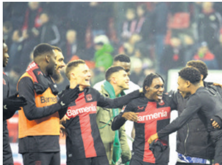
El Bayer Leverkusen se afirma en la punta y va rumbo a su primer título en la Bundesliga

Con 55 puntos, por 50 del Bayern, que encajó en el BayArena su tercera derrota en la Bundesliga, el Leverkusen está más cerca que nunca que alzar la primera Bundesliga de su historia y borrar al fin al apodo irónico con el que se le conoce "Neverkusen", del inglés "never" ("nunca"), en