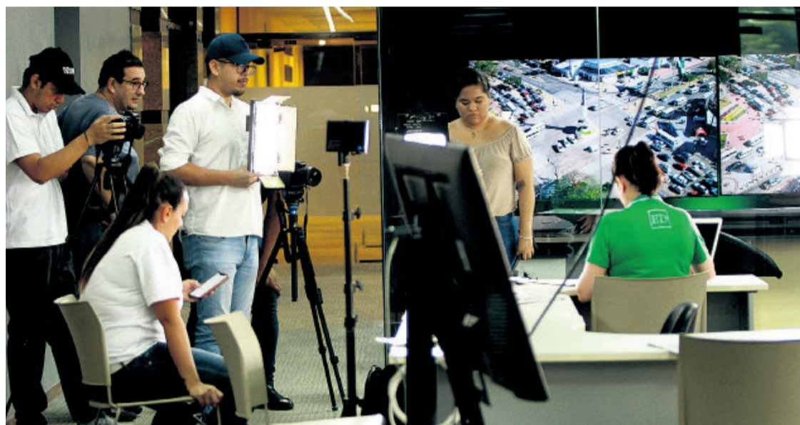
Transmisiones en vivo por redes y radio, explainer y otros formatos son parte del combo de retos