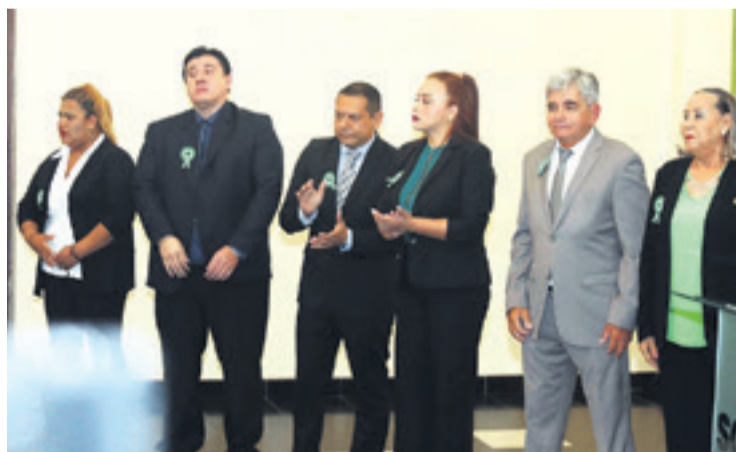
Hace unas semana seis de ocho secretarios fueron posesionados