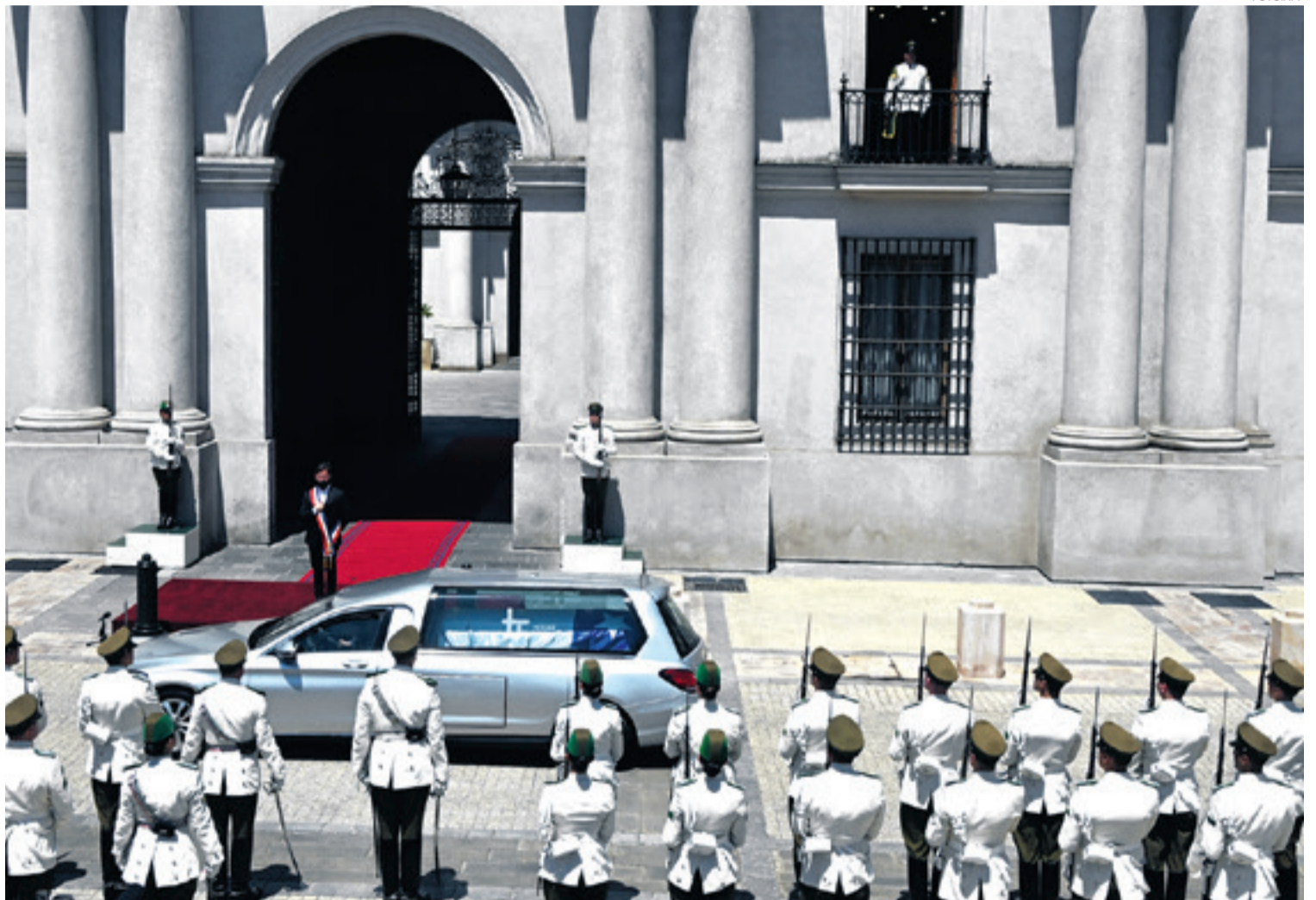
El presidente, Gabriel Boric, despidió en solitario el féretro del exmandatario desde el palacio presidencial de La Moneda. Sucedió el viernes.

Tras las palabras del expresidente demócrata-cristiano Eduardo Frei (1994-2000), la socialista Michelle Bachelet (2006-2010 y 2014-2018) resaltó a Piñera como