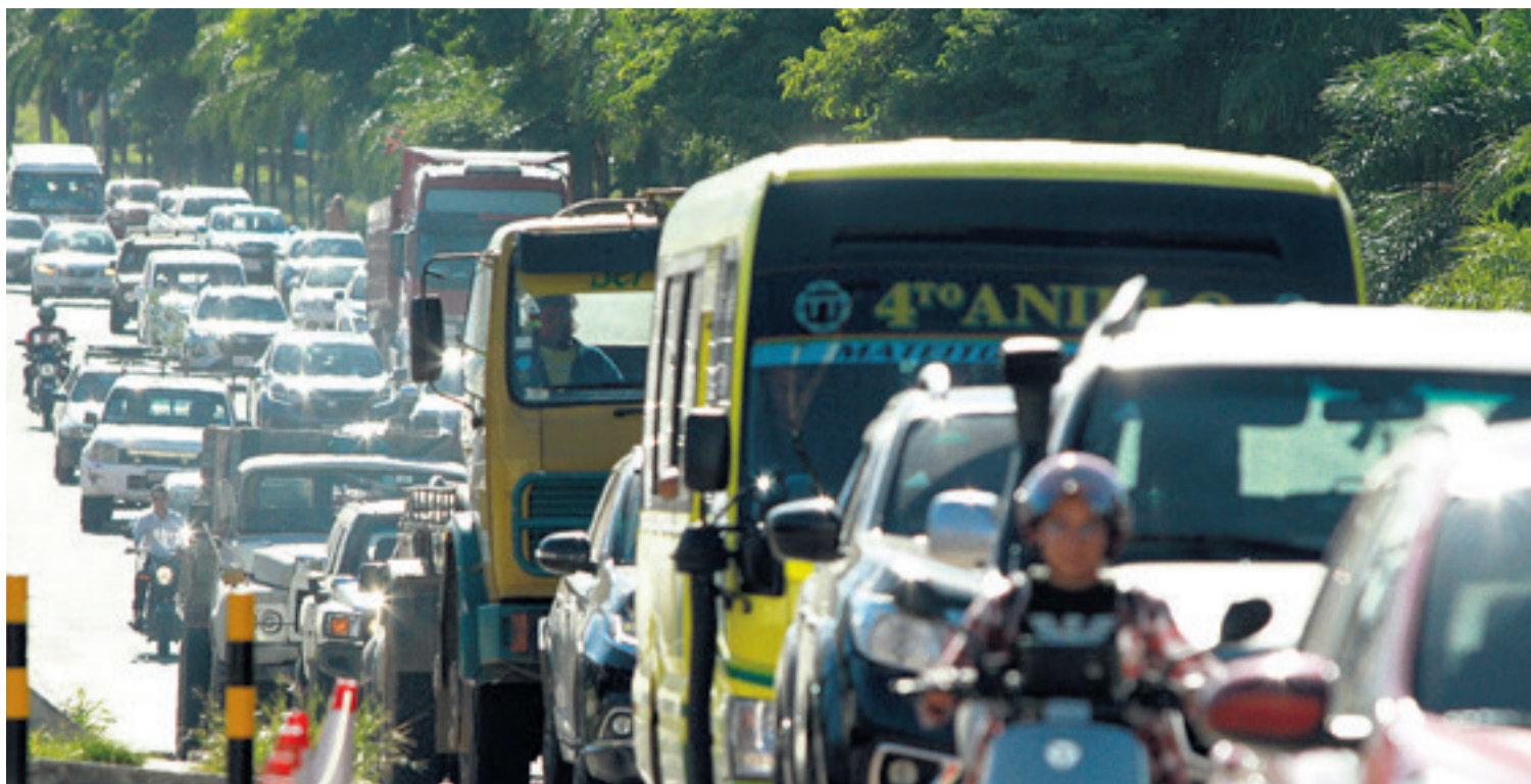
El caos que se genera en el cuarto anillo, entre las radiales 26 y 27. Algunos conductores se dan modos para buscar rutas alternas

el jueves estuvo punto de retornar a su oficina porque quedó prácticamente detenida en medio del atolladero en la rotonda de la Beni. Ella acostumbra a volver a su casa a la hora del almuerzo, pero asegura cada vez se le hace más difícil por las trancaderas.