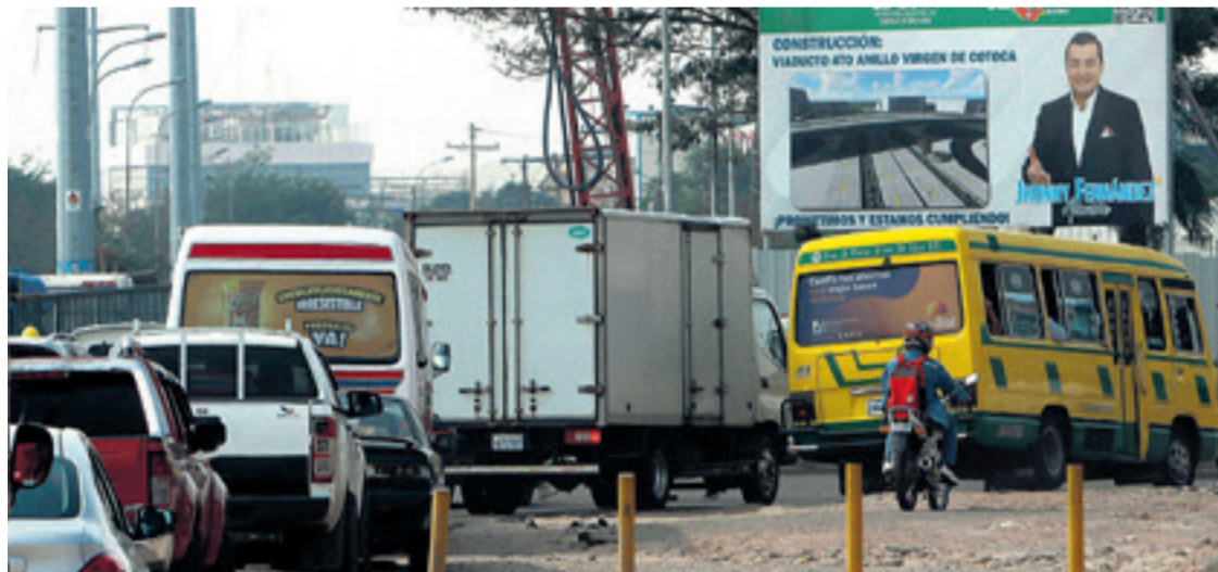
En el cuarto anillo de la Virgen de Cotoca está en construcción un viaducto para descongestionar el tráfico