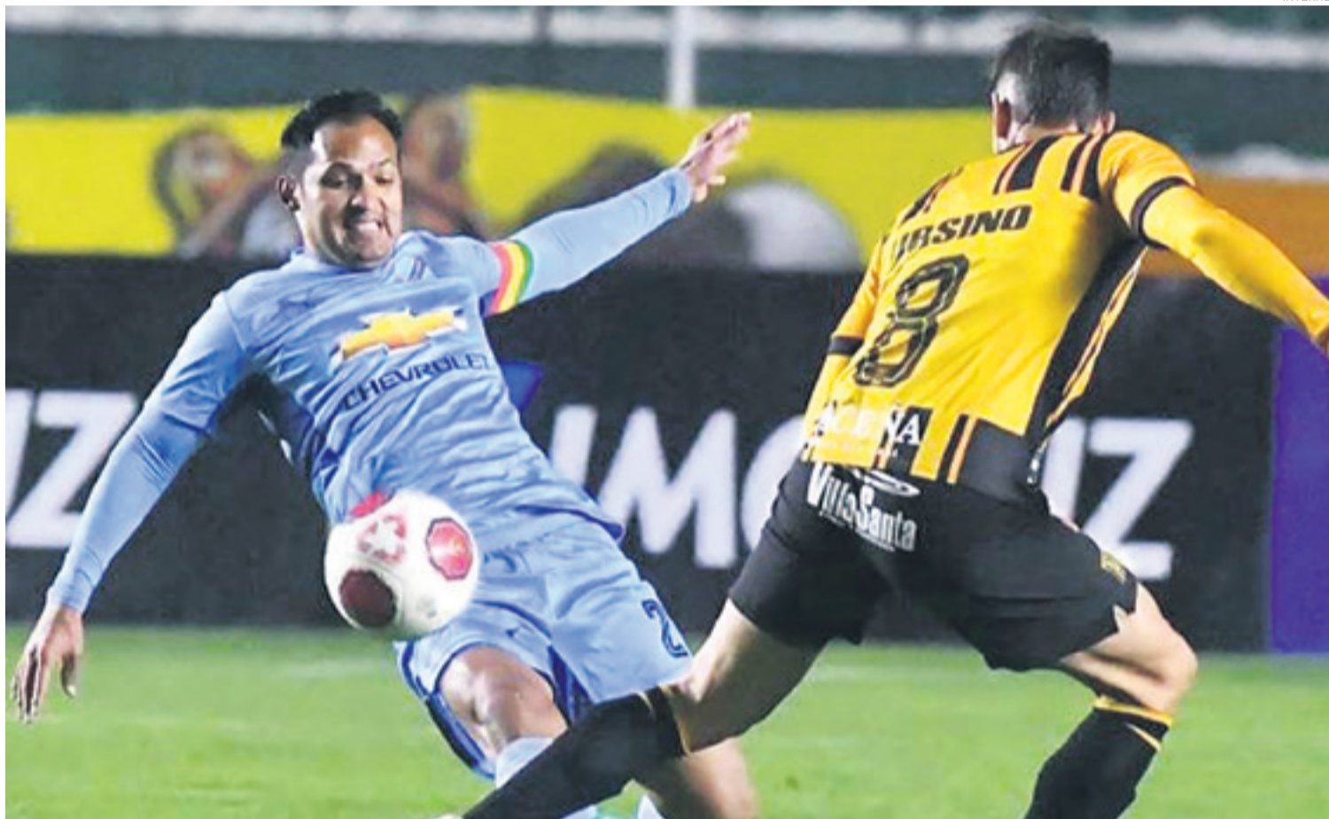
Fabol le advirtió a la FBF que el torneo Apertura no empezará si los clubes no se ponen al día en sus obligaciones económicas. La última palabra al respecto la tienen los futbolistas

En cuanto al reclamo de Blooming por incumplimiento de contrato del futbolista, aún sigue en litigio.