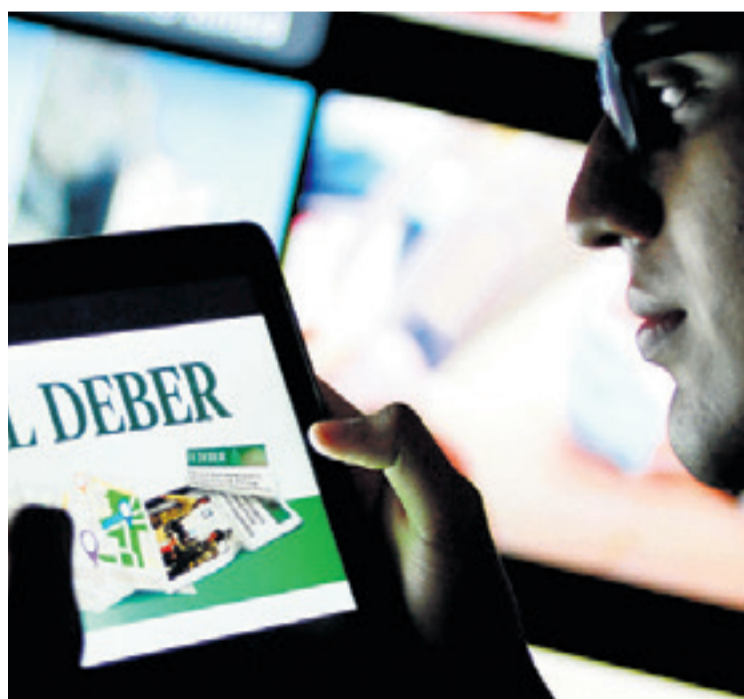
El legado de Pedro Rivero Mercado saltó del papel a las pantallas