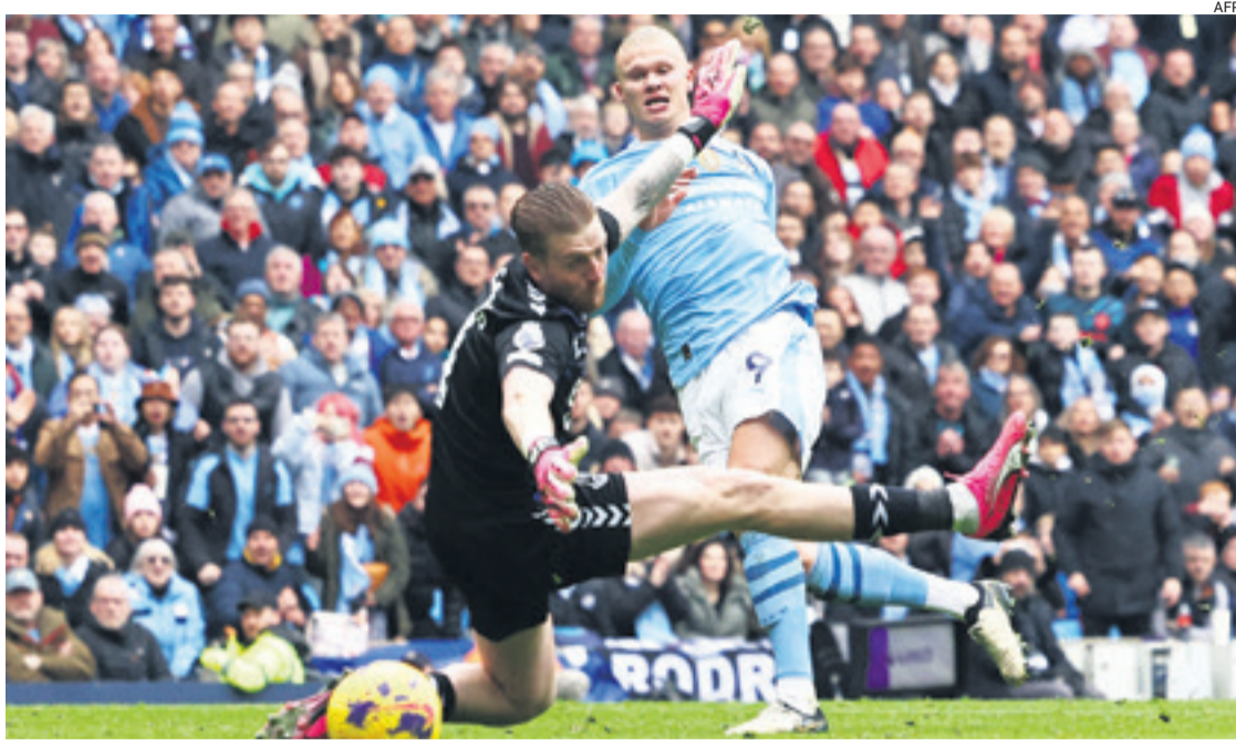
El noruego Erling Haaland volvió al gol y le dio la victoria al Manchester City ante el Everton. Se mantiene como goleador en Inglaterra