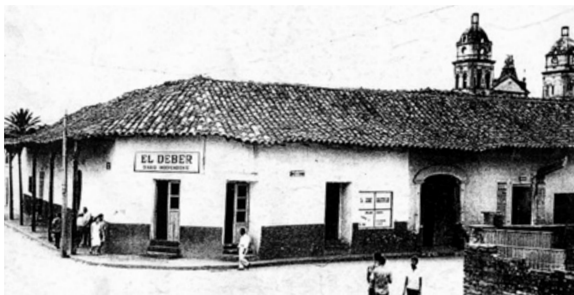
La primera oficina, ubicada en la intersección de las calles Bolívar y Beni. Década de los setenta