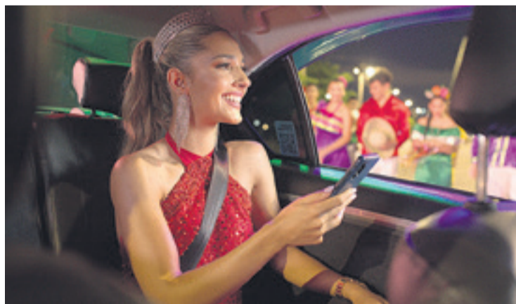
Yango acompañará a la reina Aitana I durante la fiesta grande.

Yango constantemente está desarrollando tecnologías que contribuyen a la seguridad de las carreras en línea. "Esta es nuestra prioridad principal. La tecnología de Yango incluye la disponibilidad de conductores que son verificados, un equipo