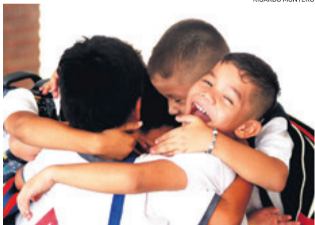
El reencuentro con los compañeros los llenó de alegría