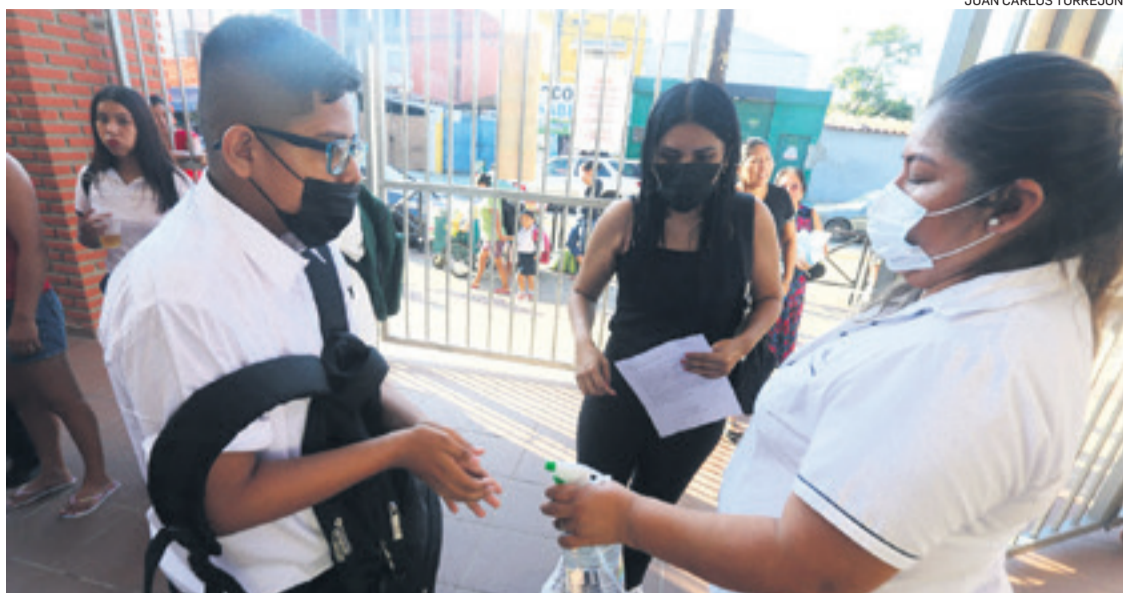
La desinfección de manos también fue controlada en el ingreso de las unidades educativas