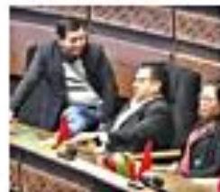
La sesión, ayer, en el Legislativo

La regulación busca frenar el alza de comisiones para transferencias al extranjero, debido a la falta de dólares. Economistas ven que la ayuda no alcanza a quienes mueven grandes montos de dinero, cuyas comisiones serán fijadas por la banca. 49-50