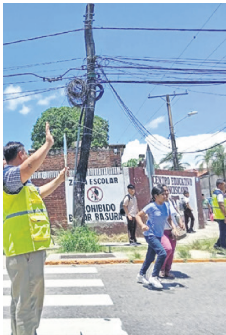
El control del tránsito en los alrededores de los establecimientos

entrega de una dieta completa, pues "lo que se hará es reformular el menú".