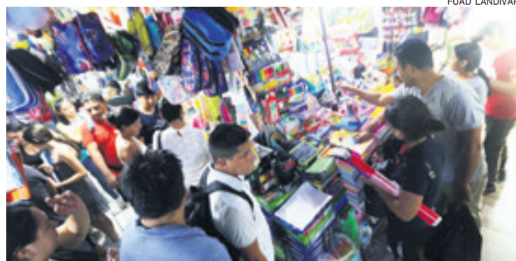
La venta de útiles escolares también aumentó en mercados y librerías

En algunos establecimientos educativos hubo reclamos por la falta de alcohol en gel para cuidar de la bioseguridad.