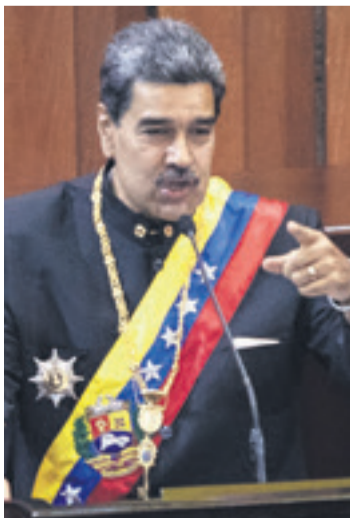
El presidente Nicolás Maduro irá de nuevo a la reelección

“Siempre salimos a ganar, como nos las pongan, cuando nos las pongan, donde nos las pongan, el pueblo (está) organizado y preparado para ganar las elecciones”.