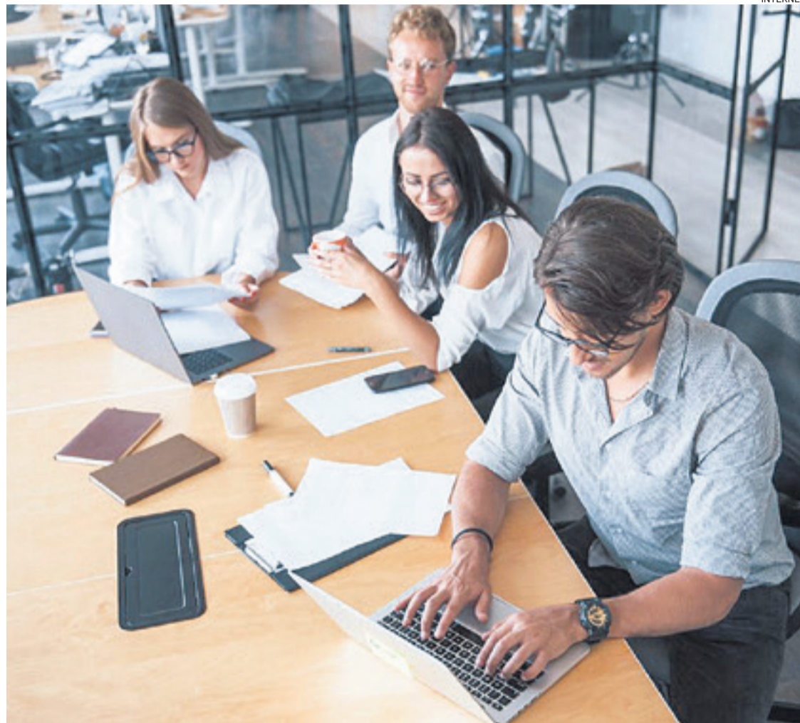
Mercado. Los jóvenes son los que más dificultad tienen para acceder a un puesto de trabajo acorde a sus estudios