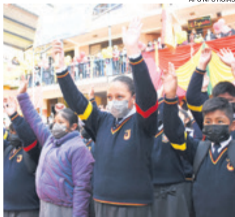
La bioseguridad se aplicó en distintas regiones