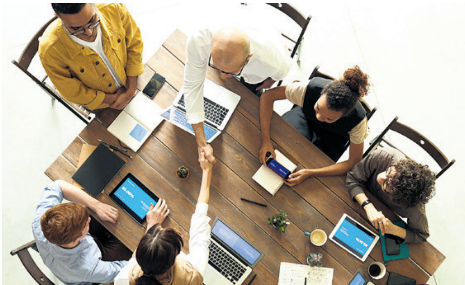
Sinergia. Los empresarios deben aprender de otros empresarios. Las experiencias en momentos de dificultad facilitan la toma de decisiones para invertir