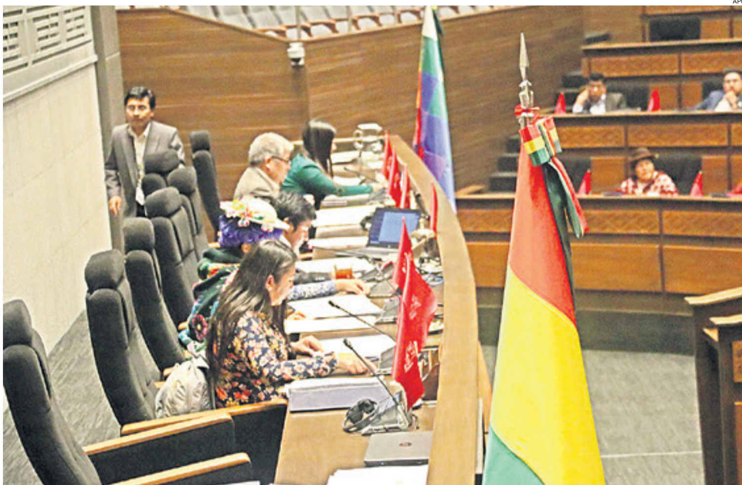
Mientras los seguidores de Evo y Arce mantenían un cerco a la Plaza Murillo, diputados opositores y del oficialismo se tomaron su tiempo en la ley

TRATAN LA LEY PRESIONADOS DESDE LA CALLE