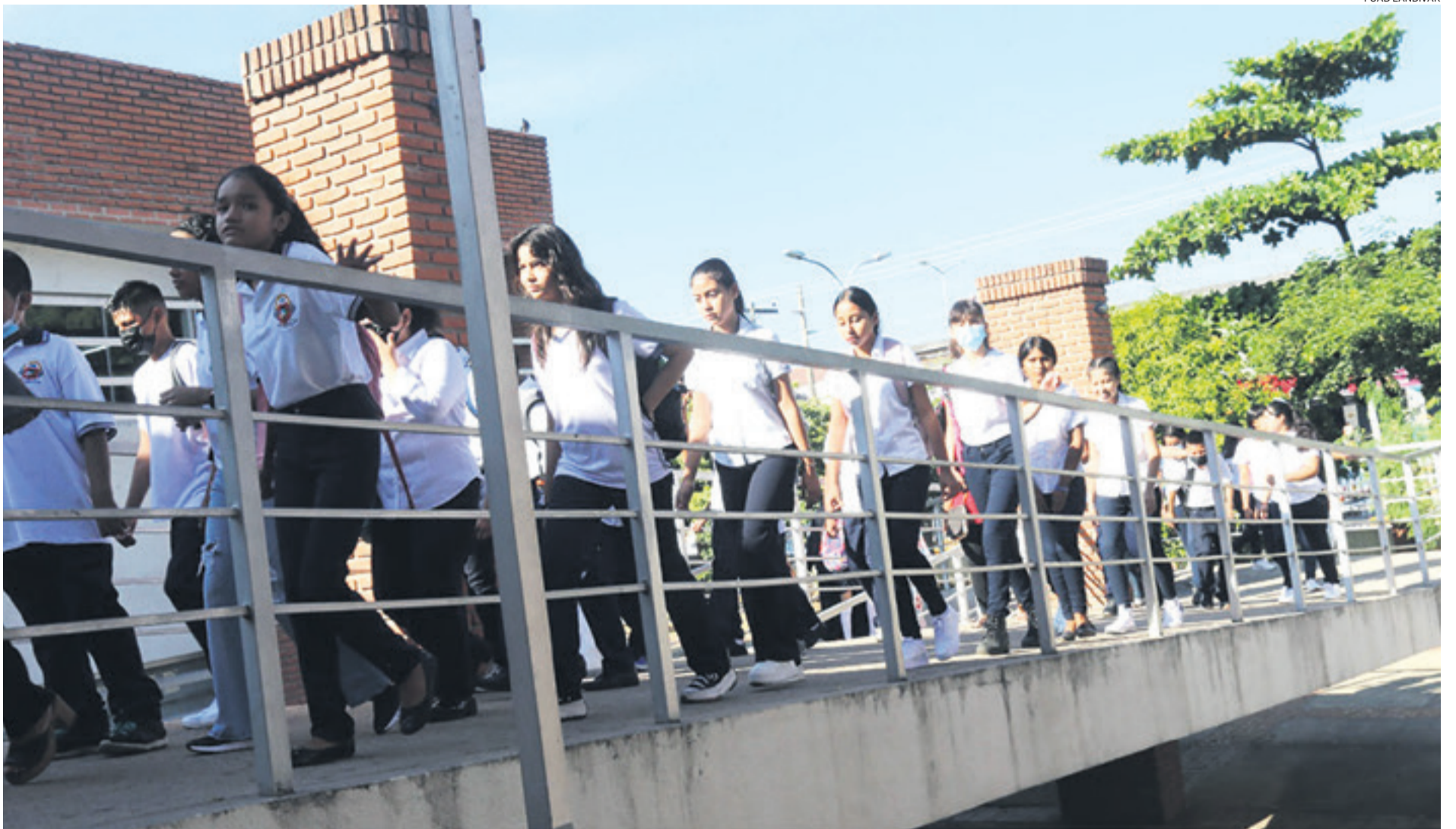
Los estudiantes iniciaron clases, pero la alimentación complementaria escolar no llegó a las aulas y se deberá esperar algunos días para la entrega