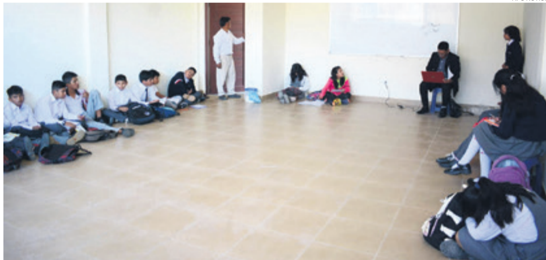
Estudiantes de la unidad educativa 24 de Junio de Tarija enfrentaron problemas con el mobiliario

El funcionario municipal estima que, una vez se habiliten las vías, tomará una semana regularizar la dotación de la merienda escolar.