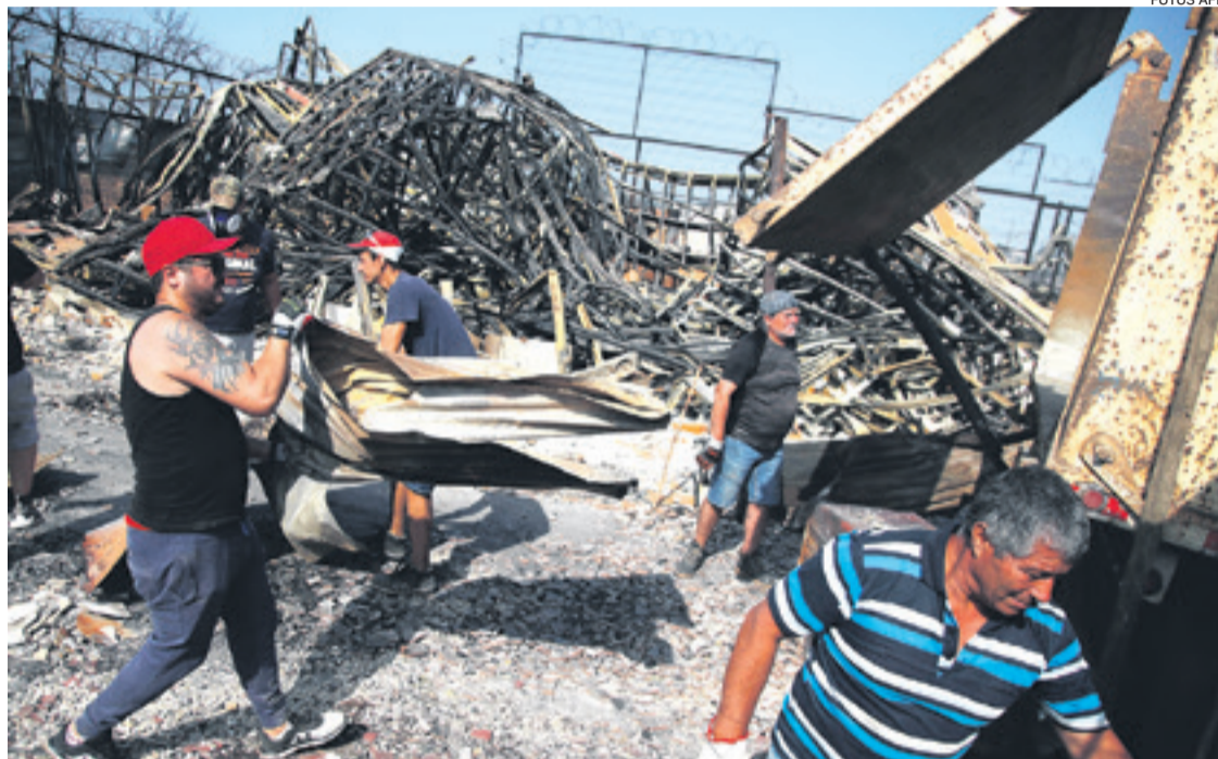
Vecinos de Villa Independencia tratan de recuperar algunas pertenencias de entre los escombros