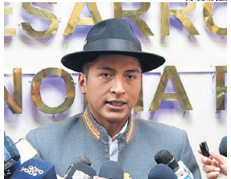
Flores detalló el daño que se genera a la industria sin chimenea

“Se ha registrado 150,8 millones de bolivianos de pérdidas solo en el sector turismo y el sector hotelero ha reportado más del 40% de cancelación y pérdidas debido a las medidas de protesta”, puntualizó Flores en conferencia de prensa. /AE