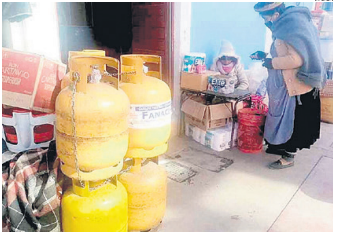
Debido a su menor precio, las garrafas de GLP tienen gran demanda, con ingreso ilegal, en el vecino país

“Las garrafas de color amarillas bolivianas son las más buscadas por la gente, las de color azul y rojo son peruanas y son más costosas, casi no lle-