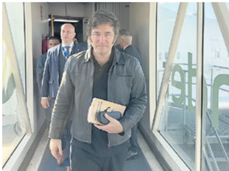
El presidente argentino emprendió viaje con destino a Israel

En un decreto anterior publicado el viernes, Milei daba a la jefatura de Gabinete el control de los medios públicos para "intervenir