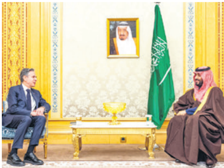
Antony Blinken se reunió ayer con el príncipe Mohamed bin Salmán

El ministerio de Salud de Hamás, que gobierna la Franja de Gaza desde 2007, afirmó que al menos 128