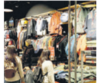
Consumo. El dato no toma en cuenta la caída en los 'súper'

Según datos de la Cámara Nacional de Comercio de Chile (CNC), las ventas semanales del retail marcaron en general una contracción en enero. Con cifras actualizadas del 22 al 28 del mes pasado, las ventas del sector presentaron una baja promedio semanal de 1,7% nominal al compararlo con las mismas semanas del año pasado.