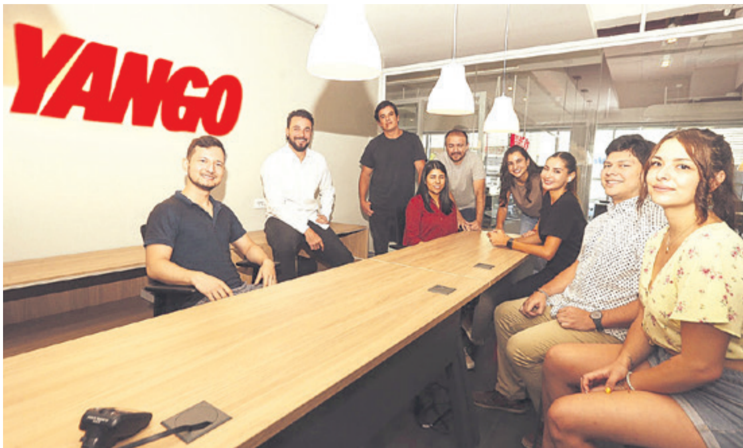
Equipo local de apoyo en Yango Santa Cruz de la Sierra.