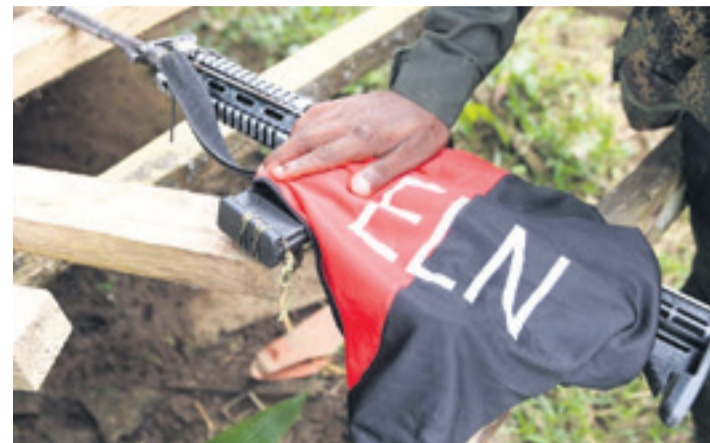
El Ejército de Liberación Nacional continúa activo en Colombia

Esta prolongación se negocia luego que el ELN se comprometió a suspender los secuestros