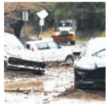
La lluvia y sus consecuencias

Ayer se volvió a implementar un toque de queda nocturno, entre las 21:00 y las 05:00 de hoy, para facilitar las labores de los médicos forenses, la limpieza de escombros e intentar reponer algunos servicios públicos.