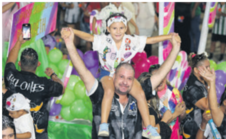
El curso infantil fue una fiesta para los chicos, pero también de padres

El curso infantil fue organizado por el Comité de Damas del Rotary Club Santa Cruz, que cada año pone todo su esfuerzo en este evento para promover la cultura y la tradición del Carnaval entre los más pequeños, pero además con el objetivo de sostener obras benéficas, como el Centro de Niños Quemados (Cerniquem), y otras iniciativas.