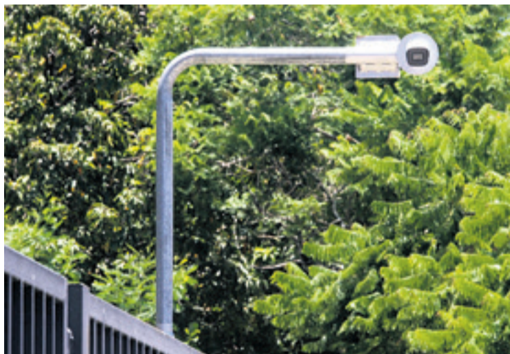
Las nuevas tienen mejor sistema de vigilancia