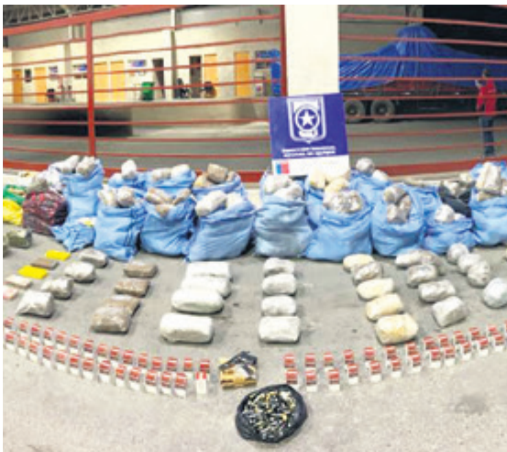
En un operativo en Chile, en 2023, también se halló droga en maderas.

Según informes de Dirandro, la mayoría de estos capos peruanos, que son los que tienen nexos con mafias bolivianas y brasileñas, radican en la ciudad de Santa Cruz de la Sierra con identidades falsas. Algunos se dedican al sector de la inmobiliaria y también a la agroindustria.