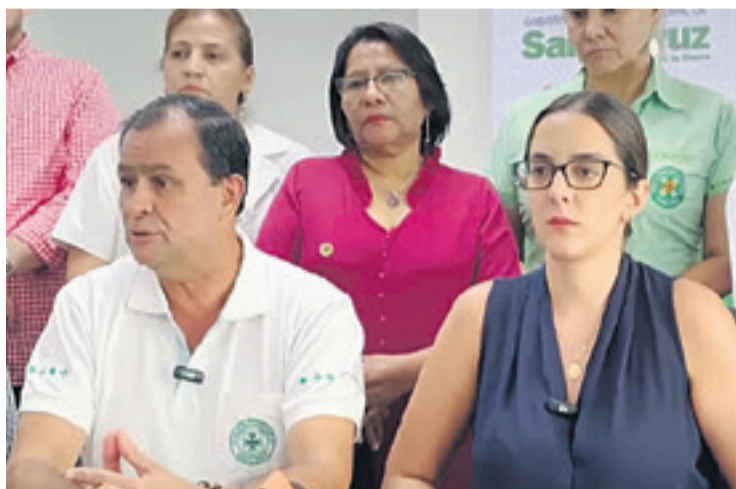
La semana pasada hubo mesas técnicas; continuarán en estos días