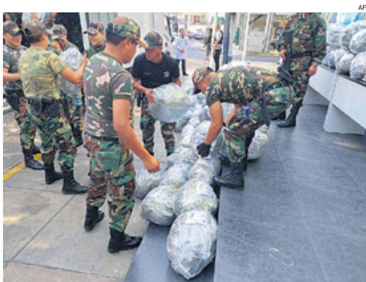
El cargamento de cocaína que pudo ser enviado desde Santa Cruz

Tras el descubrimiento, las autoridades del Viceministerio de Defensa Social, confirmaron que fue Bolivia la que dio la voz de alerta para el descubrimiento.