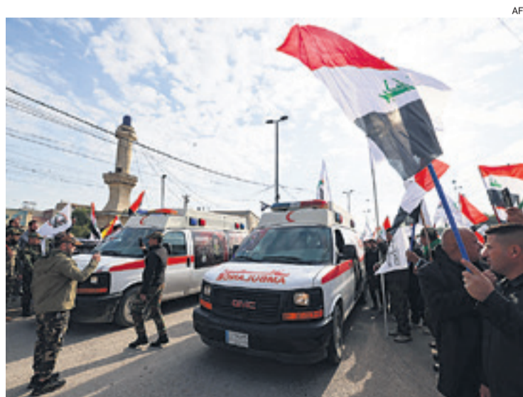
Ambulancias llevaban ayer los cuerpos de las víctimas en Irak

Estados Unidos y su tradicional aliado Reino Unido atacaron el sábado decenas de objetivos en Yemen en respuesta a repetidos ataques a barcos que transitaban el mar Rojo y el Golfo de Adén por parte de los rebeldes hutíes respaldados por Irán.