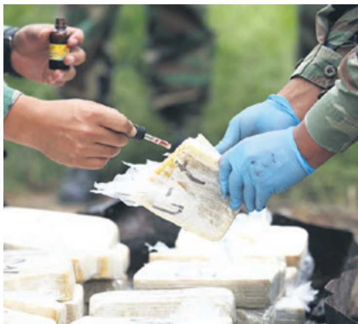
La Policía boliviana coordinó acciones con la Dirandro del Perú.

Algo similar pasó en Perú. La pasada semana se incautó 7,2 toneladas de cocaína. La droga también estaba en medio de un cargamento de madera. Entre las maderas de lujo había una franja negra que era