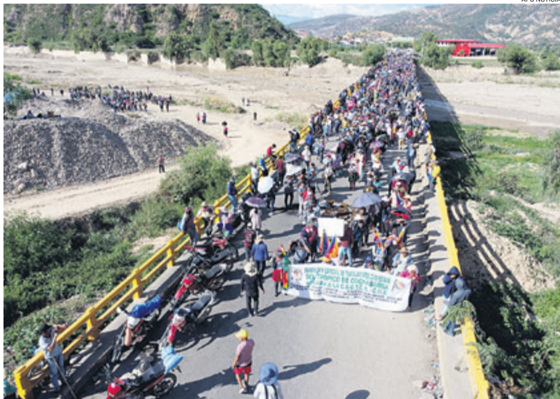
El Gobierno identificó ocho puntos de bloqueos en las vías que unen Cochabamba con Oruro y La Paz.

Por su parte, el viceministro Ríos lamentó que, a pesar del acuerdo político alcanzado el viernes -para la viabilización de las elecciones judiciales-, persisten ocho puntos de bloqueo con, al menos, 1.500 movilizados en la