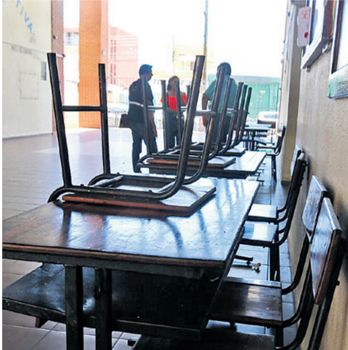
Padres familia y porteras se encargan de la limpieza de los centros