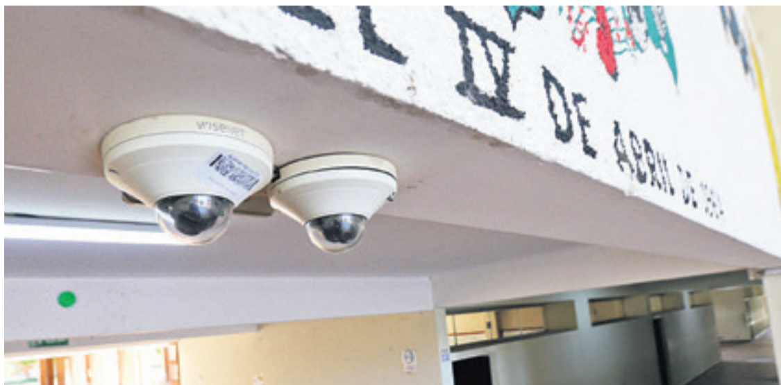
La Alcaldía indicó que se está haciendo mantenimiento a las cámaras que estaban instaladas