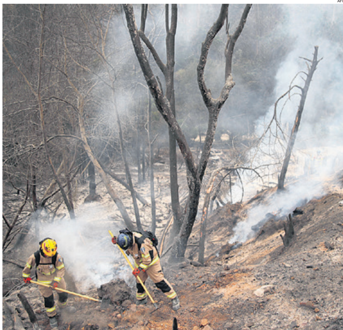
Los incendios forestales en Chile arrasaron varias comunas y prevén que aumente el número de víctimas

Esa cifra se reveló ayer por la tarde, aunque el mandatario chileno dijo que los números de fallecidos podrían subir. Cuatro comunas continúan con toque de queda.