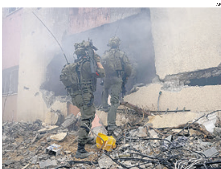
Siguen los conflictos en Gaza. Israel bombardeó una guardería.

Pese a la resolución de la Corte Internacional de Justicia (CIJ)