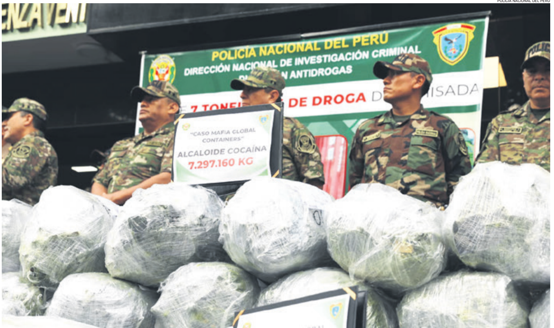
La Policía peruana mostró las 7,2 toneladas de cocaína que fueron halladas en el puerto del Callao. Maexa SRL. llevaba a Europa esa droga camuflada en cargamentos de madera.