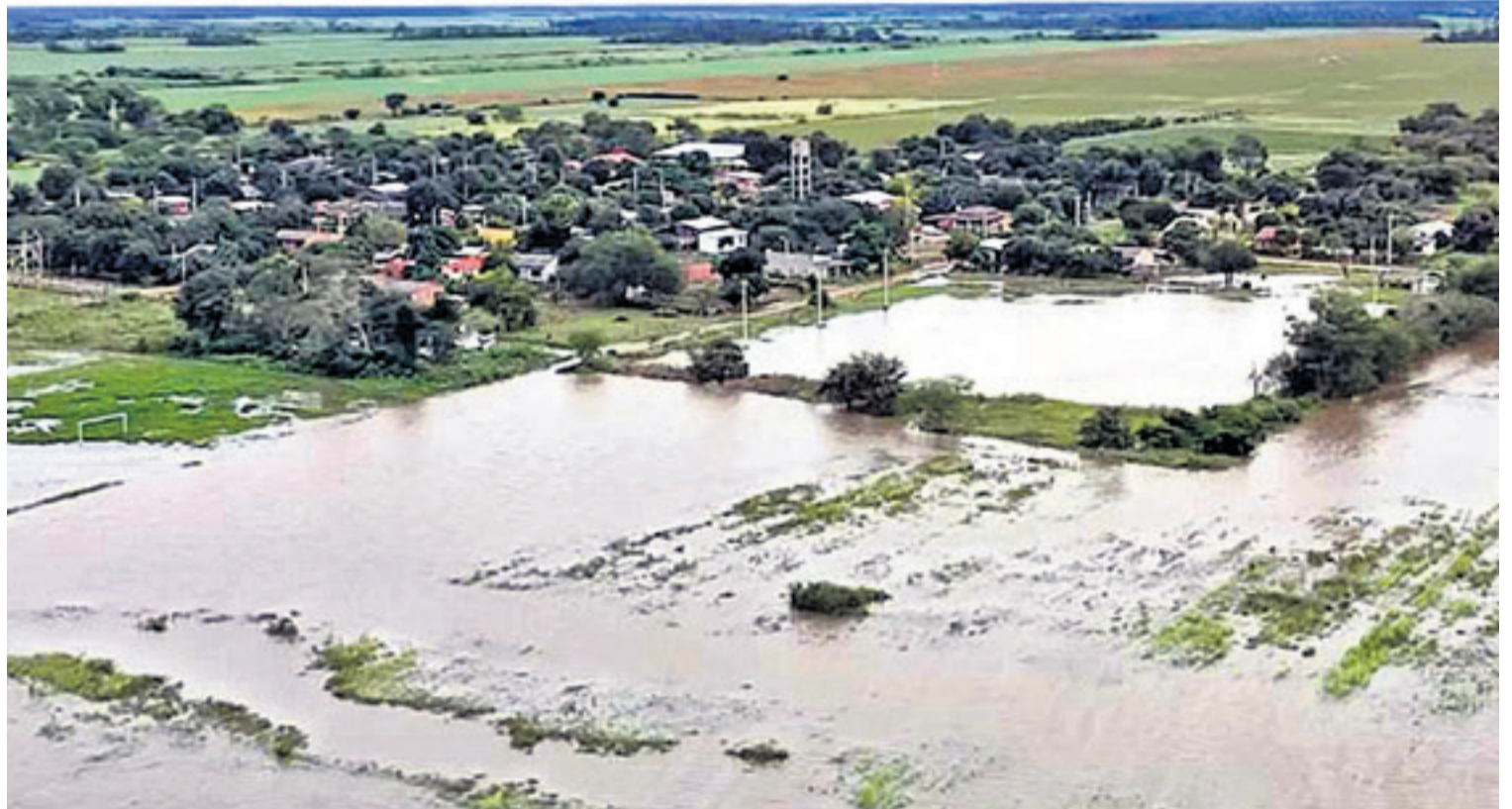
Campo de soja inundado en Cuatro Cañadas, Santa Cruz. Anapo calcula pérdidas promedio de 400 mil toneladas en los últimos años

"El problema, en la simulación, era el agua. Inundaciones y escasez en ciertos lugares. Pero no era tanto por el cambio climático, sino por la expansión de la frontera agrícola que necesita mucho más agua para el riego (...). Para eso hay que planificar bien dónde se van a expandir las actividades (agrícolas), porque en ciertos lugares no hay suficiente agua para seguir haciéndolo", expresó Andersen.