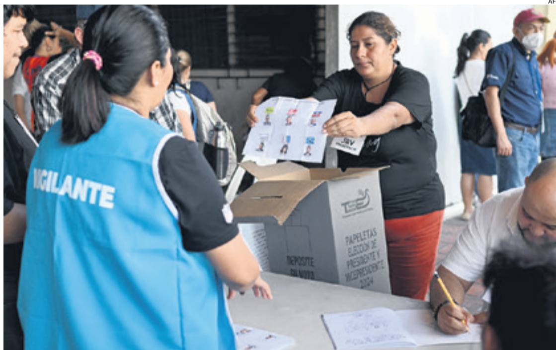
Unos 6,2 millones de salvadoreños (740.000 en el exterior), votaron en pleno estado de excepción

mingo, el mandatario tiene prácticamente asegurada la reelección y las encuestas vaticinaron que podría tener la supermayoría calificada en el Congreso unicameral.