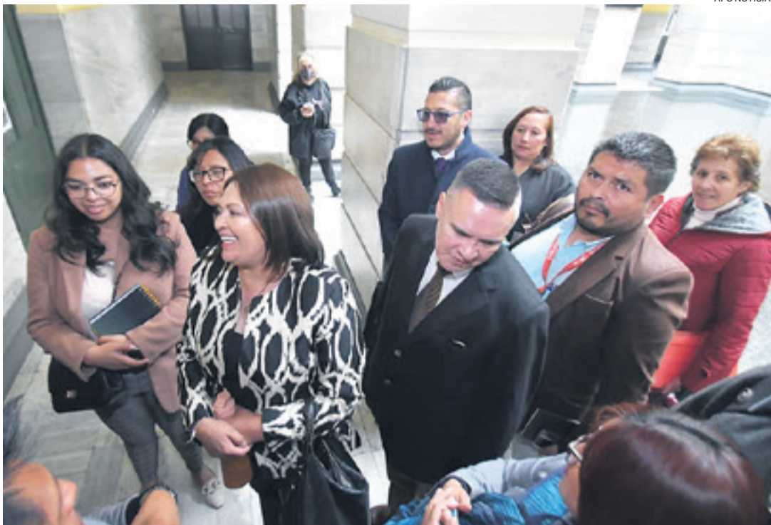
Los acusados del segundo caso ingresan a la sala de audiencias en La Paz

Los informes de la psicóloga y de la trabajadora social fueron lapidarios para desarmar todo.