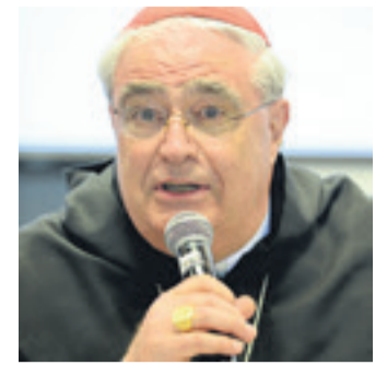
El cardenal José Lacunza.

El mandatario defendió que El Salvador tenga la tasa de encarcelamiento más alta del planeta y afirmó que todos los policías cometen errores.