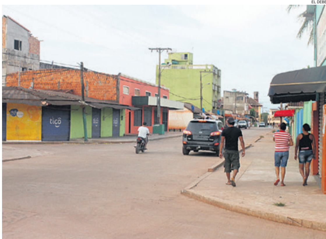
Pobladores de San Matías conmovidos con la muerte violenta de un hombre que festejaba por carnaval