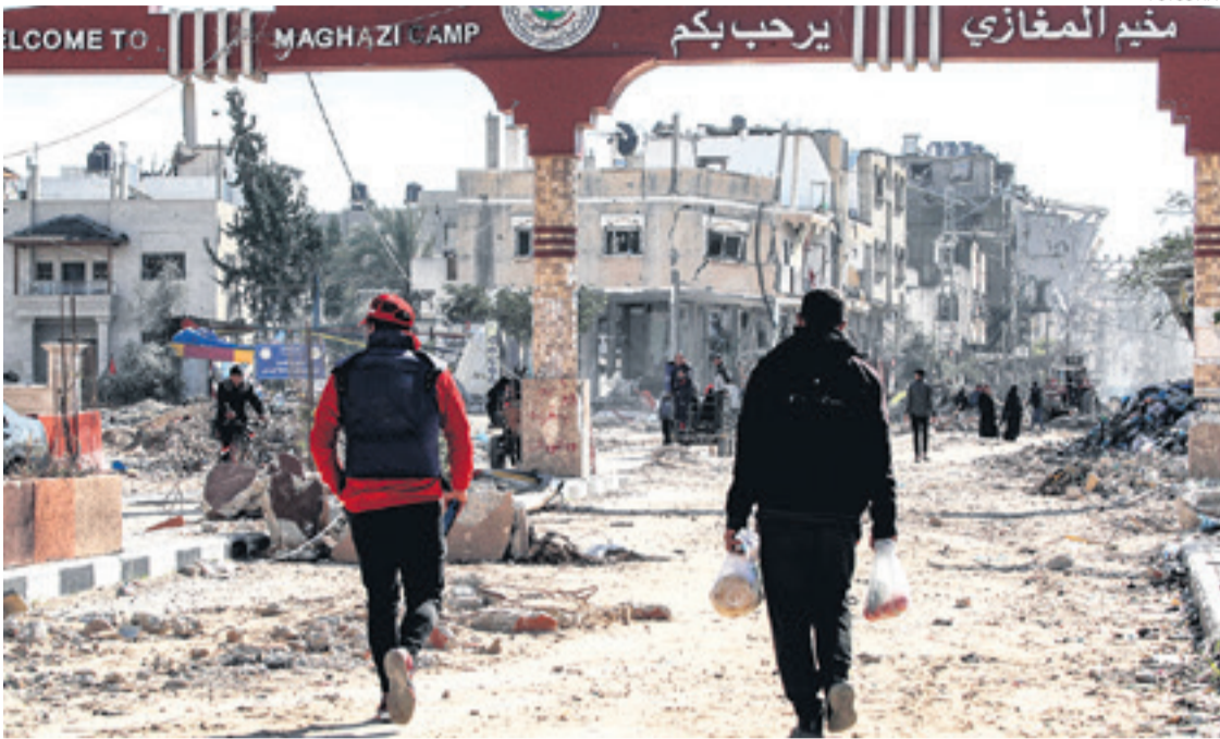
Una estela de destrucción se observa en las ciudades de la Franja de Gaza por los ataques de Israel