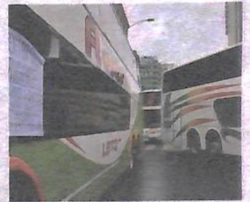
Protesta en el centro político

citado. Arriba de 1.000 dólares se cotiza a Bs 8,10. Por la transferencia en yuanes, la comisión alcanza un 13,5% A10