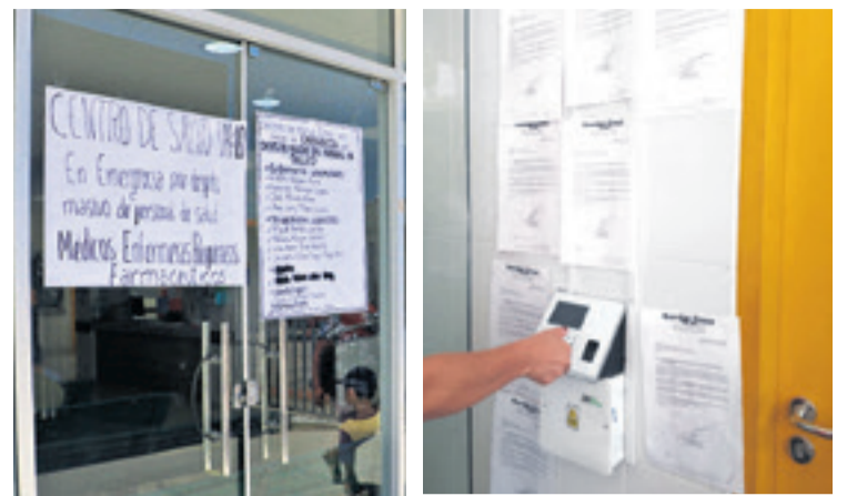
Estos avisos informan sobre los despidos y el cierre de servicios