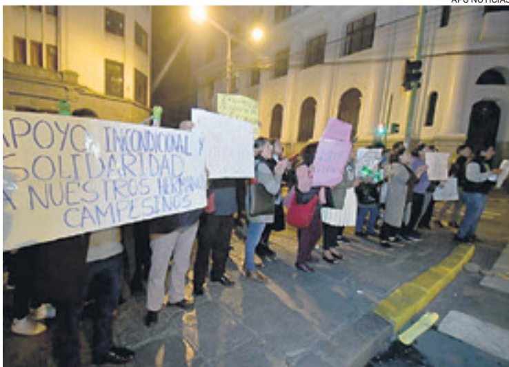
Hay tensión y bloqueos cerca de la vicepresidencia del Estado