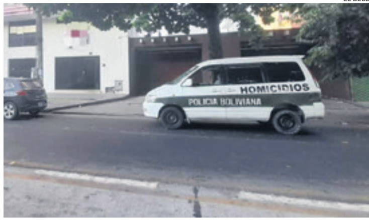
El vehículo de la brigada de homicidios de la Felcc levantó los restos