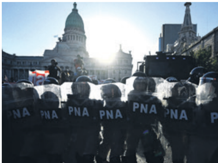
La policía tuvo que actuar contra los manifestantes en Argentina

Imágenes de televisión mostraban a la policía disparando balas de goma para desalojar a cientos de manifestantes de las calles.