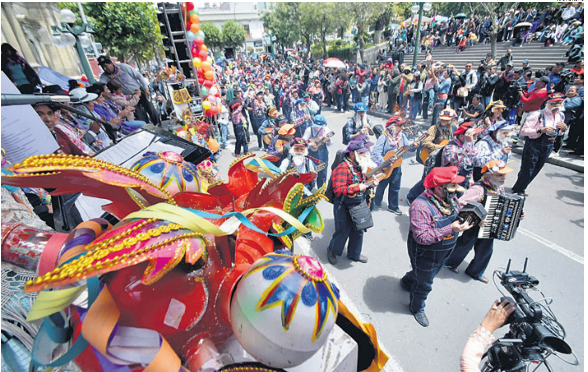
Las autoridades políticas vinculadas con el arcismo salieron ayer a celebrar el día de Compadres en la Plaza Murillo, mientras el resto de la ciudad estaba cerrada por los bloqueos

ARCE LLAMÓ A NO REPETIR LOS ERRORES DE 2019