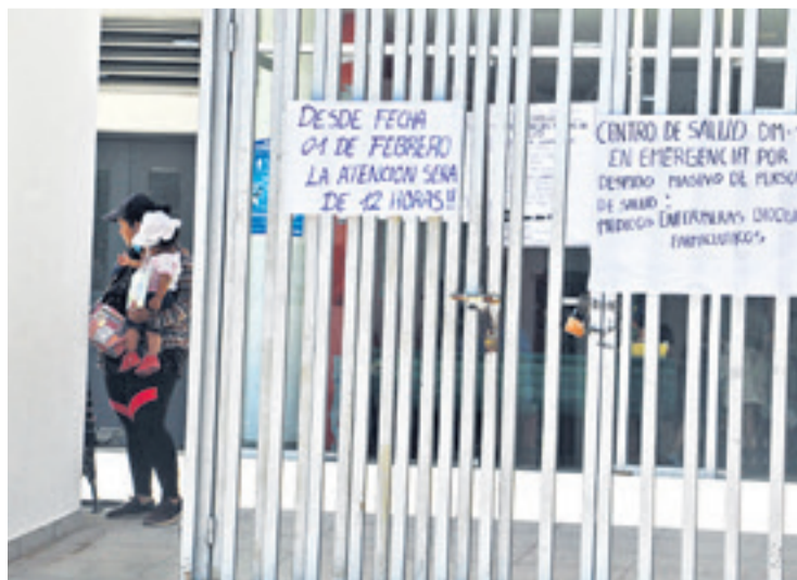
La gente se encuentra con estos letreros en las puertas del DM-10

"Lamentablemente nos hemos visto obligados a cerrar nuestra sala de pediatría con 20 camas, ya que el personal de enfermería, que es indispensable para colocar sueros e inyectables a los pacientes, fue retirado. Estábamos funcionando las 24 horas, pero ahora