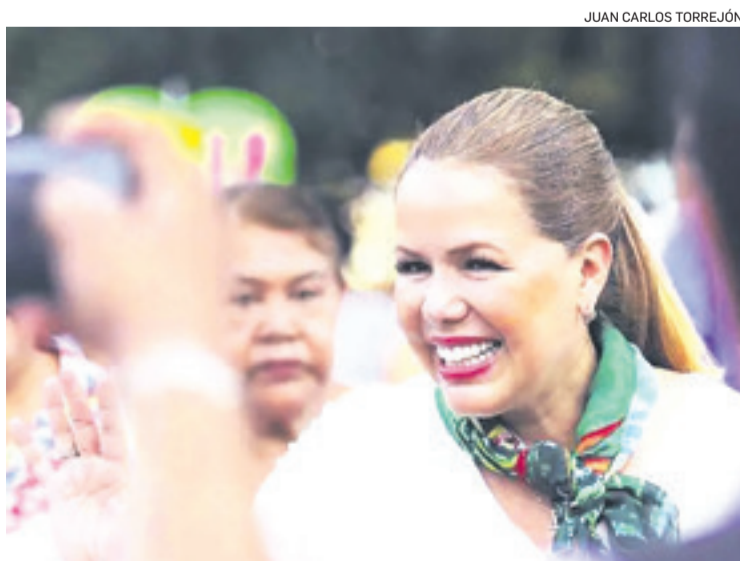
Sosa dijo que seguramente querrán sumarle más procesos

Señaló que el proceso ya está en etapa de juicio, pero que con esta audiencia de medidas cautelares, lo que pretende la parte