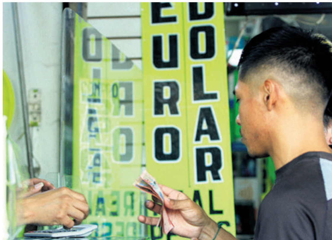
En las casas de cambio, se podía comprar dólares todavía en enero. Ayer la moneda no estaba disponible

Una fuente del sector bancario que prefirió guardar su nombre en