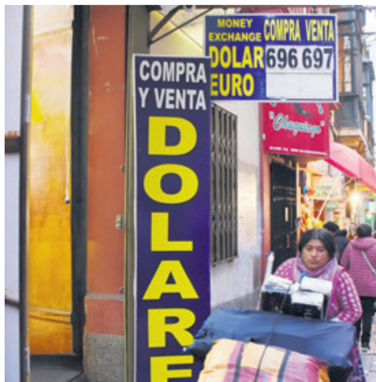
En la ciudad de La Paz, aseguran que el dólar paralelo subió a Bs 9

reserva, señaló que evidentemente en Bolivia existe escasez de dólares y que los bancos cuentan con unos $us 1.000 millones "a la vista", es decir, dinero de los clientes que pueden retirar cuando lo soliciten. "Pero si en este momento levantamos las restricciones, lo que quedaría en bóveda no alcanzará para nada. Por eso no se puede entregar todo de golpe", afirmó.