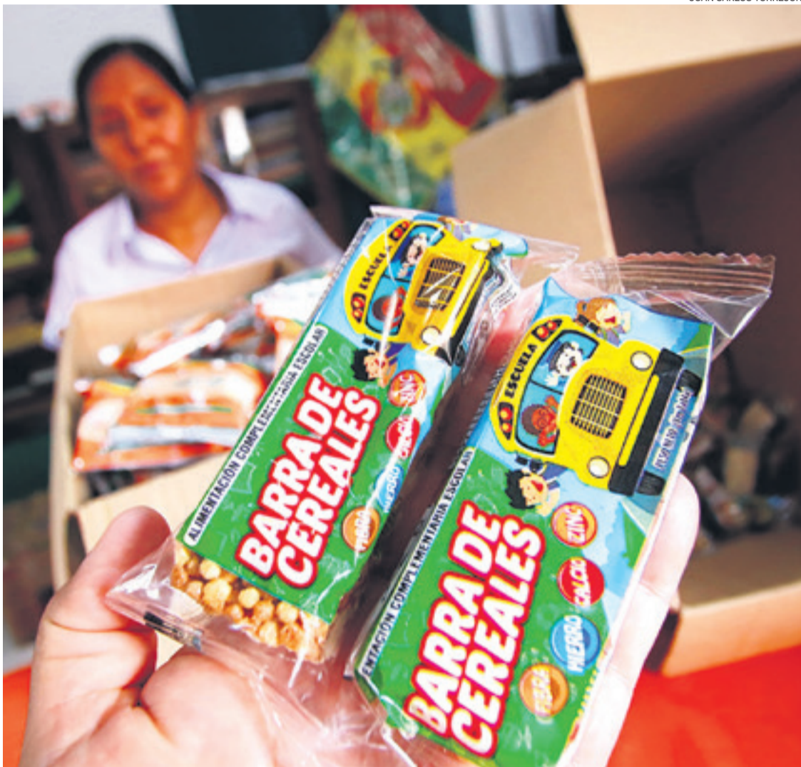
La licitación se llevó a cabo por Bs 168 millones. El año pasado hubo muchos reclamos