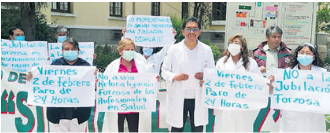
Médicos y profesionales protestaron en la ciudad de La Paz en contra de la jubilación forzosa