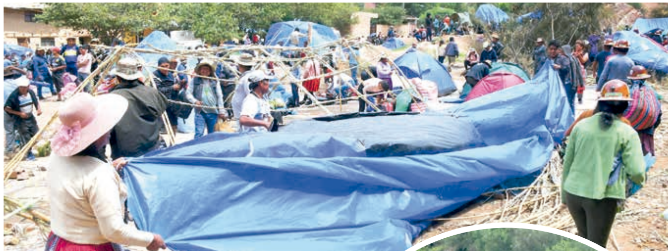
Bloqueadores levantan sus carpas en Parotani (Cochabamba).

Amenaza. Los evistas advierten que permanecen en vigilia y retomarán sus medidas en caso de que no se cumplan las demandas pendientes. En las terminales de buses del país, se normalizó la actividad.