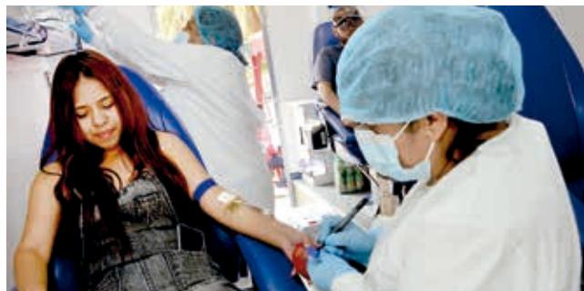
Universitarios acuden a donar sangre, ayer.

Datos. En 2023, acudieron más de 25 mil donantes, la mitad fue voluntario. Para esta gestión se prevé superar esta cantidad