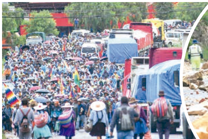
Policías organizan la circulación tras el desbloqueo, ayer.