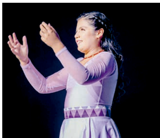
Soberana. Maya I es la reina infantil del Carnaval de la Concordia 2024.

asumido su reinado con un compromiso admirable. En sus palabras, expresó su gratitud hacia su familia y amigos, y aprovechó la oportunidad para enviar un mensaje de inspiración a todos los niños de Cochabamba, alentándolos a seguir sus sueños con esfuerzo y amor hacia sus seres que-