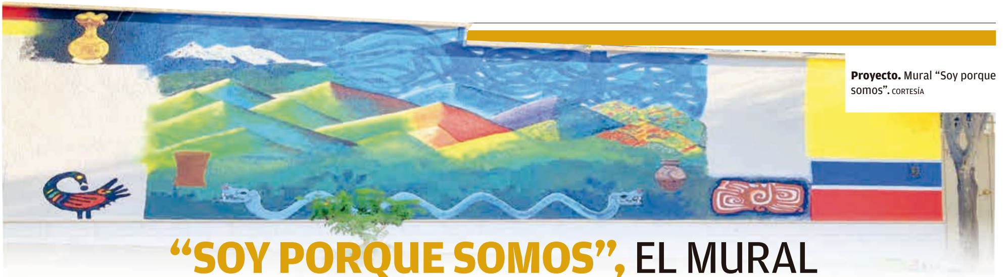
Proyecto. Mural "Soy porque somos".