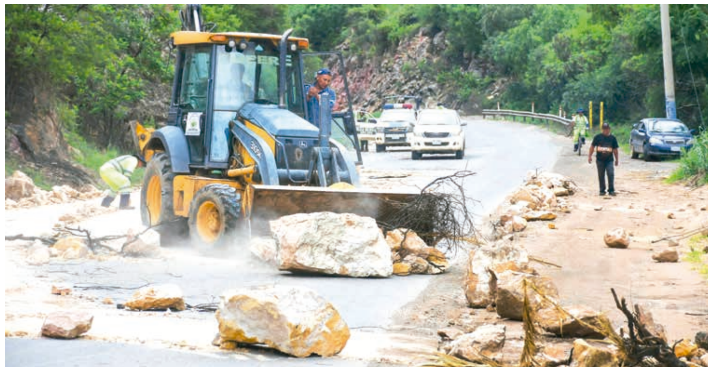
La maquinaria pesada barre las piedras de los bloqueos en la carretera a Oruro, ayer en Vinto.

Secuelas. Los comicios serán en septiembre. No se habló de la prórroga. El Presidente dice que querían su "cabeza". Del Castillo espera informes para actuar. Págs. 3-5