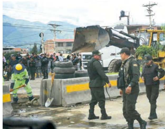
Gente afín al MAS se concentra en Parotani, ayer