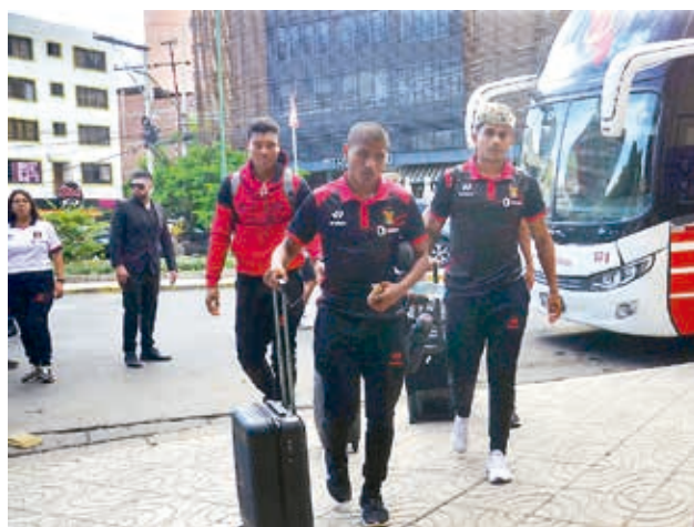
Llegada del equipo de Melgar de Arequipa a Cochabamba. DANIEL JAMES