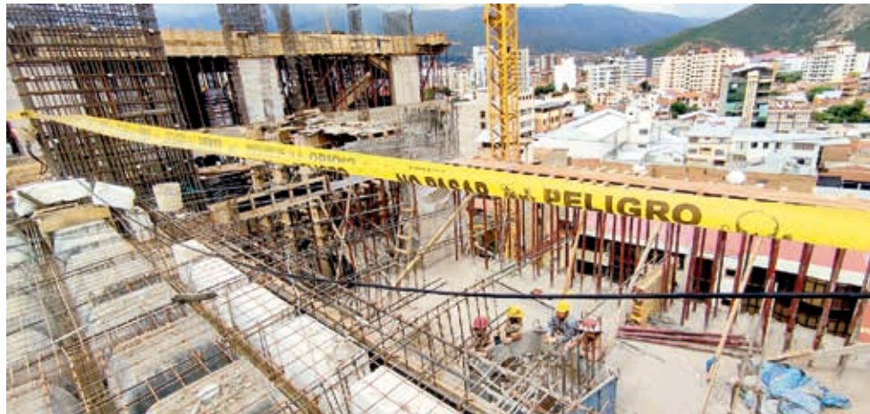
El piso donde cayó la losa del nuevo edificio edil.

MULTIMEDIA: Escanee este QR para ver el video de la inspección. www.lostiempos.com