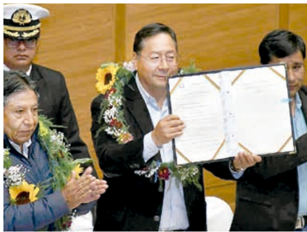
El presidente Luis Arce promulga la ley 144, ayer.

"Sacrificio del pueblo" En tanto, el expresidente Evo