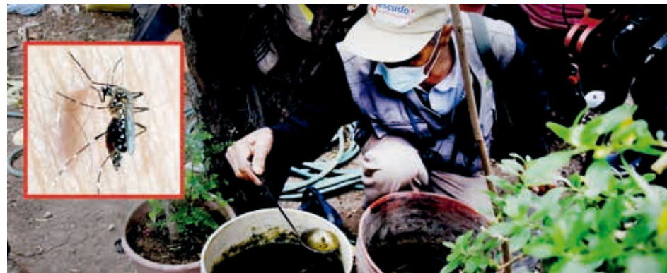
El mosquito que transmite el dengue Aedes aegypti. BCB

El 70 por ciento de las personas donantes de sangre en los puntos móviles son mujeres jóvenes y los restantes son varones, según Berrios.