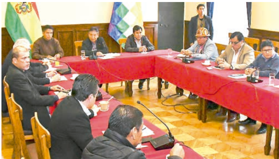
Reunión entre el Vicepresidente y representantes de la Asamblea, la semana pasada.