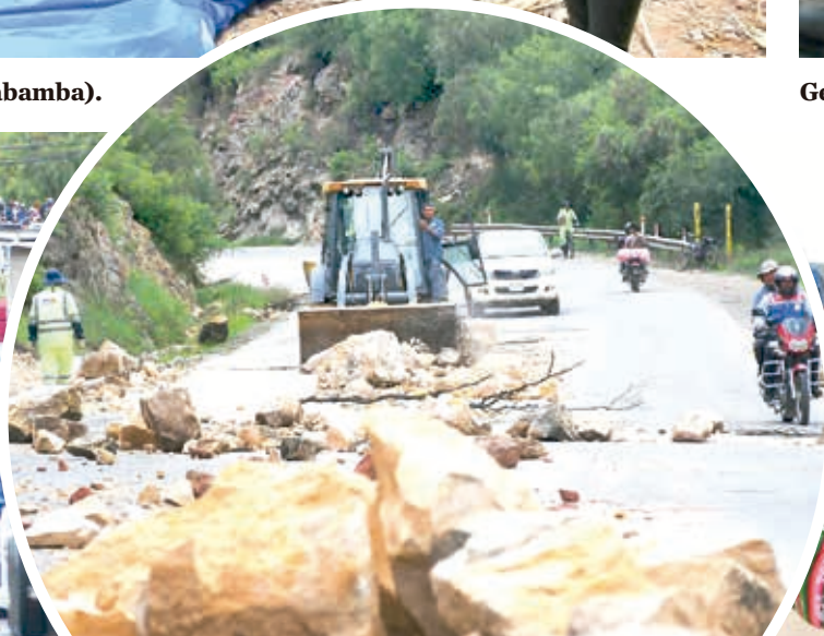
Retiran escombros con maquinaria pesada en Vinto.