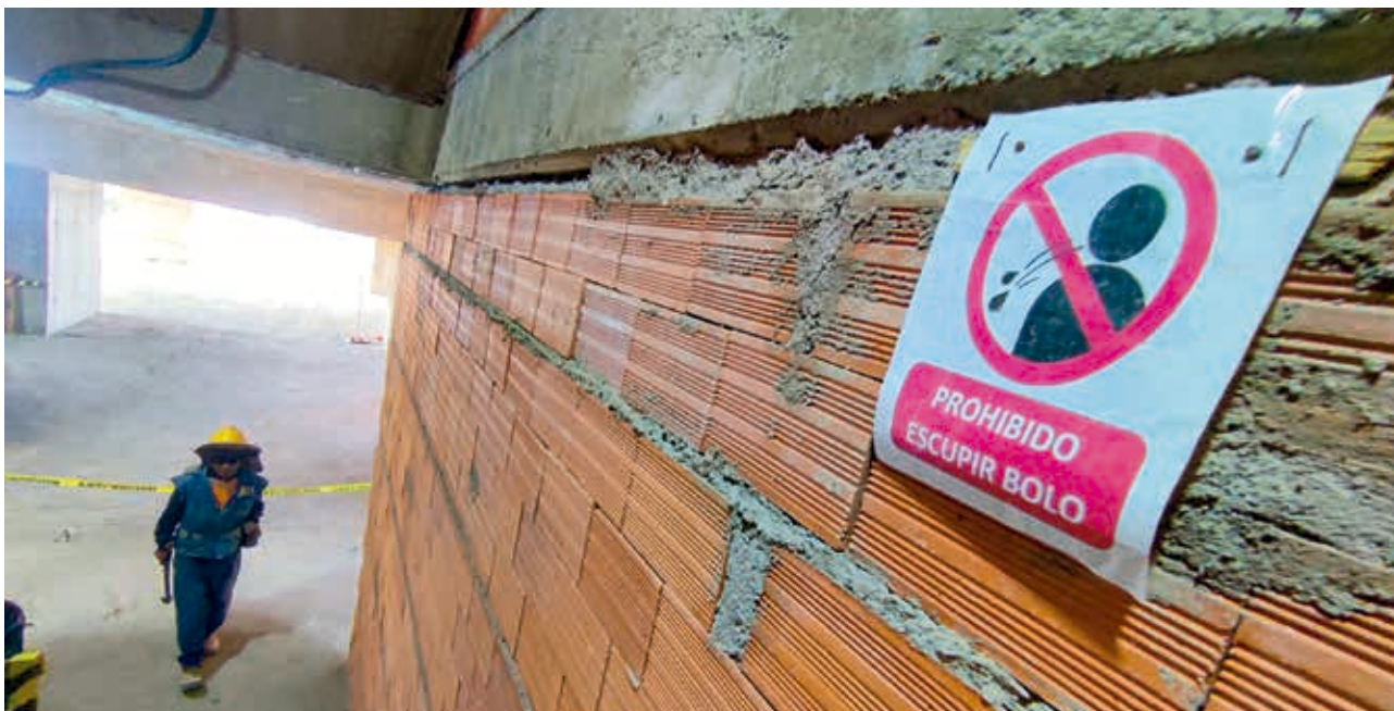
PROHIBICIONES INTERESANTES. Este cartelito en el edificio municipal en construcción (el que sufrió el colapso el sábado pasado), en la plaza Colón, presenta una interesante restricción: se prohíbe escupir bolo (de coca, entendemos). ¿Cuál habrá sido el efecto en la obra para tener que prohibirlo?

ENVÍE SU FOTO PARA PUBLICARLA EN ESTA SECCIÓN A: fotografia@lostiempos-bolivia.com