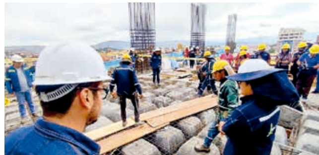
La inspección técnica al edificio.