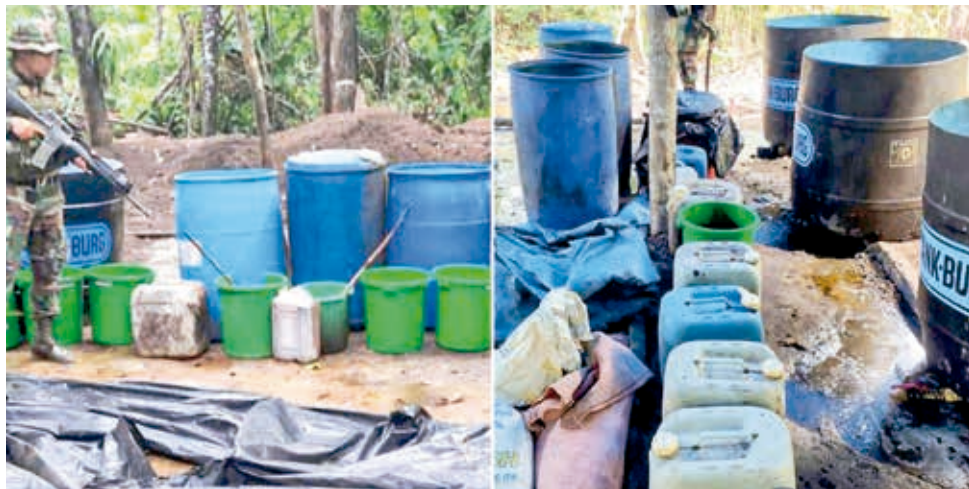
Los precursores que se incautaron el lunes en Bulo Bulo. FELCN

El 30 de enero la Policía hizo un operativo en una pista clandestina donde secuestraron 40 AVGAS, además de una avioneta.