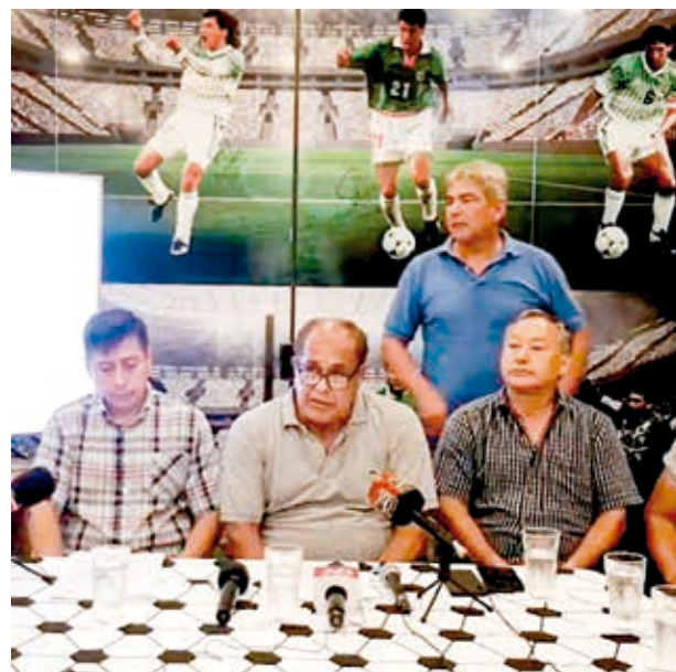
Conferencia de prensa de Fabol, ayer. FABOL

Fútbol. A pedido de Fabol, la FIFPro envió una nota a la FIFA en la que solicitó tratar las demandas de los jugadores nacionales