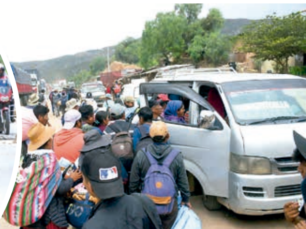
Bloqueadores se retiran a sus localidades, ayer.