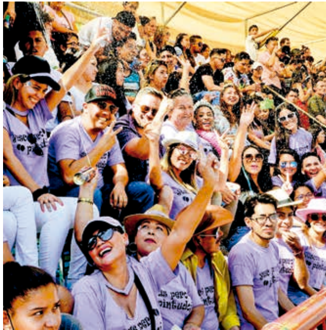
Actividades del Carnaval en Cochabamba.

El presidente de la Cámara Hotelera de Cochabamba, Tito Navia, explicó que varios