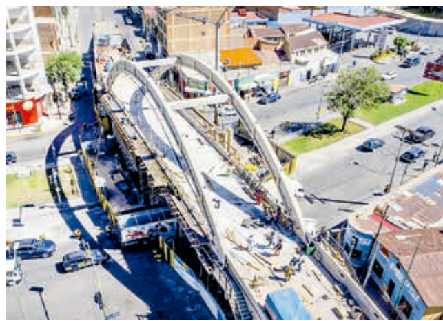
La reposición del puente caído en la 6 de Agosto.

La pasada semana se instalaron pendolones que sujetan