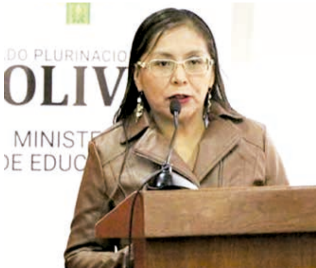
La viceministra Educación Alternativa y Especial, Viviana Mamani.

La comunidad educativa debe aplicar el “Protocolo de bioseguridad para la prevención de infecciones respiratorias agudas en el Sistema Educativo Plurinacional”, que establece el uso obligatorio de barbijos, la desinfección continua de manos, distanciamiento social, manejo de las infecciones respiratorias y las fórmulas de desinfección para infraestructuras, entre otras medidas, informó