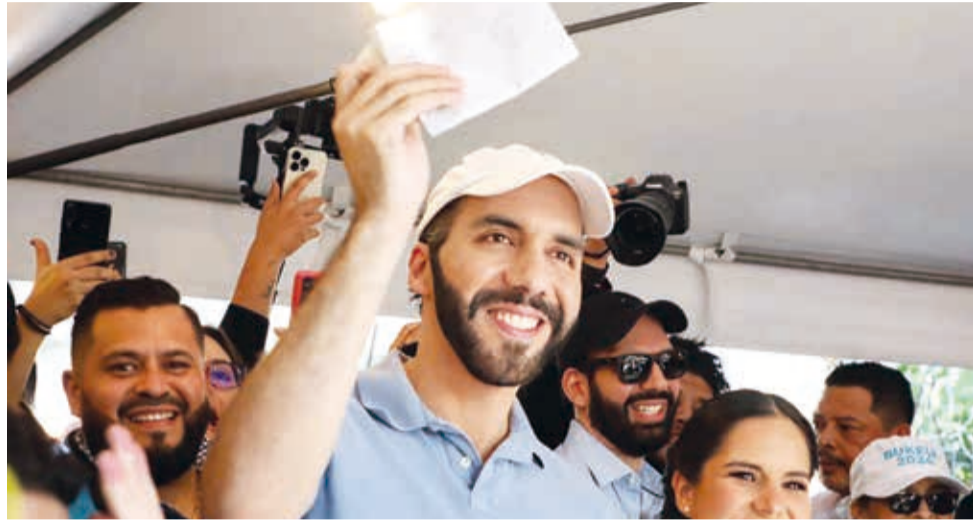
Nayib Bukele, reelecto presidente de El Salvador.

"La Secretaría de Relaciones Exteriores de México felicita al presidente Nayib Bukele por su victoria en las elecciones presidenciales de El Salvador", señaló la Cancillería mexicana.