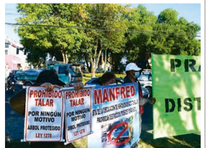
Una protesta contra el distribuidor.