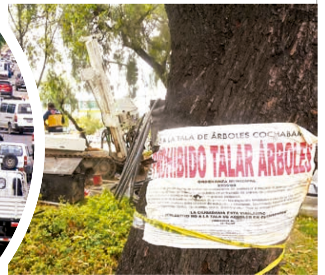
Árboles con letreros de protección.