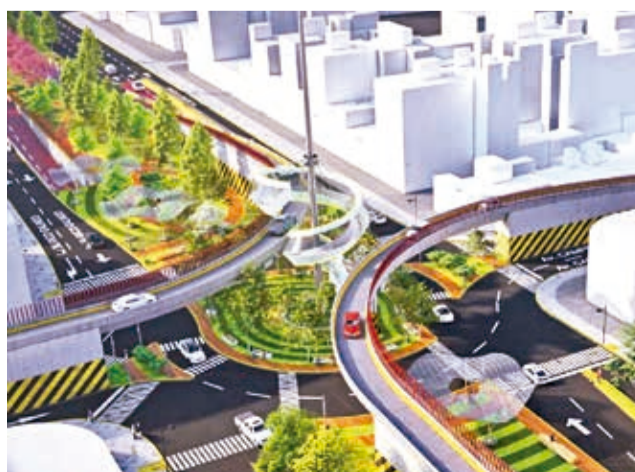
El proyecto del puente que presentó la Alcaldía.