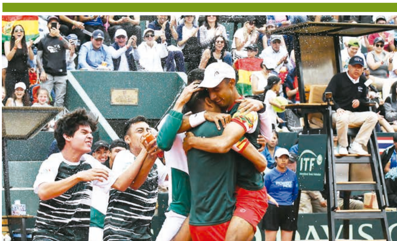
Integrantes del Equipo Bolivia festejan la victoria sobre Tailandia, ayer. APG