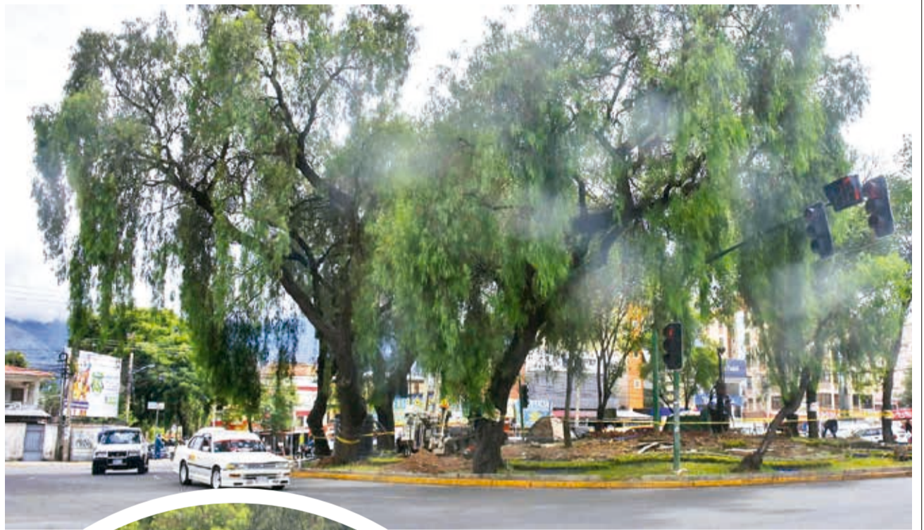
Los estudios de suelo que se realizan en la avenida Blanco Galindo y Perú para el nuevo distribuidor vehicular.