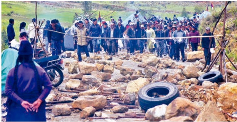
Vigilia de sectores evistas en la carretera antigua a Santa Cruz.

El senador del MAS "evista" Leonardo Loza fue increpado en el aeropuerto de Cochabamba por una ciudadana que le dijo "qué bonito es viajar en avión perjudicando al resto, ¿no?, bloqueando".