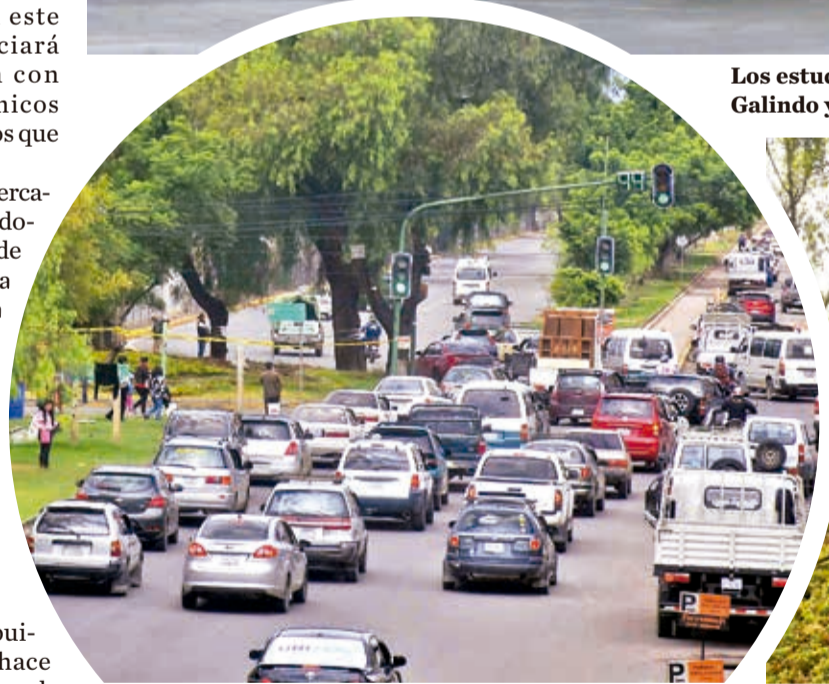
El tráfico vehicular en la rotonda de la Perú.