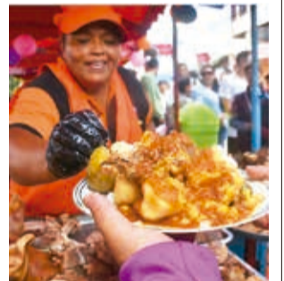
La ciudadanía disfruta de la Feria del Puchero. J. ROCHA

“Se han comercializado cerca de 30 mil platos de puchero. Se calcula que