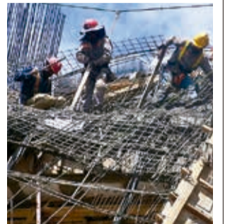
Colapso del encofrado del edificio municipal. JOSÉ ROCHA

“Se va a realizar una evaluación topográfica de toda la estructura. Este informe debe ser entregado hasta el martes como máximo y luego se va a brindar un informe técnico de lo sucedido”, señaló el secretario de