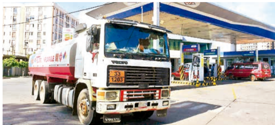
Una cisterna distribuye combustible a un surtidor. CARLOS LÓPEZ

Arze indicó que el cultivo de plantas como la palma africana o la jatropha implicaría una expansión de la frontera agrícola, generando mayor costo ambiental y social. Añadió que, si bien se puede utilizar la soya, habría que tener en cuenta el precio.