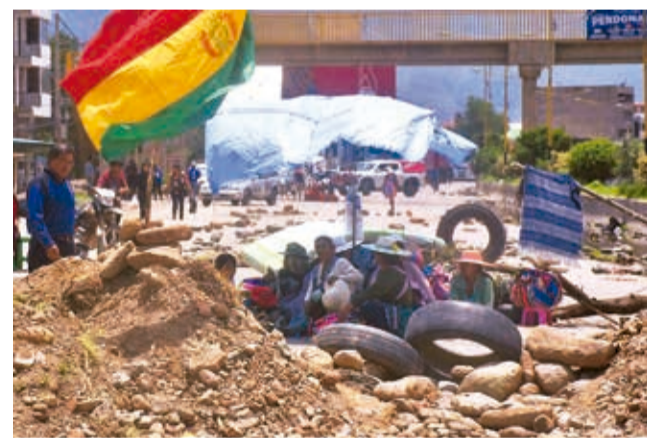
Bloqueo en el puente Khora, de Vinto. JOSÉ ROCHA

El secretario de hacienda de la Federación Carrasco,