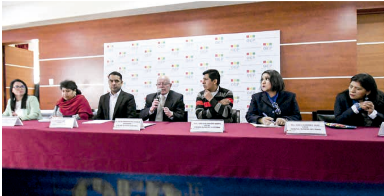
Desde septiembre, el Tribunal Supremo Electoral (TSE) trabajará con los datos del Censo para distribución de escaños.