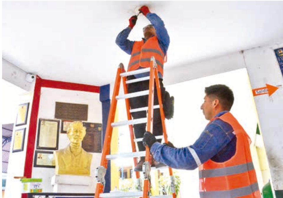
Realizan trabajos de refacción en una Unidad Educativa.