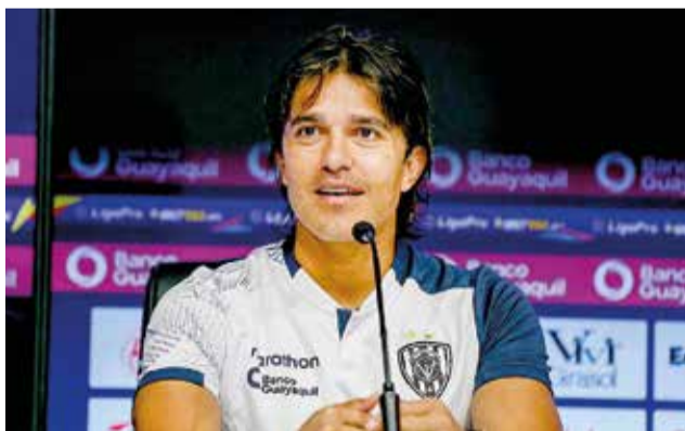
El atacante boliviano Marcelo Martins.

Entrevistado por Tigo Sports, Martins no se guardó nada y al ser consultado sobre