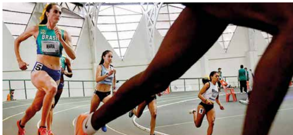
La atletas tuvieron amplio despliegue en la pista atlética.

Jannik Sinner hace historia al ganar el Abierto de Australia