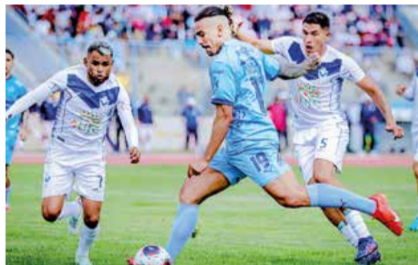
Amistoso que protagonizaron GV San José y Bolívar.