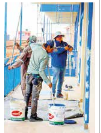
Los trabajos de limpieza en las escuelas ayer. GAMS

Comentó que a lo largo del año se realiza un mantenimiento rutinario de las infraestructuras educativas en el que se hace la limpieza de los ambientes, el retiro de la maleza, el pintado y algunos arreglos con plomería.