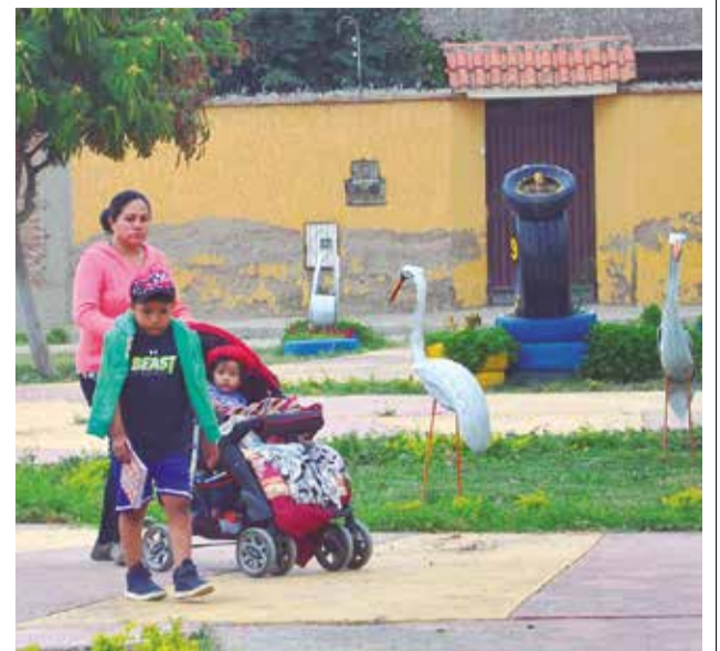
Familias disfrutaban de paseos en área verde recuperada.