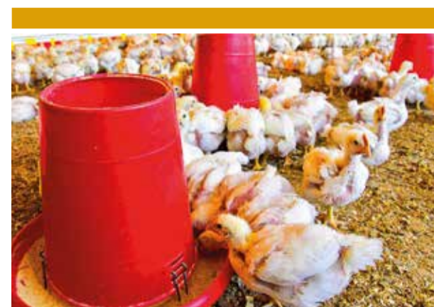
Granjas avícolas en Santa Cruz. APG

YPFB también informó que más de un centenar de carros cisterna varados en las carreteras.