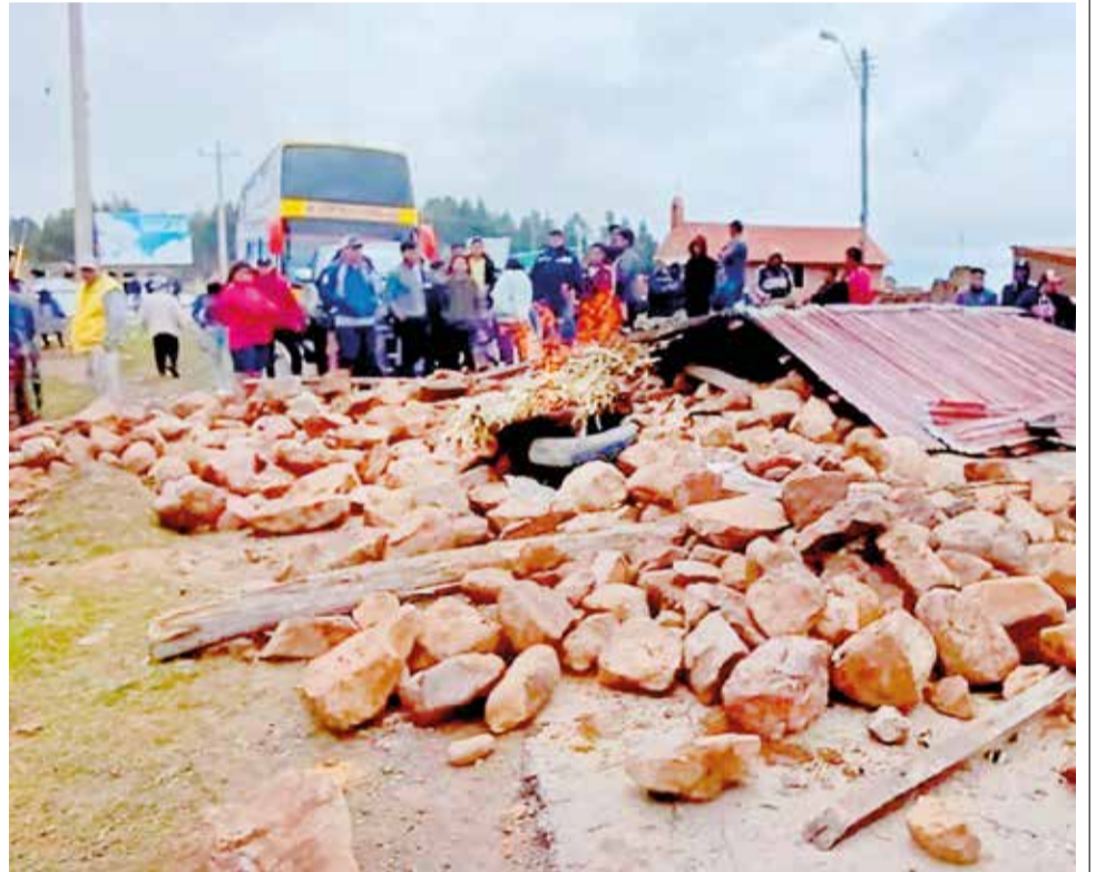
Bloqueos en la carretera al oriente de Cochabamba.

En este sentido, el dirigente cívico conminó al Ministerio Público y a la Policía a cumplir con sus labores y actuar conforme a ley, garantizando la libre transitabilidad en las carreteras del país.