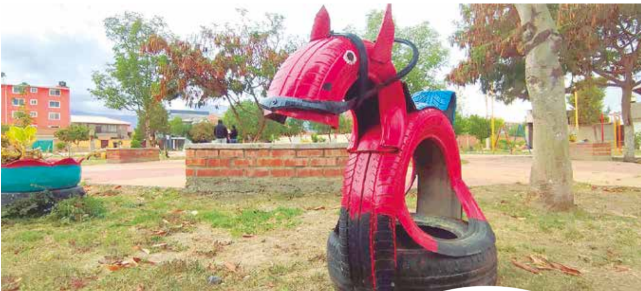
Algunos juegos en el parque de la OTB Comercio.