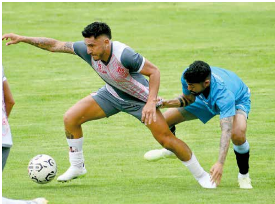
Una escena del partido que disputaron Aurora y Universitario en el complejo de Alalay. CARLOS LÓPEZ

En la vereda del frente, la expectativa estaba centrada en el debut de otro colombiano, Tommy Tobar, refuerzo