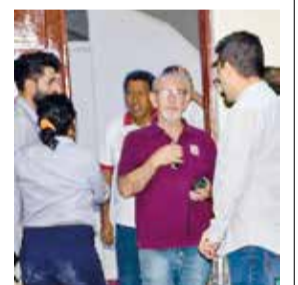
La Conmebol visita el estadio IV Centenario.

La Conmebol inspecciona el estadio IV Centenario