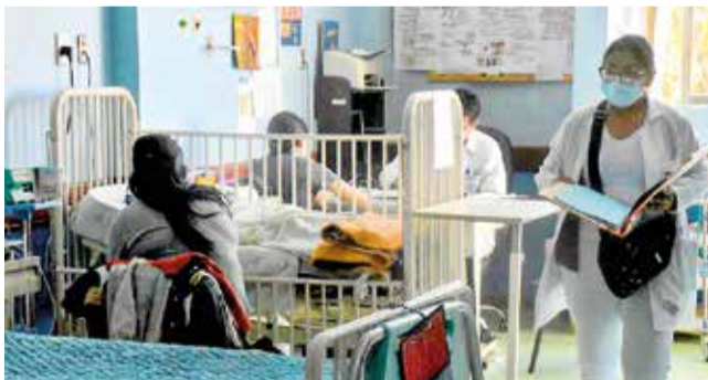
Una sala de internación del hospital del niño. J. ROCHA

Avance. La administración del nosocomio implementa un nuevo modelo centrado en las necesidades de los pacientes para evitar filas.