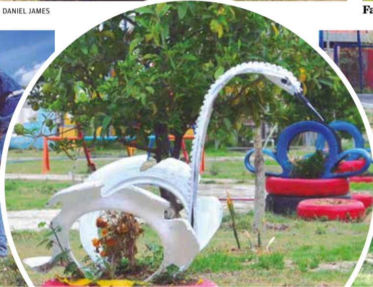
Las artesanías hechas con neumáticos por vecinos.