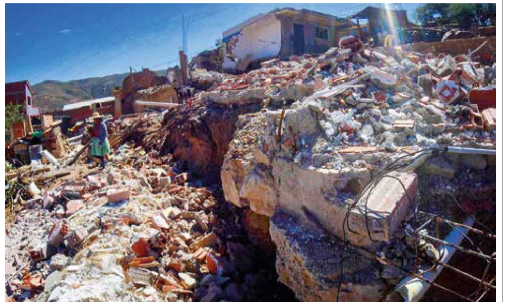
Las viviendas que colapsaron en la OTB Libertad por los deslizamientos.