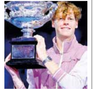
El tenista italiano Jannik Sinner.

Jannik Sinner hace historia al ganar el Abierto de Australia