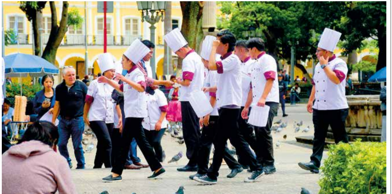
PASEO. Un grupo de estudiantes de gastronomía perfectamente uniformados de paseo por el centro de la ciudad concitó la atención de los transeúntes.

ENVÍE SU FOTO PARA PUBLICARLA EN ESTA SECCIÓN A: fotografia@lostiempos-bolivia.com