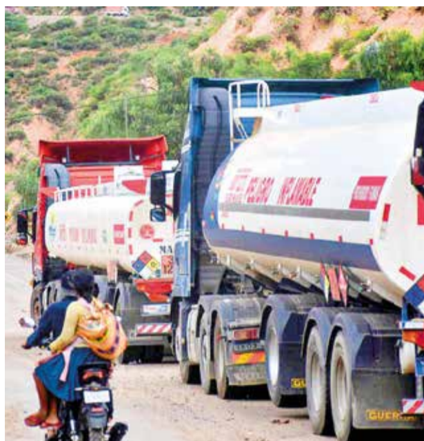
Carros cisterna en las carreteras. APG

“Va a haber un perjuicio en el mercado nacional, puesto