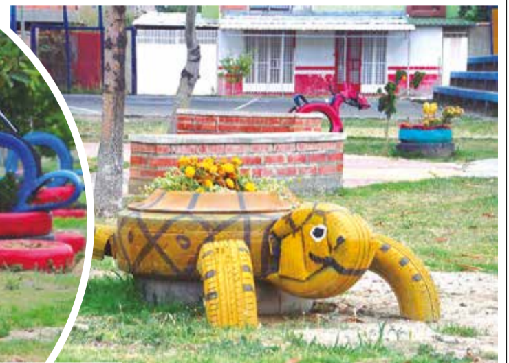
Una tortuga de llantas decora el parque.