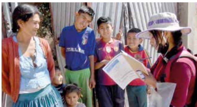
Censistas voluntarios en la prueba de campo del censo, en Capinota, en julio de 2023.

La década de 1980 fue un periodo desafiante para Boli-