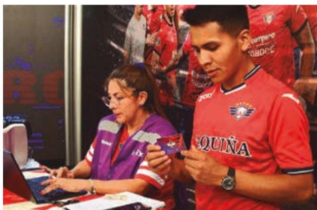
Un hincha recibe su abono en el Día del Rojo.