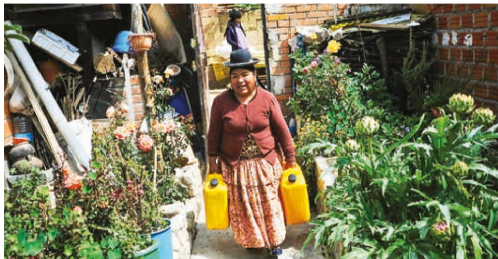
La ingeniera con la materia prima para su negocio. CARLOS SÁNCHEZ

Al ver los desperdicios de aceites quemados (afirma que no se deberían utilizar más de tres veces, ya que después se vuelven tóxicos), se le ocurrió que podría aprovechar residuos más limpios. Lo primero que hizo fue lavavajillas en su cocina, cuando vivía en otro lado y no disponía de un laboratorio.