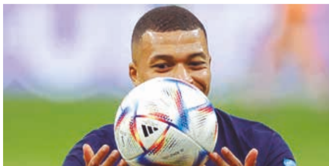
La celebración de Mbappé, ayer.

Fútbol. Con un doblete de Kylian Mbappé, el cuadro parisino avanzó en el torneo.