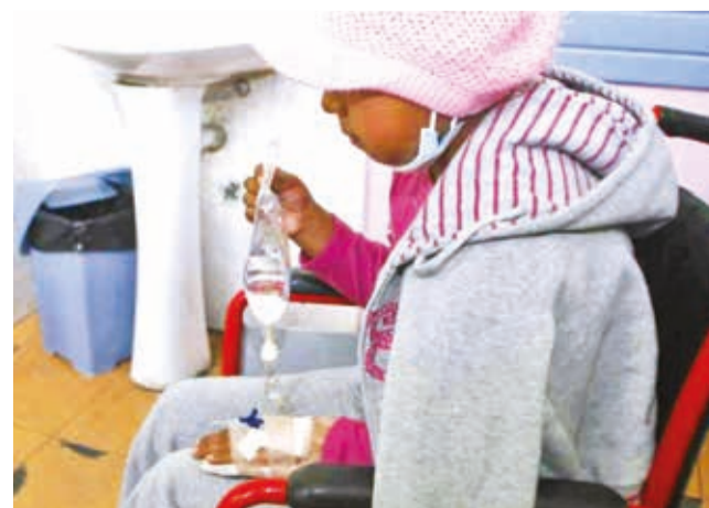
Fotografía ilustrativa de un niño con hepatitis A.

Copana señaló que la frecuencia de estos decesos es considerada “inusual” por los expertos, ya que la estadística indica que sólo 0,1 por ciento