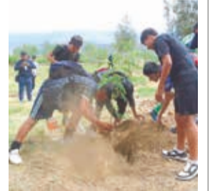
La campaña de forestación, ayer. C. LÓPEZ