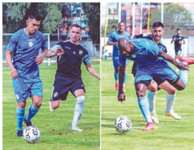
Una incidencia del partido entre Aurora y Nacional. PA

Las gestiones realizadas permitirán que el Celeste ace-