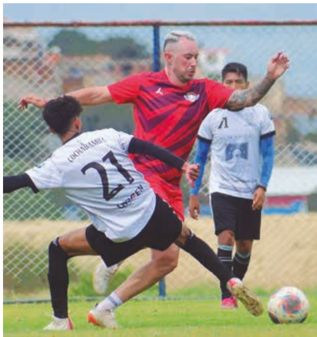
El partido amistoso entre Wilstermann y el seleccionado valluno.

Los jugadores expresaron su satisfacción por comenzar a "tomar ritmo", pero también con la intención de engranar con sus compañeros.