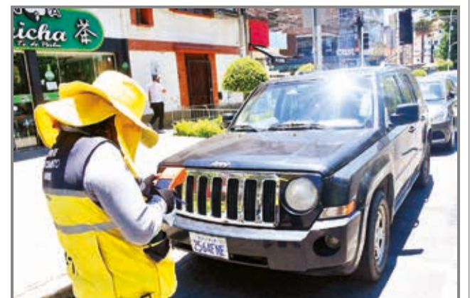
El cobro del parqueo tarifado en El Prado. CARLOS LÓPEZ