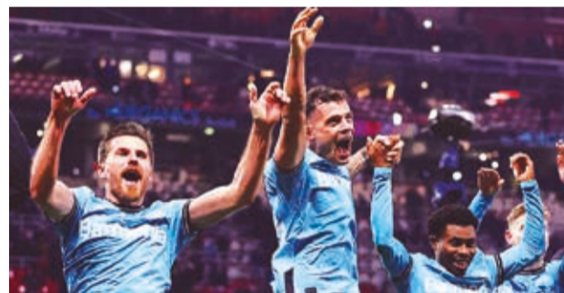
El festejo del Bayern Leverkusen.

Horas antes de ese último partido del día, el Nantes, de la Ligue 1 y vigente subcampeón de la Copa de Francia, cayó eliminado en dieciseisavos de final de la competición del KO ante el Laval (1-0), de la Ligue 2, en el estadio de La Beaujoire.