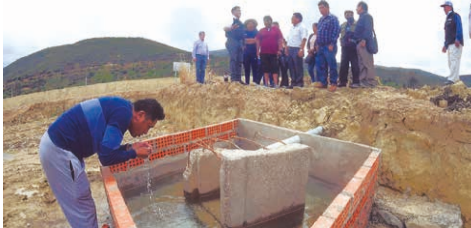
La inspección de vecinos del sur a los ingresos de agua en la laguna Alalay. CARLOS LÓPEZ

Escanee este QR para ver la inspección de los vecinos www.lostiempos.com