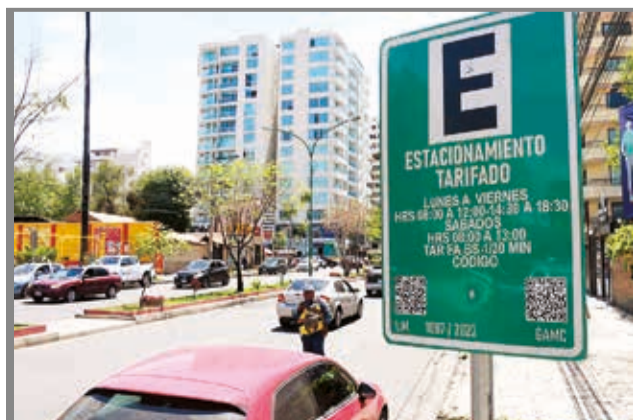
El parqueo tarifado en la avenida América. CARLOS LÓPEZ