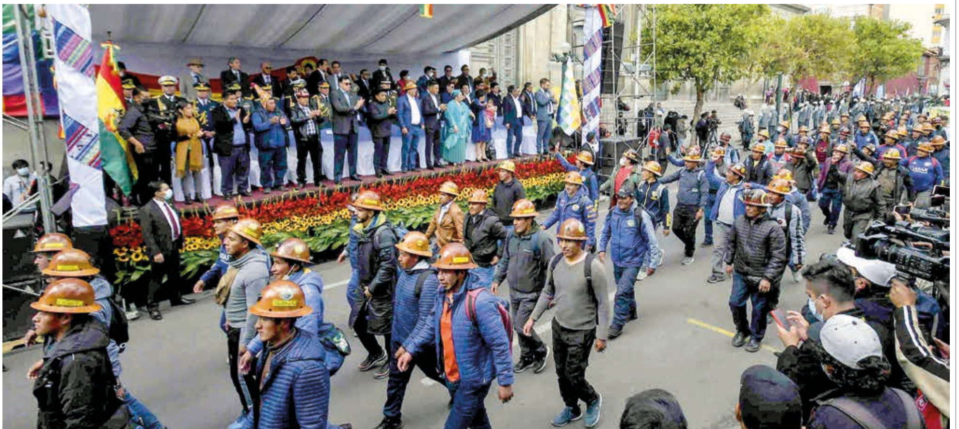
Desfile por aniversario del Estado Plurinacional en La Paz, en enero de 2023.