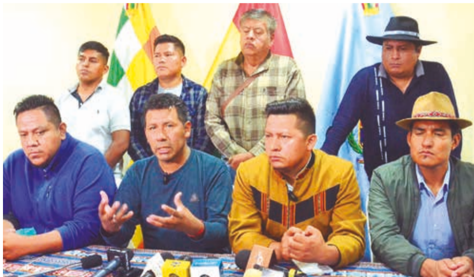
Dirigentes de Pacto de Unidad “evista” en rueda de prensa en Cochabamba.