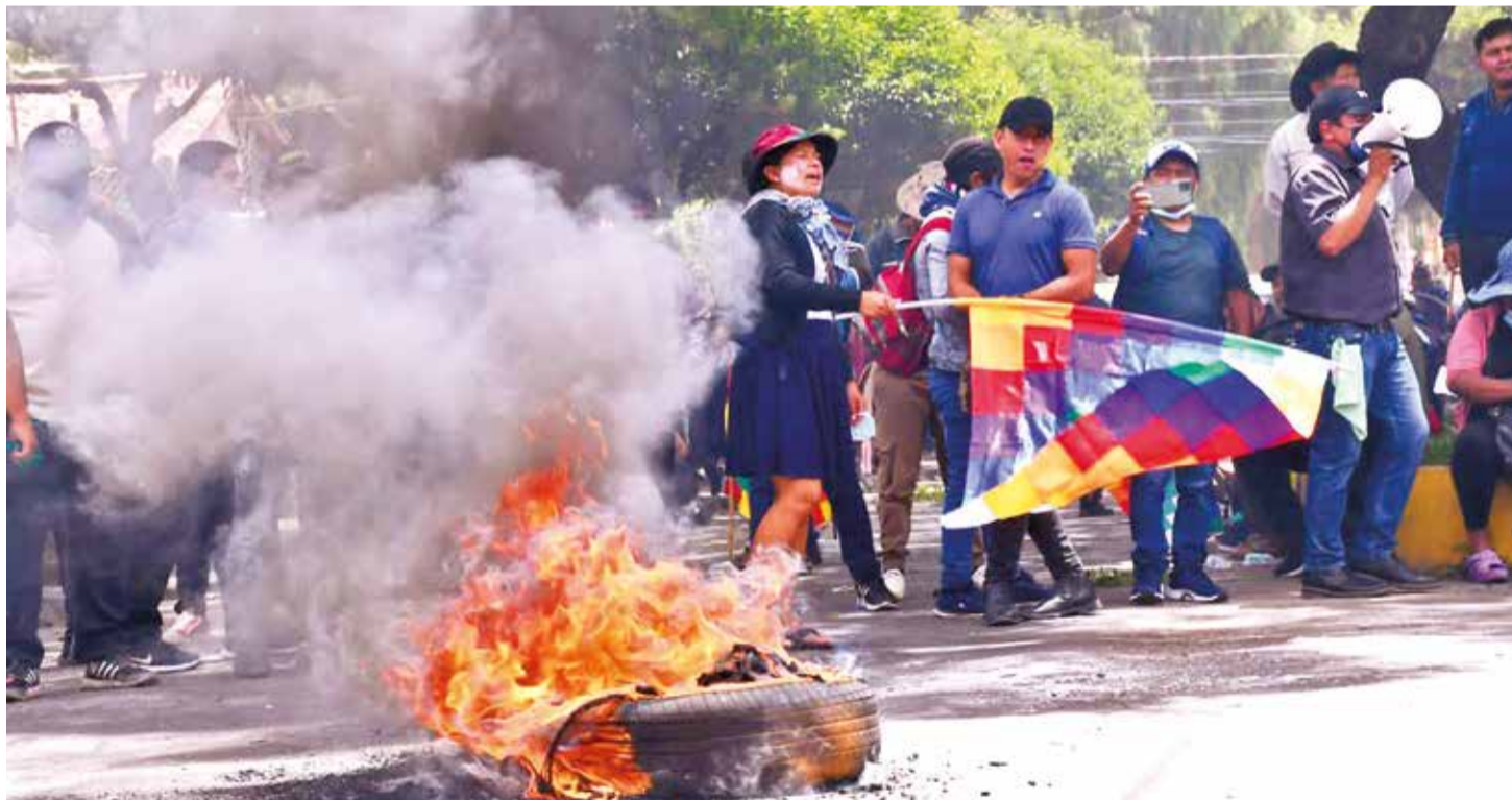
Seguidores de Evo Morales realizan actos de protesta frente a la sede del Tribunal Constitucional, ayer en Sucre.

Conflicto. Protestan contra la prórroga de magistrados judiciales, a quienes dieron 24 horas para que renuncien. El Gobierno los acusa de buscar desestabilizar el país. Pág. 5