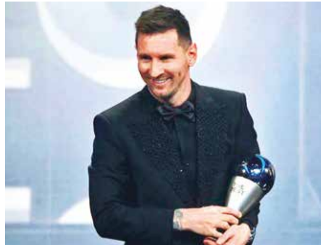
Lionel Messi, en la entrega del premio de la versión 2022. No estuvo en el acto de ayer.

En octubre, Messi recibió en París su octavo Balón de Oro, en reconocimiento principalmente al Mundial que conquistó en diciembre de 2022 con Argentina, la