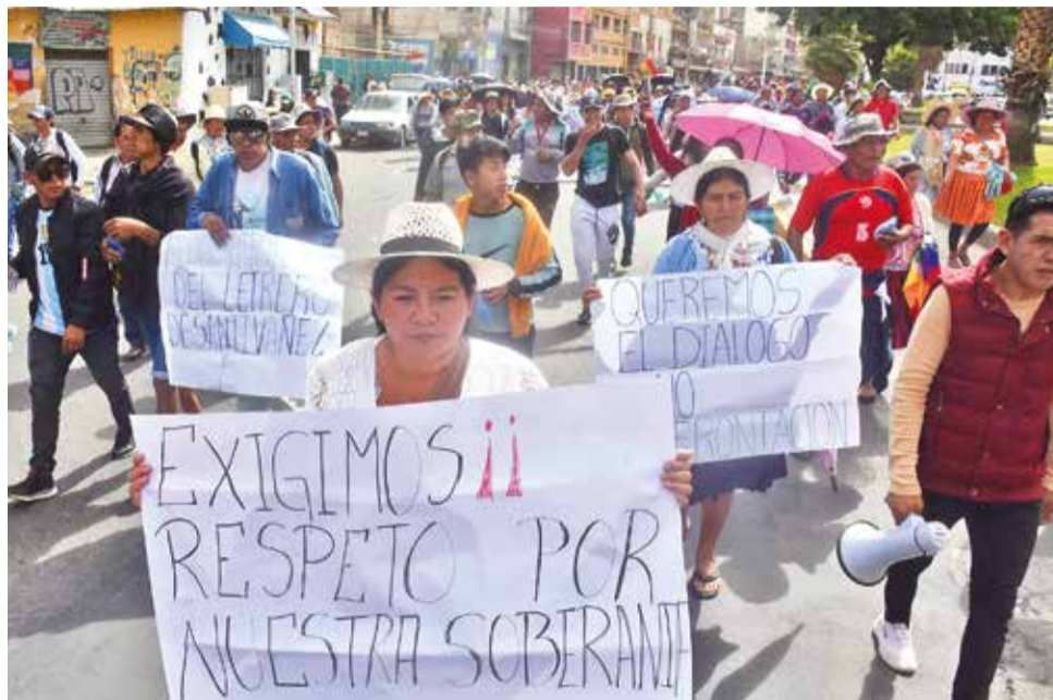
Pobladores de Santiváñez marchan ayer exigiendo respeto a sus límites.

“Lo rescatable es que existe predisposición de ambas partes para conciliar, así que esperamos que avancen estas mesas técnicas”, remarcó. Santiváñez avanzó en varios procesos de conciliación. Cocapata, Shinahota y Raqaypampa ya tienen sus límites definidos, según antecedentes del tema.