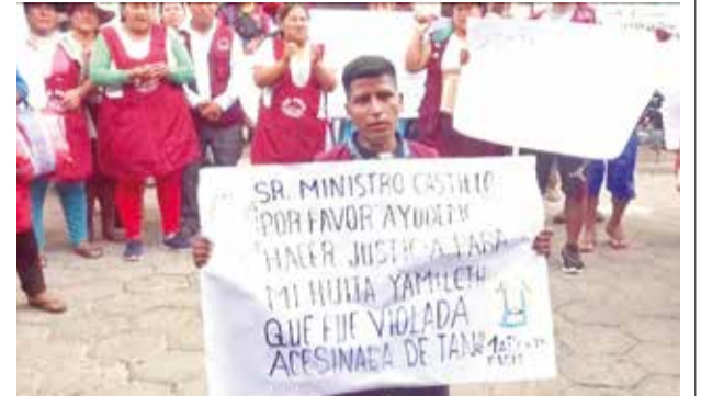
La marcha de padres exigen justicia, ayer en Santa Cruz.