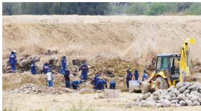
La instalación de tuberías en la laguna Alalay. CARLOS LÓPEZ

Canal. La laguna Alalay recibe el agua de las escorrentías de las lluvias, pero se prevé que para fin de mes ingrese de otras fuentes más.