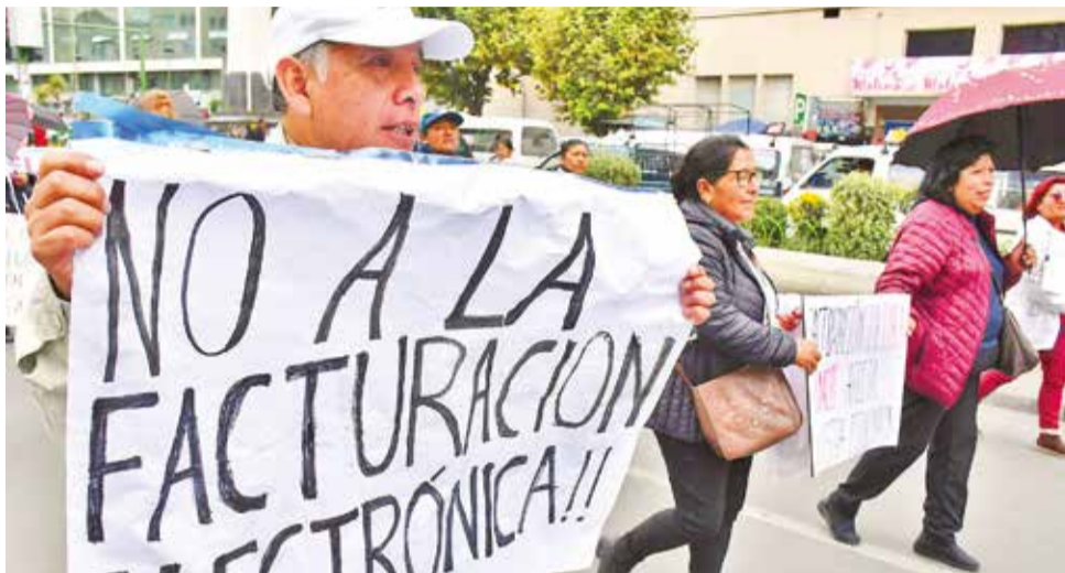
La movilización del sector gremial en el centro de La Paz.

Asimismo, se presupuestó elevar los ingresos por venta de bienes y servicios de las administraciones públicas en 11,9 por ciento, de 3.909 millones de bolivianos a 4.373 millones.