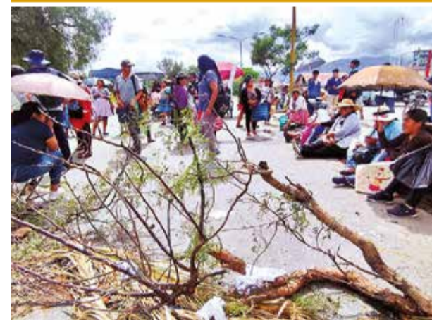
El bloqueo de la av. Blanco Galindo ayer. DANIEL JAMES

Reyes Villa añadió que este martes se reunirá con la Gobernación para abordar el tema de la zanja de coronación que fue un compromiso del Ejecutivo departamental para coadyuvar a la recuperación de la laguna.