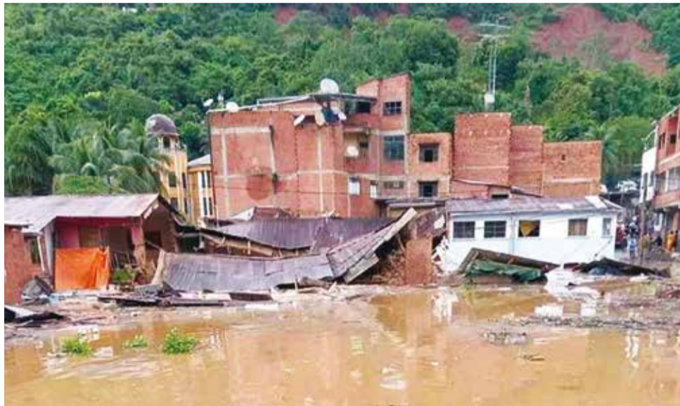
Lluvias anegan al municipio de Tipuani, tras el desborde de un río.

Defensa Civil movilizó a Tipuani a 31 efectivos militares del Comando Conjunto de Respuesta a Eventos Adversos, de los cuales 11 son el Batallón de Ingeniería Román del municipio de Caranavi, cinco de la Base Naval Ballivián asentado en Rurrenabaque y 15 rescatistas del Servicio de Búsqueda y Rescate de la Armada Boliviana (Sbrab). La segunda medida asumida es la movilización de ayuda humanitaria en alimentos y vituallas, colchones, frazadas, carpas, herramientas entre otros necesarios para atender a 200 familias damnificadas.