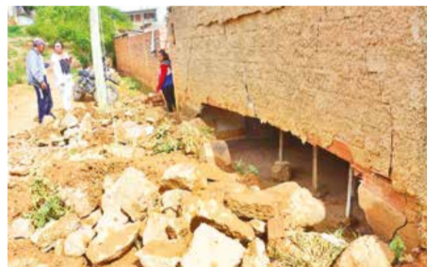
Una viviendas afectadas en Primero de Mayo. HERNÁN ANDIA

Indicó que existe una coordinación con la Alcaldía de Cercado para ampliar la ruta hasta Primero de Mayo y Pucarita Chica.