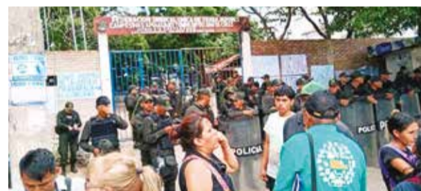
Arcistas desalojan la sede campesina cruceña.

El expresidente enfatiza que la acción de los magistrados representa un "evidente conflicto de intereses.