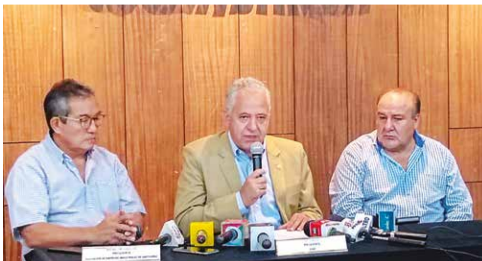
El presidente de la FEPC (centro) y ejecutivos del Parque Industrial Santiváñez.