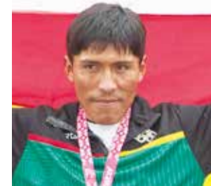
El fondista Héctor Garibay.

nes enviaron mensajes de aliento al atleta para que pueda superar este momento de dolor.