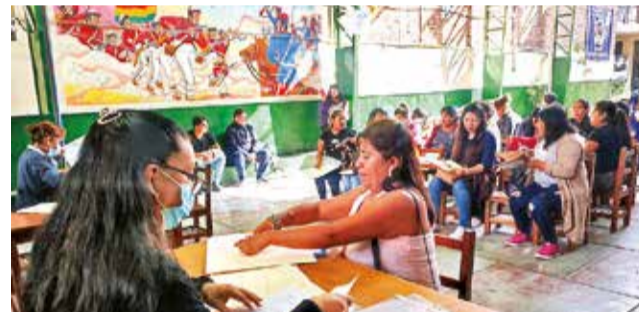
Inscripciones en un colegio de Cochabamba, ayer.

cobros irregulares, el subdirector reiteró que están prohibidos y que desplazó técnicos para realizar inspecciones que permitan recopilar datos y emitir sanciones.