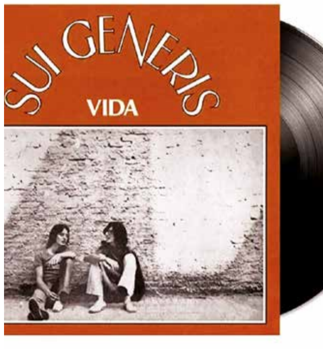
Clásico. Nito Mestre y Charly García en la portada del disco "Vida".