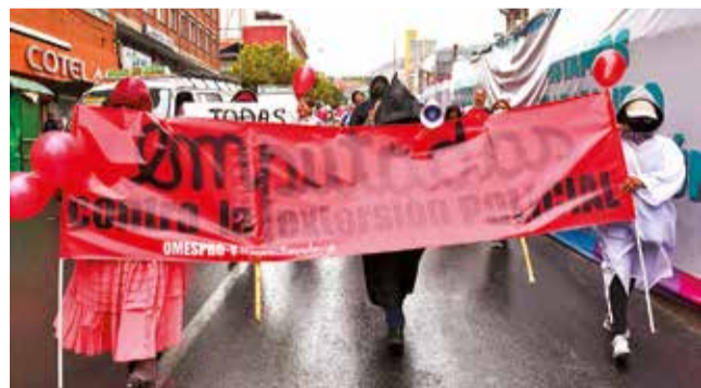
La marcha de trabajadoras sexuales, ayer en La Paz.

Protesta. La activista denunció que algunos policías extorsionan a las trabajadoras sexuales constantemente