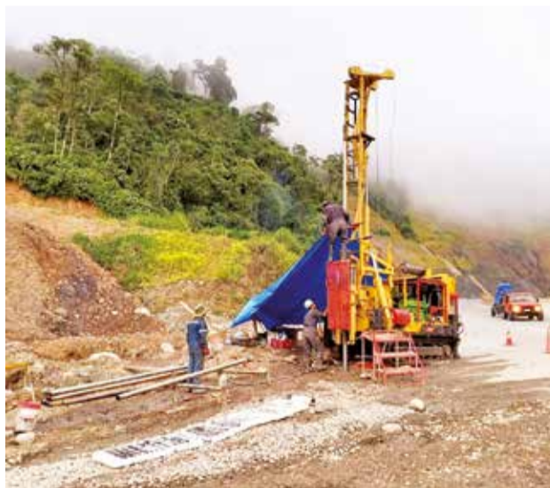
Limpieza en el tramo de El Sillar.