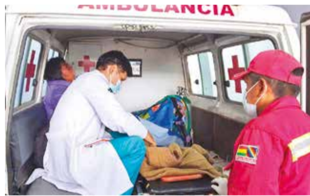
Las víctimas auxiliadas por Bomberos, el domingo.

Las manifestantes, al llegar hasta las instalaciones del Ministerio de Gobierno, grafitearon mensajes, como: “La gordura policial no se resuelve con zumba”, “Basta de extorsión policial” y “Que la policía persiga violadores y feminicidas, no trabajadoras sexuales”.