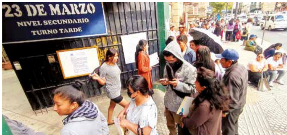
La fila para inscribir a nuevos estudiantes en el colegio 23 de Marzo ayer.

En caso de contar con más espacios, Rocha indicó que el procedimiento para asignar los cupos restantes es priorizar a hermanos de estudiantes ya inscritos, hijos de traba-