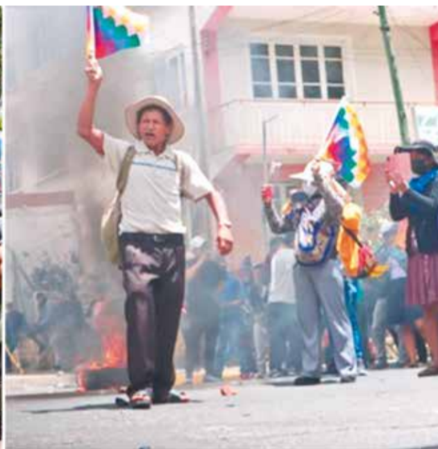
Sectores evistas que protestan contra la prórroga de los magistrados se enfrentan con policías, ayer en Sucre.