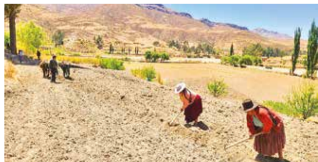
Trabajos en campos para sembrar. INSA

Reporte. El INSA reportó 588 mil hectáreas aseguradas y 345 mil productores afectados por los eventos climáticos.