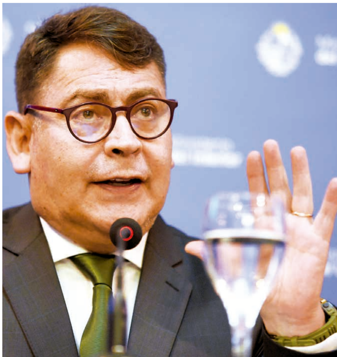
El viceministro de Régimen Interior y Policía, Jhonny Aguilera.

Violencia. Decenas de policías fueron enviadas al trópico de Cochabamba después del caso del hombre acribillado el pasado jueves