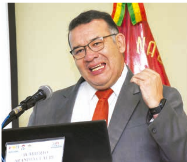
El director del INE, Humberto Arandía.

“Muchos analistas buscan generar desestabilización en el país, diciendo que no tenemos los recursos, los materia-