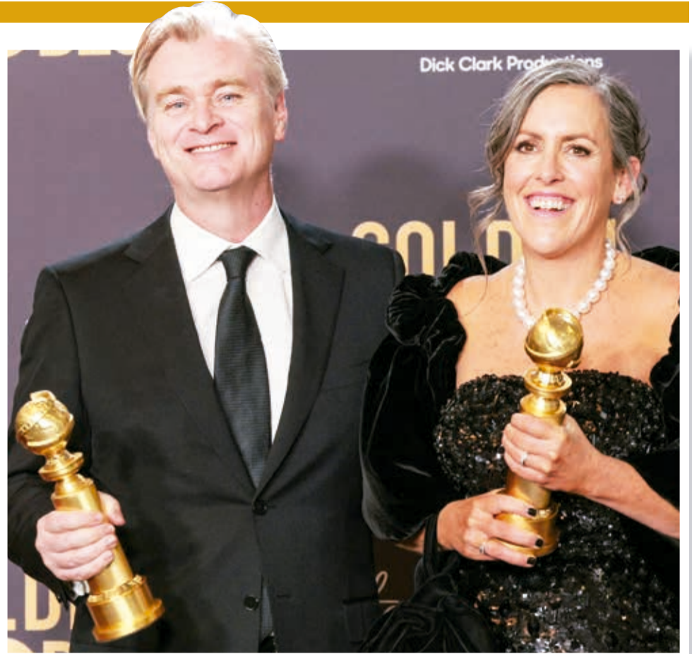
Ganadores. Christopher Nolan y su esposa con las estatuillas.

Paul Giamatti (The Holdovers, “Los que se quedan”)