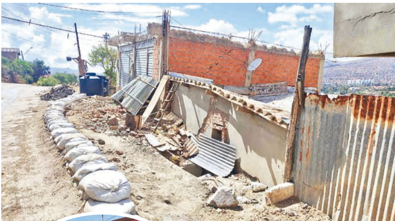
Las casas afectadas por los hundimientos en la OTB 14 de Abril al sur de la ciudad.

Aseguró que en este lugar no puede haber ninguna intervención hasta que existe un estudio de suelo que revele las zonas rojas. La Alcaldía de Cercado prevé realizarlo esta gestión.