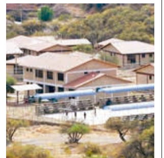
El centro de Playa Ancha. CARLOS LÓPEZ

“La ley le da un sustento legal en la atención a personas en situación de calle y consumo mayores de 18 años. Estaleynos va permitir regularizar el ingreso de