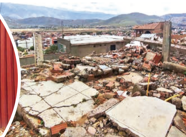
Las viviendas que se desplomaron en Alto Cochabamba.