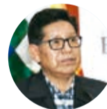
Edgar Pary, ministro de Educación