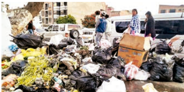
La acumulación de basura en vías de Quillacollo.

Conflictos. Los trabajadores exigen que se cumpla un laudo, mientras tanto queda pendiente la renovación de un comodato.