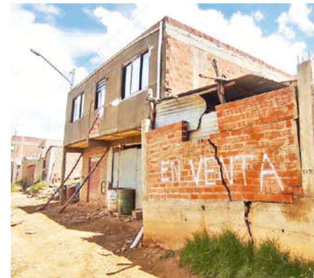
Las casas afectadas en la zona Libertad.