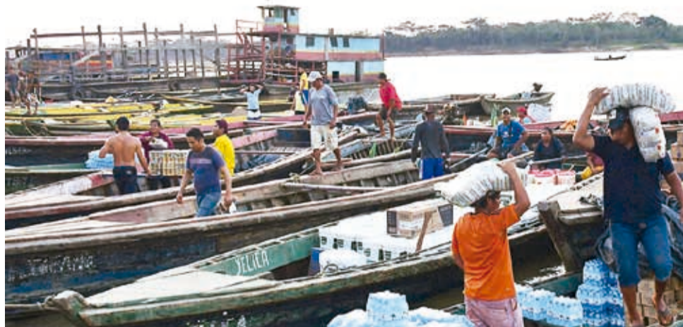
Productos que cruzan la frontera con Argentina. CARLOS LÓPEZ

Recordó que un contingente de la Fuerza de Tarea Conjunta (FTC) sufrió agresiones por parte de la población y el sindicato de transportes