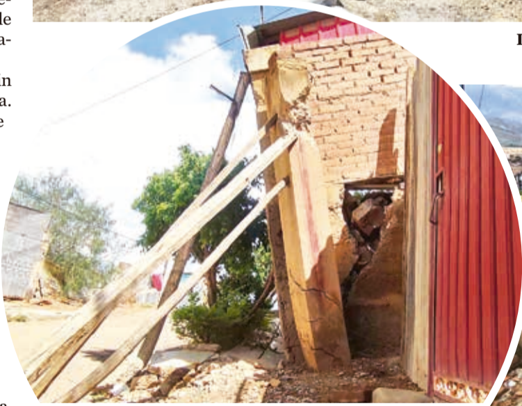
Apuntalan los muros con bolillos para evitar el colapso.