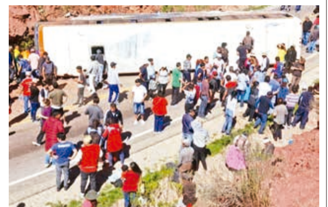
El accidente del bus de la empresa Coral SRL. POLICÍA

De acuerdo con las primeras investigaciones, el bus se chocó contra una peña, se arrastró 150 metros. El accidente sucedió en el kilómetro 100 de la carretera Cochabamba-Oruro.