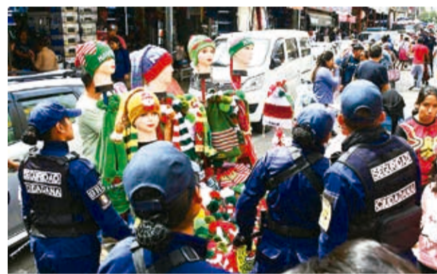
Guardias municipales realizan controles.