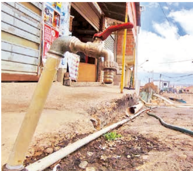
Cuatro familias comparten una pileta en El Mirador.