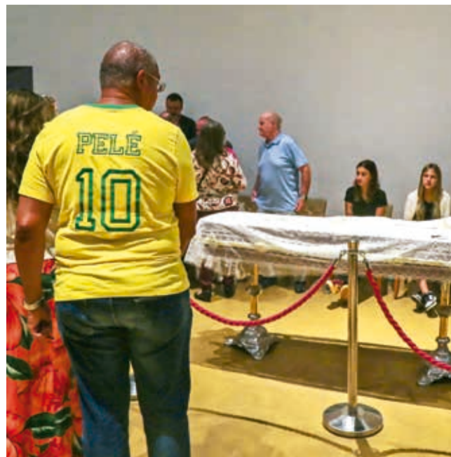
Funeral de Mário “Lobo” Zagallo. SPORT.

El velatorio fue en la sede de la Confederación Brasileña de Fútbol (CBF), cuya fachada lucía un cartel en el que se leía “Zagallo Eterno”, una frase con “13 letras”, el número preferido del “Viejo Lobo”, quien admitía ser supersticioso como pocos.