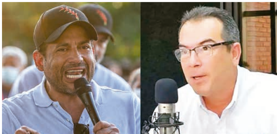
Luis Fernando Camacho y Mario Aguilera.

El expresidente Evo Morales aseveró que el Gobierno hizo un acuerdo con el vicegobernador Mario Aguilera, para que se quede con la Gobernación de Santa Cruz. La ministra de la Presidencia, María Nela Prada, respondió que Morales "sintoniza con la derecha" y que el expresidente desconoce los pormenores del conflicto, por lo que "le falta criterio" para hablar del caso.