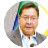
Luis Arce, presidente de Bolivia.