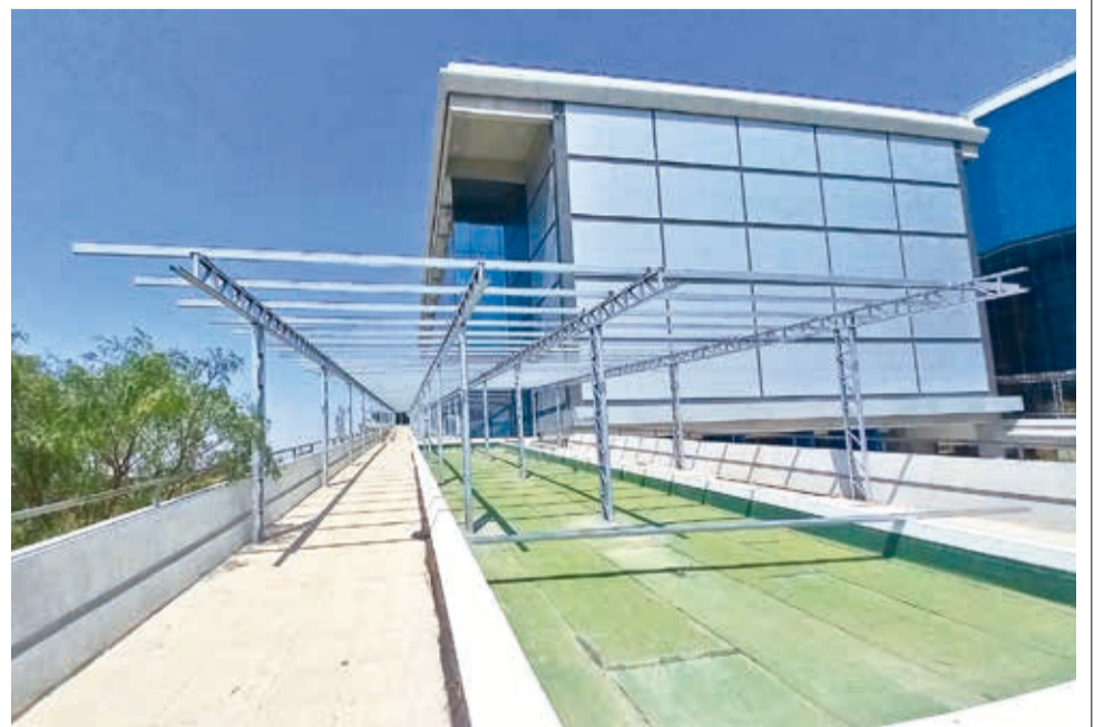
Las instalaciones refaccionadas del Parlamento Suramericano en San Benito.

Plata precisó que el Gobierno nacional destinó 1, 8