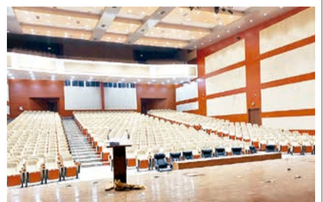
La EBC hizo arreglos en el techo, piso y los muros.

Asimismo, desde la EBC se recomendó realizar refacciones de forma permanente para evitar daños de magnitud.