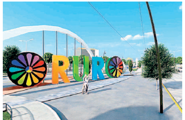
Ley pretende obtener la autorización para la gestión de financiamiento de crédito de la avenida

tidos al Ente Legislativo para su autorización a través de una ley; sin embargo, a finales del año, el CMO solo sancionó la Ley municipal de declaración de prioridad a la ejecución del proyecto construcción de La Avenida del Moreno y no así la Avenida del Diablo debido a que la documentación de este proyecto no alcanzó a ingresar