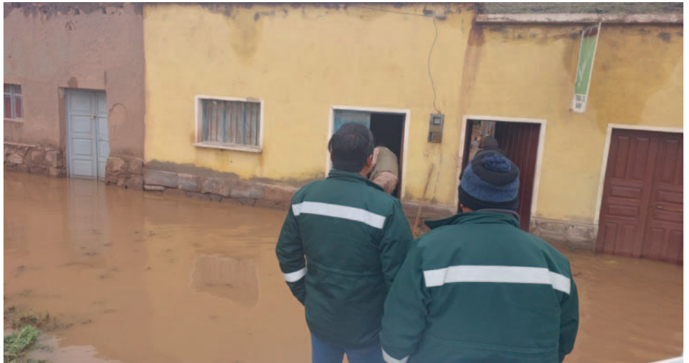
Al menos diez familias se vieron afectadas por intensas lluvias