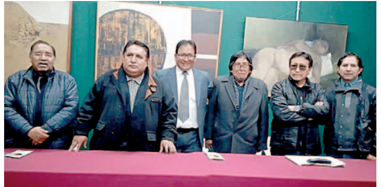
Algunos expositores e invitados durante la inauguración