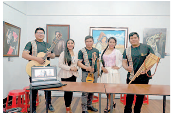
El grupo Kasama y la directora de Proyecto Matices/LA PATRIA

En tres minutos con 48 segundos, la canción narra la historia de un amor fugaz que al principio prometió ser eterno, pero en el videoclip, muestra el imponente zapateo de jiaja que tiene su particularidad de ser de lado a lado y es realizado por integrantes del grupo, pero también se ve el paso del salay