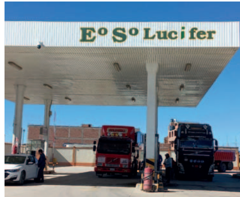
Se pone en marcha el plan de emergencia para garantizar combustible en Oruro

“Tanto la ANH como YPFB están garantizando el abastecimiento en todo el departamento y en menos de 24 horas se va a poder atender este requerimiento a las solicitudes que crucen por nuestra institución. Hay más de tres días de autonomía (en Planta)