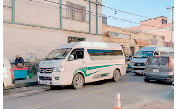
Ratifican vigencia de ordenanza municipal 098/2013

Después de las movilizaciones realizadas el martes contra de las nuevas tarifas aplicadas para el transporte urbano, tras un acuerdo firmado entre autoridades edi-