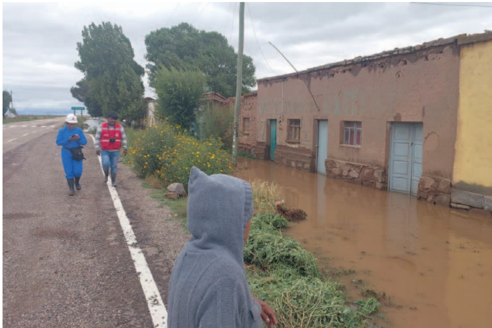
Familias de Sillota Vito de Caracollo afectadas por inundaciones esperan por volver a sus hogares