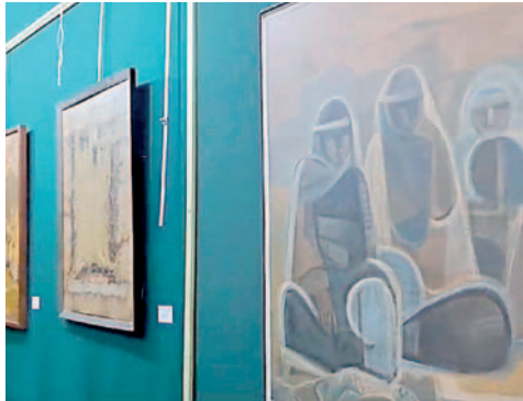
Las obras son expuestas en el salón de Exposiciones Temporales de la Casa Simón I. Patiño

"La UTO es poseedora de más de 300 obras de arte contemporáneo que se obtuvieron vía concurso, adquisición y donación y