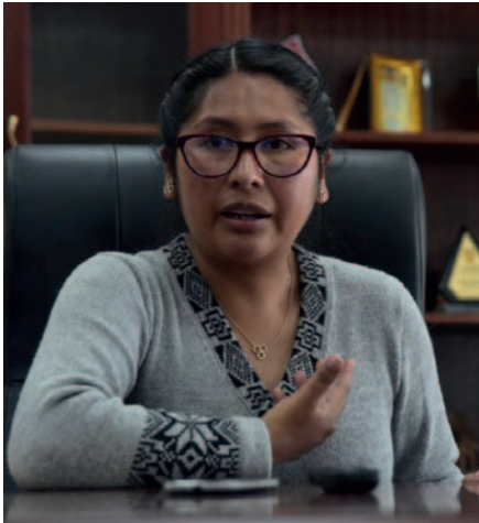
La alcaldesa de El Alto, Eva Copa