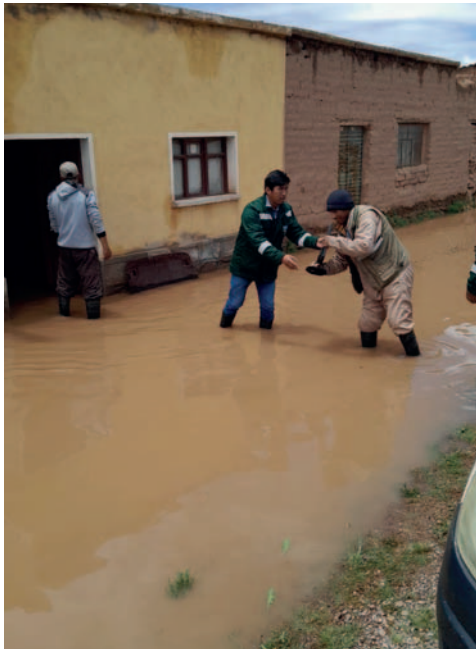
Aún se hace en recuento de daños en Sillota Vito

En los siguientes días se comprometió un informe de cuantificación de daños, entre tanto, las familias del lugar están alertas ante la continuidad de lluvias.