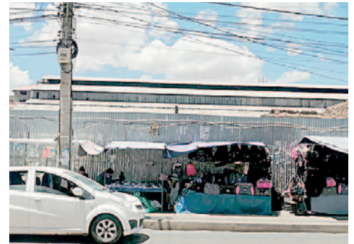
Buscan avanzar en el proyecto de abrir la calle Adolfo Mier entre la Velasco Galvarro y 6 de Agosto

Luego de que el GAMO recuperó los predios don-