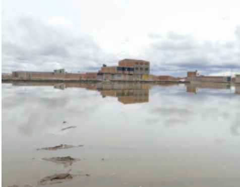
Inundaciones en la urbanización Francisca La Fuente

Según el presidente, la urbanización tributa a la Alcaldía hace ocho años y tiene su planimetría aprobada. A la fecha, se tienen 48 familias afectadas por las inundaciones del sector.