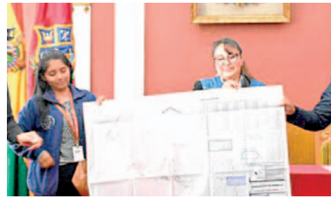
Entrega de planimetrías es una de las estrategias rumbo al Censo

Según la autoridad, junto a los controles sociales, asociaciones comunitarias y juntas vecinales, se realizó la sensibilización en cuanto a la importancia de que los