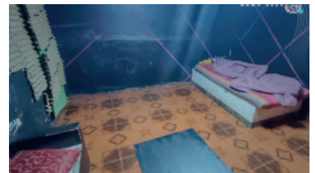
Clausura de casa de citas clandestina “El Triangular”