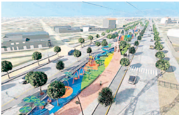
Avenida del Diablo o de la Diablada se llevará a cabo en la zona Sudeste

La Avenida del Moreno se ubicará en el sector Este, específicamente en el Distrito tres cerca del Aeropuerto, mientras que la construcción de la Avenida del