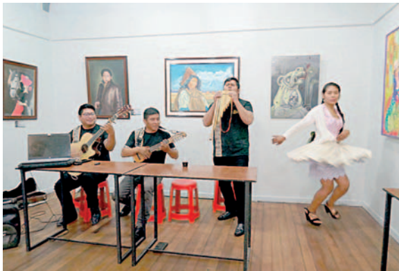
El baile del jiaja en la presentación del videoclip

"Este material se titula Tres Días, basado en una vida cotidiana y algunas anécdotas de algunos familiares que alguna vez han tenido un amor fugaz que ha durado tres días, es una