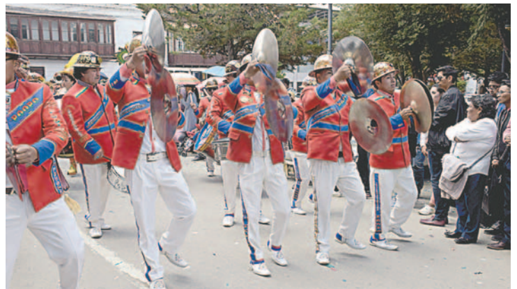
Las bandas de música fueron parte de la Entrada de los Bordadores