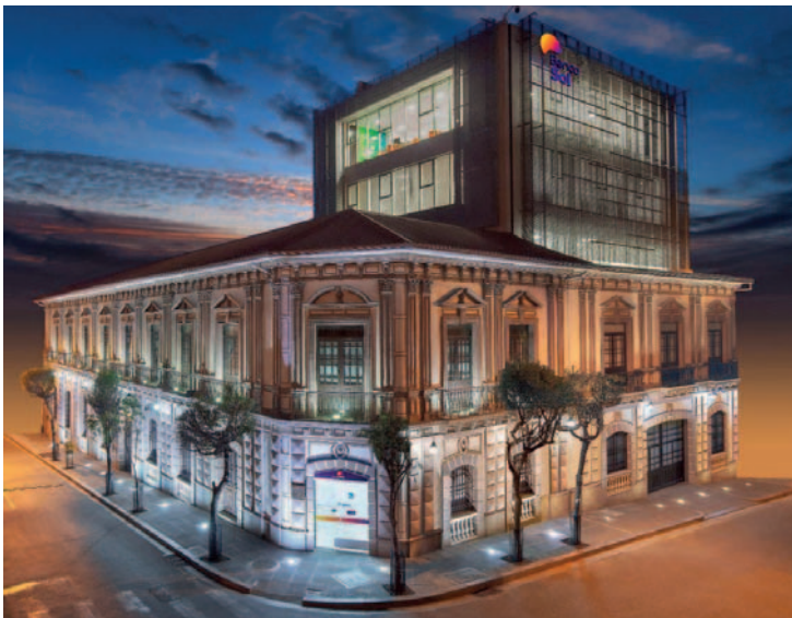
BancoSol cuenta con la confianza de más de 1,3 millones de clientes en los nueve departamentos de Bolivia

En esa ruta, BancoSol en la gestión 2024 seguirá manteniendo su fortaleza financiera y su sólido liderazgo en las microfinanzas y el sistema financiero boliviano para seguir cumpliendo su propósito: Soñar en grande. Mejorar el futuro.