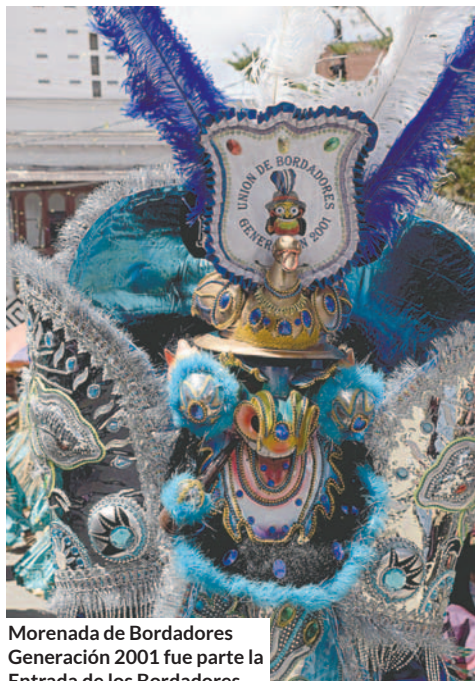
Morenada de Bordadores Generación 2001 fue parte la Entrada de los Bordadores