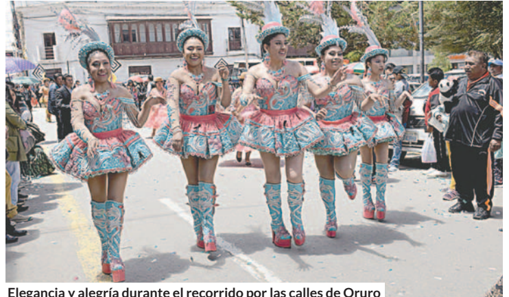
Elegancia y alegría durante el recorrido por las calles de Oruro