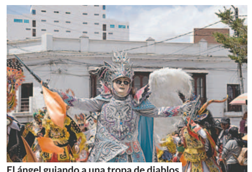
El ángel guiando a una tropa de diablos