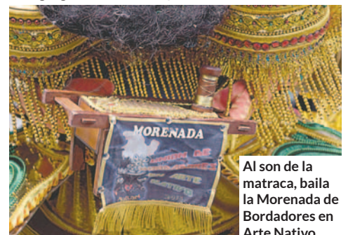
Al son de la matraca, baila la Morenada de Bordadores en Arte Nativo