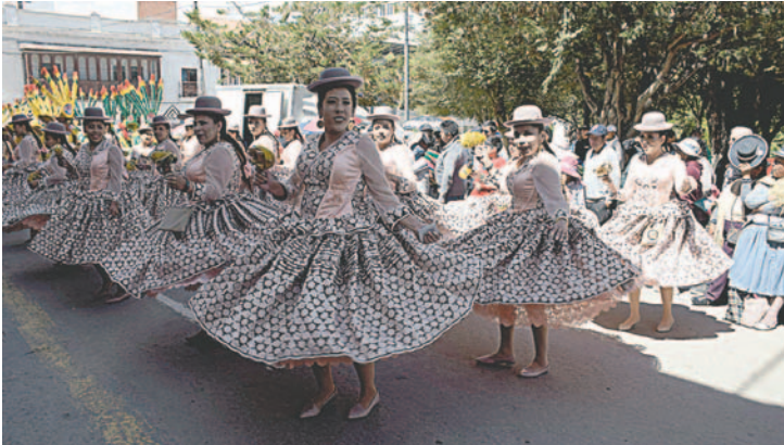
Familias artesanas demostraron su destreza y gratitud por el Carnaval 2024