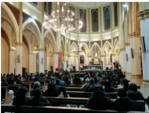
En Cuaresma, llaman a la población a encontrarse con Dios

"Debemos reflexionar sobre lo que hemos hecho, dónde estamos y qué tenemos que hacer. El tiempo de Cuaresma es como estar en el desierto, donde tenemos que encontrarnos con nosotros mismos, con