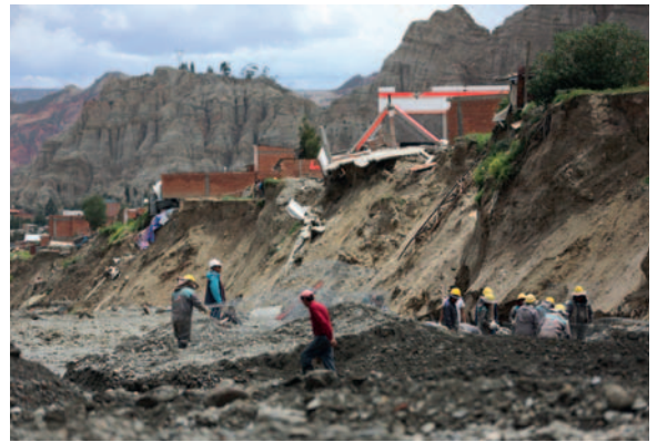
Obremos municipales trabajan cerca de casas colapsadas por la crecida de ríos en la zona Callapa

más de 300 ríos subterráneos y está construida en terrenos inestables, pues más del 70 % del área urbana está catalogada como “suelos de riesgo”, según información difundida en 2019 por la alcaldía.