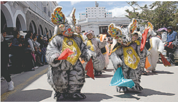
Integrantes de la Diablada Juventud Calle La Paz con trajes de oso