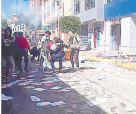
Momento en que destrozan la sede de los chóferes

La Federación Universitaria Local (UTO) convocó a una marcha contra el "tarifazo" ayer por la mañana, pero ya reunidos en el Parque de la Unión Nacional se consultó si se haría la movilización y las bases consintieron, motivadas porque un día antes,