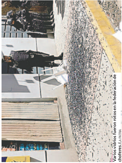
Varios vidrios fueron rotos en la federación de choferes.