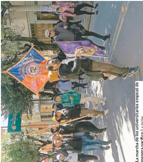
La marcha de los universitarios empezó de manera pacífica.