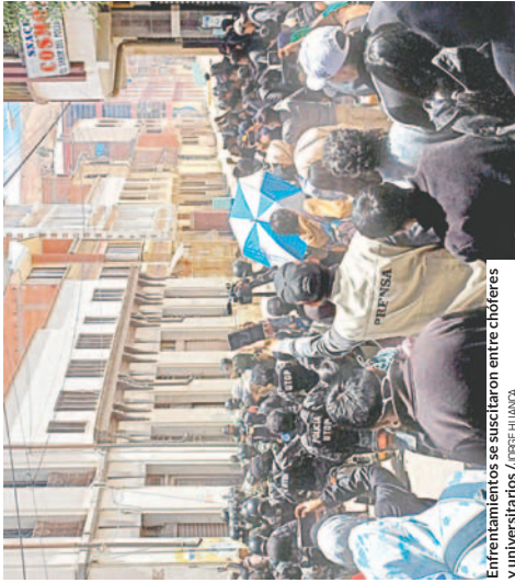
Enfrentamientos se suscitaron entre choferes y universitarios.