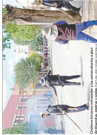
Choferes hicieron retroceder a los universitarios a plan de dinamitas, piedras y ondas.