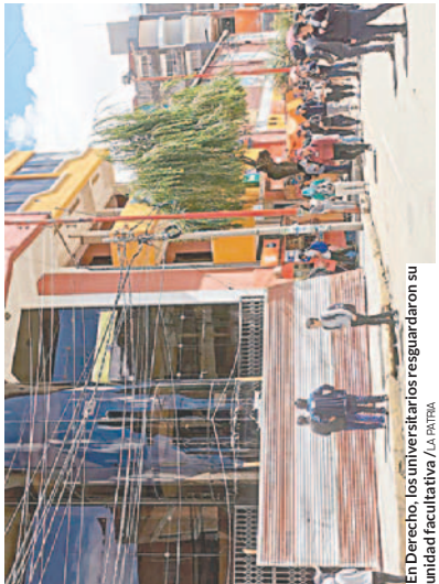
En Derecho, los universitarios resguardaron su unidad facultativa.