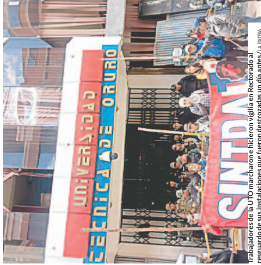
Trabajadores de la UTO marcharon e hicieron vigilia en Rectorado al resguardo de sus instalaciones que fueron destruidas un día antes.