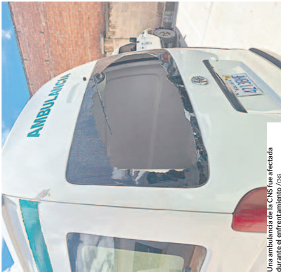
Una ambulancia de la CNS fue afectada durante el enfrentamiento.