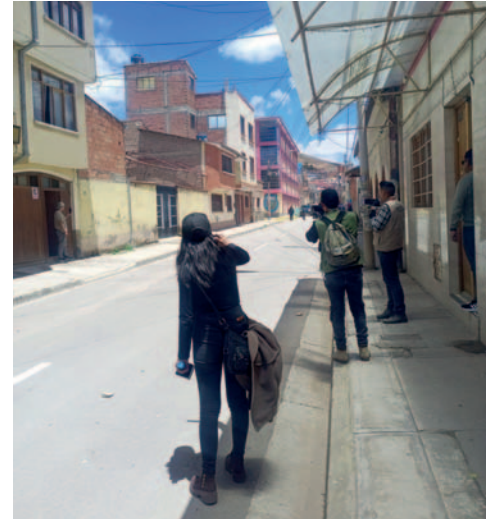
Periodistas exigieron garantías para su trabajo

Asimismo, los choferes, en un estado totalmente iracundo, no solo amenazaron a miembros de la prensa, sino también a toda persona que cruzaba por el sector de las calles La Paz y Lira. Vecinos del sector incluso denunciaron que un joven fue golpeado y despojado de su celular por grabar las actitudes de este grupo.