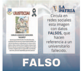
Redes sociales sirvieron para informar sobre el conflicto, pero también hubo desinformación