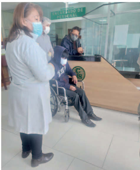
Chófer herido fue atendido en el Hospital Obrero

Las consultas generales en el Hospital Obrero disminuyeron debido a que los enfrentamientos impidieron que los pacientes acudieran a sus consultas, pero las emergencias se atendieron con normalidad.