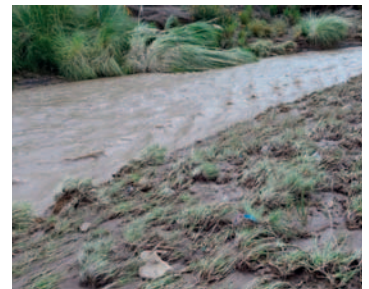
Varios cultivos fueron afectados por la riada

“Otra preocupación es el tema del camino que es de Cruce San Miguel, sector Jachuyo, tiene una declaratoria de una