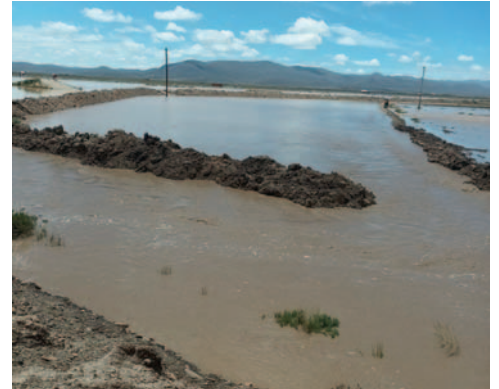
Se dañó la tubería que conecta con el sistema de suministro de agua en Oruro

Entre tanto, se pidió a la población no hacer derroche del agua potable que se tenga de reserva.