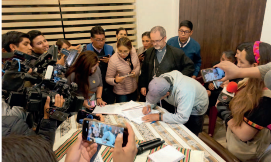
Momento de la firma de acta de entendimiento para la pacificación tras disturbios

“Claramente dice el acuerdo, de manera unánime se llega a la pacificación entre las partes