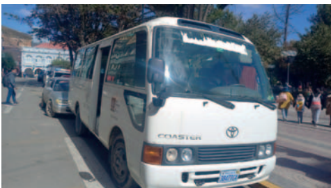
Piden a la Alcaldía poner en funcionamiento los buses escolares

A finales de 2014, la exalcaldesa Pimentel presentó los buses escolares denominados “Surbuses”, con el objetivo de implementar en la ciudad un servicio de transporte escolar municipal a bajo precio. Sin embargo, estos no entraron en circulación por falta de presupuesto para el servicio; además solo eran ocho motorizados por lo que no existía la capacidad de cubrir ni el 1% de la población estudiantil.