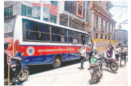
Servicio de Transporte Urbano Universitario entra en actividad