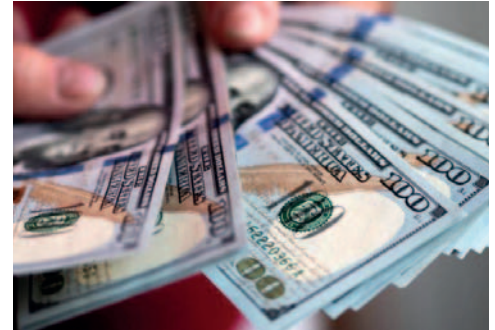
Gobierno busca ejecutar plan de estabilización de la divisa extranjera /REFERENCIAL

Este bono se emitirá con el objetivo de captar dólares tanto de personas naturales como entidades financieras del país, ofreciéndoles una segura