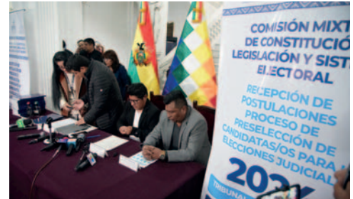
El primer día nadie se registró para la preselección de postulantes al Órgano Judicial

hasta el 10 marzo para recibir postulaciones al Tribunal Agroambiental y Consejo de la Magistratura (...), invitamos a todos los profesionales interesados en estos cargos para cambiar la justicia boliviana”, expresó.