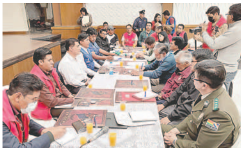
Evaluación preliminar realizada en el Salón Luis Ramiro Beltrán / GAMO

"Se han hecho interesantes observaciones, pero hay que resaltar lo que dice la Secretaría de Cultura y el GAMO, ha sido un Carna-