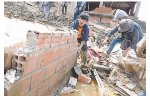
Familias afectadas por la mazamorra en el municipio de Achocalla

de Meteorología e Hidrología (Senamhi) activó recientemente una nueva alerta naranja hasta el miércoles por lluvias