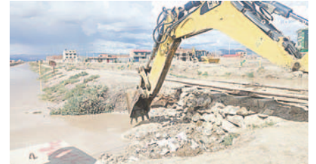
Plan de contingencia se aplicó durante las recientes lluvias