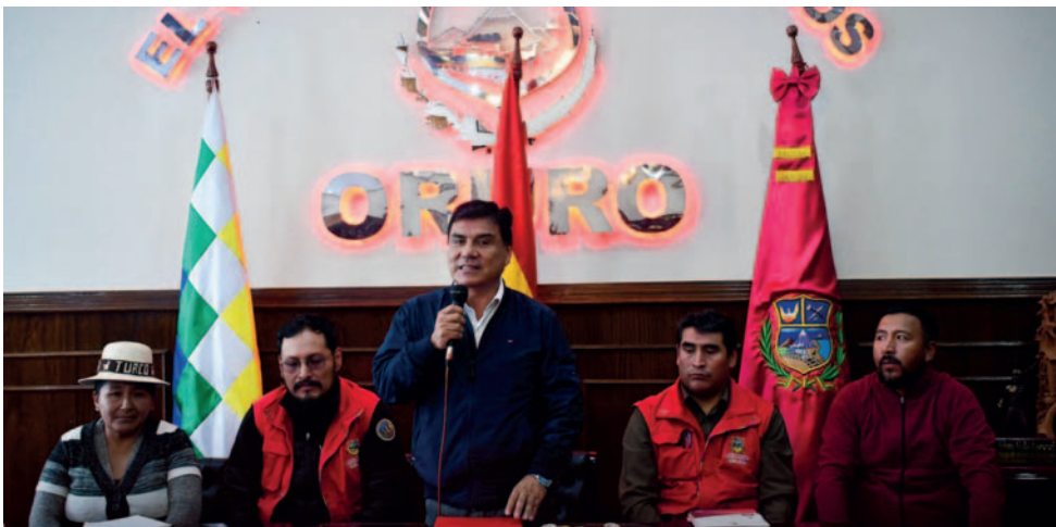
Momento del anuncio de las reuniones con representantes de Gran Bretaña