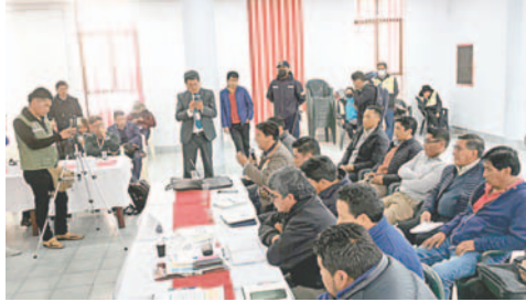
Chóferes urbanos están en desacuerdo con determinaciones de la Mesa de Consenso convocada por el GAMO

Por la mañana estuvieron en la convocatoria a la mesa de Consenso represen-