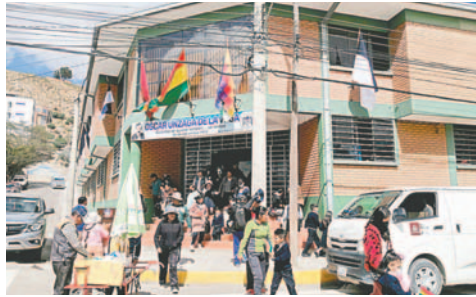
Labores educativas son normales

En ese sentido, con la finalidad de garantizar el derecho a la educación y considerando que en la inscripción de los estudiantes fue priorizada en