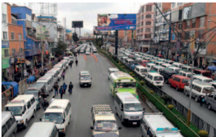
La Confederación Sindical de Chóferes de Bolivia propone aumento en tarifas debido a la escasez de dólares /INTERNET