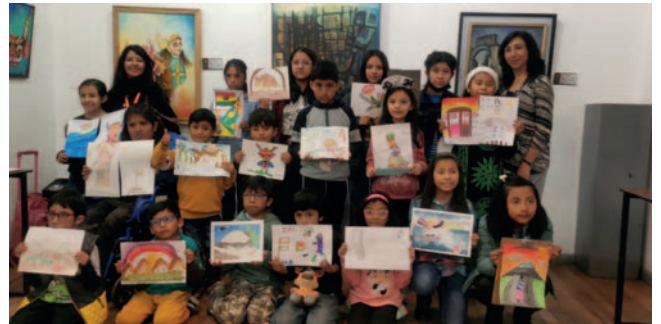
Los participantes del Festival Infantil “Píntame Bolivia 2024”

“Soy médico de profesión, pero también la cultura es algo que me encanta y llevo haciendo difusión de la cultura de Bolivia en México desde