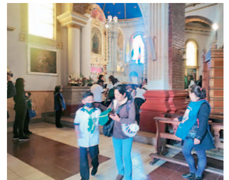
Voluntarios resguardaron el Santuario

“Lo principal es tener el corazón transparente, presentarse ante la Virgen tal como uno es, con sus expresiones culturales y musicales, con la representatividad de su conjunto. Pero especialmente deben presentarse tal como son, así como María presentó a Jesús hace más de dos mil años en el templo. Nosotros también debemos presentarnos tal como somos, pero con el sincero propósito de superarnos y ser mejores hijos e hijas de Dios”, afirmó.