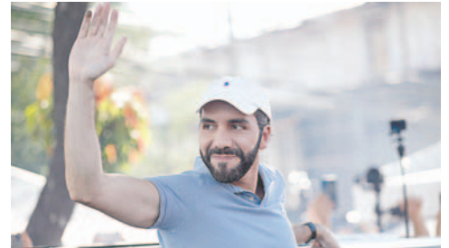
El presidente de El Salvador Nayib Bukele, fotografiado al llegar a votar en las elecciones nacionales

Este ciclo electoral ha estado marcado por la polémica reelección inmediata -considerada inconstitucional- y por la popularidad del presidente Bukele. Algunas encuestas le sitúan como uno de los líderes mejor valorados tanto en América Latina como a nivel mundial. Además, otro factor relevante ha sido la situación de seguridad del país; durante su mandato se ha registrado una disminución