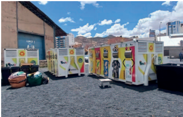
Las seis islas verdes se hicieron con recursos propios del GAMO

Esta entrega es parte de las acciones que se implementan para lograr la clasificación de residuos sólidos para reducir la basura que se genera en Oruro.