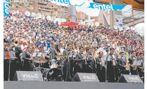
Antes del Festival de Bandas, músicos advierten que tenían contratos

“Este paro prácticamente ha sido un gran perjuicio, ahora queda menos de una semana para el Carnaval de Oruro, en ese entendido los próximos días como músicos nos vamos a reunir con las organizaciones y sacar un pronunciamiento conjunto para que nuestros asambleístas también puedan so-