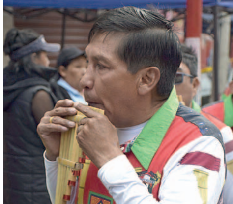
Devotos con su peregrinación hecha danza

“Son 25 años que cumpla en el Phujllay Oruro y son 37 años que le entrego mi corazón a la Virgen del Socavón, porque antes fui