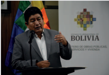
Ministro de Obras Públicas, Edgar Montaña

Desde el 22 de enero, sectores sociales afines al expresidente Evo Morales decidieron bloquear diferentes carreteras del país, especialmente en Cochabamba, demandando la renuncia de los magistrados prorrogados y la elaboración inmediata de nuevas elecciones judiciales. El viernes pasado, varios sectores decidieron dar un cuarto intermedio luego de llegar a un