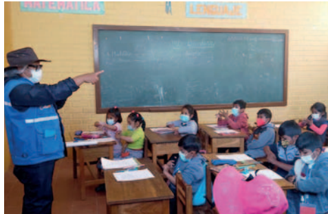
Los estudiantes deberán utilizar barbijos de manera obligatoria

El ministro recordó que se reactivó dicho protocolo mencionado, por lo cual los estudiantes y la comunidad educativa en general deben adop-