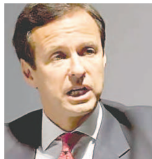
El expresidente del país, Jorge Tuto Quiroga

En este contexto, Quiroga acusó a Arce y al expresidente Evo Morales, a través de sus redes sociales, de saquear la economía nacional y destruir las instituciones públicas