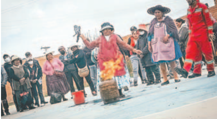
Vendedoras de comida fueron capacitadas en el manejo de garrafas