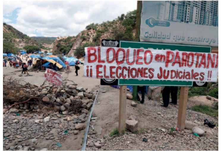
Afines a Evo Morales en el punto de bloqueo del puente de Parotani

Aunque se observa una reducción en la cantidad de manifestantes, la situación persiste, generando tensiones en el tráfico y la movilidad en la región.