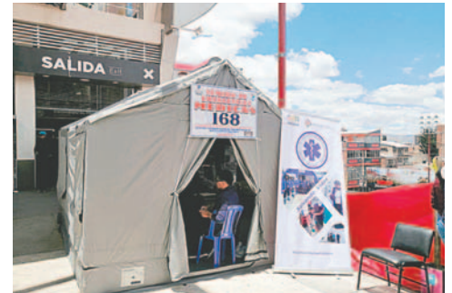
Puntos de salud se ubicaron por la ruta del Carnaval

Durante la mañana de ayer, el Sedes realizó la supervisión tanto de los puntos fijos como también de los móviles para verificar que cuenten con medicamentos e insumos necesarios para responder adecuadamente a la población.