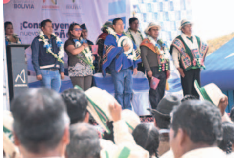
El mandatario Luis Arce adelantó sobre la futura construcción de un centro de salud en ese municipio /RR.SS.

Las soluciones habitacionales fueron construidas por la Agencia Estatal de Vivienda (AEVivienda) con una inversión superior a los Bs 3 millones. Según explicó el mandatario, estas viviendas son dignas y