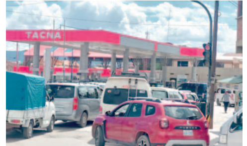
Desde la ANH, reportaron un problema ayer en Planta de Almacenaje de YPFB /LA PATRIA

“Referente a hoy miércoles (ayer), ha habido un problema con uno de los tanques en Planta de YPFB, lo cual ha hecho que se retrase los despachos a las cisternas de las estaciones de servicio, antes del mediodía se ha vuelto a la normalidad las operaciones en Planta y se han restablecido para que se puedan despachar a las cisternas y ya luego se ha despachado en las estaciones de servicio y se han disminuido las filas”, complementó Cazorla.