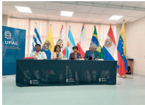
Cuatro programas de becas se expusieron en la feria “Futuro brillante orureño”

El legislador aseguró que esta fue la primera actividad de muchas otras planificadas, todas con el objetivo de motivar a los jóvenes a