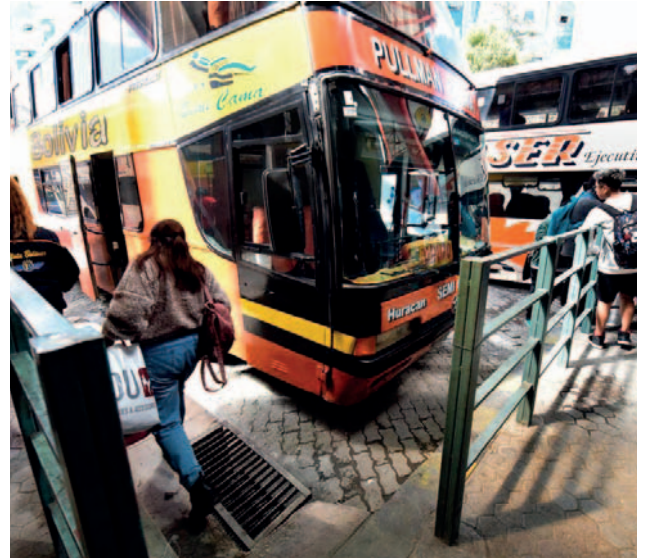
Buses salen con normalidad de La Paz hacia Oruro

Hasta la fecha se cumplen diez días desde que simpatizantes del expresidente Evo Morales bloquearan las carreteras en diferentes puntos del país, principalmente del eje central, exigiendo la renuncia de los magistrados y consejeros “autoprorrogados” del Órgano Judicial y la realización inmediata de las elecciones judiciales.