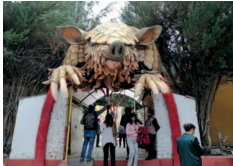
Bioparque se encargará del manejo y custodia responsable de la fauna silvestre

De acuerdo con la licencia otorgada para su funcionamiento como Centro de Custodia de Fauna Silvestre con categoría de