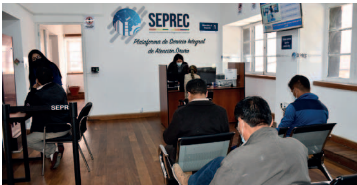
Seprec registró más de 700 unidades económicas en 2023