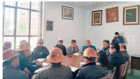
En la reunión no se descartó posible cambio de razón social de Cooperativa Luminosa RL y con ello, migración de operaciones

Fedecomín han acompañado en esta reunión y en una de las cláusulas han indicado que van a migrar de actividad no metálica a metálica, que sería un trámite más administrativo y nosotros estamos esperanzados en que se pueda avanzar este trabajo y en el tema social, poder ya realizar la migración y que