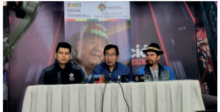
El ministro de Medio Ambiente y Agua, Rubén Alejandro Méndez Estrada (centro)