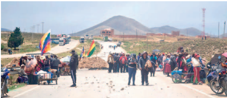
Bloqueo de carreteras persisten en el país