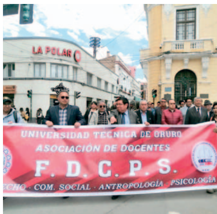
Docentes de la UTO con marcha piden que jubilación a los 65 años sea opcional

Los movilizadores cuestionaron además las bajas rentas de jubilación, por lo que argumentaron que son obligados a seguir trabajando.