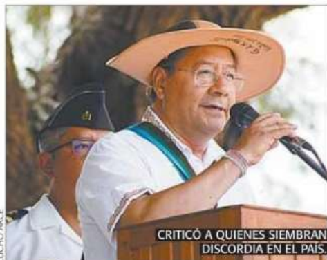
CRITICÓ A QUIENES SIEMBRAN DISCORDIA EN EL PAÍS.