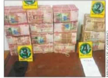
MINISTERIO DE GOBIERNO

de 100 bolivianos. "La persona no pudo certificar la procedencia legal de estos recursos por lo que se procedió a la aprehensión de la misma. El caso se encuentra en investigación", agregó Del Castillo, prometió conocer la procedencia de ese dinero que estaba en manos de esa mujer. Adempas, adelantó que se continuará haciendo estos controles en las cerreteras.