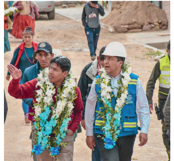
Vecinos se beneficiarán con proyecto de pavimento y muro / GAMO