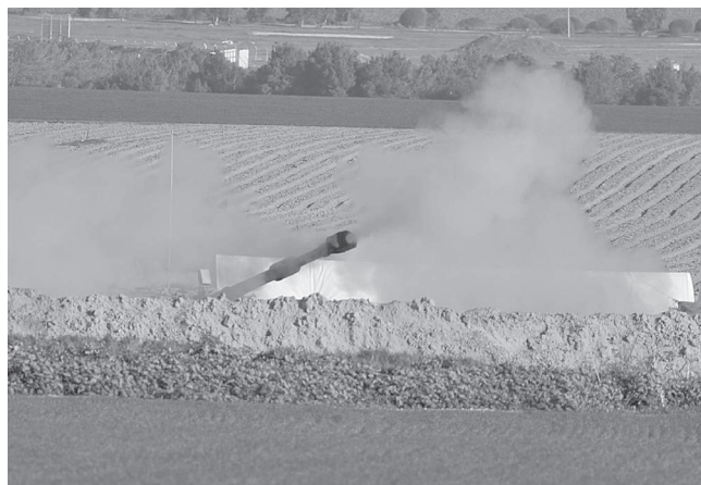
La artillería israelí dispara contra objetivos en la Franja de Gaza, en un lugar no revelado junto a la frontera israelí con el enclave palestino, el 12 de enero de 2024

El Ministerio denunció: "Los crímenes genocidas cometidos por la ocupación israelí en la Franja de Gaza hacen que esta guerra sea la más criminal y sangrienta de la historia. Uno de cada veinte gazatíes es mártir, herido o desaparecido". Además, el Gobierno de Hamás denunció que la fuerza aérea israelí lanzó un "cinturón de fuego" sobre varios barrios del sureste de la ciudad de Jan Yunis, bastión del grupo en el sur del enclave donde se cree que se encuentra su líder Yahya Sinwar.