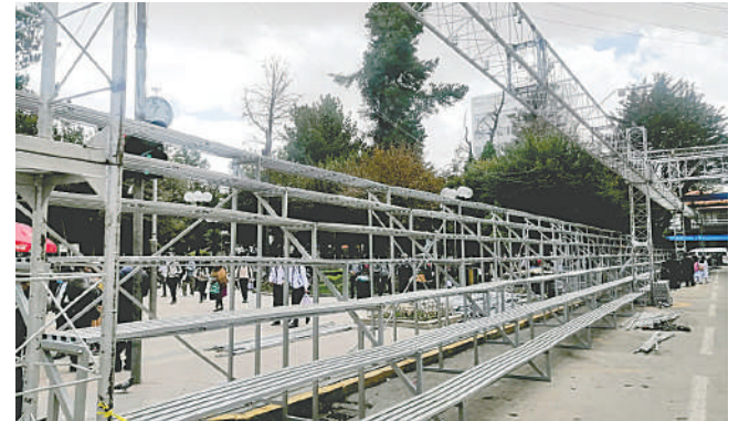
Recomiendan el armado correcto de graderías

Este año, por concepto de venta de metros lineales, incluyendo las zonas municipales, se recaudaron 2.710.609.99 bolivianos. Esta recaudación