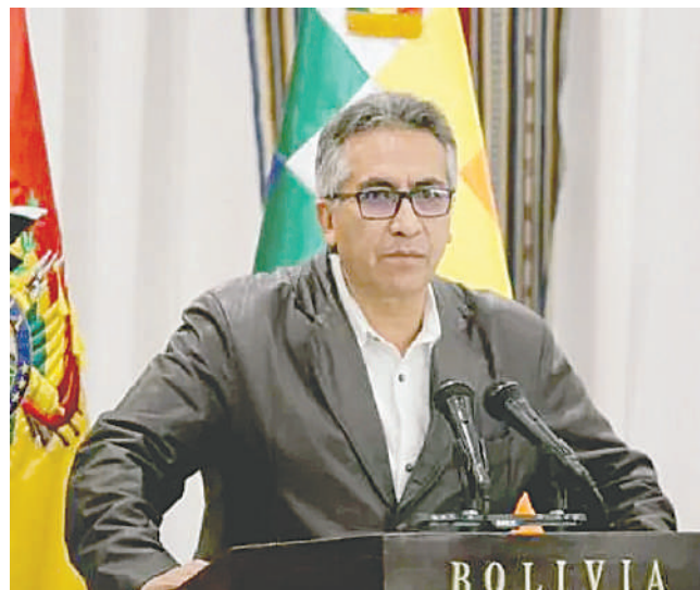
El viceministro de Coordinación Gubernamental, Gustavo Torrico

En declaraciones a la prensa, opinó que la solución al conflicto interno del partido gobernante es convocar un congreso consensuado entre las organizaciones del Pacto de Unidad y Evo Morales, en su calidad de presidente