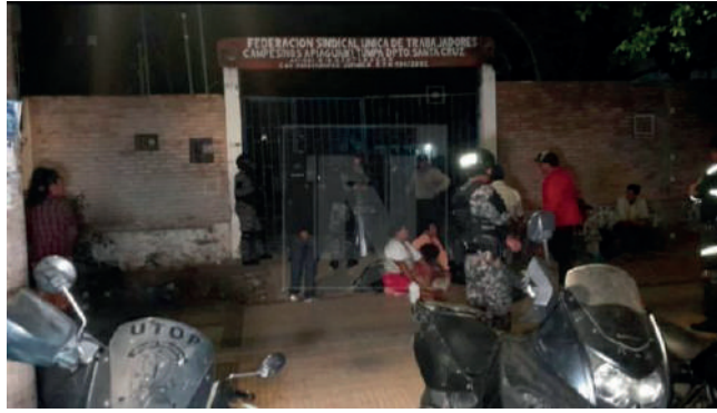
Un grupo de policías resguarda la sede campesina en Santa Cruz