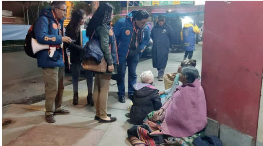
Operativo busca evitar el trabajo infantil

Además, se observó incluso la presencia de progenitores que