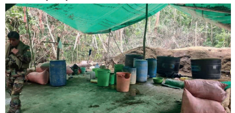
Se halló droga y se destruyeron fábricas de estupefacientes