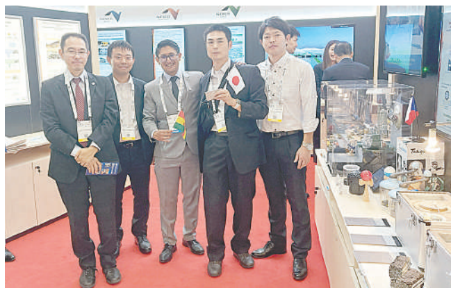
Representantes de todos los países del mundo participan

Sin embargo, enfatizó en que este camino no es fácil; no solo hay que tener amplias capacidades en investigación sino también dominio del inglés y, muchas veces, incluso cubrir los gastos de participación. Por tanto, incentivó a los ingenieros y estudiantes a prepararse arduamente y buscar superarse siempre.