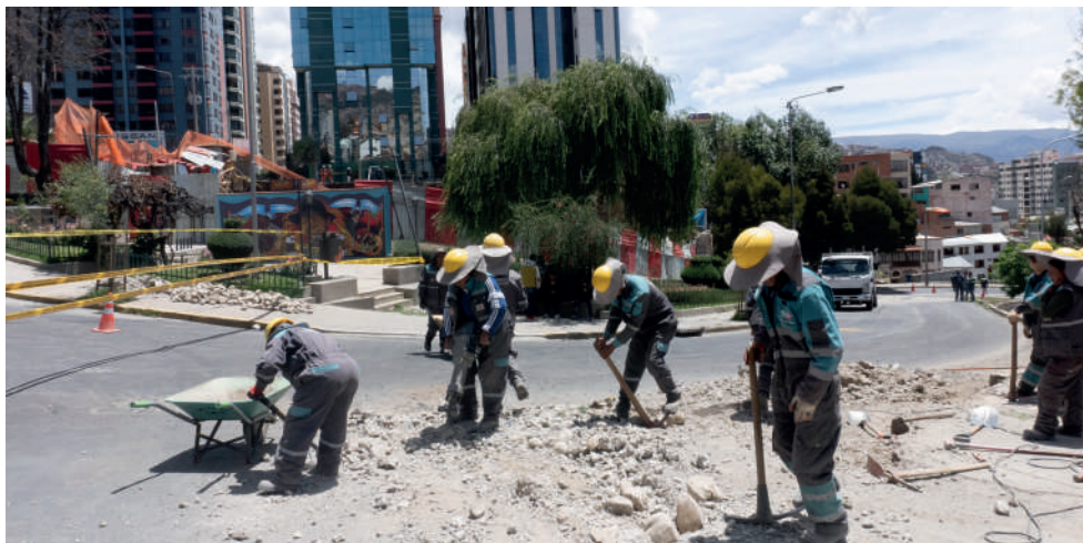
El lugar está siendo atendido por distintas instancias del Estado

El desplome del muro ocurrió el pasado jueves por la mañana durante la construcción del edificio Panoramic a cargo de Empresa Constructora Tauro S.A., lo cual generó preocupación entre los residentes debido a que esta zona concentra varios edificios grandes.