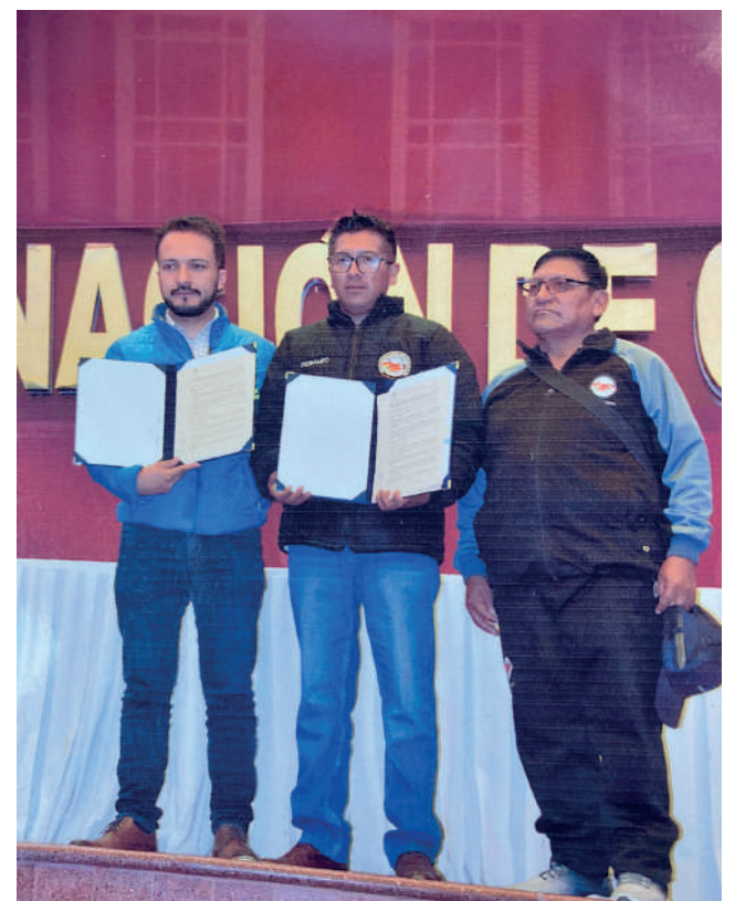
Acto de presentación del convenio entre Mi Teleférico y Fedbampo

En el departamento, también se confirmó la ampliación del horario y días de atención de estación del Teleférico Virgen del Socavón y la adecuación para que se note el tono del Carnaval de Oruro.