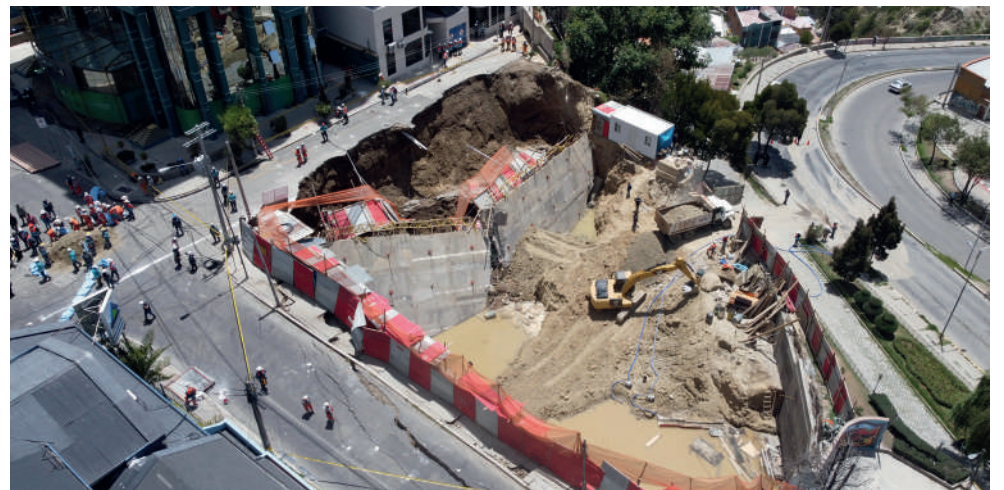
El hundimiento trajo diversos problemas en la zona