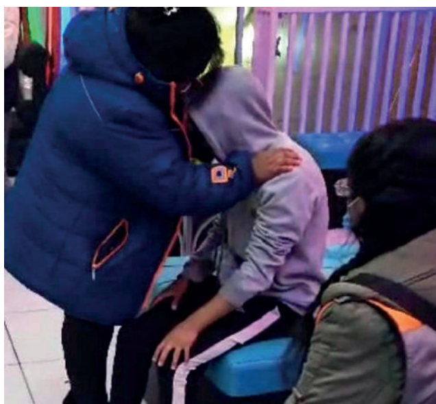
Menor de edad fue encontrado en un local de expendio de bebidas alcohólicas

En ese sentido, los funcionarios de la DIO pusieron rápidamente al adolescente bajo custodia y contactaron a sus familiares para firmar un acta