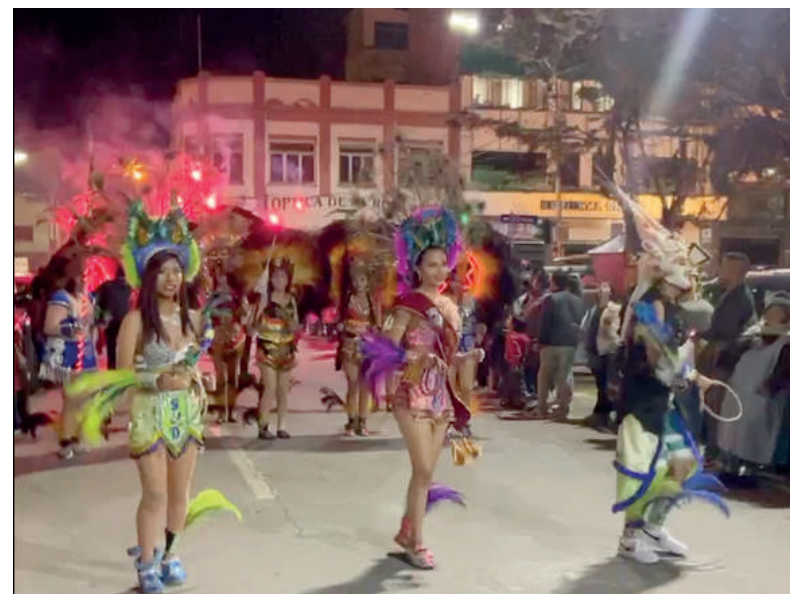
Realizaron un recorrido la noche de ayer