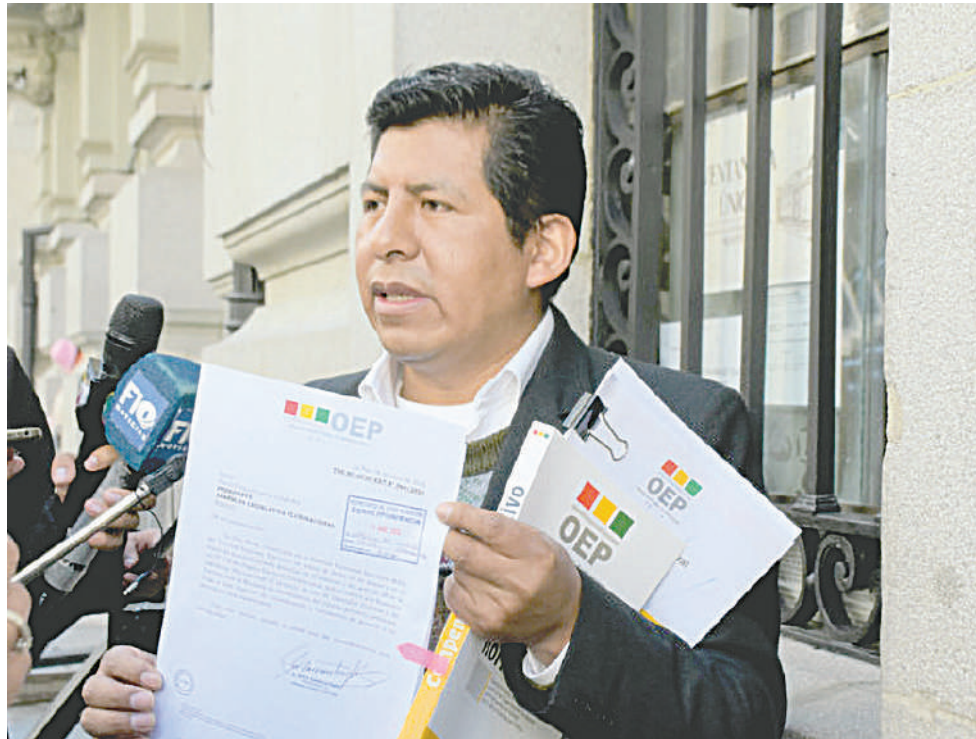
El vocal del Tribunal Supremo Electoral (TSE), Tahuichi Tahuichi

“La realización de las elecciones primarias es una aberración, un insulto a la democracia. Es un insulto a la inteligencia de los bolivianos. Es importante, es imperativo que podamos trabajar como bolivianos y bolivianas, como actores políticos, académicos (...). Es decir, este proyecto busca anular las elecciones primarias. No tiene sentido ir a las elecciones primarias