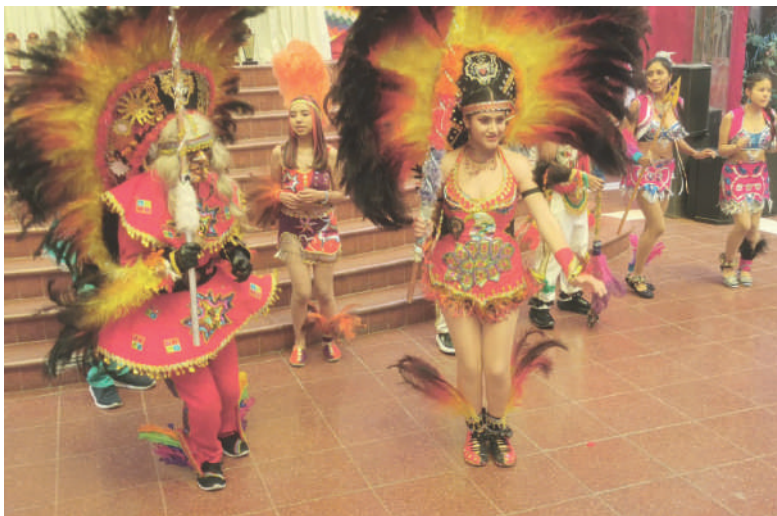
Con danza, celebran acto de conjunto Tobas Sud

También fueron distinguidos los bloques: Tobas Centenario, Cambas, Izozog, Añas, Tarijeños, Chunchos Sajama y Weenhayek.