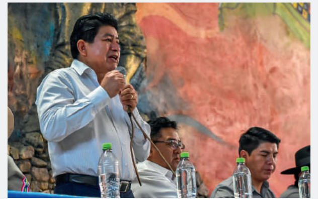
El ministro de Obras Públicas, Edgar Montaño