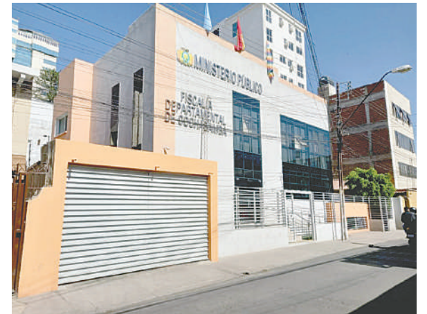
Frontis del Ministerio Público de Cochabamba