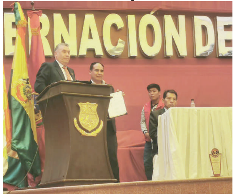
Entrega de distinción camaral / LA PATRIA