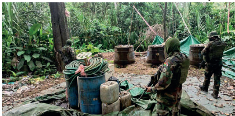
La policía intervino varias zonas del trópico cochabambino

Según Astorga, la producción de tambaquí parece ser una cortina de humo utilizada para encubrir el presunto lavado de dinero proveniente de actividades ilícitas. Por lo tanto, considera imperativo abrir una investigación contra Evo Morales y realizar un allanamiento en su domicilio para descartar posibles vínculos con el lavado de dinero o conocer conexiones con los líderes del narcotráfico.