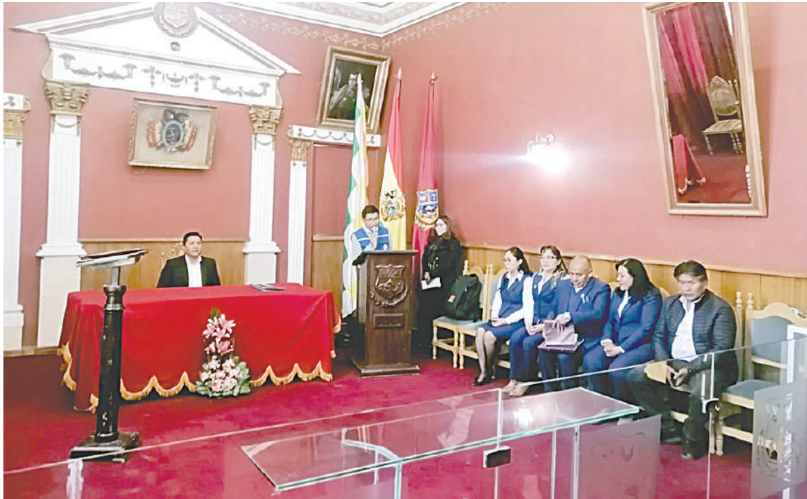
Alcalde Adhemar Wilcarani ratificó a otros secretarios

En el acto de posesión, el burgomaestre resaltó la importancia y relevancia de dar continuidad al trabajo efectuado a lo largo de la gestión edil, como la entrega del proyecto prevista para el 10 de febrero. Asimismo, ponderó que se encuentra en plena ejecución el proyecto de alcantarillado con una inversión de 38 millones de bolivianos, así como también el proyecto del Hospital "Isaías" con una inversión de 54 millones de bolivianos, además de otras