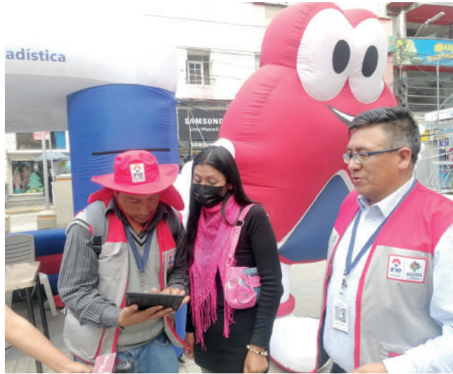
Oruro necesitan 41.017 censistas voluntarios

En relación al Censo, Cabrera destacó que existen una serie de incentivos para los censistas volunta-