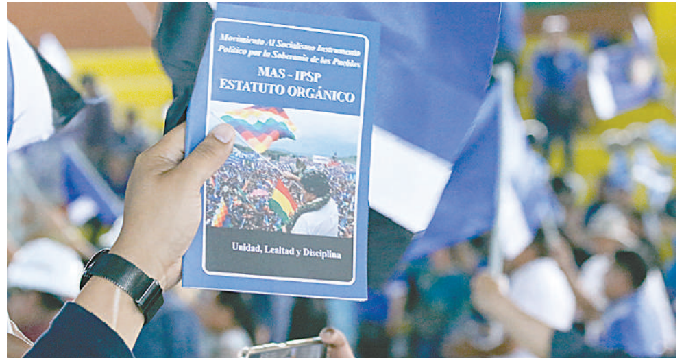
El Pacto de Unidad del bloque renovador del MAS pide que se convoque a congreso en una semana