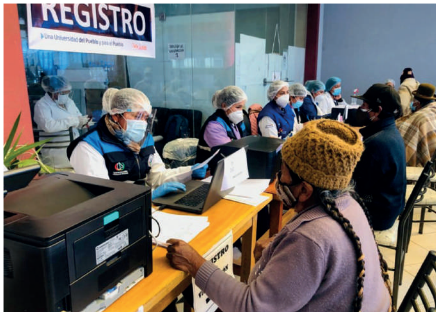
Prevén aumento de casos de coronavirus en temporada invernal /

Castro aseguró que el Gobierno garantiza la llegada y distribución de vacunas a nivel nacional. Hizo un