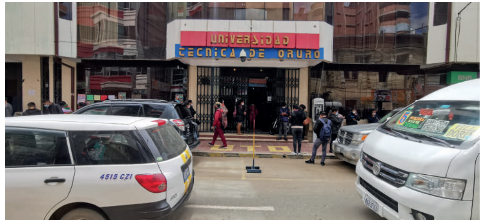
El déficit económico ronda los 50 millones de bolivianos en la UTO

"A las nuevas autoridades les tocará seguir manteniendo con austeridad la universidad; seguir manejándose con mucha prudencia, porque hemos visto que, en anteriores gestiones, si