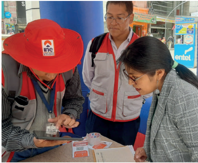
Continúa el reclutamiento de censistas

“Si observamos la planificación, estamos cumpliendo con todos