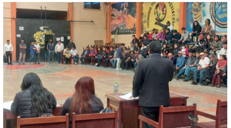
La Cocanis pretende poner en práctica su nuevo estatuto

El 21 de diciembre de 2023, la Sala Constitucional Primera de