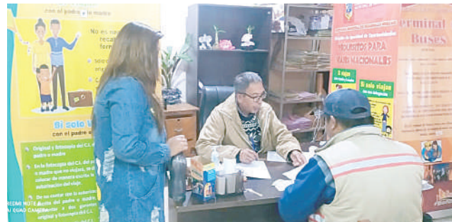
Emisión de permiso para menores de edad fue mayor en diciembre

En el marco del plan preventivo “Viaje Segu-