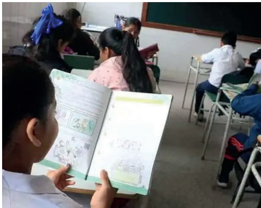
El Gobierno visualiza reunión con padres de familia de colegios particulares la siguiente semana / JUAN CARLOS TORREJÓN

“Nos vamos a reunir con la Asociación Nacional de Padres de Familia para coordinar acciones contra cualquier colegio particular que no