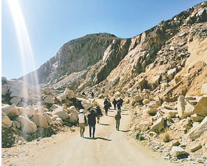
La sentencia constitucional establece la paralización de trabajos en el cerro de la zona Norte de Oruro