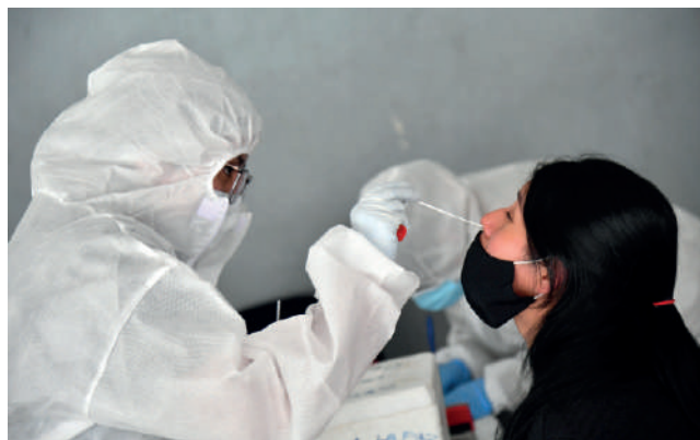
Instan a mantener las medidas de bioseguridad de manera constante

“Durante la semana epidemiológica hemos tenido 1.933 casos, lo que representa un aumento del 128% en comparación con la semana 51, y predomina en el departamento de Santa Cruz”, dijo en una entrevista con ATB Radio.