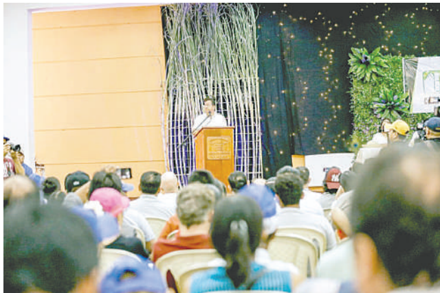
El Presidente del país, Luis Arce, encabezó el acto del sector productivo en Montero /LUCHO ARCE

EL jefe de Estado anunció que Bolivia buscará mejorar la productividad agrícola con tecnologías avanzadas y biotecnología nacional, rompiendo así su dependencia externa