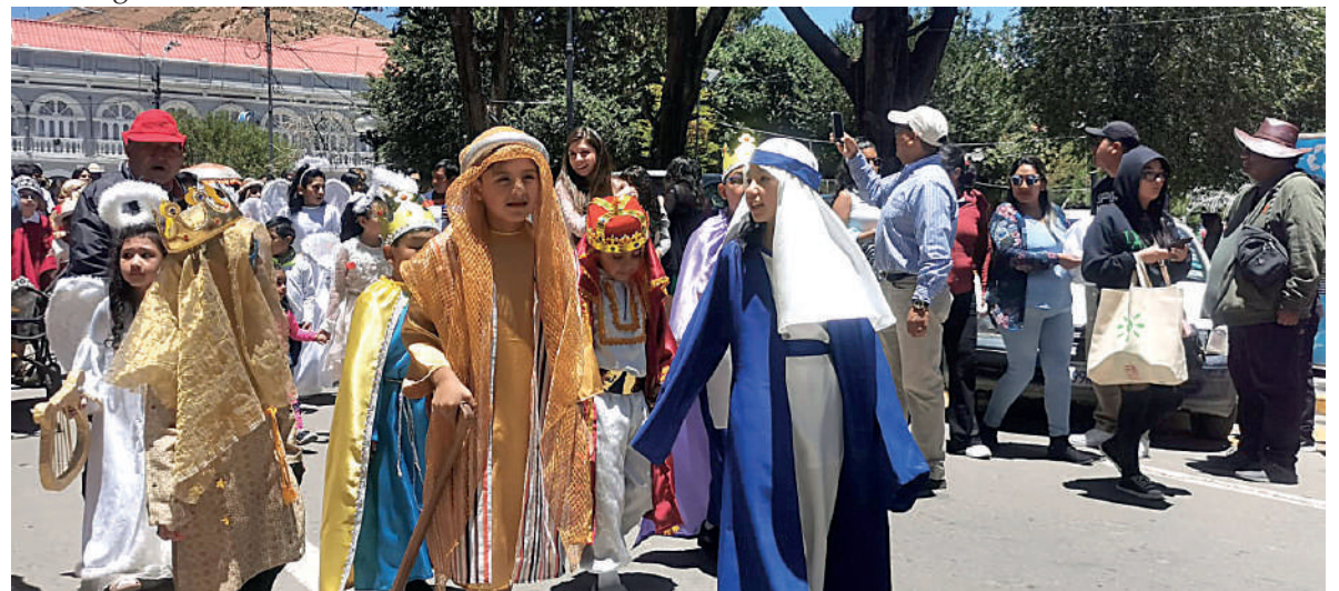
Algunos niños se vistieron de Reyes Magos