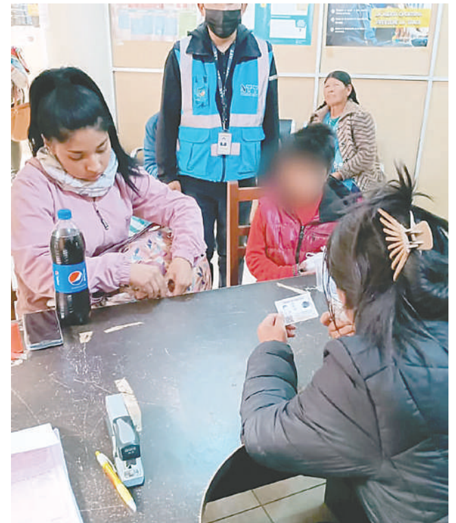
Progenitores tramitaron el permiso para sus hijos /DIO

“Hubo pequeños incidentes, pero la DIO respondió oportunamente. Seguiremos atendiendo a la población como corresponde”, concluyó.