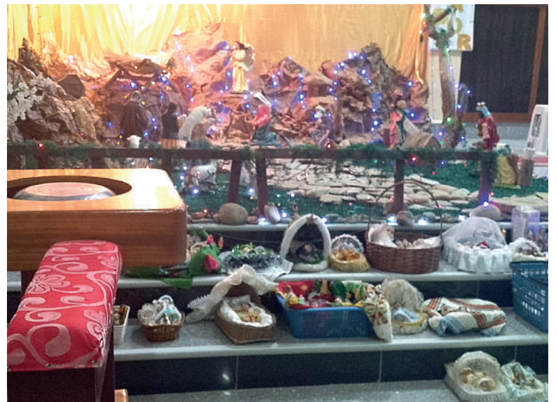
Imagen de niños Jesús en la parroquia de urbanización Huajara

El oro significa la ayuda económica y el culto de los pobres al rey, el incienso para acompañar las oraciones y la mirra como muestra de sacrificio por lo amargo de su aroma.