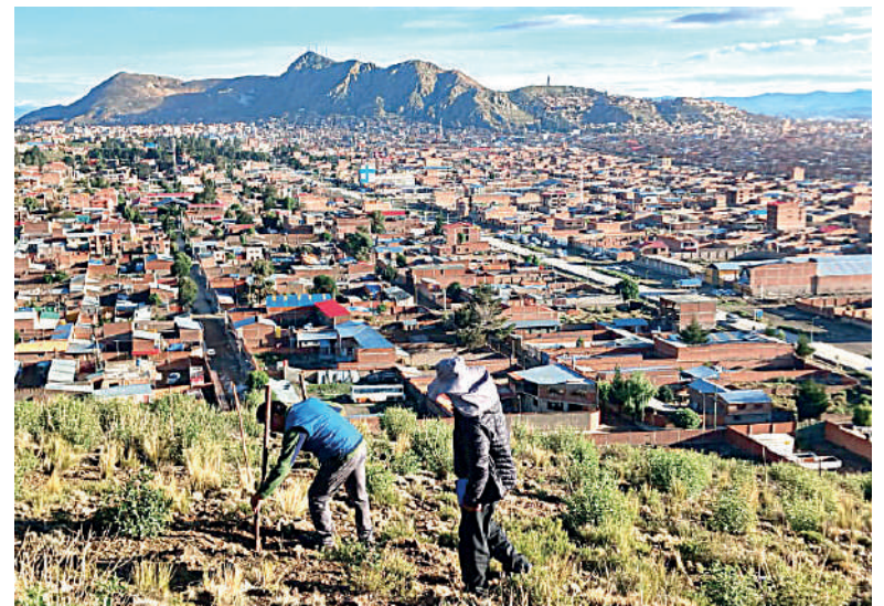
Algunas de las especies plantadas