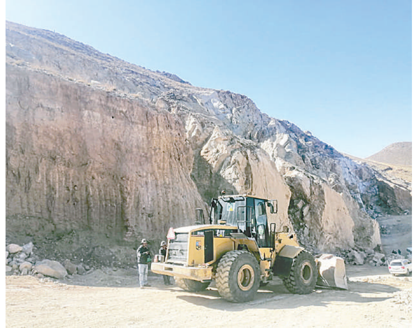
Continúa la explotación de agregados en el cerro San Pedro

Aclaró que el monto mencionado es solo un estimado, pero enfatizó que esos recursos son del GAMO y que los gastos invertidos hasta el momento son significativos.