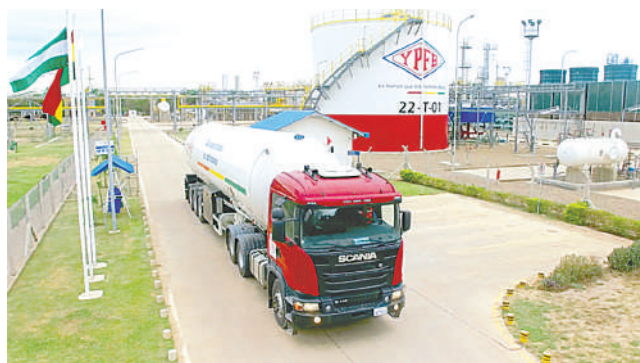
La Planta de Biodiésel en Santa Cruz

“Ya hay las resoluciones firmadas, entonces de seguro vamos a ahorrar $us 250 millones al año”,