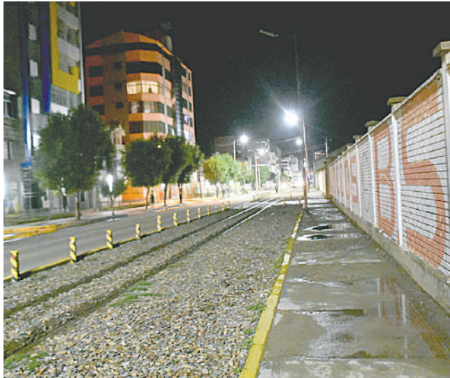
La ruta del Carnaval de Oruro comenzará desde la avenida 6 de Agosto detrás del Molino de Piedra

tener un cambio rotundo que va a tener este Carnaval, con las tres instituciones hemos verificado la nueva ruta y son espacios que han sido muy dejados pero ahora se va a trabajar y mejorar la iluminación, más seguridad, limpieza, contenedores