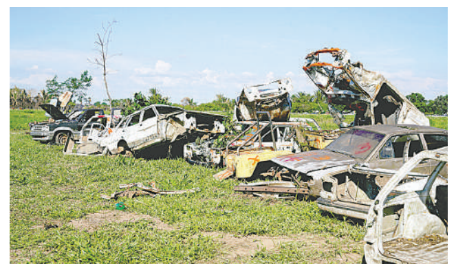
Lograron monetizar 2.160.000 dólares en concepto de chatarra de autos

La estrategia adoptada por Dircabi muestra una gestión eficiente y efectiva frente al problema persistente del narcotráfico en Bolivia. La venta de estos bienes incautados no solo representa un ingreso eco-