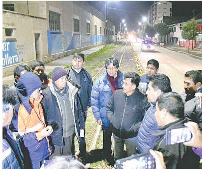
Representantes de las tres instituciones organizadoras en la inspección

Con esta inspección, los organizadores ratificaron el cambio en el inicio de la ruta del Carnaval de Oruro, ya que este año, no comenzará en las calles Aroma y Potosí como solía ser.