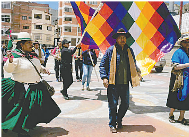
Se anuncia dos convocatorias para XXXI Anata Andina /LA PATRIA

Cada año esta actividad es organizada por la Federación Departamental de Campesinos de Oruro (Fsutco), sin embargo, actualmente, hay dos líderes que se atribuyen la legalidad de la institución y por lo tanto la organización del Anata Andino.