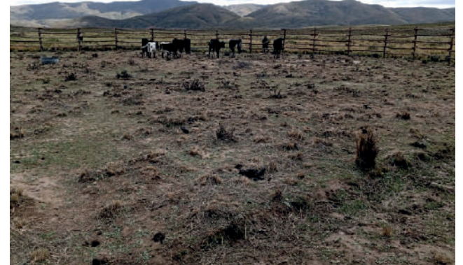
Animales fueron encontrados en situación crítica