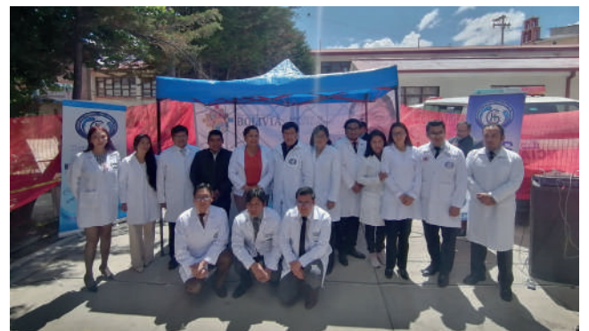
Ministerio de Salud entregó 15 ítems a médicos especialistas y subespecialistas

“En este contexto estamos trabajando en varias actividades con los hospitales. También es importante recalcar que, en 2023, el hospital general recibió más de 31 millones bolivianos destinados al cierre