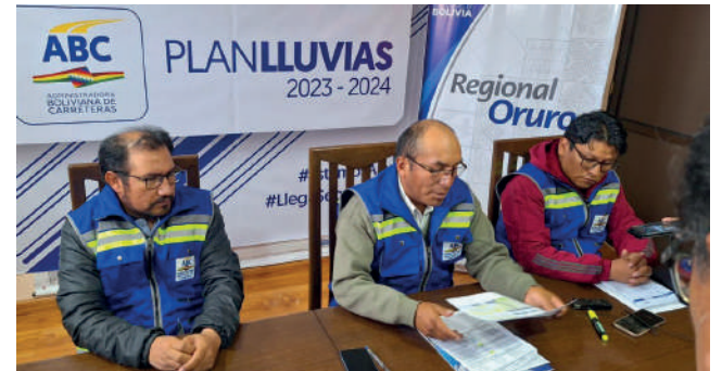
ABC publica licitación internacional para la construcción del Tramo I Oruro - Cruce Vinto - Cruce Huanuni de la Doble Vía Oruro Challapata

Además, se construirán seis pasarelas y cuatro vacaductos que son solicitudes realizadas por las comunidades. En cuanto a las características técnicas del proyecto, este contará con dos carriles bidireccionales.