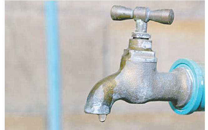
Los adultos mayores podrán acceder a un 20% de descuentos en SeLA /REFERENCIAL

Con base en la Ley N° 1886 del 14 de agosto 1998, el artículo primero, menciona que "los ciudadanos bolivianos de 60 o más años, tienen el derecho de obtener deducciones