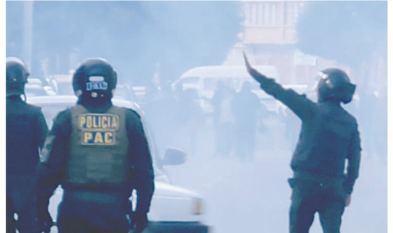
Efectivos policiales separan a ambos bandos para evitar enfrentamientos