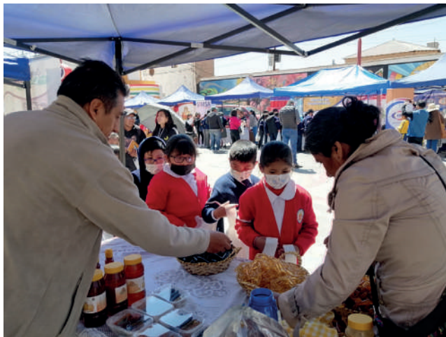
Degustación de alimentos se realizó el año pasado

“Este es el compromiso firmado y esperamos que las autoridades den especial importancia a la educación. Hablamos de menores de edad, por lo tanto, el Concejo Municipal debe aprobar los productos como garantizar su entrega según lo acordado. Estamos a la