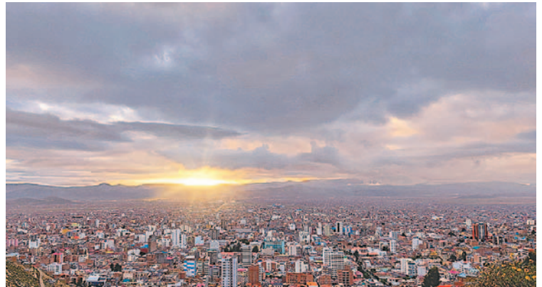
El centro urbano de Oruro está cambiando con la construcción de edificios altos

"Esto deberían analizar las autoridades municipales, porque además están ocasionando un crecimiento caótico, desordenado, además de afectar seriamente al medioambiente urbano, porque un edificio que no cumple con la normativa, primero que da sombra a todos los vecinos, les quita el sol, sus patios