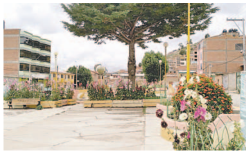
La plazuela de Chiripujio lucirá más “verde” con el impulso de los Fruticultores / LA PATRIA

“En la plazuela de Chiripujio hemos plantado algunos arbolitos frutales y seguiremos con la intención de poner también especies exóticas. Por ahí cerca está el lugar donde queremos hacer el proyecto del gran