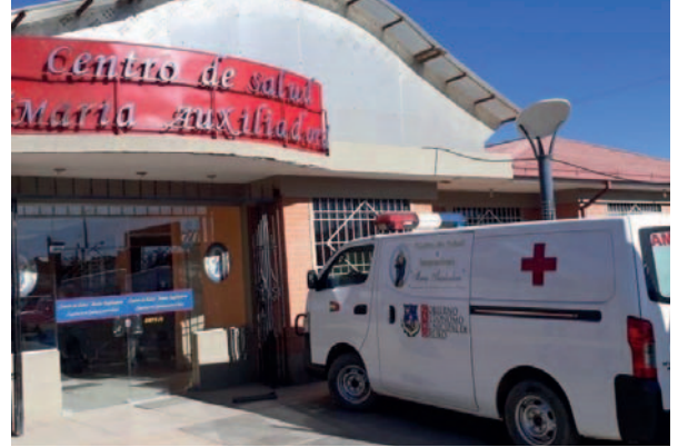
Centro de Salud María Auxiliadora

Se ha confirmado que el equipo ha arribado ya a la ciudad de Oruro y como corresponde, se está efectuando la fiscalización no solamente a su instalación en los ambientes a los que ha sido destinado, sino también al proceso de licitación que se ha