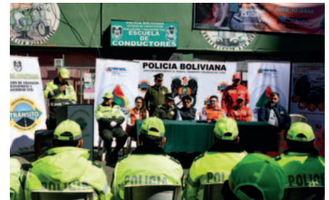
La empresa Univida junto a la Policía controlarán el SOAT desde esta jornada