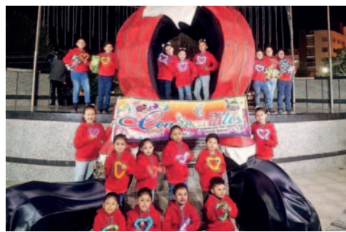
La Navidad fue un punto central en las composiciones