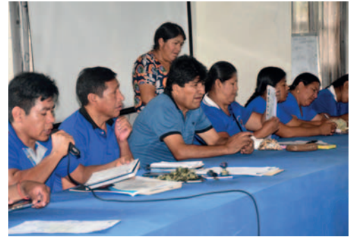
El ampliado se realizó entre el viernes y sábado, con la presencia de Evo Morales

“Nuestras bases han repudiado los ataques contra nuestro líder Evo Morales. No tenemos miedo y vamos a defenderlo. El presidente Luis Arce está dividiendo a las organizaciones sociales y se está convirtiendo en un dictador al intentar inhabilitar a Evo Morales. Es lamentable que actúen de esa forma”, manifestó Soto.