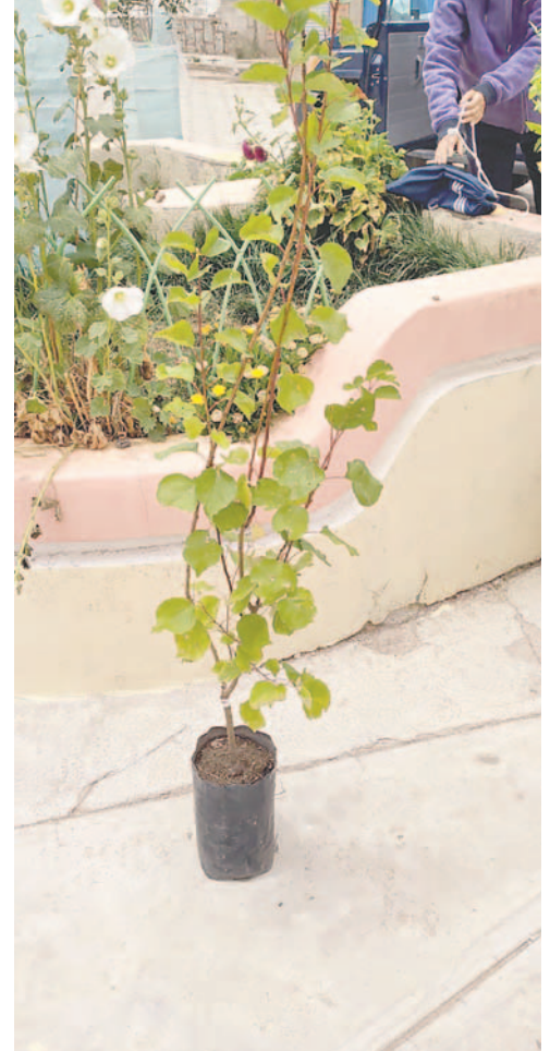
Distintas variedades fueron plantadas

logró poner en toda la ciudad más de 1.000 plantines frutales y ahora también especies exóticas, como parte de esta iniciativa ciudadana que trata de ser autosostenible para cubrir el costo de los arbolitos.