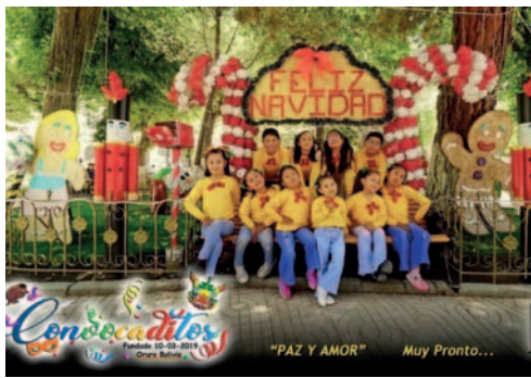
El grupo de Los Convocaditos