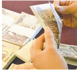
El PGE 2024 estará vigente a pesar de la falta de aprobación en la ALP /ABI

El 20 de diciembre, la Cámara de Senadores aprobó, con modificaciones, el proyecto de ley y lo devolvió a la Cámara de Diputados