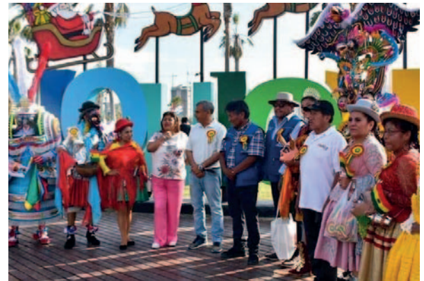
Se realizó la promoción del Carnaval de Oruro, en Chile

“Otro tema es el prototipo de la gradería, porque si bien no se hará para el Carnaval 2024, se hará más adelante. Hemos abierto la posibilidad de que nos hagan llegar sus sugerencias y lo principal ha sido que no se puede hacer rápido, pero luego hay aceptación”, sostuvo, a pesar que los propietarios de inmuebles de la 6 de Agosto, efectuaron