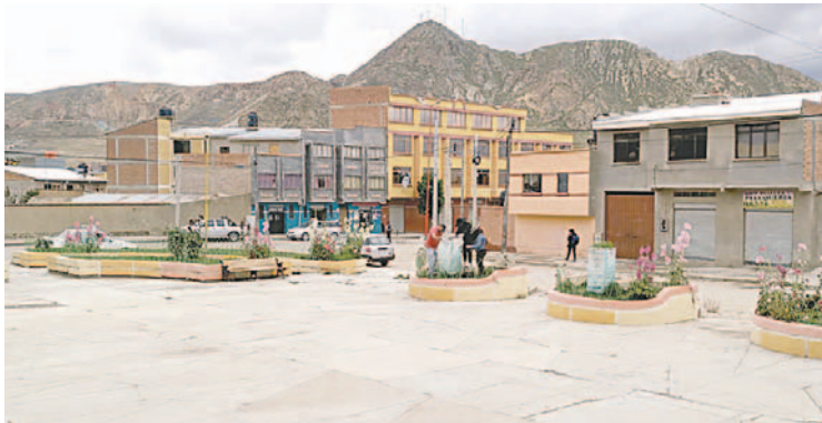
Algunos de los voluntarios durante el plantado de árboles frutales

“Nuestro plan era trabajar en la Avenida Tomás Barrón, al inicio de la ruta de entrada a la ciudad por el Monumento del Casco del Minero, pero decidimos ir a la plazuela de Chiripujio y ahí colocamos damascos, manzanos y especies exóticas como la acacia purpúrea que es muy bonita, exótica y la