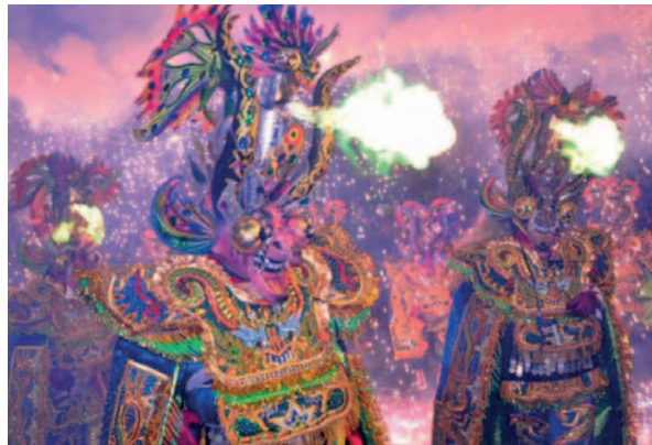
Buscan que el Carnaval mejore tras los trabajos anticipados que se hicieron

“Estamos convencidos de que hay que seguir trabajando en esa línea para poder llegar a otros lugares. Segundo elemento debo destacar el Decreto Municipal, por primera vez hemos hecho la promulgación faltando tres meses para el Carnaval y nos ha permitido vender los metros lineales, graderías, seguridad y