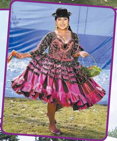
PEREGRINACIÓN La "Sociedad Folklórica de Morenos La Paz, Maravilla del Mundo en Gran Poder" inicia su peregrinación.