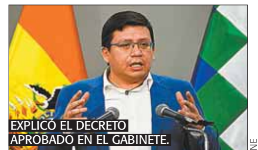
EXPLICÓ EL DECRETO APROBADO EN EL GABINETE.

Se otorgará acceso libre y gratuito a los censistas en el dominio de la plataforma del INE para capacitarse.