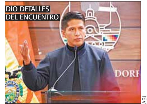
DIO DETALLES DEL ENCUENTRO

estamos convocando, hemos cursado las respectivas notas, a los jefes de Bancada, a los presidentes de ambas Comisiones y al presidente de Diputados. Si existe la predisposición y voluntad política de llevar a cabo las elecciones judiciales, seguramente estarán presentes y, nos pondremos de acuerdo entre las tres fuerzas y allanar el proceso", explicó.