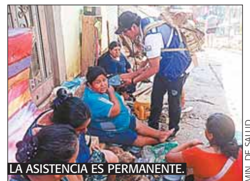
LA ASISTENCIA ES PERMANENTE.

epidemiología haciendo vigilancia, ya que con la inundación se forman charcos de agua donde se forman criaderos del mosquito transmisor del dengue. De la misma forma roedores y serpientes buscan lugares más altos para huir de las inundaciones y es allí donde los epidemiólogos hacen la vigilancia para evitar brotes emergentes por vectores.