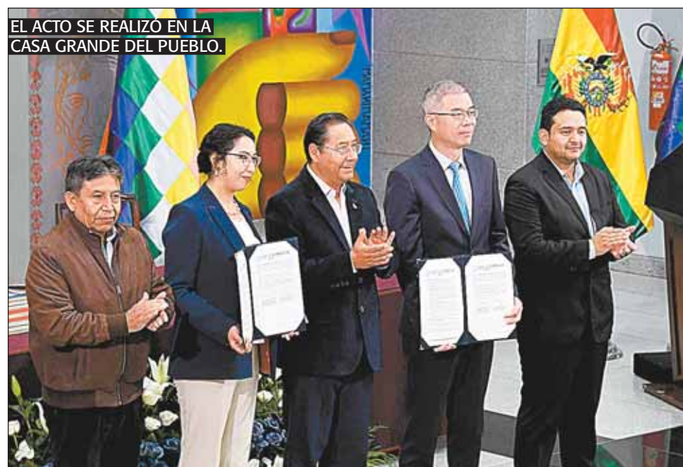
EL ACTO SE REALIZÓ EN LA CASA GRANDE DEL PUEBLO.

Dato. YLB y el consorcio chino CBC firmaron un acuerdo para producir 2.500 toneladas