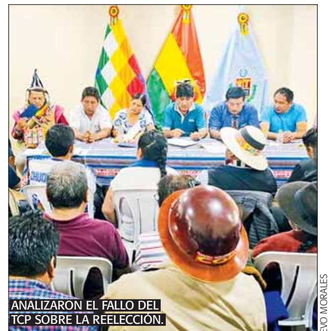
ANALIZARON EL FALLO DEL TCP SOBRE LA REELECCIÓN.

“Nos reunimos con el objeto de analizar los ataques externos de la derecha y el gobierno que buscan proscribir a nuestro instrumento político. Estamos preocupados por la crisis de la institucionalidad en nuestro país y la campaña permanente de desinformación mediática que existe en contra nuestra. El blanco del imperio y el gobierno son Evo y el MAS-IPSP”, aseguró el líder del MAS, Evo Morales en conferencia de prensa.