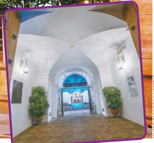
MUSEO CASA DE LA LIBERTAD

La Casa de la Libertad logrará récord de visitas