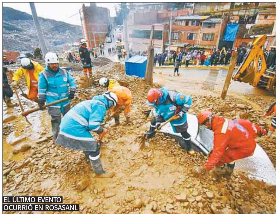
EL ÚLTIMO EVENTO OCURRIÓ EN ROSASANI.

Como no es la primera vez que ocurre un evento de estas características en el sector, la Comuna invierte seis millones de bolivianos para hacer obras de control hidráulico en la zona. “En el caso de Rosasani tenemos una Superobra que se está ejecutando desde agosto y los vecinos pueden dar fe, podemos compartir las imágenes, que son obras de control hidráulico en toda la parte superior del río Tappichuro que es