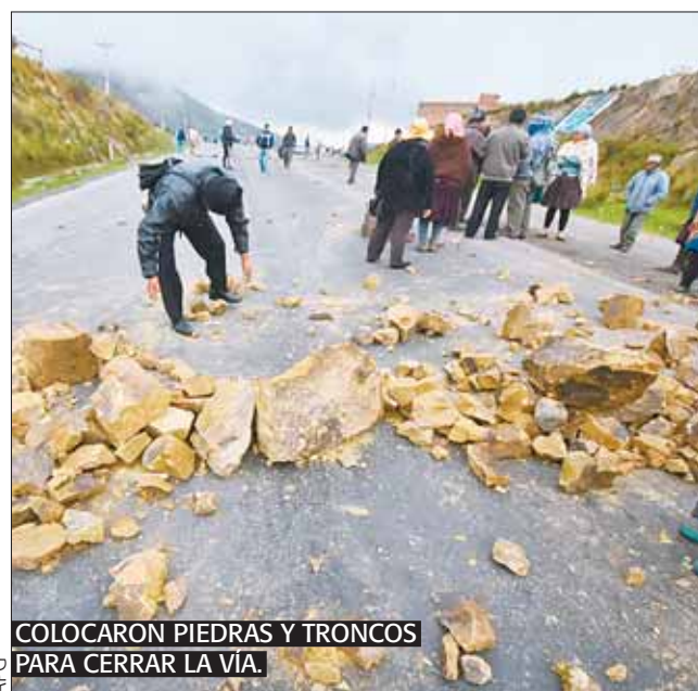
COLOCARON PIEDRAS Y TRONCOS PARA CERRAR LA VÍA.