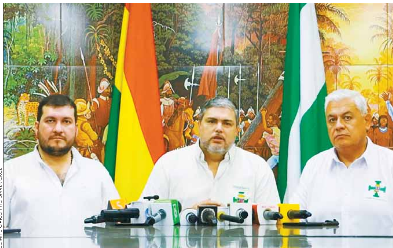
COMITÉ CÍVICO PRO SANTA CRUZ