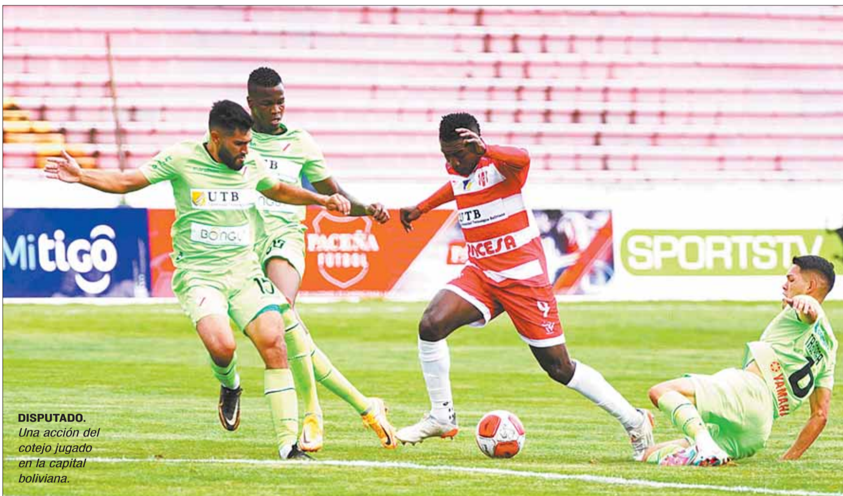
DISPUTADO. Una acción del cotejo jugado en la capital boliviana.