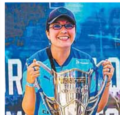
Una hincha celeste con el trofeo.

Desde las 14.00 se abrirán las puertas, por la puerta 20 ingresará el plantel. Desde las 15.00 se dará un show de los canes dentro del mismo estadio y otras más.