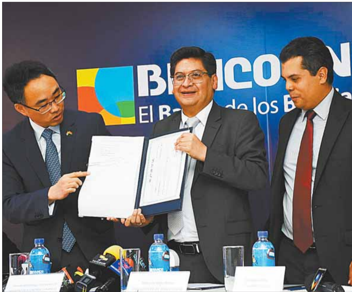
LA PAZ. El ministro de Economía (c.) junto al presidente del directorio del Unión y el embajador de China.

La autoridad consideró que la firma del acuerdo también podrá abrir un nuevo escenario de relaciones económicas con la perspectiva de generar un mayor volumen de negocios con la moneda del yuan y que Bolivia pueda ser parte de los BRICS+ (Brasil, Rusia, India, China y Sudáfrica, considerados países con economías emergentes).