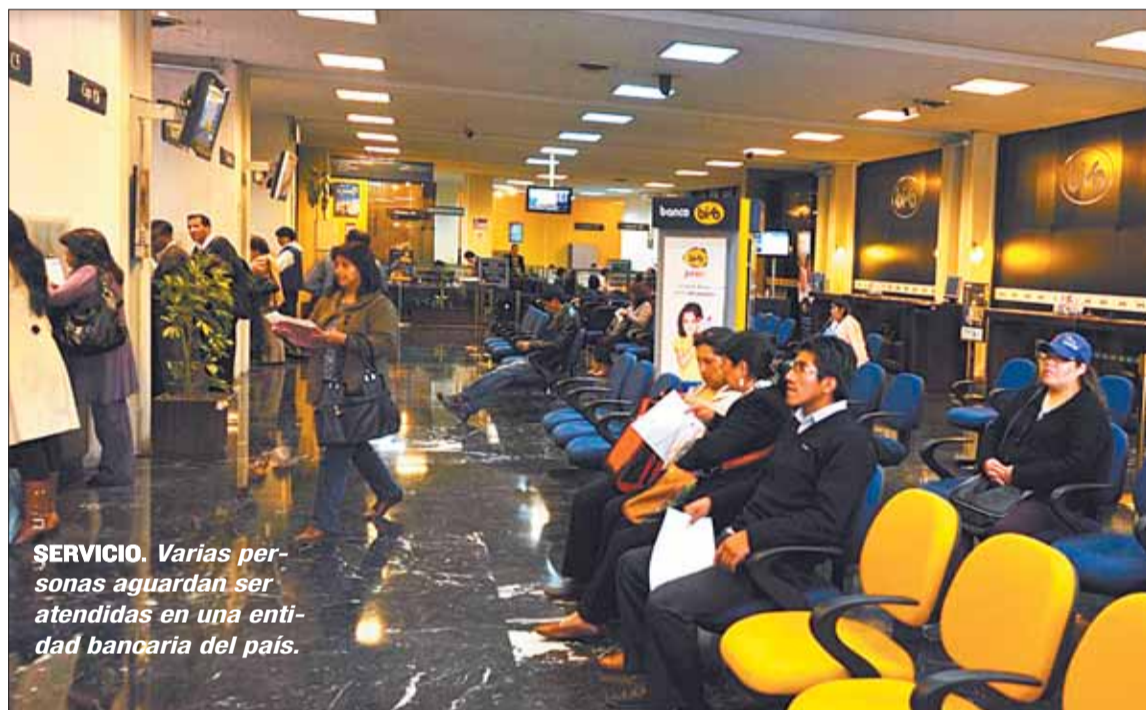
SERVICIO. Varias personas aguardan ser atendidas en una entidad bancaria del país.