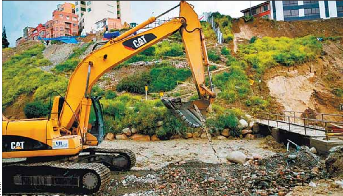
MOVILIZACIÓN. Personal municipal sale a atender emergencias, con apoyo de equipos pesados.