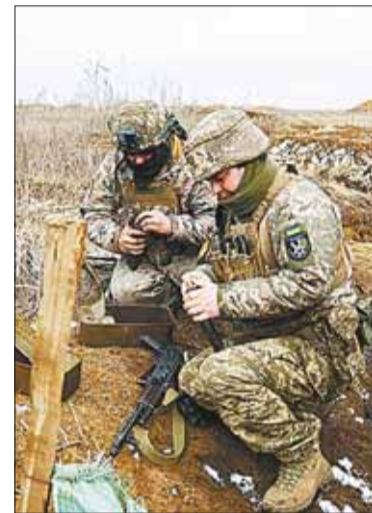
Dos años de Guerra en Ucrania.

Biden anunció una batería de medidas contra individuos vinculados al encarcelamiento del opositor Alexéi Navalni, fallecido en prisión el 16 de febrero; a la maquinaria bélica rusa, contra el sistema de pago ruso Mir y contra un centenar de entidades que ayudan a Moscú a eludir las sanciones. El demócrata volvió a pedir ayer a los congresistas republicanos que desbloqueen los fondos adicionales para Ucrania, que se está quedando sin municiones.