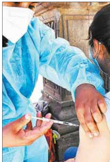
Una enfermera aplica la vacuna.

El Ministerio de Salud evaluó la cobertura de las vacunas anti COVID-19