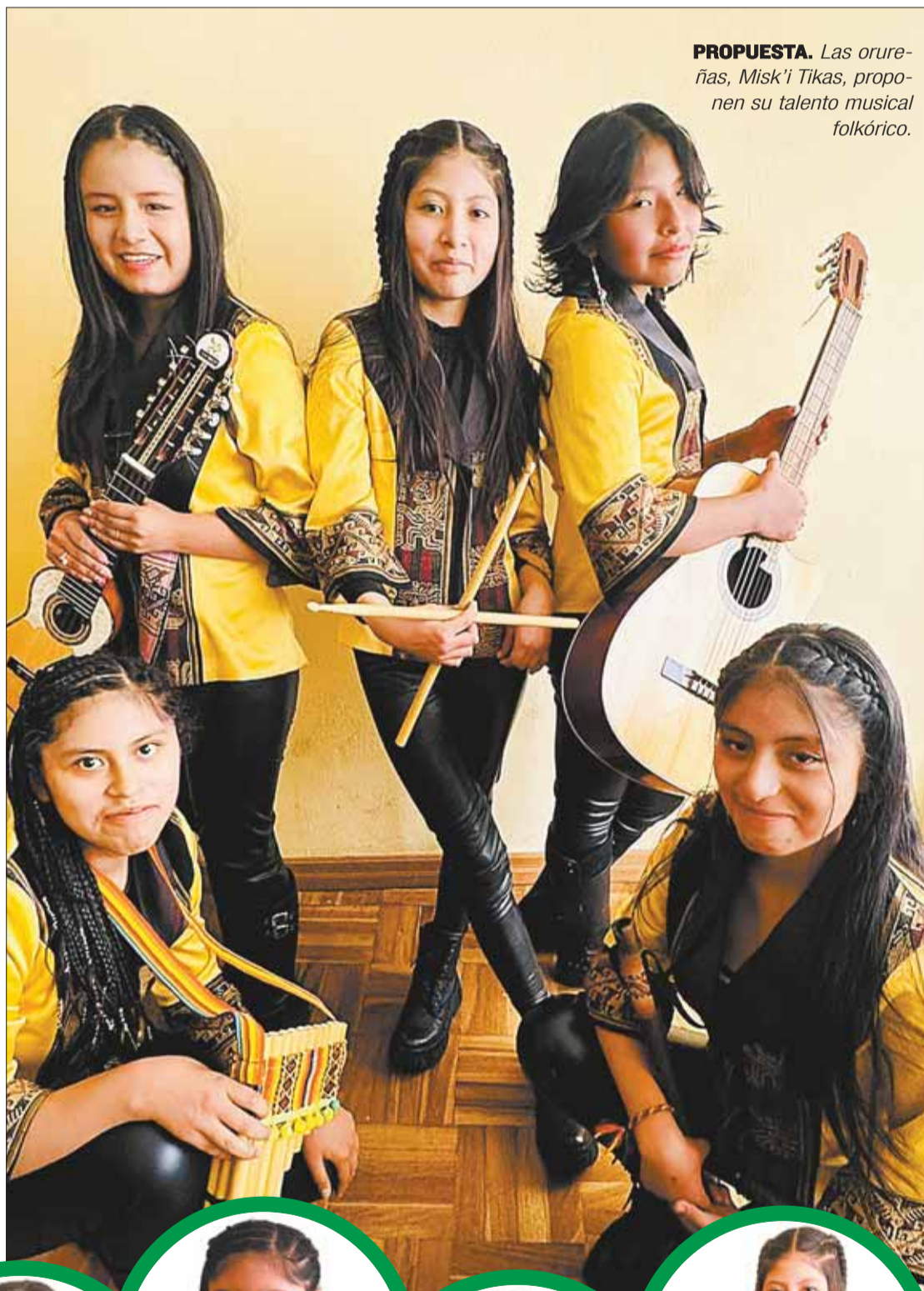
PROPUESTA. Las orureñas, Misk'i Tikas, proponen su talento musical folklórico.

El corto tiempo que tiene la agrupación Misk'i Tikas no ha