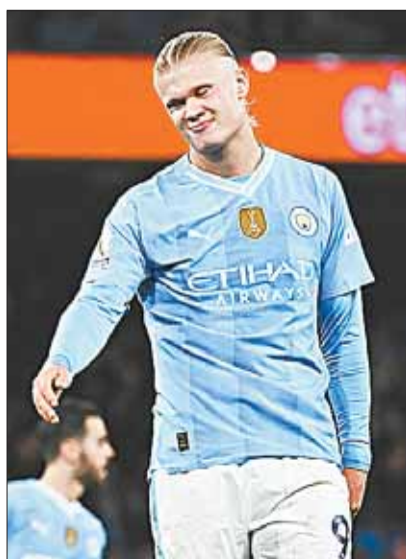
El astro noruego Erling Haaland.

Los de Guardiola tienen 56 unidades y los 'Reds' son líderes con 60 puntos