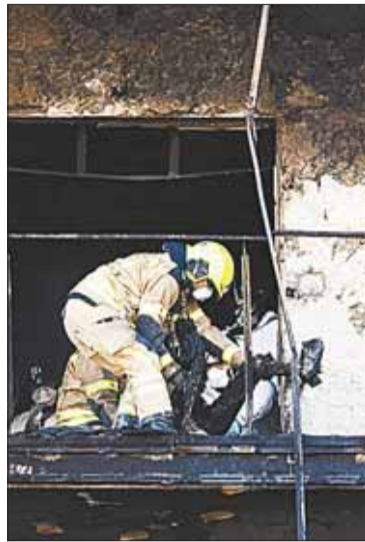
Imagen del trabajo de rescate.

MUNDO. Un grupo de bomberos logró entrar a la zona del desastre