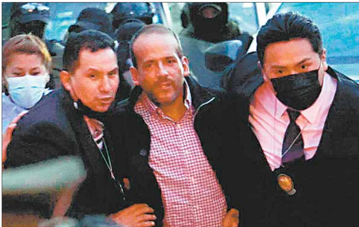
APREHENSIÓN. El gobernador de Santa Cruz, Luis Fernando Camacho, cuando fue trasladado a La Paz.

Agregó que los poderes del Estado (Judicial, Electoral, Ejecutivo y Legislativo) no deben “entrometerse ni proscribir” la personería jurídica del MAS, ni “inhabilitar” a Morales.