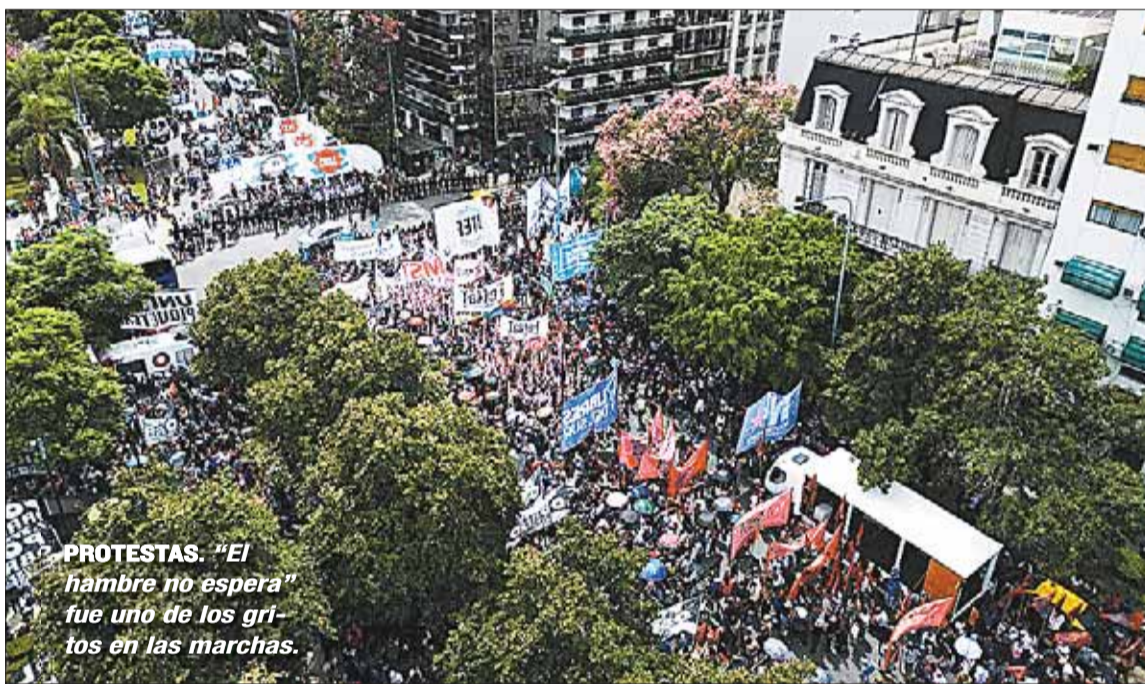
PROTESTAS. "El hambre no espera" fue uno de los gritos en las marchas.

El presidente regional de Valencia, Carlos Mazón, dijo a los periodistas que se atendieron quince personas con diversas lesiones, entre ellas siete bomberos; pero sus vidas no corren peligro, pero falta recoger más datos.