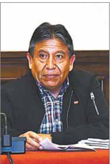
David Choquehuanca Céspedes.