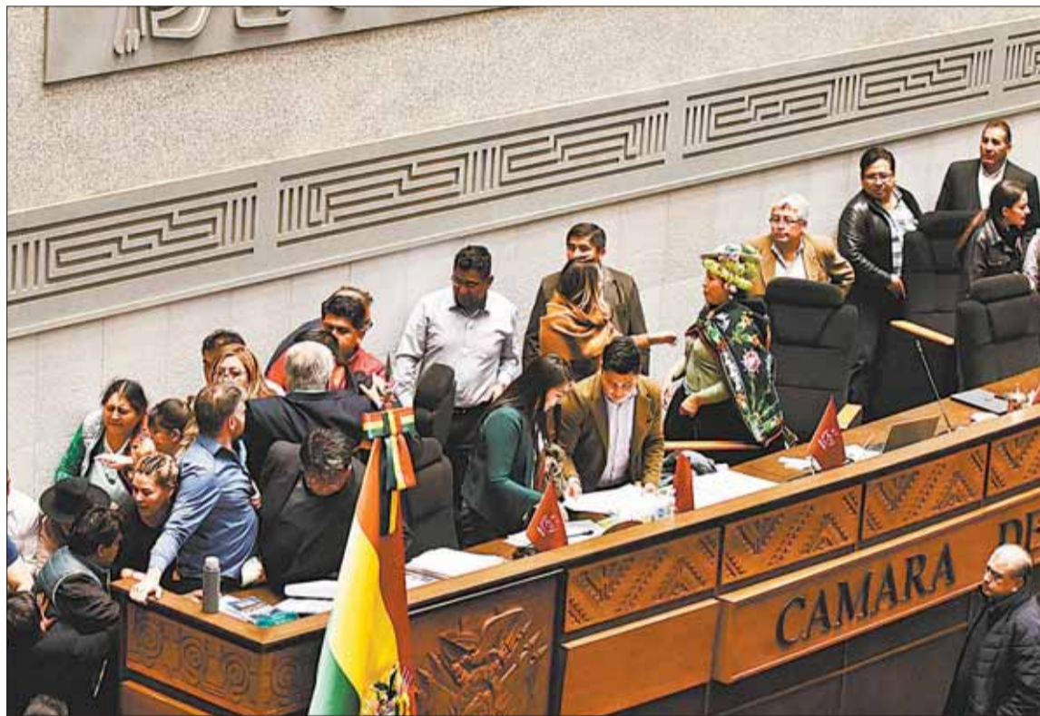
POLÉMICA. La sesión de la Cámara de Diputados tuvo agresiones físicas y verbales entre legisladores.

El jueves, la convocatoria de la presidenta en ejercicio de la Cámara Baja, Verónica Challco (MAS), derivó en una sesión en la que se dieron agresiones verbales