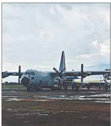
La aeronave que fue utilizada.

Se reportó la caída de lluvia en uno de los sectores al poco tiempo