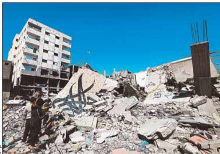
DESTRUCCIÓN. Israel quiere el control de una ciudad en ruinas.

"Ustedes son nuestros auténticos héroes del pueblo", declaró el dirigente ruso, quien, como cada año, visitó la tumba del soldado desconocido, a los pies de la muralla del Kremlin.