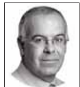
David Brooks es columnista de The New York Times.

Estados Unidos es económicamente próspero pero políticamente disfuncional. Tenemos los recursos materiales, tecnológicos y militares para seguir siendo la principal superpotencia del mundo, pero el Congreso actual es incapaz de tomar decisiones sobre cuestiones básicas, como cómo arreglar el sistema de inmigración o qué papel debemos desempeñar en el mundo.