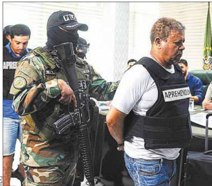
APREHENSIÓN. El narco brasileño es presentado por la Policía.