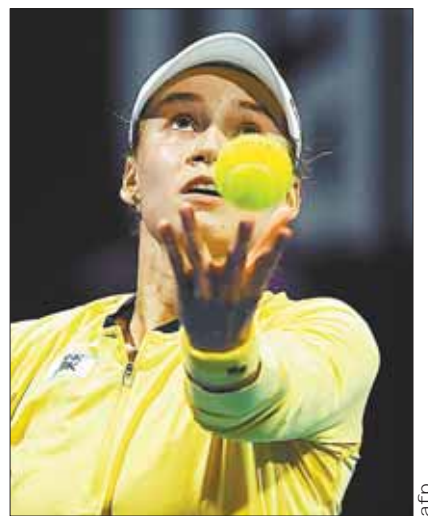
La tenista kazaja Elena Rybakina.

Swiatek se mantiene en la cima del tenis mundial, sin embargo es constantemente presionada por sus rivales que la 'amenazan' con arrebatarle ese sitio de privilegio. Precisamente Rybakina es una de las candidatas a ello.