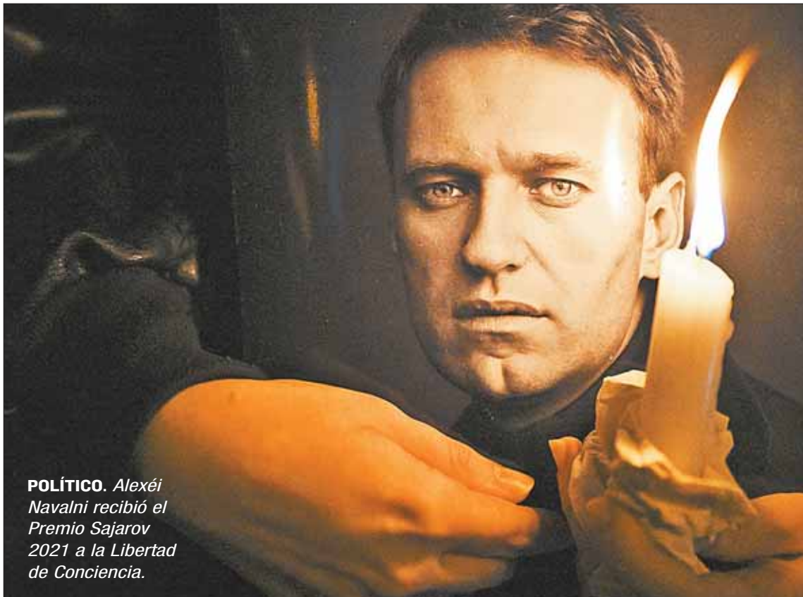
POLÍTICO. Alexéi Navalni recibió el Premio Sajarov 2021 a la Libertad de Conciencia.

Mundo. Países apuntan a Putin, gobierno de Rusia tilda de 'inaceptables' las acusaciones