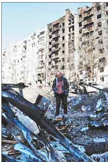
Avdiivka, al este de Ucrania.

Es la victoria simbólica más grande de Rusia desde la contraofensiva de Kiev