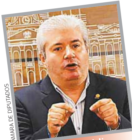
CÁMARA DE DIPUTADOS