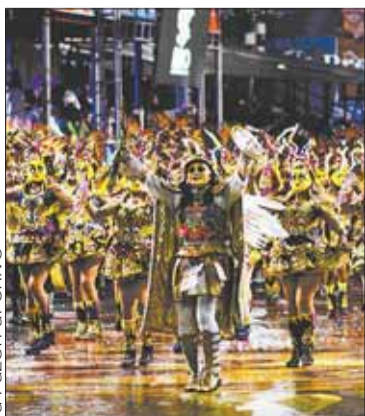
Una postal del Carnaval de Oruro.

ECONOMÍA. Es Bs 20 MM menos de lo previsto, según la ministra Orellana