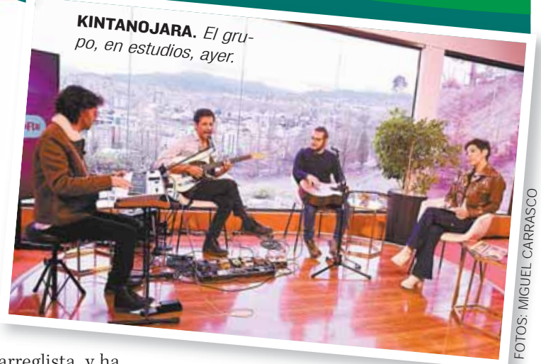
KINTANOJARA. El grupo, en estudios, ayer.