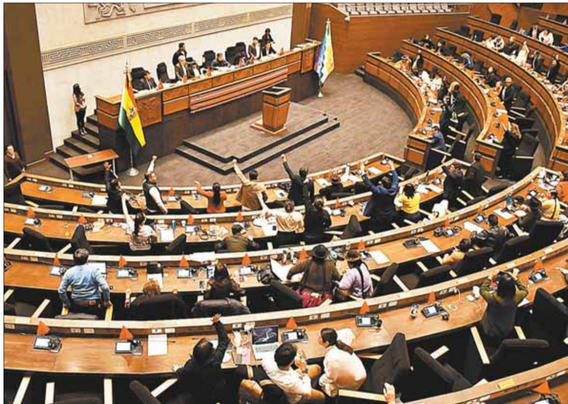
VOTACIÓN. La sesión de la Asamblea Legislativa para la aprobación de la convocatoria a las judiciales.

Nacional. Se prevé que el registro de los postulantes comience el martes