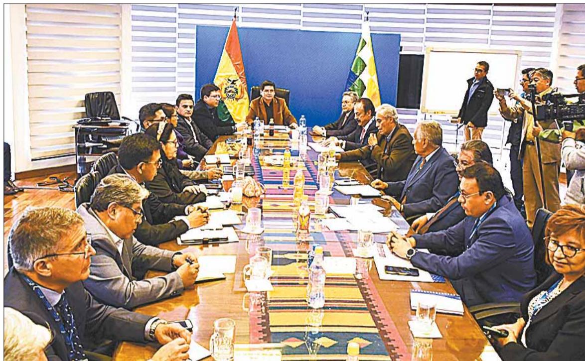
LA PAZ. El encuentro entre las autoridades del Gobierno con los representantes de los empresarios.

Durante la reunión, los empresarios privados hicieron conocer la problemática que atraviesan sus agremiados para obtener dó-