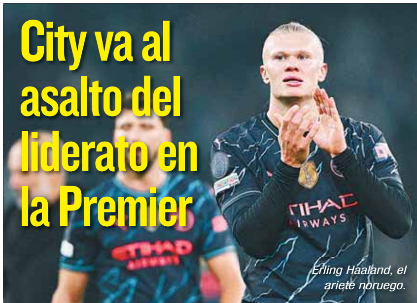
Erling Haaland, el ariete noruego.

Hoy (13.30 HB) jugará frente al Chelsea y el martes con Brentford