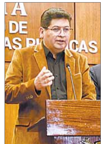
El Ministro de Economía.