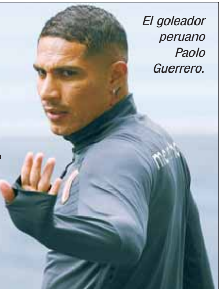
El goleador peruano Paolo Guerrero.

El delantero renunció a su continuidad en el peruano César Vallejo