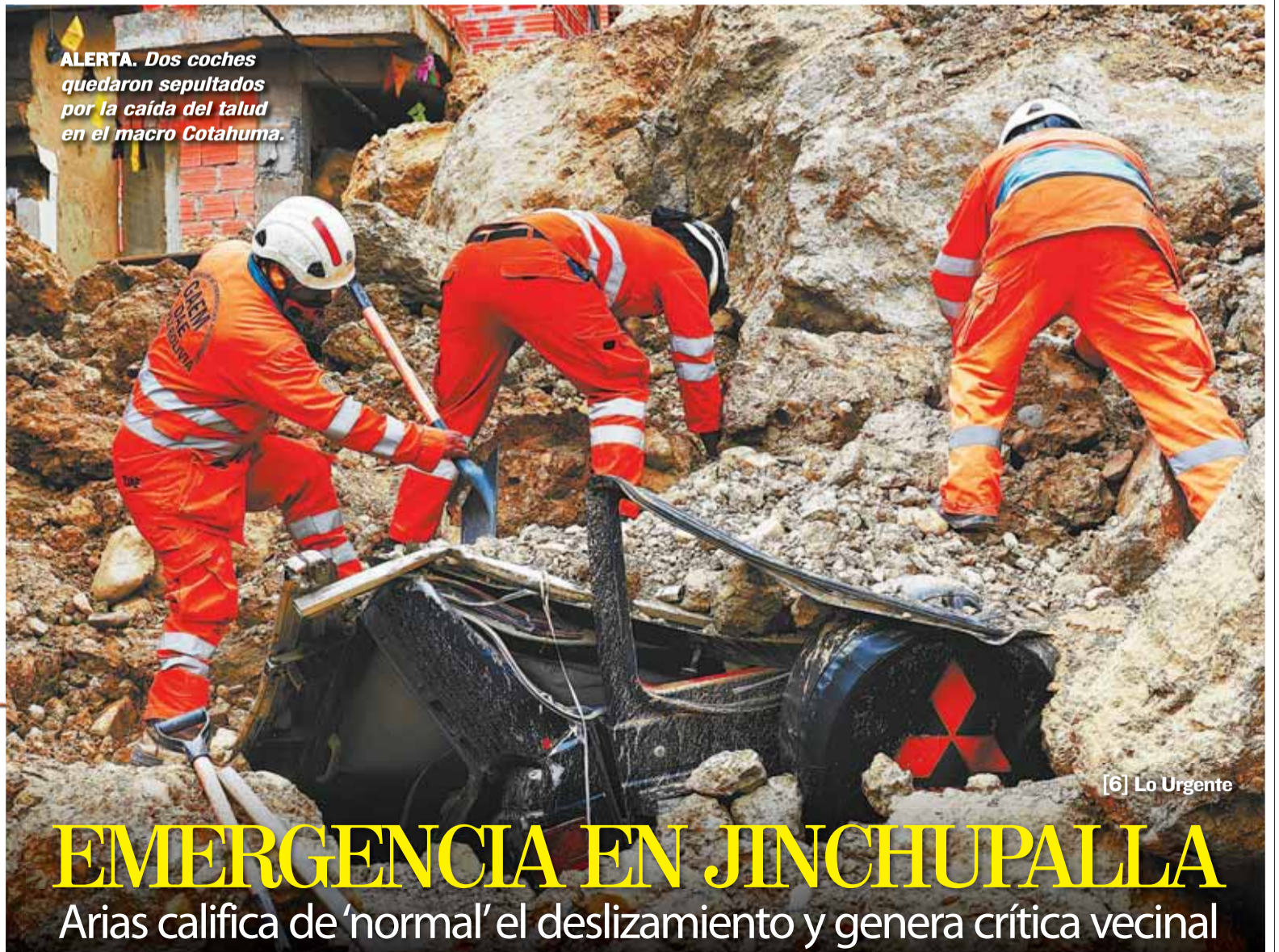
ALERTA. Dos coches quedaron sepultados por la caída del talud en el macro Cotahuma.

Polémica por la muerte del opositor ruso Alexéi Navalni