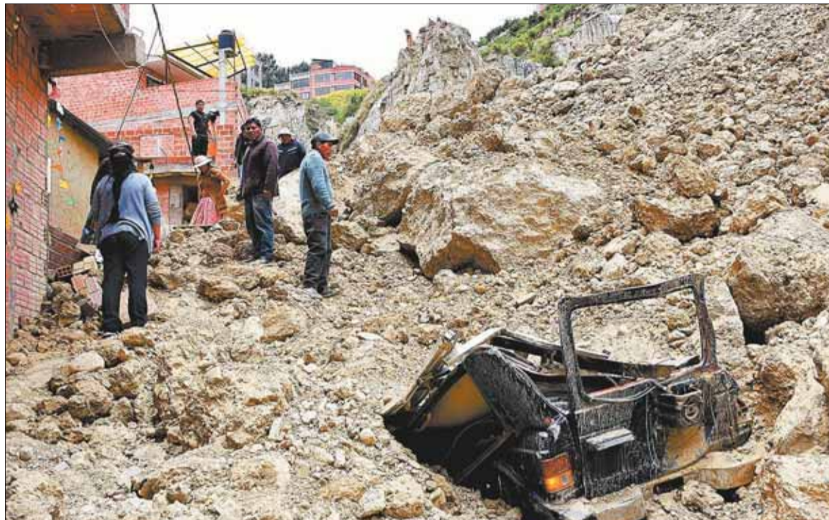
TALUD. El personal de la Alcaldía de La Paz llegó a brindar atención tras el deslizamiento de tierra.

"Es lamentable escuchar a la primera autoridad municipal de que esta situación es normal, porque hay reportes de los vecinos que tienen toda la razón de recla-