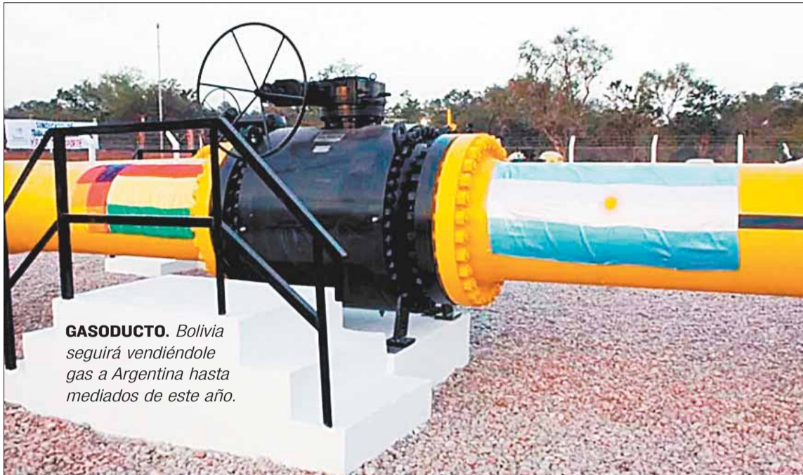
GASODUCTO. Bolivia seguirá vendiéndole gas a Argentina hasta mediados de este año.