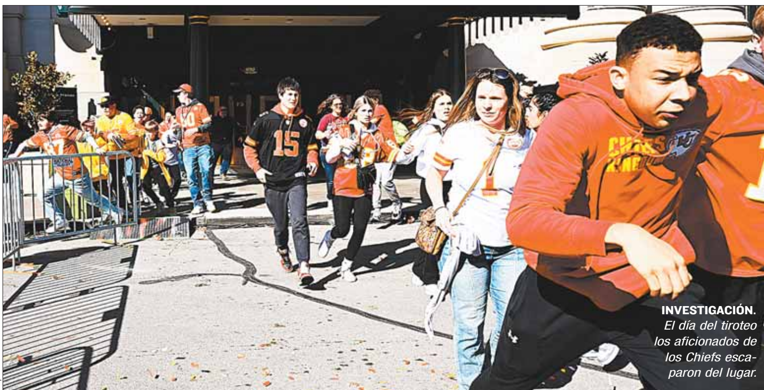
INVESTIGACIÓN. El día del tiroteo los aficionados de los Chiefs escaparon del lugar.