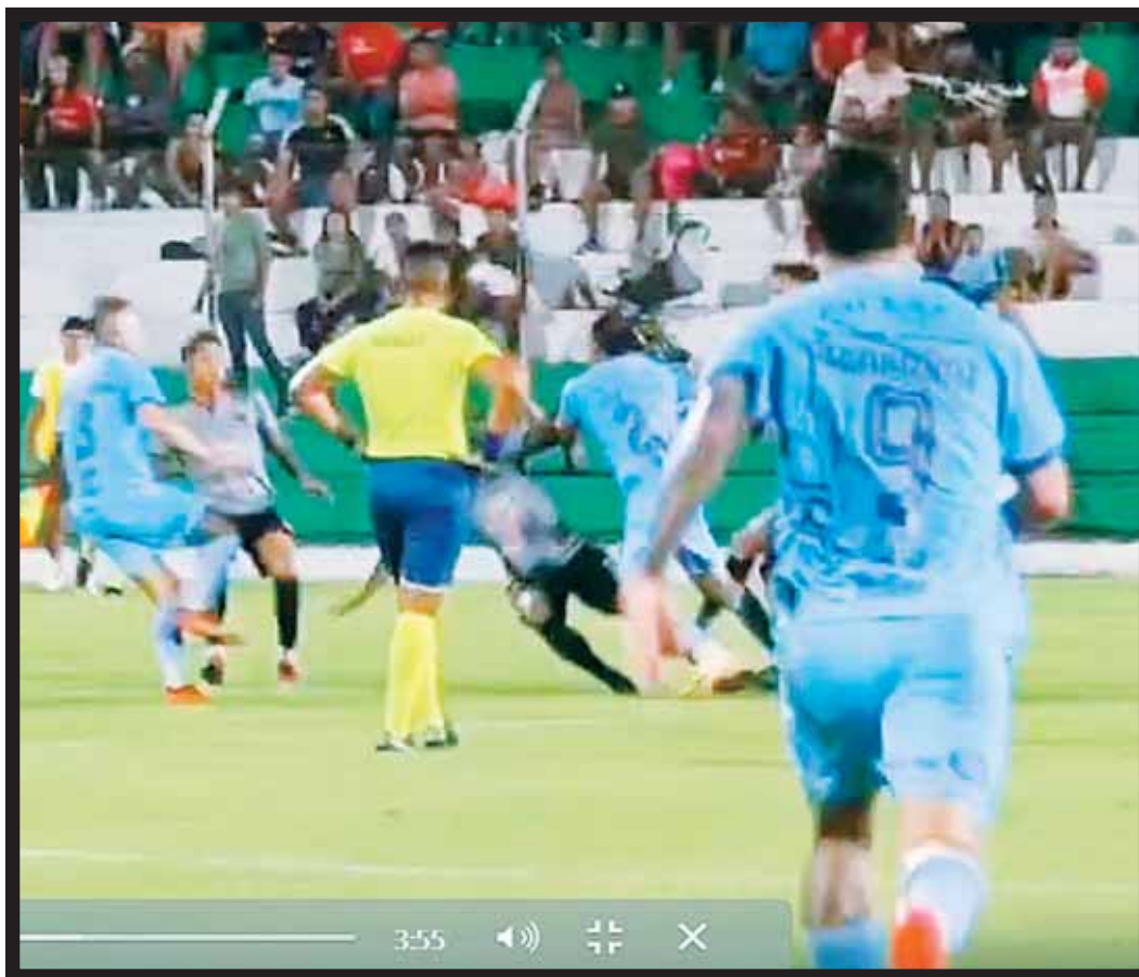
BATALLA. Momento de la pelea entre jugadores de Bolívar y Guabirá