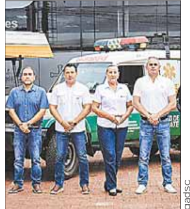
Autoridades de la Gobernación.

“Referente a tránsito, no beba si conduce, no use el celular mientras conduce, y si va a trasladarse a las provincias no exceda la velocidad y evite los accidentes” re-