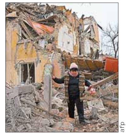
Los ataques en Ucrania.

El presidente ucraniano, Volodimir Zelenski, destituyó ayer al comandante en jefe de las Fuerzas Armadas, en la mayor reorganización del liderazgo militar desde el inicio de la invasión rusa hace casi dos años. Valeri Zaluzhni, de 50 años, comandante en jefe desde julio de 2021, se convirtió en una figuras en Ucrania.