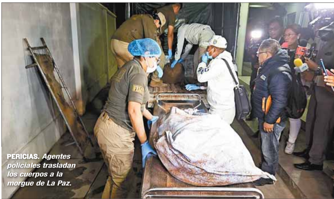
PERICIAS. Agentes policiales trasladan los cuerpos a la morgue de La Paz.