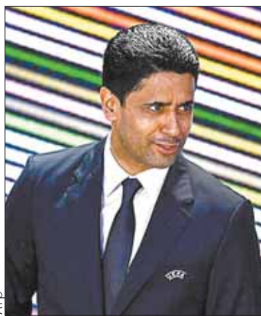
El esloveno Aleksander Ceferin.

El texto no suprime el límite de tres mandatos, una de las medidas clave tomadas en abril de 2017 por Ceferin tras la oleada de restricciones definidas en FIFA.