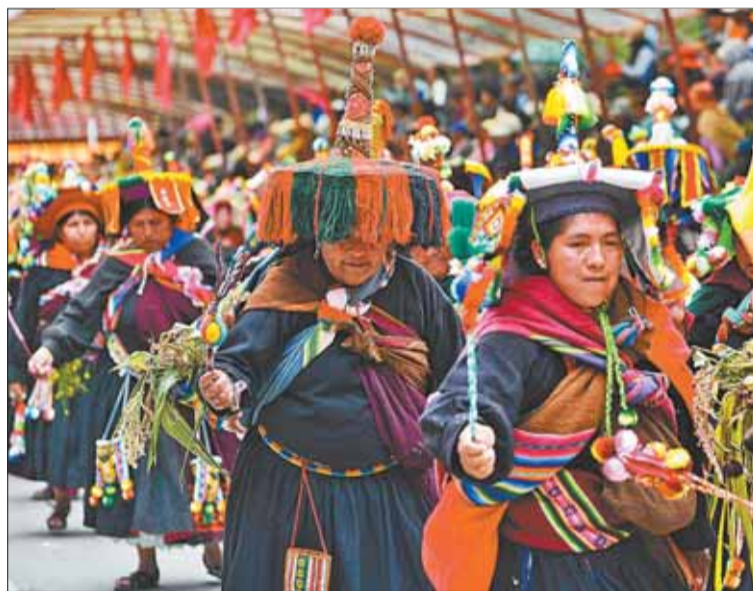
DIVERSIDAD. Comunitarios mostraron la diversidad cultural.