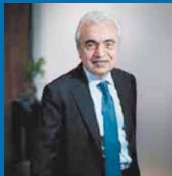
Fatih Birol Director ejecutivo de la AIE

India está dando pasos increíbles al impulsar los combustibles renovables y la bioenergía