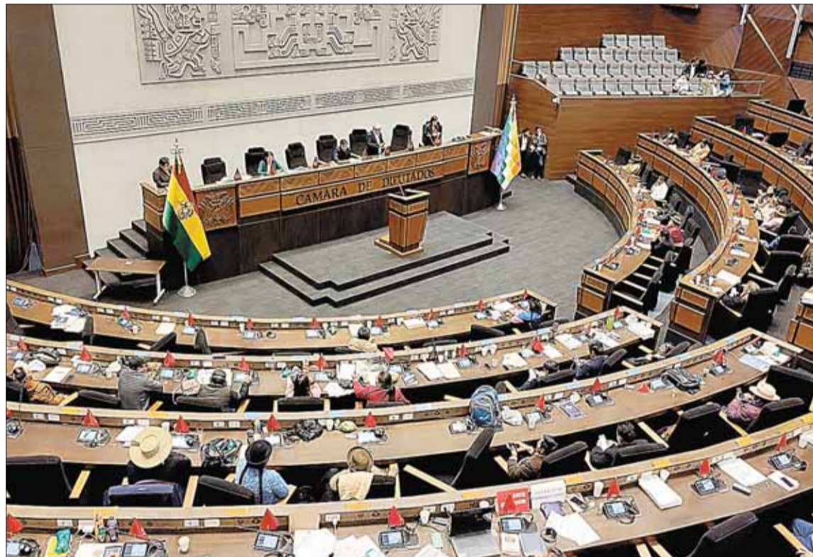
SIN ACUERDO. La sesión ordinaria de ayer en la Cámara de Diputados, en la ciudad de La Paz.

Ante ello, se determinó la suspensión de la sesión. "Se comunica a las diputadas y diputados que la 48 sesión ordinaria fijada para el día de hoy jueves 8 de febrero de 2024, queda suspendida en