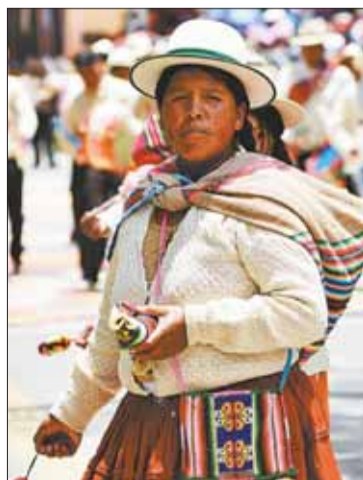
Mujeres muestran su identidad.