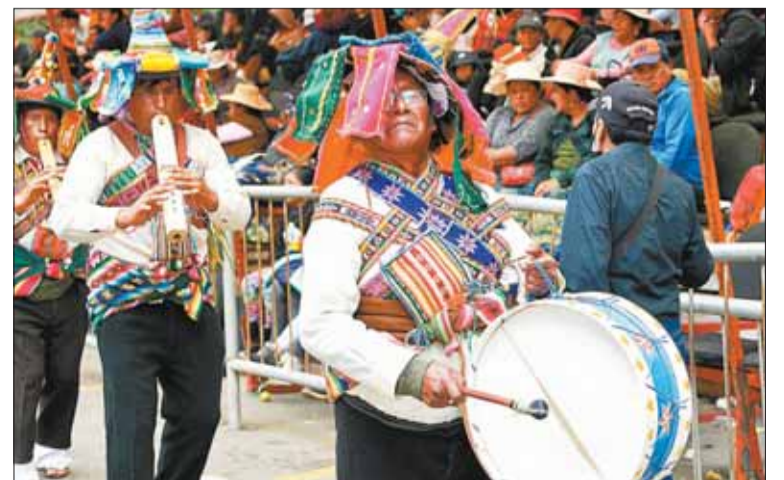
CULTURA. Los pueblos originarios expresan sus tradiciones.

enfoque descolonizador, sin racismo y sin discriminación.