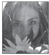
Verónica Rocha Fuentes es comunicadora. Twitter: @verokamchatka

Que Nayib Bukele haya ganado las pasadas elecciones generales en El Salvador fue solo la comprobación de un hecho que, de alguna manera, esperábamos en el continente. Lo sorprendente fue el uso que le dio a la fuerza otorgada por el porcentaje de votación que obtuvo, utilizándola para legitimar un postulado sobre la democracia que presume que la misma puede existir con un partido único. Así, la última semana, hemos asistido al hecho de que un líder emergente de las urnas tenga como primerísimo acto de gobierno, informar al mundo su propósito de ensayar un experimento que prescindiera de la democracia (en su nombre) y que vaya “más allá de ella”.