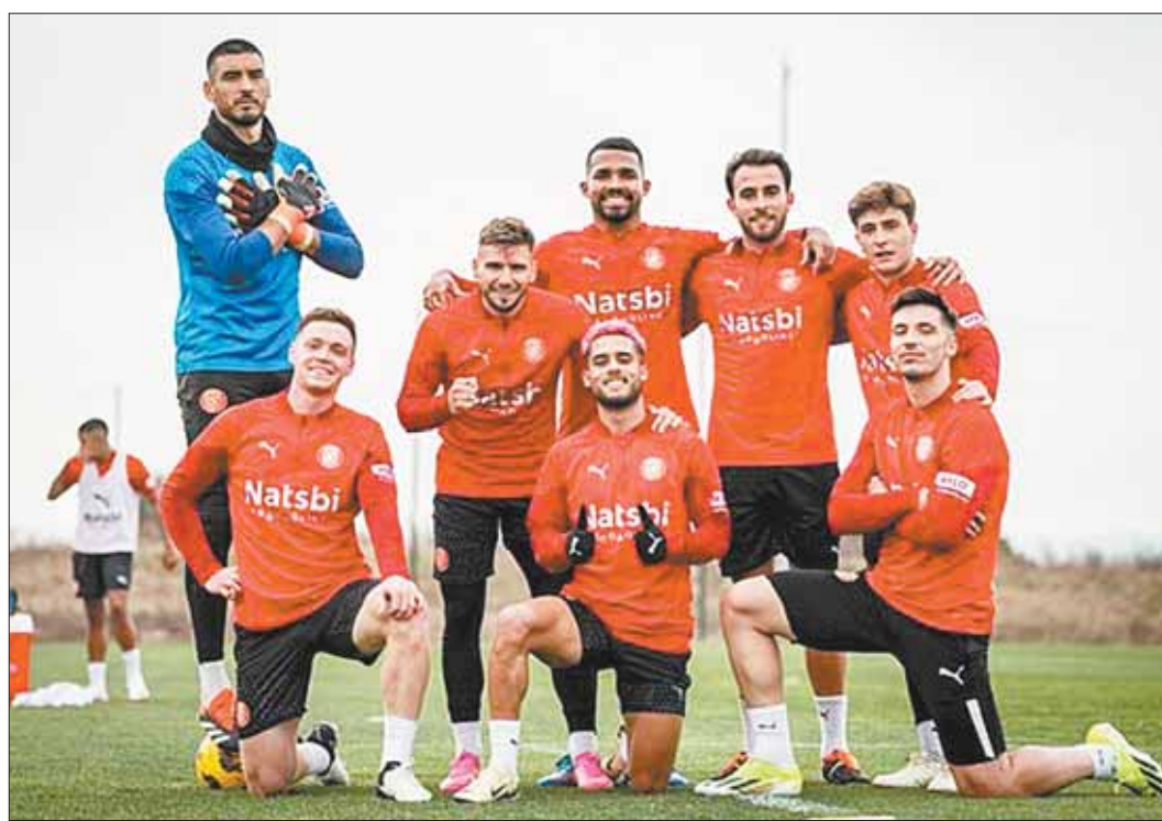
ENTRENAMIENTO. Los jugadores de Girona durante una práctica en su centro de preparación.