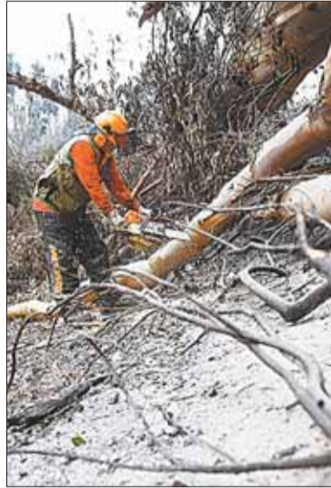
Quieren volver a levantarse.

MUNDO. La mayoría de las casas quemadas eran de madera y de gente pobre