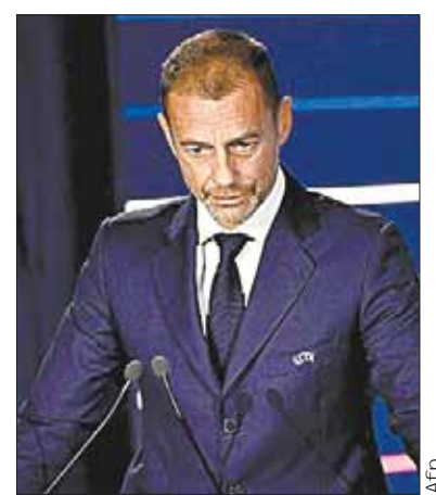
El dirigente Nasser Al Khelaifi.

El propio ayuntamiento pidió modernizar el recinto deportivo "bajo el contexto de un plan satisfactorio para todos".