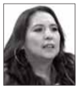
Julia Susana Ríos Laguna es viceministra de Transparencia Institucional y Lucha Contra la Corrupción.

En la presente nota me permito poner a consideración del lector, los avances en la implementación de las TIC (Tecnologías de la Información y la Comunicación) en 2023, para cumplir con la Política Plurinacional de Lucha Contra la Corrupción “Hacia una Gestión Pública Digitalizada y Transparente”, aprobada mediante el Decreto Supremo 4872, del 2 de febrero de 2023, a fin de socializar el trabajo desarrollado en este periodo y su importancia para mejorar la gestión.