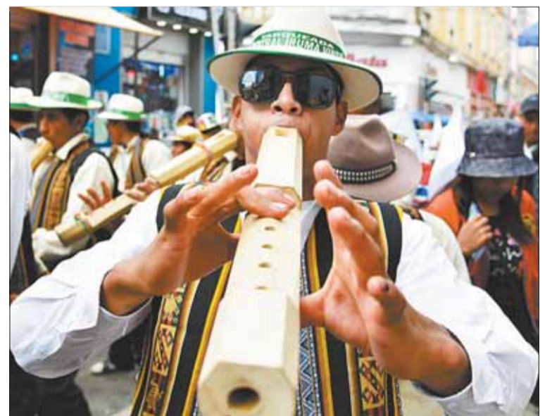
DANZA. Hombres, mujeres y niños participaron en el Anata.