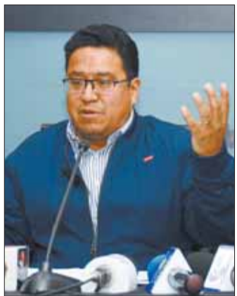
El procurador César Siles.

Explicó que el TCP es la única instancia en el país que puede realizar una interpretación sobre la Constitución y que "no cabe contra sus decisiones un recurso ulterior".