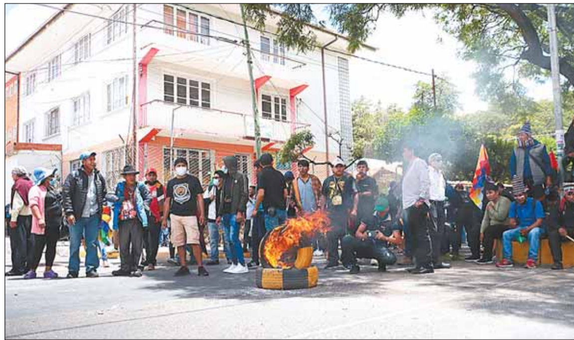
SUCRE. La movilización de sectores evistas en la capital, frente a la sede del Tribunal Constitucional.

Organizaciones que respaldan a Evo Morales anunciaron un bloqueo nacional desde el lunes, demandando la realización de elecciones judiciales y la renuncia de magistrados