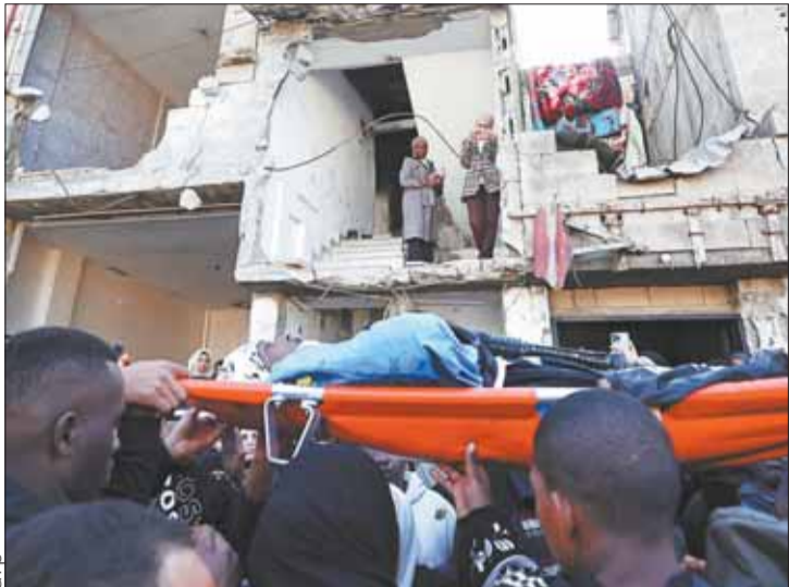
ATAQUES. La cifra de muertes en Gaza sube a 24.762.