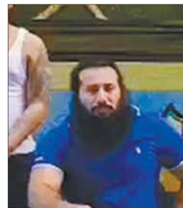
Fito, el más buscado.

La ministra de seguridad argentina, Patricia Bullrich, informó que la familia de Fito fue apresada en un barrio privado en la provincia de Córdoba. Ahora no se sabe cuál será su futuro.