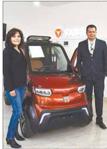
Un vehículo eléctrico Quantum.

Para acelerar la electromovilidad, el Gobierno dispuso la instalación de electrolinerías (Estaciones de Recarga) en La Paz, Cocha-