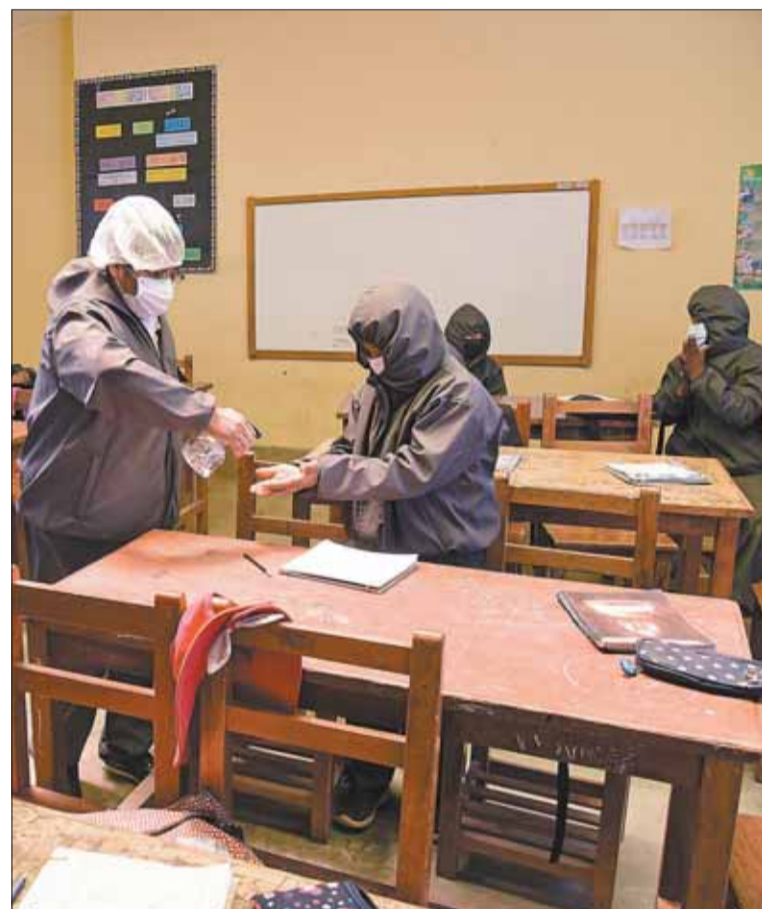
CUIDADO. Estudiantes usan barbijos como medida de bioseguridad.

pectativa el inicio de la gestión educativa 2024 que, para él y las nuevas autoridades educativas, constituye “un desafío muy grande para mejorar los aprendizajes y la calidad educativa en el país”.