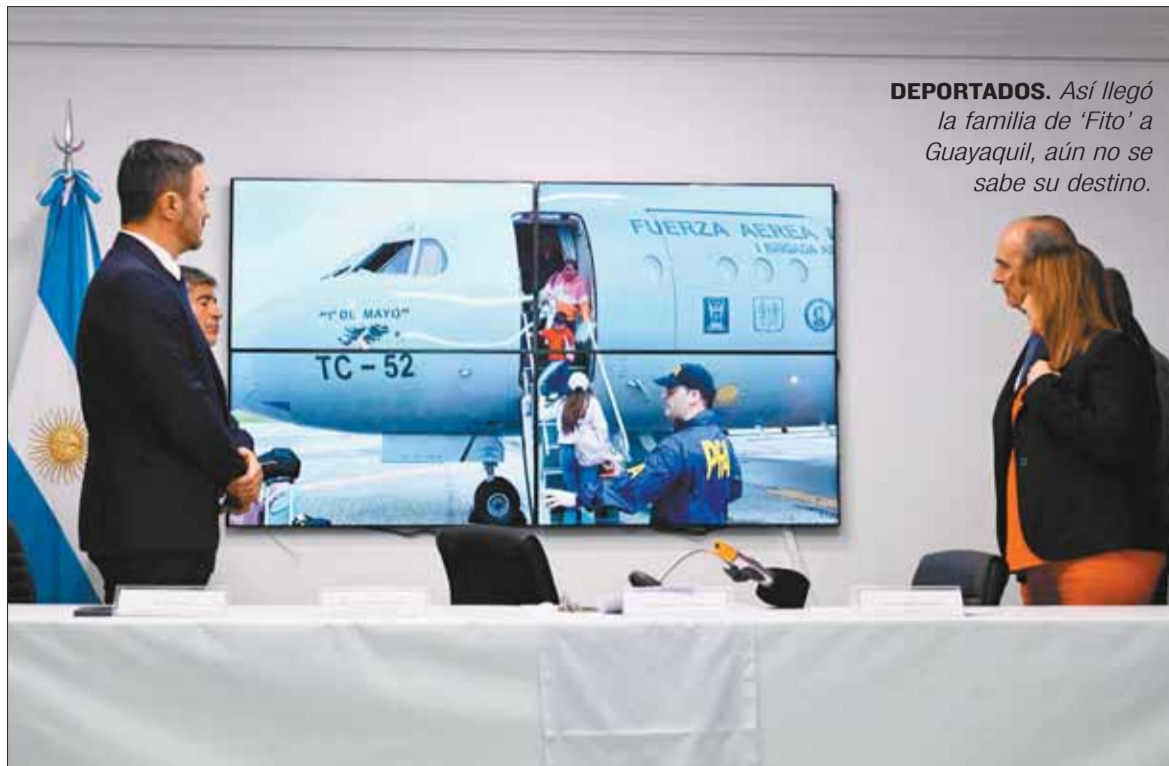
DEPORTADOS. Así llegó la familia de 'Fito' a Guayaquil, aún no se sabe su destino.

Bullrich compartió en su cuenta de la red X imágenes en las que se observa a la familia bajar de un pequeño avión de la Fuerza Aérea Argentina, y luego algunos agentes revisan sus maletas. De acuerdo con medios ecuatorianos, la