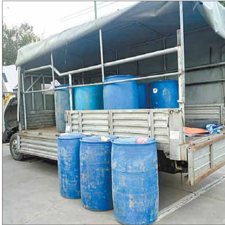
ILEGAL. Los turriles que se usaban para almacenar el combustible.

No fue el único operativo en Cochabamba, pues el director de la ANH informó también sobre el hallazgo de dos motorizados que realizaban carguíos irregulares en tres estaciones de servicio.