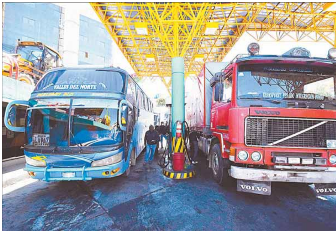
COMBUSTIBLE. Motorizados del transporte de carga y pasajeros realizan el carguío de diésel oil.

El procurador General del Estado, César Siles, informó ayer que se remitió una nota al TJCA en el que se hace conocer el cumplimiento de la sentencia emitida en julio de 2023, que establece un trato igualitario en la comercialización de combustible a los transportistas de los países miembros de la Comunidad Andina. La demanda fue presentada por el go-