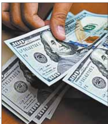
Envío de remesas es en dólares.

El ente emisor no cobrará a las entidades financieras ningún tipo de comisión