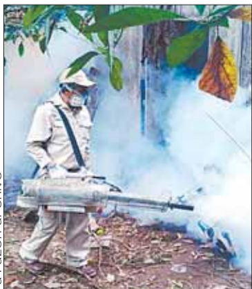
Brigadas realizan la fumigación.

SOCIEDAD. El Sedes La Paz organizó 16 brigadas para controlar la enfermedad