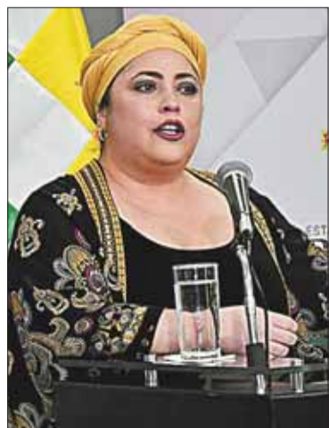
La ministra María Nela Prada.

Prada: Bloqueos buscan dar un golpe de Estado