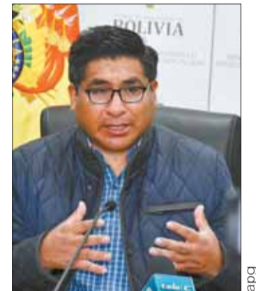
El ministro Néstor Huanca.

El ministro de Desarrollo Productivo y Economía Plural, Néstor Huanca, afirmó que ese anuncio ocasiona que mayoristas e intermediarios de alimentos comiencen a especular con el precio en desmedro de las amas de casa y la población.