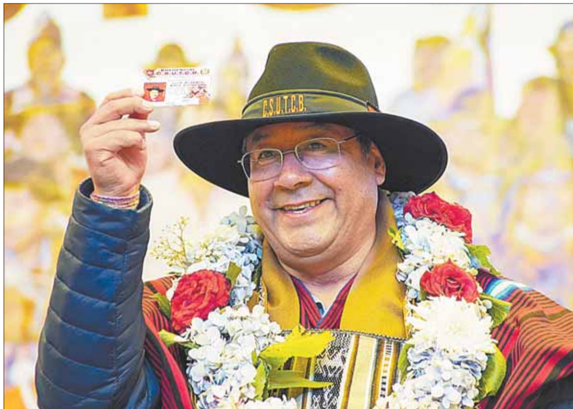
LA PAZ. EL presidente Luis Arce, en la inauguración del ampliado de la CSUTCB, en Achocalla.

El jefe del Estado se refirió de esa manera al acuerdo entre el bloque evista del Movimiento Al Socialismo (MAS), al que se refirió como "nueva derecha", y la oposición, compuesta por las alianzas Comunidad Ciudadana (CC) y Creemos.