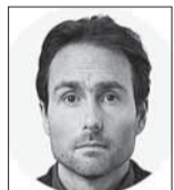
David Wallace Wells es columnista de The New York Times.

Es notoriamente complicado sintetizar los datos de todas las estaciones meteorológicas del mundo en una sola medida del calentamiento global, pero todos los grandes esfuerzos para hacerlo para 2023 ya están en marcha, y también todos están en preocupante alineación: el año pasado fue el más cálido registrado en la historia moderna, y rompió ese record por un margen extremadamente grande, un margen que la ciencia climática convencional aún no ha logrado explicar adecuadamente.