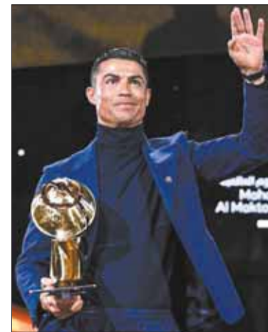
El portugués Cristiano Ronaldo.

En la clasificación del grupo, Cabo Verde se aseguró el liderato ya que domina con sus 6 puntos, por delante de Egipto (2°, 2 puntos), que tiene a Mohamed Salah lesionado y será baja dos partidos, según el reporte.