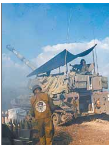
Israel también ataca a Hezbolá.

El ataque en Beirut "es grave y no quedará sin respuesta", advirtió Hassan Nasrallah en un discurso televisado, asegurando que su movimiento va a "responder" en