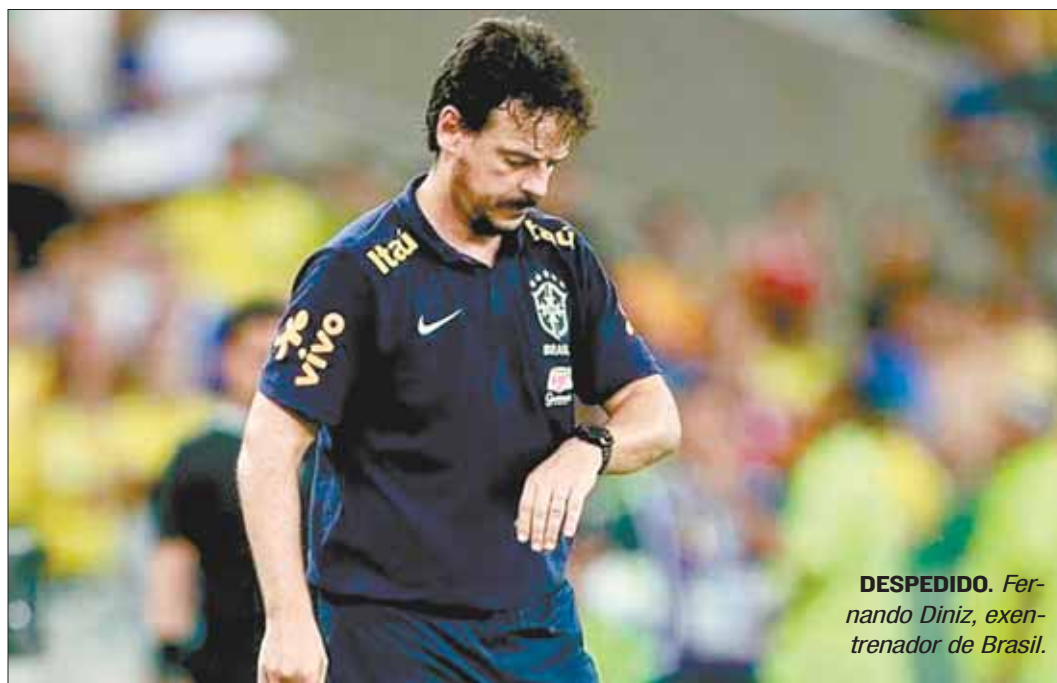
DESPEDIDO. Fernando Diniz, exentrenador de Brasil.