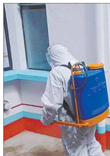
Aplican plan de fumigación.

Arispe comentó que en época de lluvias los insectos abundan,