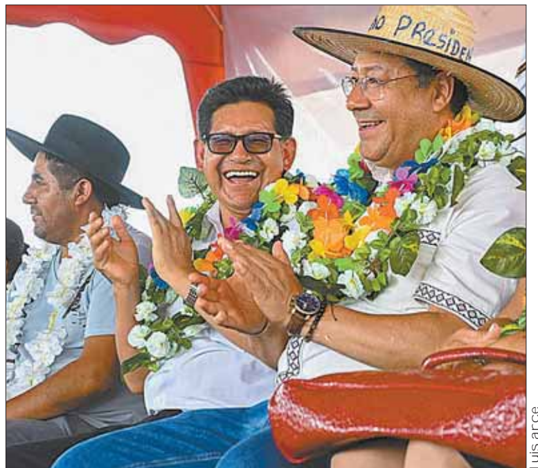
ACTO. Arce entregó un tramo carretero en el departamento de Beni.

Además, explicó que el origen de la droga es el departamento de Santa Cruz, sin embargo señaló que las investigaciones de este caso “van a seguir”.