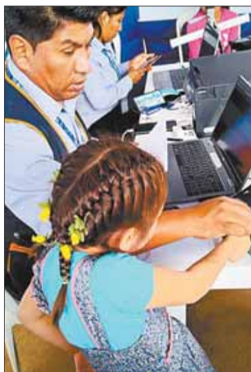
La carnetización a un niño.

SOCIEDAD. El documento se entrega de forma gratuita a los menores