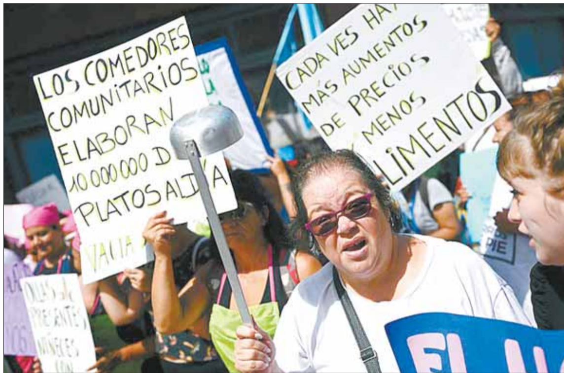
PRESIÓN. Manifestantes sostienen carteles y ollas vacías afuera del hotel donde reside el presidente Milei.

En el país rige un duro protocolo “antipiquetes”, que no solo impide los cortes de la vía pública, sino que cobra a las organizaciones sociales por los despliegues policiales que acordonan las protestas.