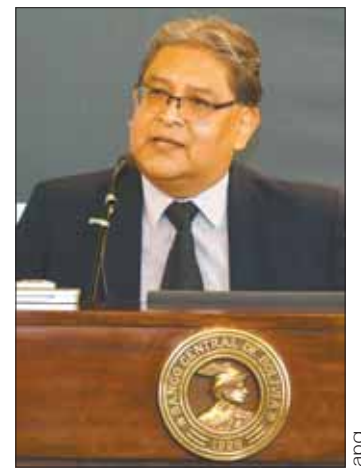
El presidente del BCB.

“El tema del litio, que ya vamos a empezar a exportar una cantidad importante, y de seguro con las provisiones tecnológicas que nos den otros socios que tienen tecnología para la Extracción Directa del Litio (EDL), estaremos con otros niveles de ingreso en dólares en 2025, 2026, cercanos a los 3.000 (millones), 4.000 millones de dólares”, aseguró.