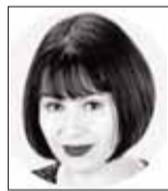
Michelle Goldberg es columnista de The New York Times.

Dos miembros de extrema derecha del gabinete de Israel —el ministro de seguridad nacional, Itamar Ben-Gvir, y el ministro de finanzas, Bezalel Smotrich— causaron un revuelo internacional con sus llamados a despoblar Gaza. "Si en Gaza hay 100.000 o 200.000 árabes y no dos millones, toda la conversación sobre 'el día después' será diferente", dijo Smotrich, quien pidió que la mayoría de los civiles de Gaza sean reasentados en otros países. La guerra, dijo Ben-Gvir, presenta una "oportunidad para concentrarse en alentar la migración de los residentes de Gaza", facilitando el asentamiento israelí en la región.