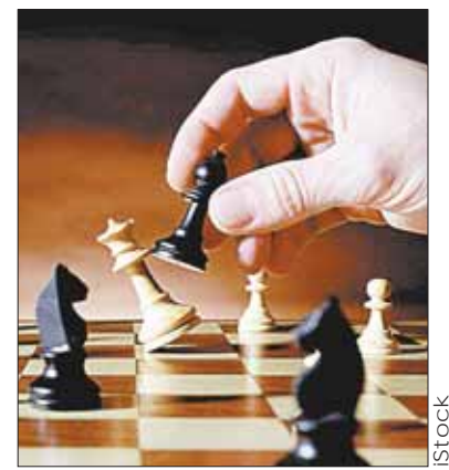
Tablero de ajedrez.

Los de Intermedio tendrán los martes, jueves y sábado (de 16.30 a 18.00 y de 18.00 a 19.30); los de Avanzado serán los lunes, miércoles y viernes (de 17.00 a 19.00).