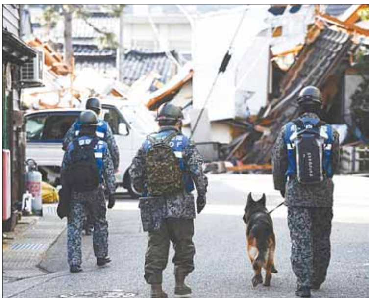
DRAMA. La búsqueda de víctimas sigue en el sismo en Japón.

Mundo. La búsqueda de víctimas sigue, pero hay menos opción de hallar sobrevivientes