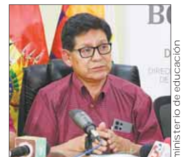
El ministro Édgar Pary.

El ministro adelantó que las recomendaciones sanitarias para el inicio de clases se realizarán en coordinación con el Ministerio de Salud. Éstas se darán a conocer a la población a la brevedad.