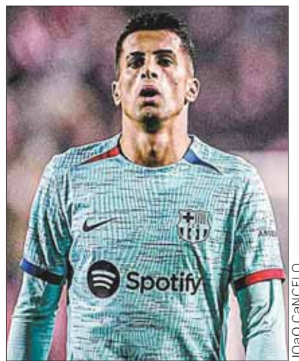
Joao Cancelo, jugador del Barcelona.

Antes de afrontar la Supercopa de España (10-14 de enero en Riad), Barça y Real Madrid arrancan este fin de semana su andadura en la Copa del Rey 2023-2024 en la ronda de dieciseisavos de final y serán favoritos contra dos formaciones de la cuarta categoría, Barbastro y Arandina, respectivamente.