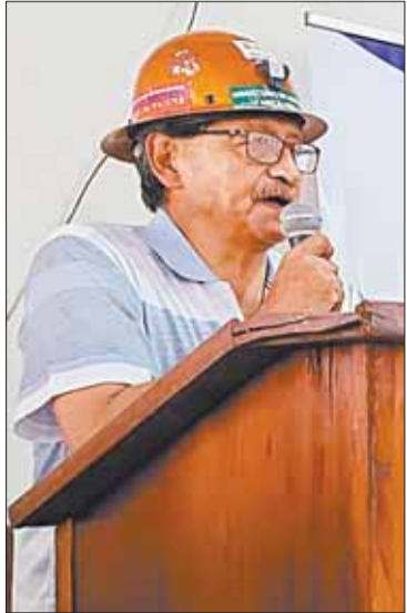
Quispe, el ministro de Minería.

Es para comercializar con el metal y luego venderlo al Banco Central de Bolivia