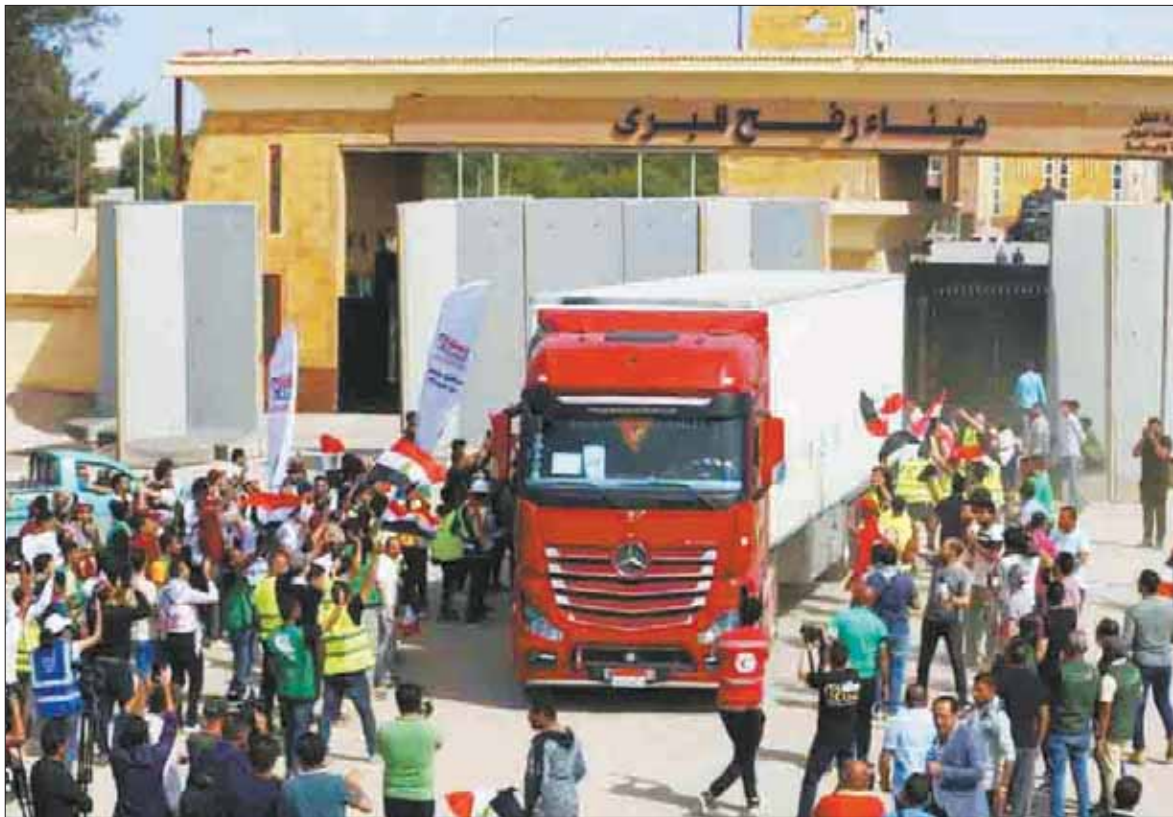
MEDIDAS. La ayuda a Gaza llega, pero no como quiere la ONU y pide abrir más pasos libres.

Según el plan de Gallant, la guerra continuará hasta que Israel haya desmantelado las "capacidades militares y de gobierno" de Hamás, al que prometió "aniquilar", y liberado a los 132 re-