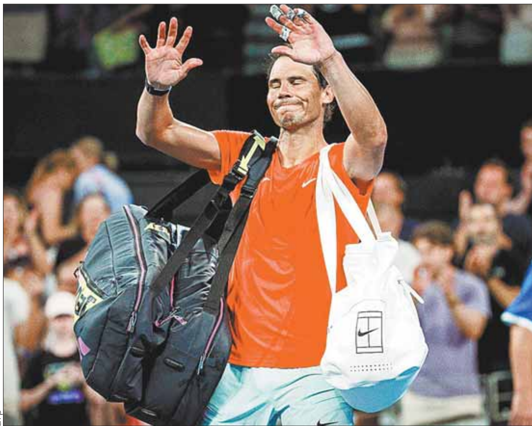
DESPEDIDA. Rafael Nadal, tenista español, saluda al público tras perder ante Thompson.