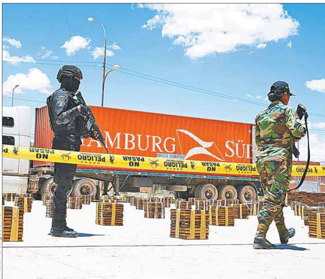
ORURO. La mercancía que estaba camuflada entre baldosas de madera, con destino a Países Bajos.