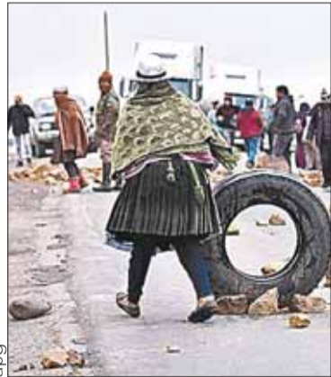
El bloqueo de vías en Colomi.

ECONOMÍA. El Gobierno y comunarios instalaron el diálogo en Cochabamba