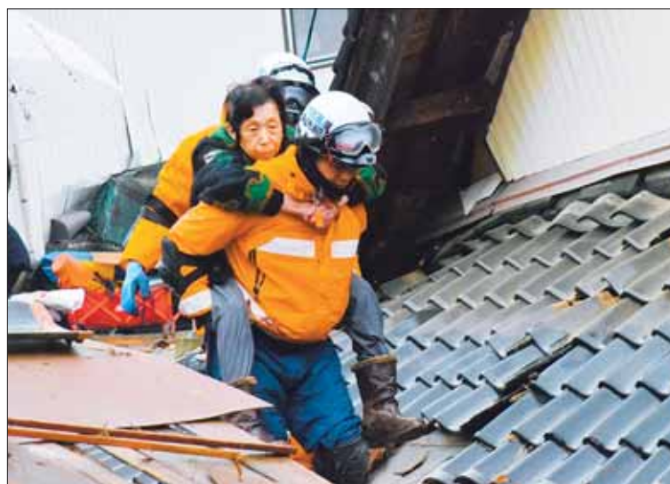
LLUVIAS. La búsqueda de víctimas se complica en la zona afectada.

Las autoridades alertaron sobre las fuertes lluvias que comenzaron ayer en una de las zonas más afectadas, la península de Noto, en el mar de Japón, y la Agencia Meteorológica Japonesa