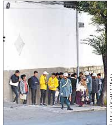
El proceso de reclutamiento.

Los requisitos para su presentación son certificado de nacimiento y cédula de identidad vigente (original y fotocopia); edad del postulante, comprendida entre