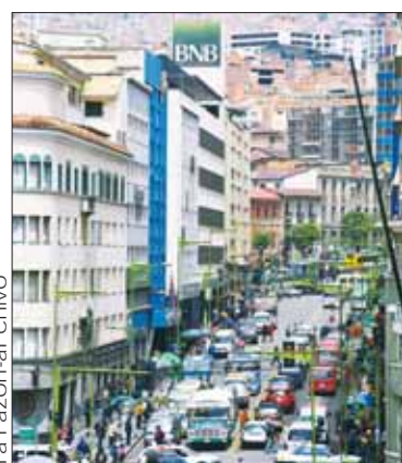
Bancos en la sede de gobierno.

El Decreto 5096 establece que los bancos otorgarán el 6% de sus utilidades