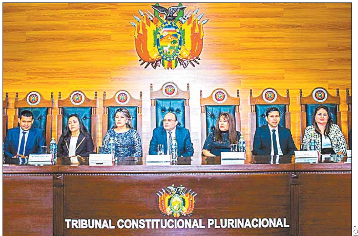
MAGISTRADOS. La Sala Plena del Tribunal Constitucional Plurinacional (TCP), en la sede de Sucre.