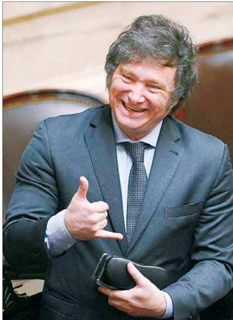
CONTRAGOLPE. Milei recibe el primer golpe contra sus medidas.

"No se evidenciaría objetivamente la 'necesidad' de adoptar tan numerosas medidas" y "lo