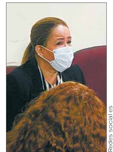
Juicio oral fue suspendido.