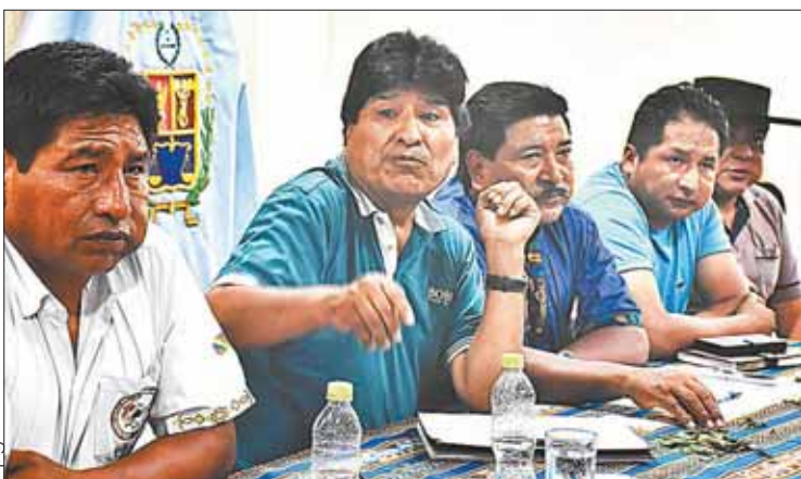
ENCUENTRO. El jefe del MAS, Evo Morales, junto a otros dirigentes.

“Las plazas son bastantes y no hay la necesidad de incomodarse”, recomendó Caballero.