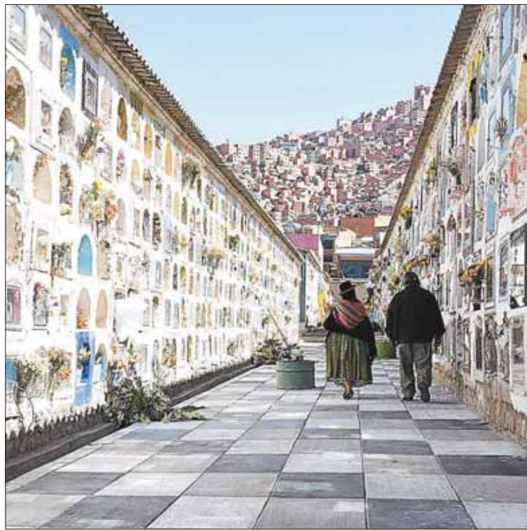
MUNICIPAL. El Cementerio General de la ciudad de La Paz.

pacios del Estado”. “Ellos están ofreciendo los espacios del cementerio, dicen que tienen contratos, pero no es atribución de ellos. Nosotros otorgamos estos espacios, el momento que llega un doliente entra a un sorteo y recién tiene el espacio en la sepultura. Que ellos tengan un contrato ofreciendo un espacio es engañar a la ciudadanía, no existe esa manera previsoría que están dando”, criticó Endara.