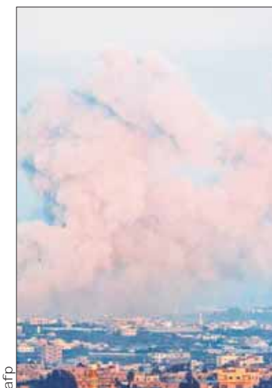
Imágenes de los atentados.