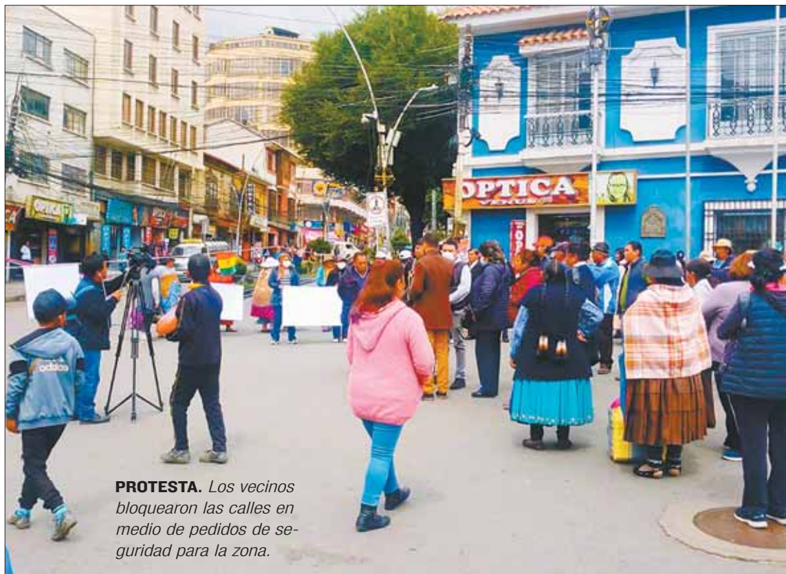
PROTESTA. Los vecinos bloquearon las calles en medio de pedidos de seguridad para la zona.