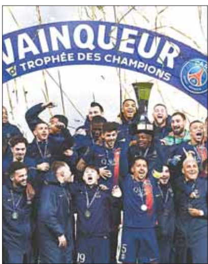
Los jugadores de PSG festejan su título.

El equipo de Luis Enrique venció a Toulouse por 2-0 como dueño de casa