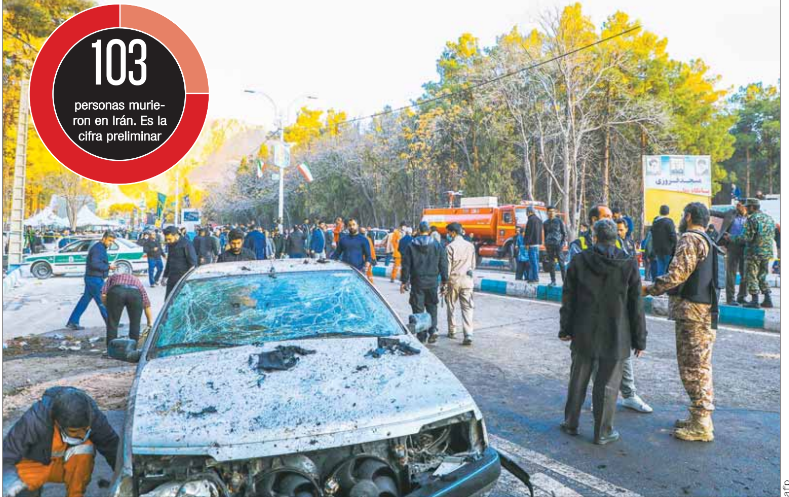
DRAMA. La gente salió corriendo del lugar tras las dos explosiones, el número de muertes puede subir, hay heridos de gravedad.

ayatolá Ali Jamenei, prometió ayer una "dura respuesta" a los "malvados y criminales enemigos de la nación". Imágenes difundidas por internet mostraron a la multitud tratando de huir del lugar mientras el personal de seguridad acordonaba la zona. La televisión estatal mostró ambulancias y socorristas en el lugar.