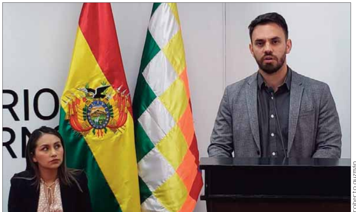
LA PAZ. El ministro de Gobierno, Eduardo del Castillo, en contacto con los medios en La Paz.

"El personal policial ha sido desplegado para dar certidumbre a la población. Se ha tenido mayor incidencia de casos atendidos y denuncias y esto se debe a la mayor presencia de efectivos policiales en las calles", manifestó.