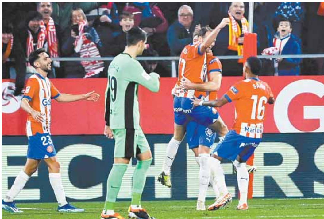
ALEGRÍA. Los jugadores de Girona celebran uno de los goles ante el Atlético de Madrid.

Rüdiger se elevó poco después para cazar el centro de Modric y libe-