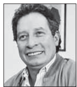
César Navarro Miranda es exministro, escritor con el corazón y la cabeza en la izquierda.

R etrospectivamente, de la nacionalización se ve solo la fecha, el acto, es decir, el acontecimiento, todo el proceso que representó la síntesis de ese momento queda registrado en la fotografía; si no se alimenta generacionalmente la memoria, el proceso se disuelve y el hecho histórico se convierte en intrascendente.