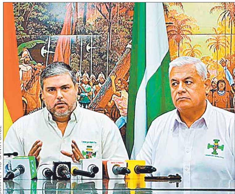
SANTA CRUZ. La conferencia de ayer del Comité pro Santa Cruz.