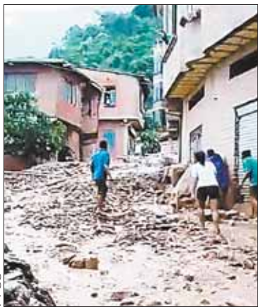
La mazamorra en Las Mercedes.

SOCIEDAD. Exigen ayuda de las autoridades ante las riadas en este sector