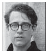
Benjamin Moser es escritor y columnista de The New York Times.

M ucho antes de saber su nombre, conocí las pinturas de Hendrick Avercamp. Muestran un mundo alegre y navideño de personas vestidas de forma alegre divirtiéndose en canales helados: pinturas que conocía de rompecabezas y tarjetas navideñas. Aquí estaba una pareja joven deslizándose sobre el hielo, con amor en sus ojos; había gente que ejercía oficios pintorescos: afilador de patines, cazador de pájaros, vendedor de castañas. Ningún otro artista capturó jamás tan bien la diversión invernal.