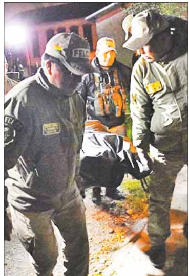
La policía rescata el cuerpo.

SOCIEDAD. El médico estaba desaparecido hace ocho días; hay dos detenidos