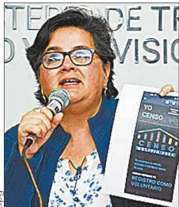
La ministra Verónica Navia.

ECONOMÍA. El Ministerio de Trabajo y el INE anunciaron el incentivo