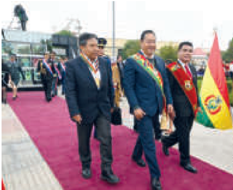
El presidente Luis Arce en Oruro.

El Presidente manifestó su apoyo para aumentar la productividad de los cultivos con la implementación