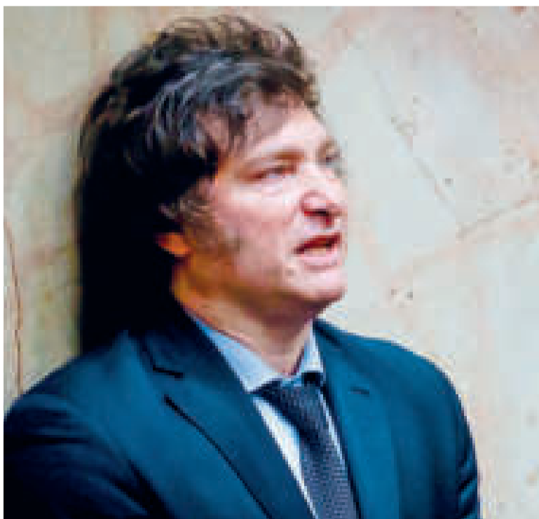
Javier Milei, presidente de Argentina.

// FOTO: TOMÁS CUESTA / GETTY IMAGES. RU