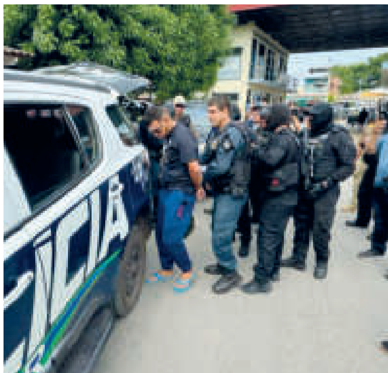
El brasileño con autoridades de su país luego de su entrega en la frontera.