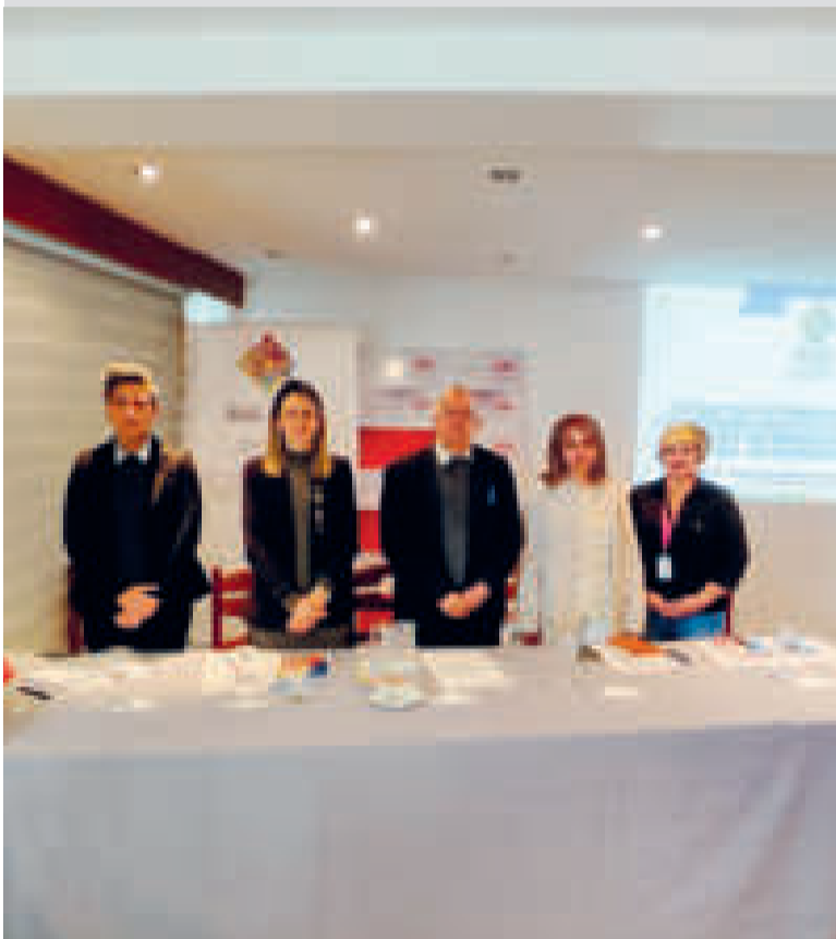
Las autoridades que participan en el taller de autoevaluación.