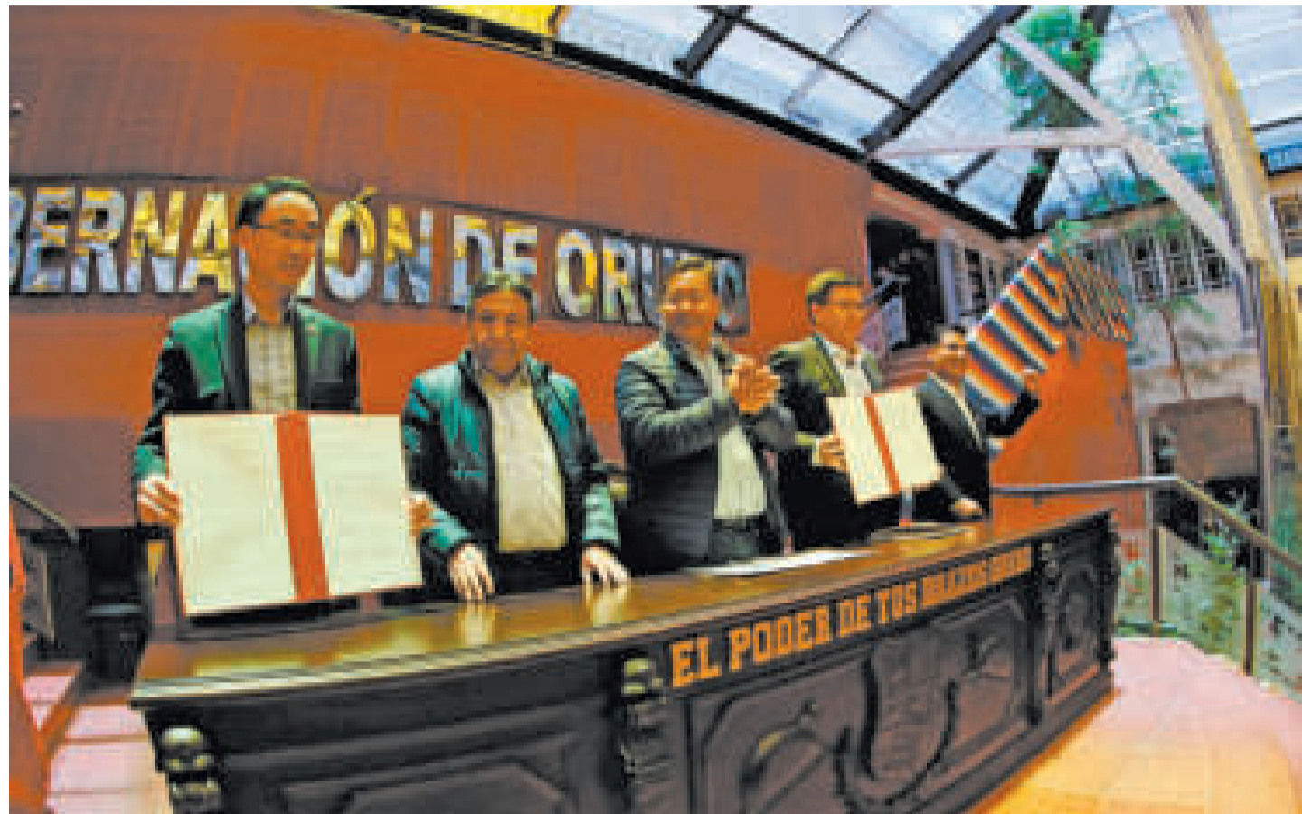
Las autoridades de Bolivia junto al embajador de China en el acto celebrado ayer.

A su turno, el diplomático chino afirmó que el proyecto de la refinadora de zinc forma parte de la estrategia nacional de la industrialización de recursos naturales de Bolivia y