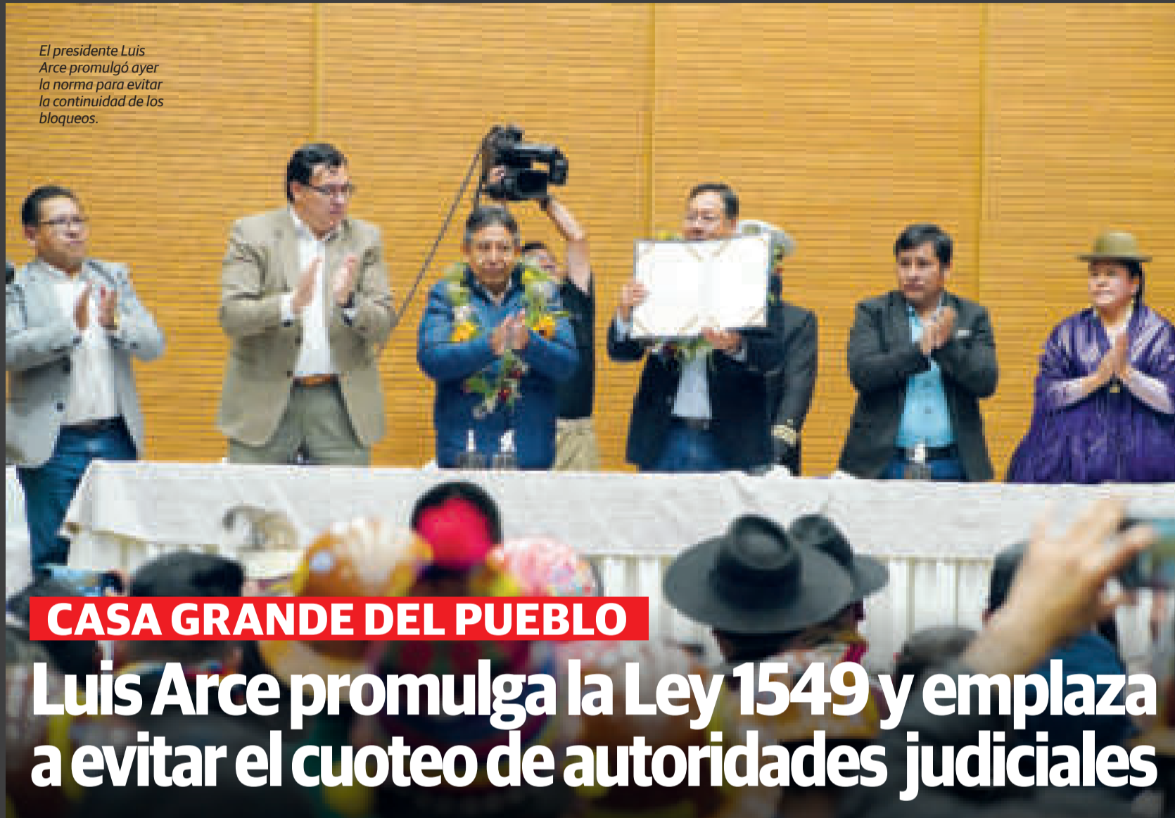
El presidente Luis Arce promulgó ayer la norma para evitar la continuidad de los bloqueos.

El proyecto de ley fija un plazo de hasta 80 días calendario