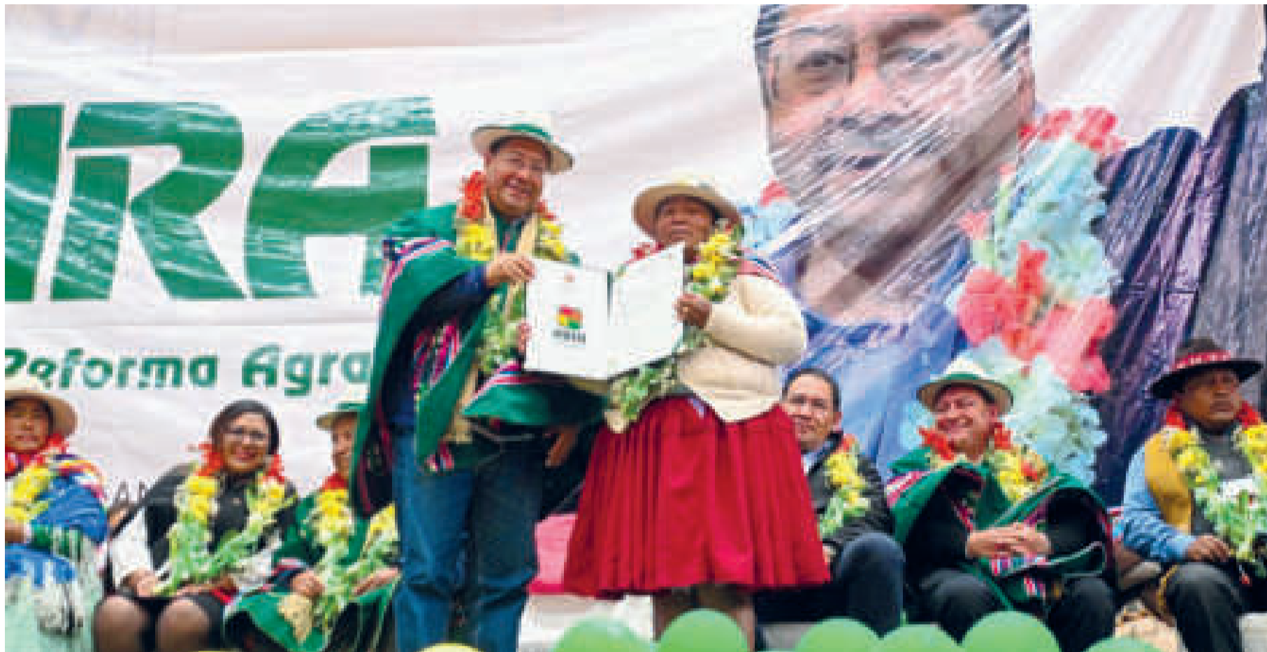
Los productores indígenas, originarios y campesinos son los beneficiarios.