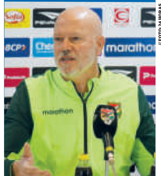
Antonio Carlos Zago, técnico de la Selección boliviana.

"Convocaremos al cincuenta por ciento que estuvieron en el preolímpico, porque creo que es una motivación más para que sigan compitiendo en el campeonato boliviano y sigan mejorando. Necesitan competir más, eso fue lo que hicimos en el Preolímpico", señaló al retorno del certamen sudamericano.