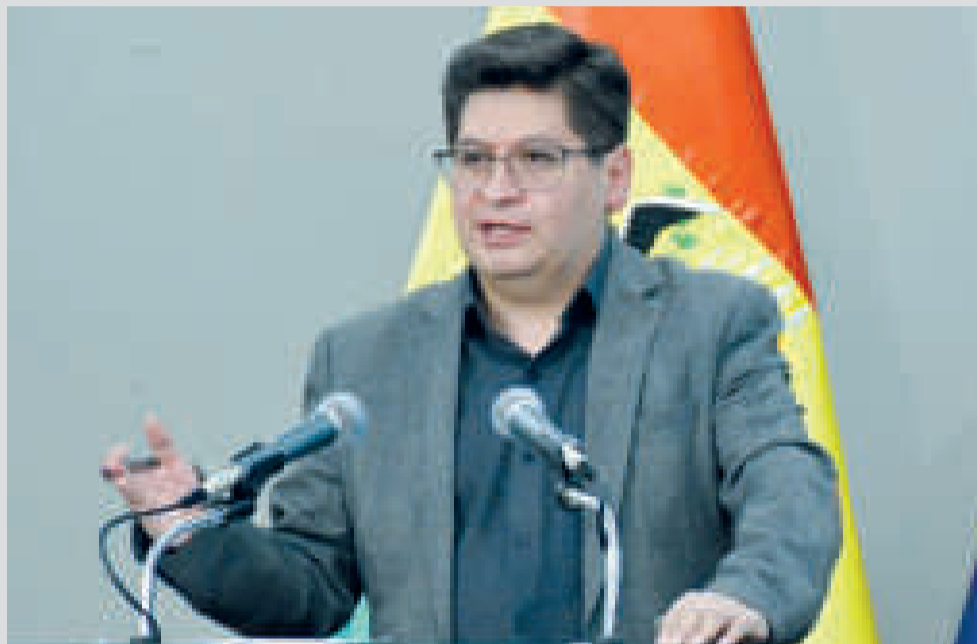
El ministro de Economía y Finanzas Públicas, Marcelo Montenegro.

144/2022-2023 Transitoria de Elecciones Judiciales 2023, y la derivó a la Cámara de Senadores, donde fue sancionada.