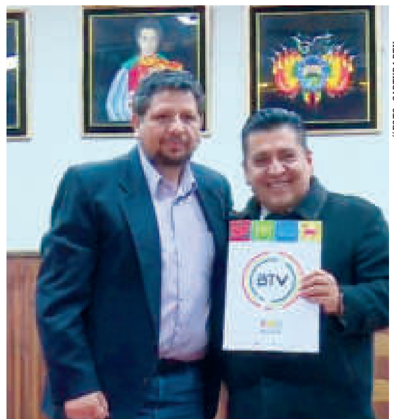
Los representantes luego de la firma del acuerdo.

La fastuosa entrada del Carnaval de Oruro corrió grave riesgo debido al bloqueo de carreteras impuesto por los seguidores de Evo Morales.