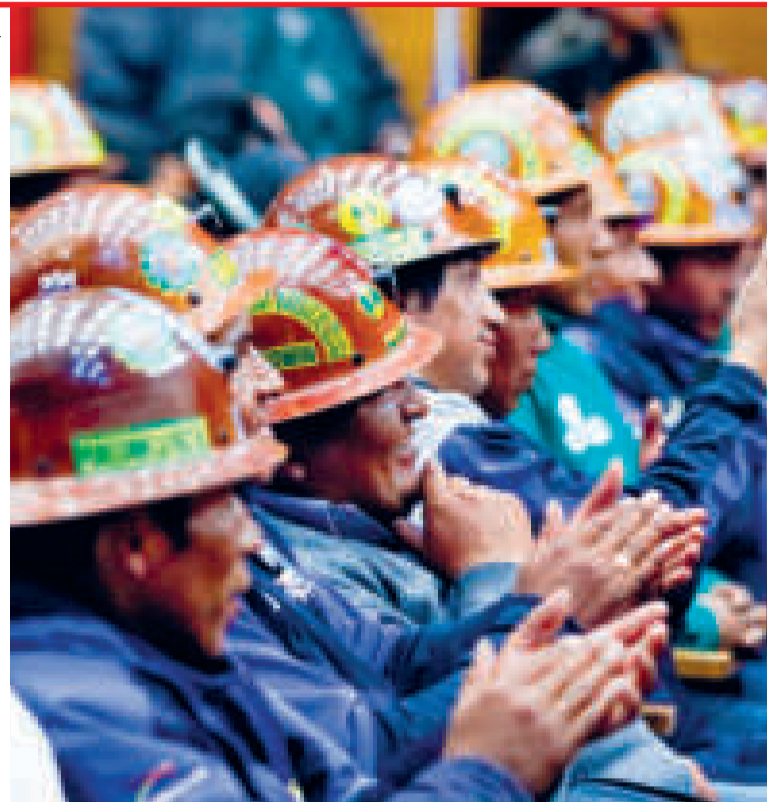
Trabajadores mineros en la Casa Grande del Pueblo.

La Sentencia Constitucional 1010/2023 establece que la reelección presidencial indefinida no existe y tampoco es un derecho humano.