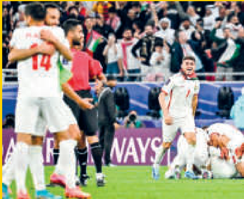
Integrantes del seleccionado de Jordania festejan la clasificación a finales.