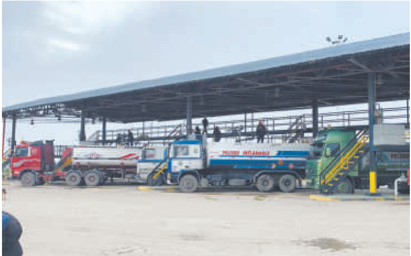
Carros cisterna cargados de combustibles.

“El daño en YPFB hoy es de un millón de dólares día que está perdiendo por culpa de un bloqueo injustificado, sin embargo, para la po-