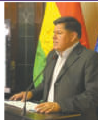
El viceministro Jaime Mamani.

Estas cartas credenciales, según el derecho internacional, se constituyen en un documento oficial que acredita a un agente diplomático.