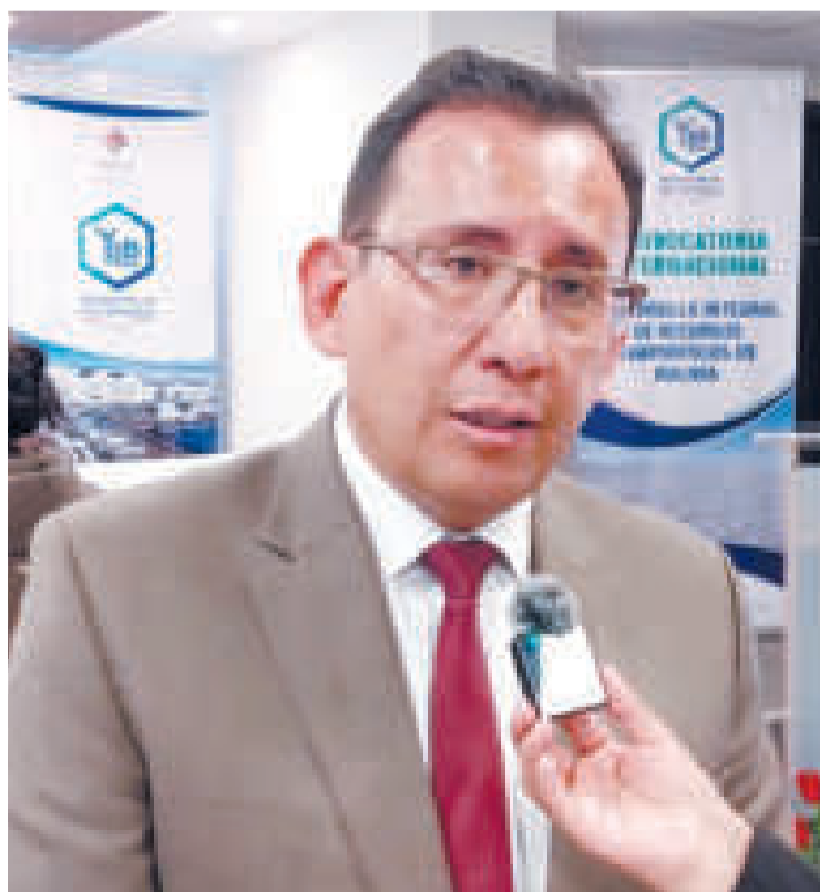
Pablo Camacho, presidente de la CNI.

La convocatoria internacional que lanzó la estatal YLB el 26 de enero tiene el objetivo de implementar proyectos piloto de desarrollo de recursos evaporíticos en siete salares bolivianos: Coipasa, Uyuni, Pastos Grandes, Capina, Cañapa, Chiguana y Empexa, ubicados en los departamentos de Oruro y Potosí, con viabilidad tecnológica, económica y financiera.