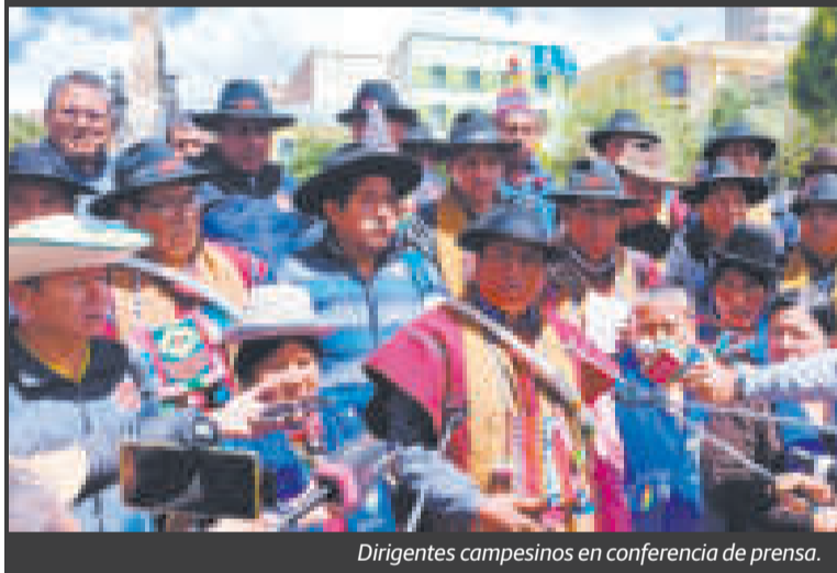
Dirigentes campesinos en conferencia de prensa.

Advirtió de que, si en 48 horas no se levantan los bloqueos, podrían tomar el Legislativo para acelerar la convocatoria a las elecciones judiciales. (ABI)