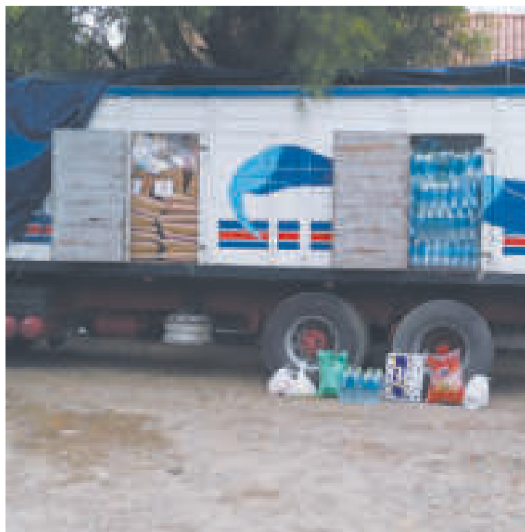
Ayuda humanitaria que no pudo ser entregada a los transportistas.

MILLONES DE PÉRDIDA económica genera el bloqueo de caminos.