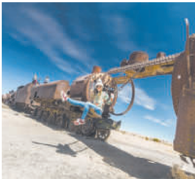
El turístico Cementerio de Trenes, en Uyuni.