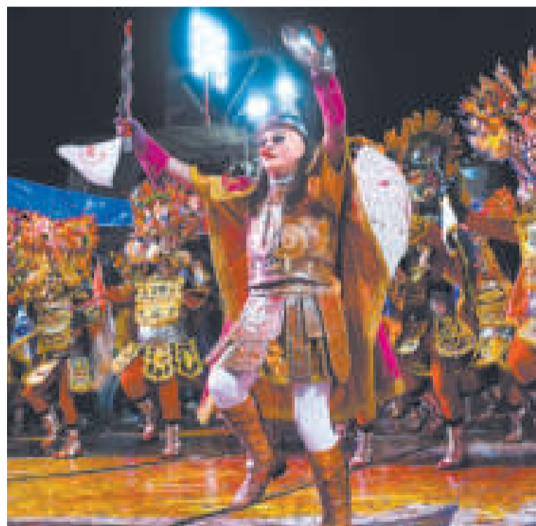
El Carnaval de Oruro se ve seriamente amenazado por el bloqueo de Evo.

En 2023 generó un movimiento económico superior a los $us 37 millones.