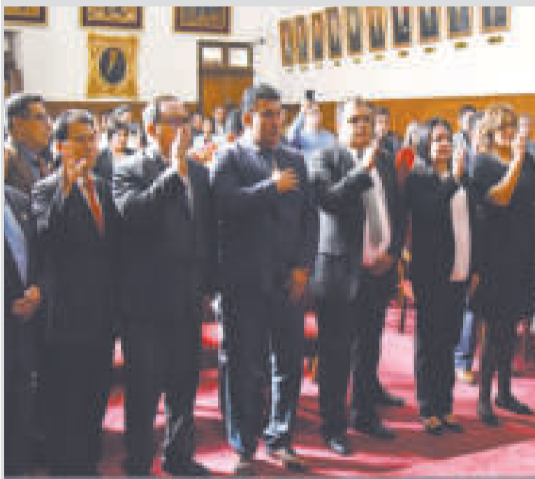
Parte de los 14 vocales posesionados ayer en Sucre.