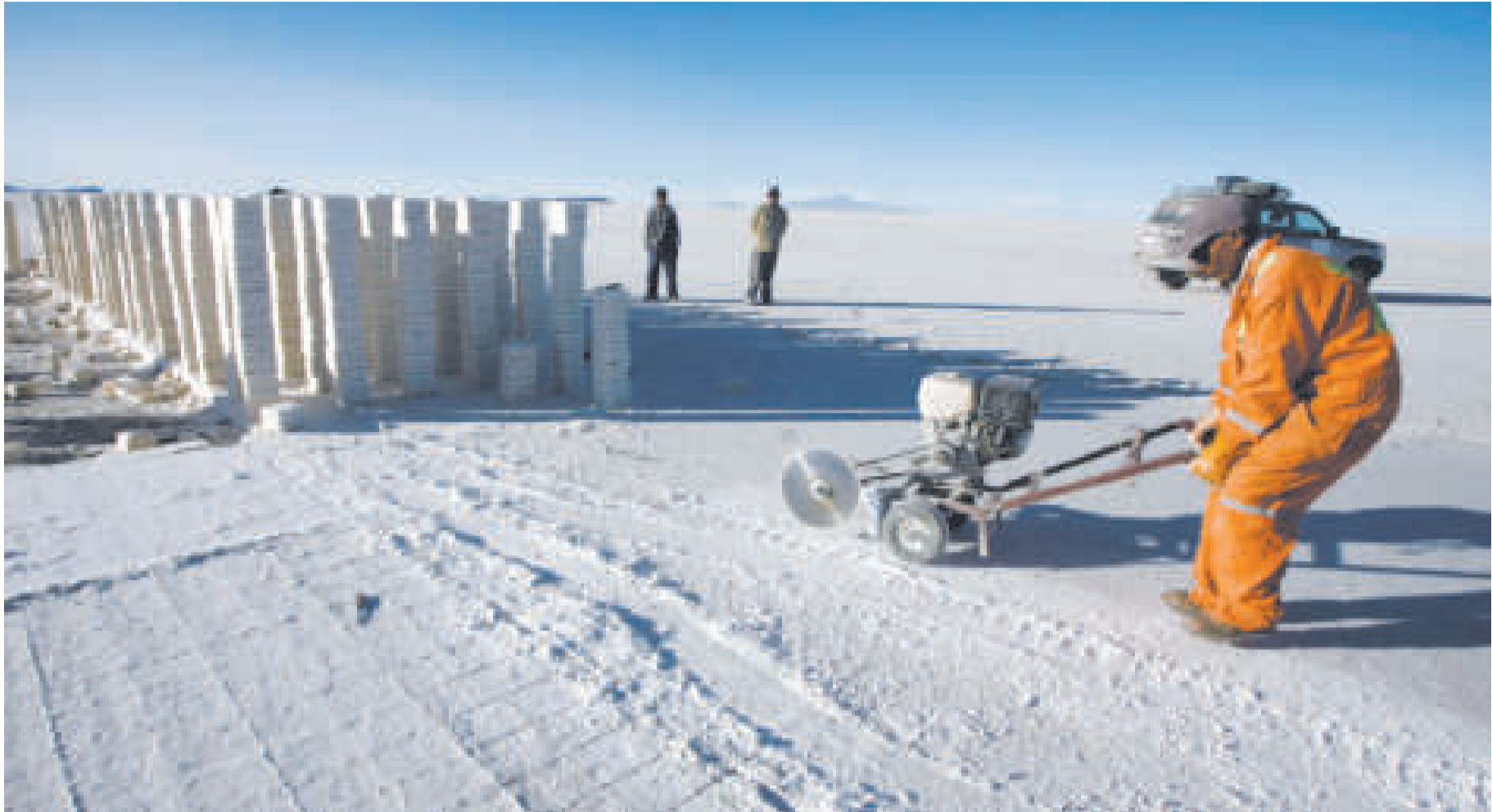
La convocatoria toma en cuenta recursos evaporíticos de los salares de Coipasa, Uyuni, Pastos Grandes, Capina, Cañapa, Chiguana y Empexa.