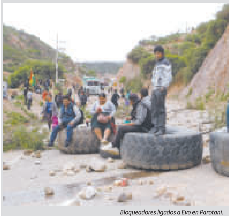
Bloqueadores ligados a Evo en Parotani.