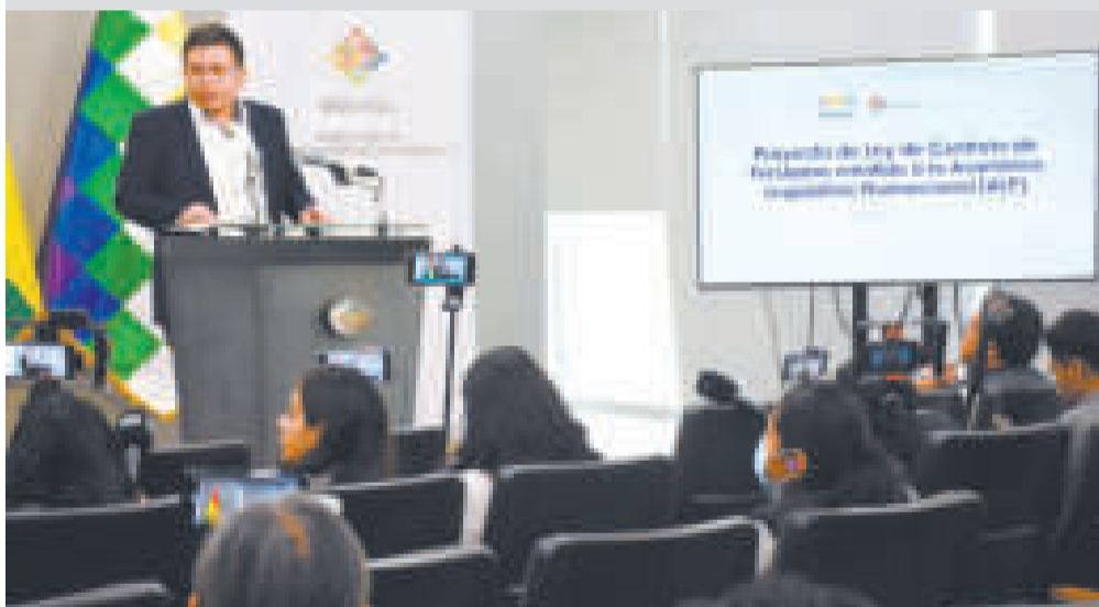
El ministro Cusicanqui en conferencia de prensa.