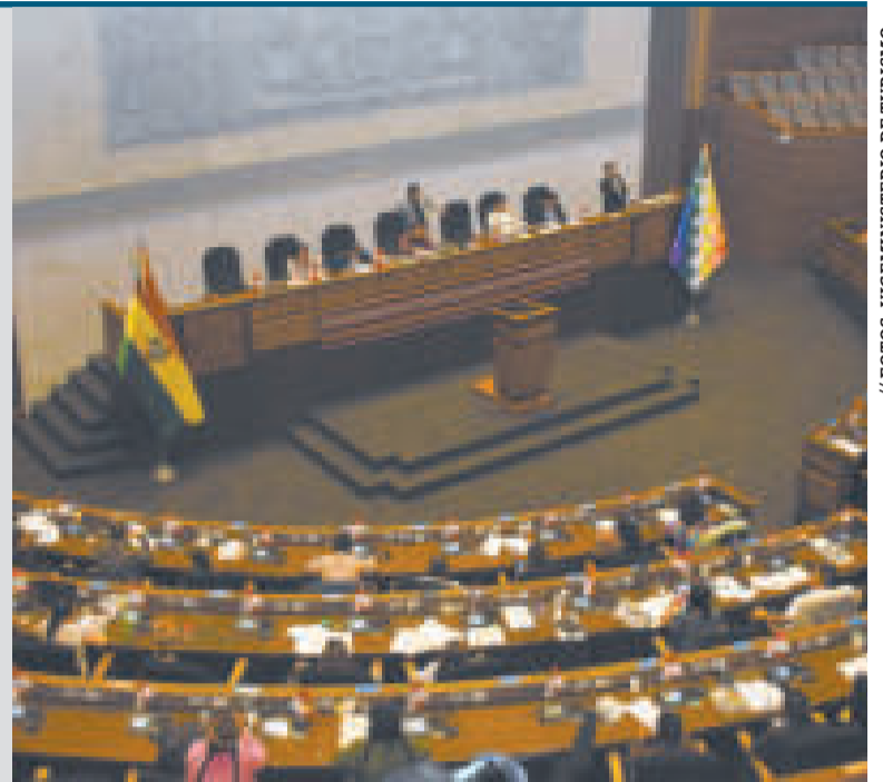
Sesión en la Asamblea Legislativa Plurinacional.

“Se busca contribuir al desarrollo urbano integral a través de la creación de nuevos espacios públicos para beneficiar a la población de La Paz y El Alto. Comprende una ciclovía de 18,24 kilómetros de longitud, siete torretas, 10 parques, 21 miradores, luminarias LED, cámaras de seguridad y cuatro puestos de seguridad física”, precisó la autoridad.