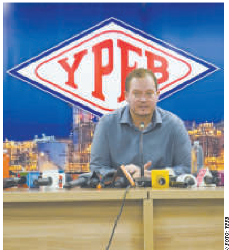
Armin Dorgathen, presidente de YPFB, en conferencia de prensa.

Dorgathen solicitó a la población que evite saturar las estaciones de servicio y puntos de venta, ya que la gasolina, diésel y GLP en el país “están garantizados”.