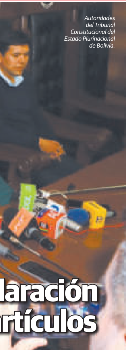
Autoridades del Tribunal Constitucional del Estado Plurinacional de Bolivia.