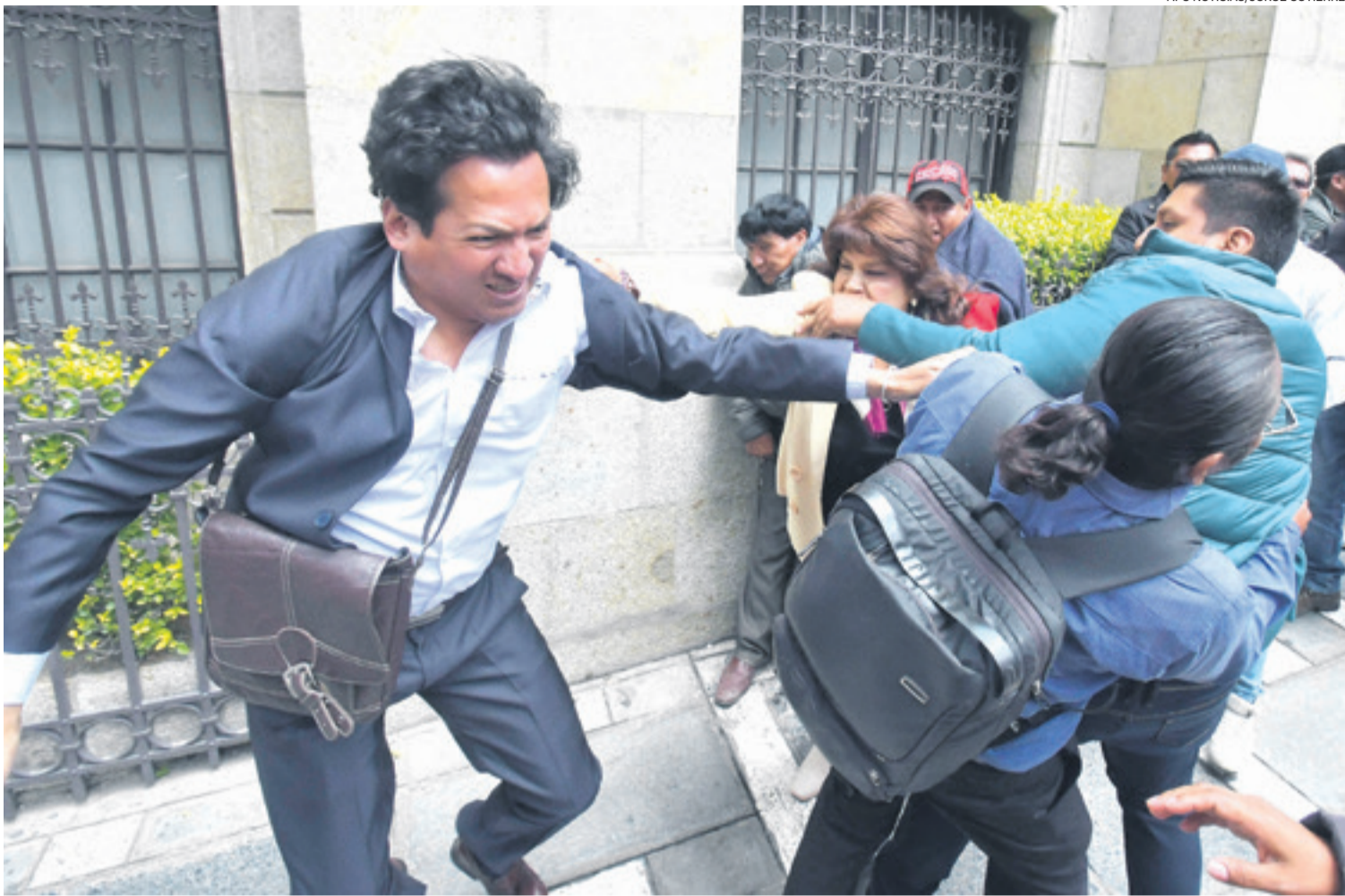
Pelea campal entre evistas y arcistas en la ciudad de La Paz. Ambos bandos del MAS convirtieron las calles paceñas en campos de batalla.