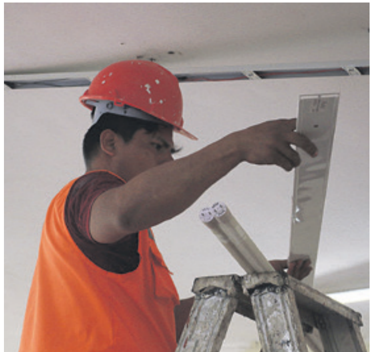
MANTENIMIENTO. Se priorizan arreglos de goteras, del sistema hidrosanitario y eléctrico en los establecimientos