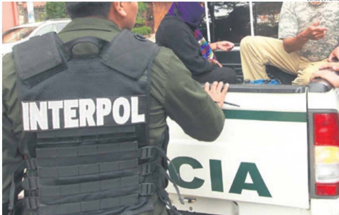
Policías de la Interpol están respondiendo a investigaciones de un nuevo hecho de corrupción

Por los informes se sabe que los policías llegaron hasta el departamento de un condominio para verificar una denuncia de supuesto malos tratos y violencia familiar y doméstica contra una mujer.