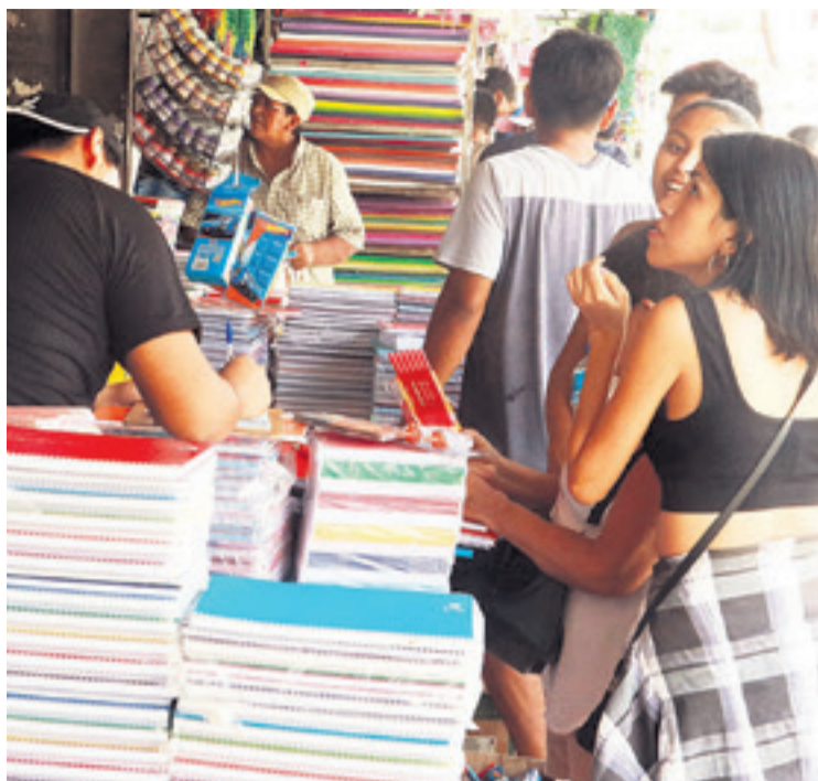
COMPARAN PRECIOS. La gente recorre puestos de venta de útiles escolares para ajustar su presupuesto