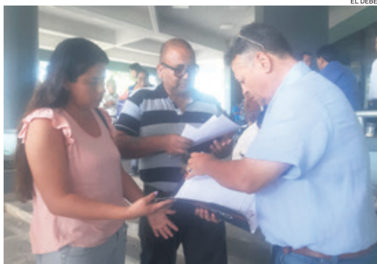
La defensa asegura que no existen pruebas contra el exdirector preso