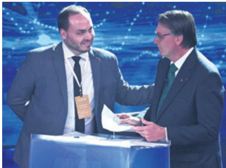
Carlos Bolsonaro (izq.) y el exmandatario brasileño Jair Bolsonaro

Carlos Bolsonaro, hijo del ex presidente y legislador en Río de Janeiro, fue objeto el lunes de órdenes de allanamiento e incautación por parte de la policía, que investiga un supuesto espionaje