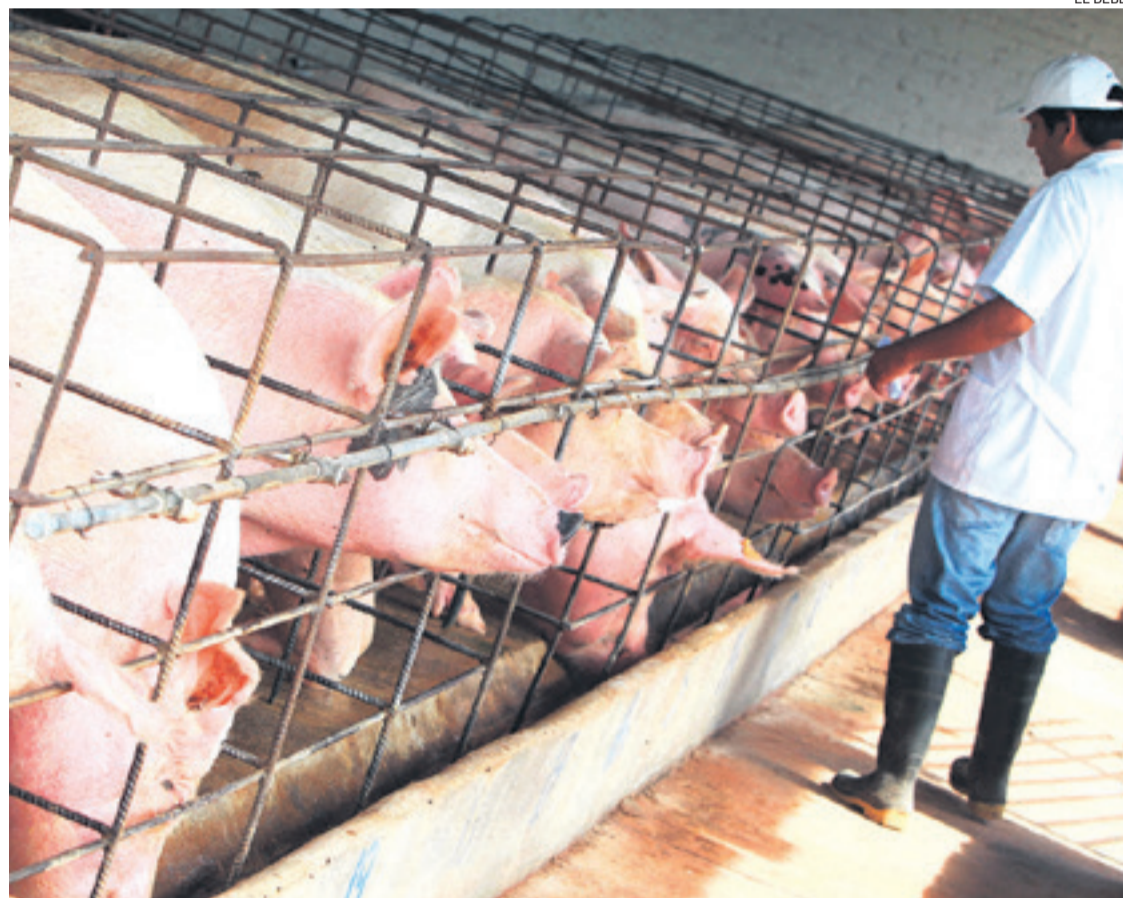
Los porcicultores piden 5.000 toneladas de harina de soya, a la que se adiciona sorgo, maíz y minerales

Al mismo tiempo, Méndez indicó que se tendrá que esperar hasta mayo para contar con excedentes, ya que la cosecha 2023 continúa retrasada. "En concreto 1.800.000 toneladas de soya fueron exportadas por compromisos que tenían los industriales con el exterior y la producción fue 3.200.000. ¿Dónde está el saldo de la soya? Nosotros