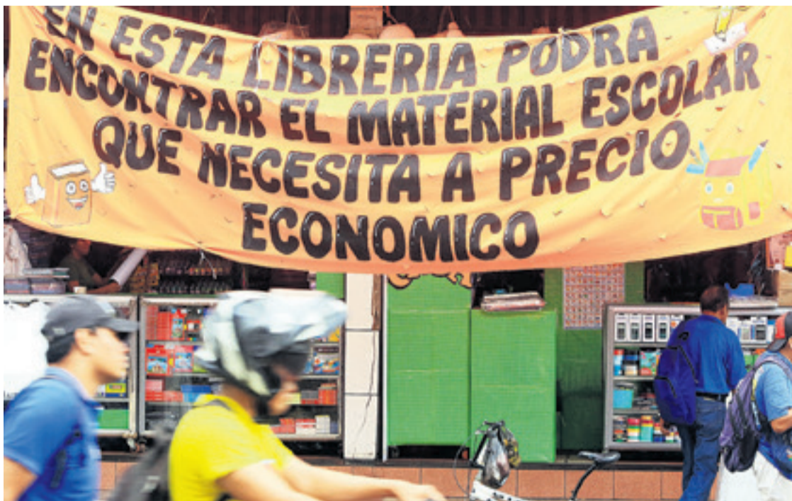
PROMOCIONES. En las diferentes librerías y centros de abastecimiento se destaca la venta del material escolar para el inicio de clases el próximo lunes