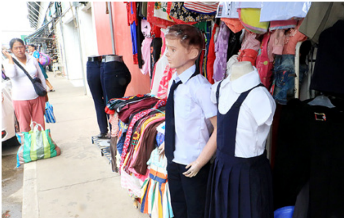
UNIFORMES. Los mandiles, poleras, blusas y pantalones tienen alta demanda. El precio varía de acuerdo con la calidad