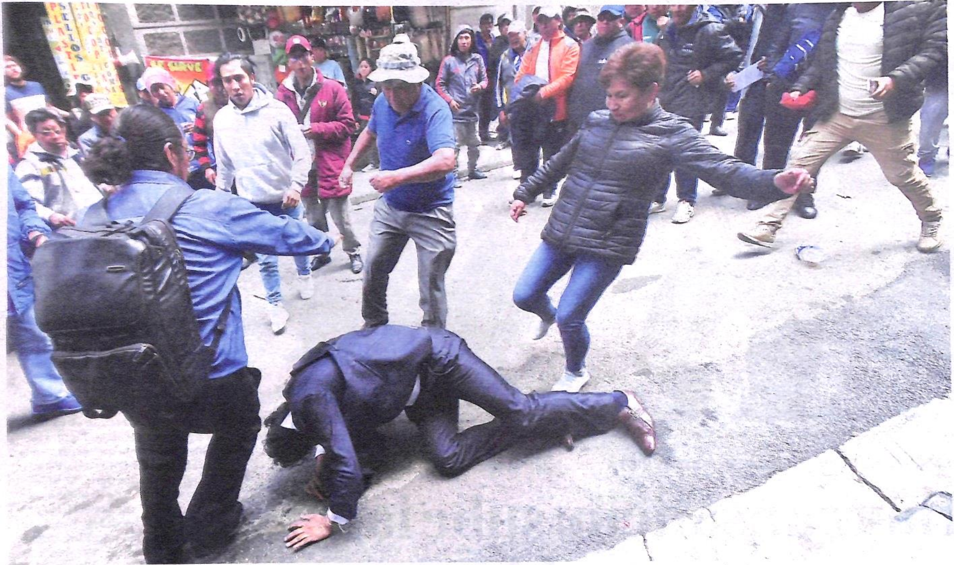
EL MAS CONTRA EL MAS. Seguidores de Arce y Evo se agarraron a golpes. En el piso yace un ciudadano que se presentó como abogado cercano al expresidente. Hay tensión en las carreteras

POSTURA. "ESTÁN ATENTANDO CONTRA NUESTRO CARNAVAL", ASEGURA ARCE