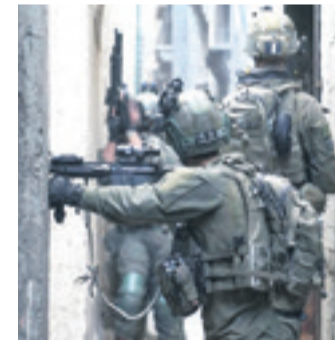
Soldados israelíes en acción

El conflicto se desató el 7 de octubre con la incursión de comandos de Hamás que mataron a unas 1.140 personas. (AFP)