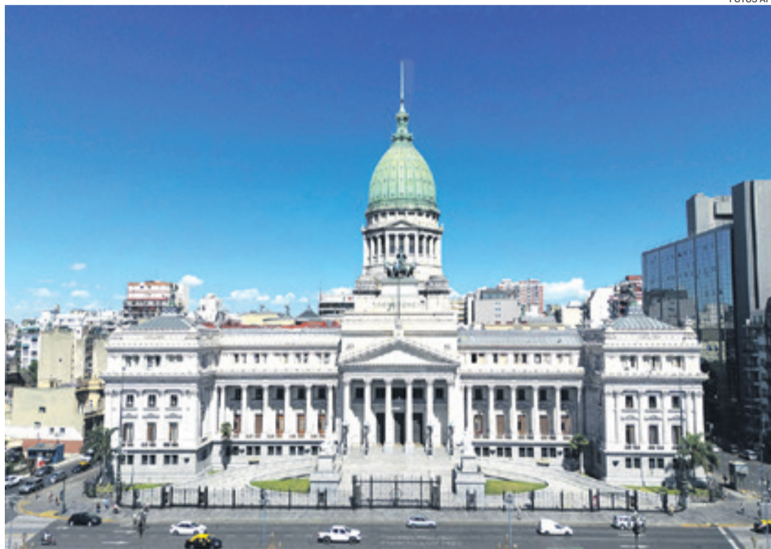
El Congreso de la nación argentina donde debe debatirse el paquete de medidas del gobierno de Milei

viernes el corazón fiscal del proyecto, que incluía, entre otros, moratorias fiscales, cambios en impuestos al patrimonio, a los altos ingresos y a las exportaciones, y modificaciones en el cálculo del aumento de jubilaciones.