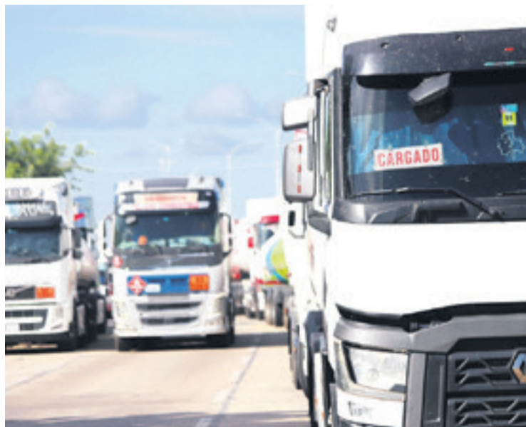
Decenas de cisternas no pueden reabastecerse en Palmasola.

Hasta el propio presidente, Luis Arce, ayer en Oruro, expresó su molestia por los bloqueos y dijo que esas medidas "atentan"