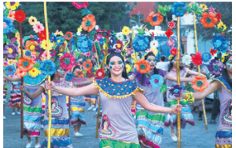
COLORIDO. El Arete Guasu alegra al público que se dio cita a las calles del centro cruceño. La gente empieza a disfrutar de la fiesta grande de los cruceños