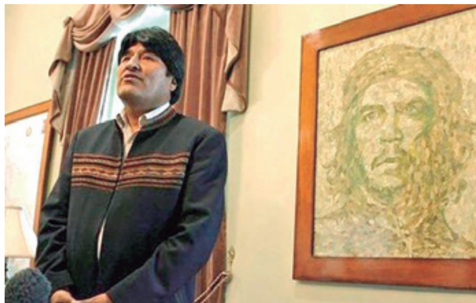
En el Museo de la Revolución en Orinoca está parte de los obsequios que le dieron a Morales