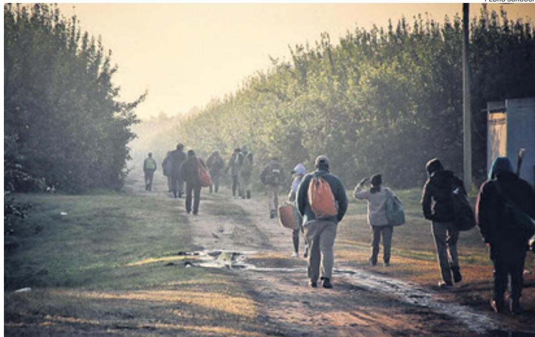
Varios trabajadores bolivianos se asientan en diferentes localidades de Argentina buscando mejor vida

Argentina es el primer exportador de derivados industriales de limón. En Tucumán se cosecha alrededor del 80% de la producción nacional.