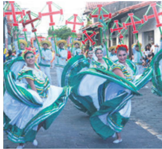
TRADICIÓN. El público disfrutó de las danzas y coreografías, que realizan los jóvenes la noche de este sábado en Santa Cruz de la Sierra.