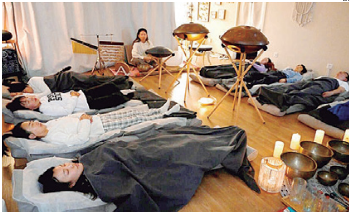
Esta fotografía muestra a personas durmiendo durante una sesión de relajación en un centro en Pekín

Pero cuando se corren las cortinas y empiezan a zumban los cuencos tibetanos en el estudio de