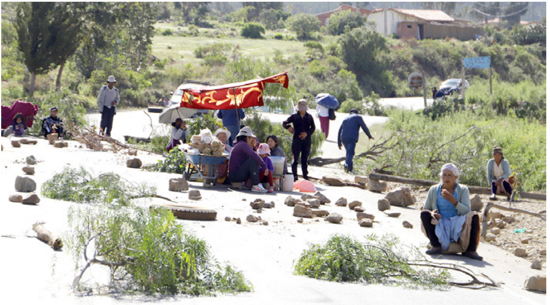
Algunos comunarios de Cochabamba, específicamente de la región de Valle Alto, denunciaron que son obligados a bloquear por dirigentes afines al expresidente Evo Morales

DIÁLOGO SE HACE ESPERAR Y CRECE LA TENSION