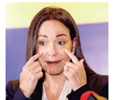
La opositora Corina Machado

Destacó que Machado no tuvo la posibilidad de responder.