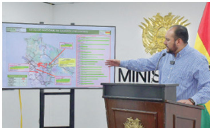
El viceministro Ríos informó que hay 22 puntos de bloqueos en el país