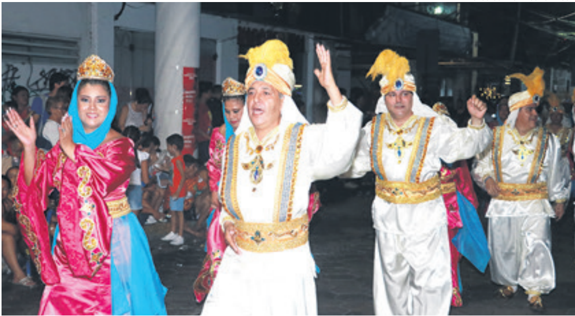
COMPARSAS. Las agrupaciones carnavaleras también estuvieron presentes este sábado en el centro de la ciudad, donde la noche se llenó de luces de colores, tradiciones, buena música y mucha alegría