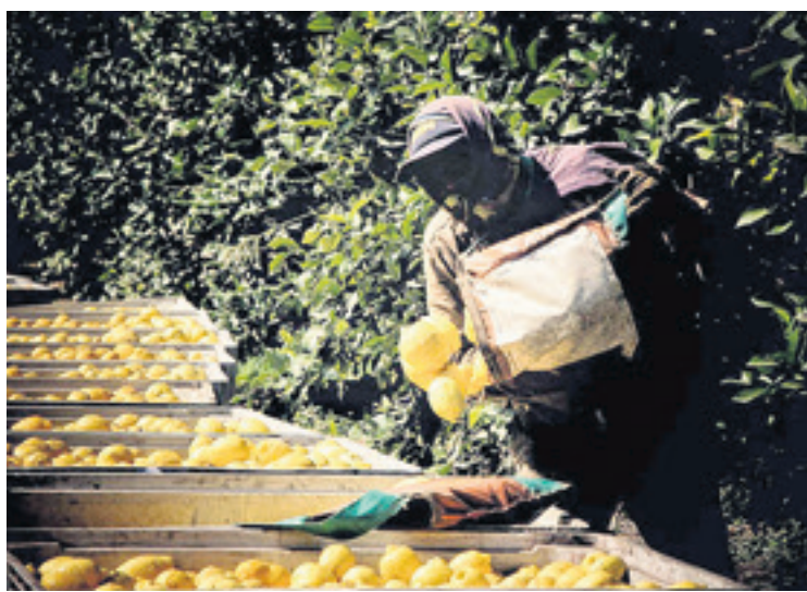
Migrantes bolivianos cosechando limones en la ciudad de Tucumán.

en La Rioja y Mendoza. Para mayor información te podrás contactar a través de una llamada telefónica, les voy a brindar mi número para aquellos que estén interesados". Ese es otro de los mensajes para los trabajadores "golondrinas". En este caso la paga es un poco más: 750 pesos argentinos, unos seis bolivianos con 20 centavos.