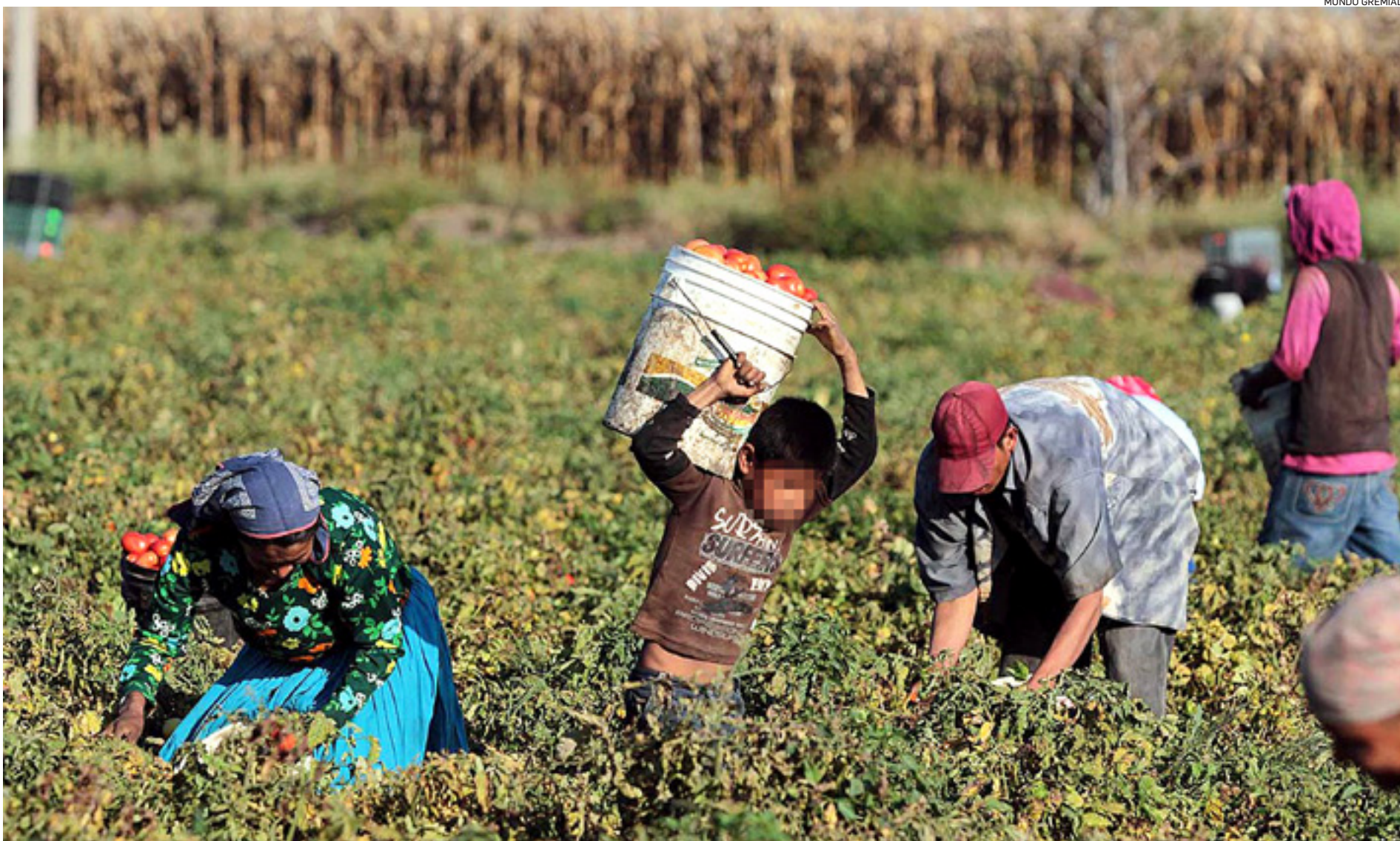
Varios bolivianos son trabajadores "golondrinas" en esta época del año. Muchos van a zonas rurales a cultivar frutas y verduras, pero viven en condiciones precarias.