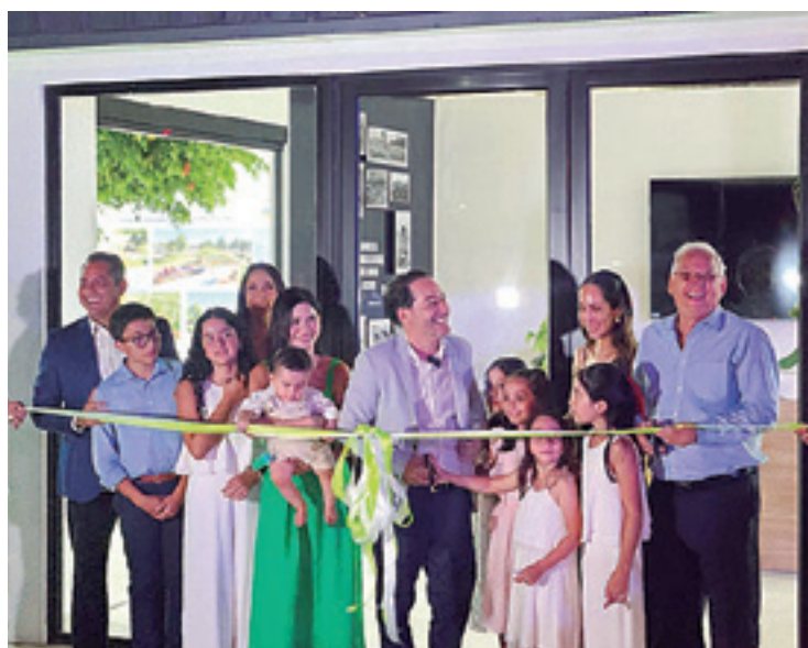
Showroom, ubicado en el 2do anillo, carretera Santa Cruz - Montero

El mega proyecto de 336 hectáreas, situada en el corazón del norte integrado, se perfila como un centro logístico, comercial y habitacional. “El proyecto incluye el primer boulevard gastronómico del norte, un moderno supermercado, farmacia, el primer Mall de Montero con salas de cine de última generación, sucursales de los principales bancos, un centro empresarial corporativo, estaciones de transporte público, un surtidor, 2,5 kilómetros de parques urbanos lineales, canchas deportivas, áreas infantiles, ciclovía, teatros al aire libre, y servicios de seguridad como