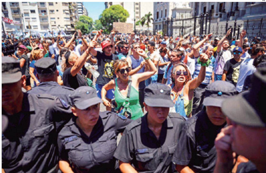
Esta semana se realizó la primera manifestación de alcance nacional contra el gobierno y sus medidas

La ley, tildada de Ley Omnibus por lo amplia, se propone revolucionar el sistema económico argentino con el cambio de centenares de leyes y normas y se complementa con un decreto de 366 artículos con más desregulaciones, cuyos efectos ya fueron