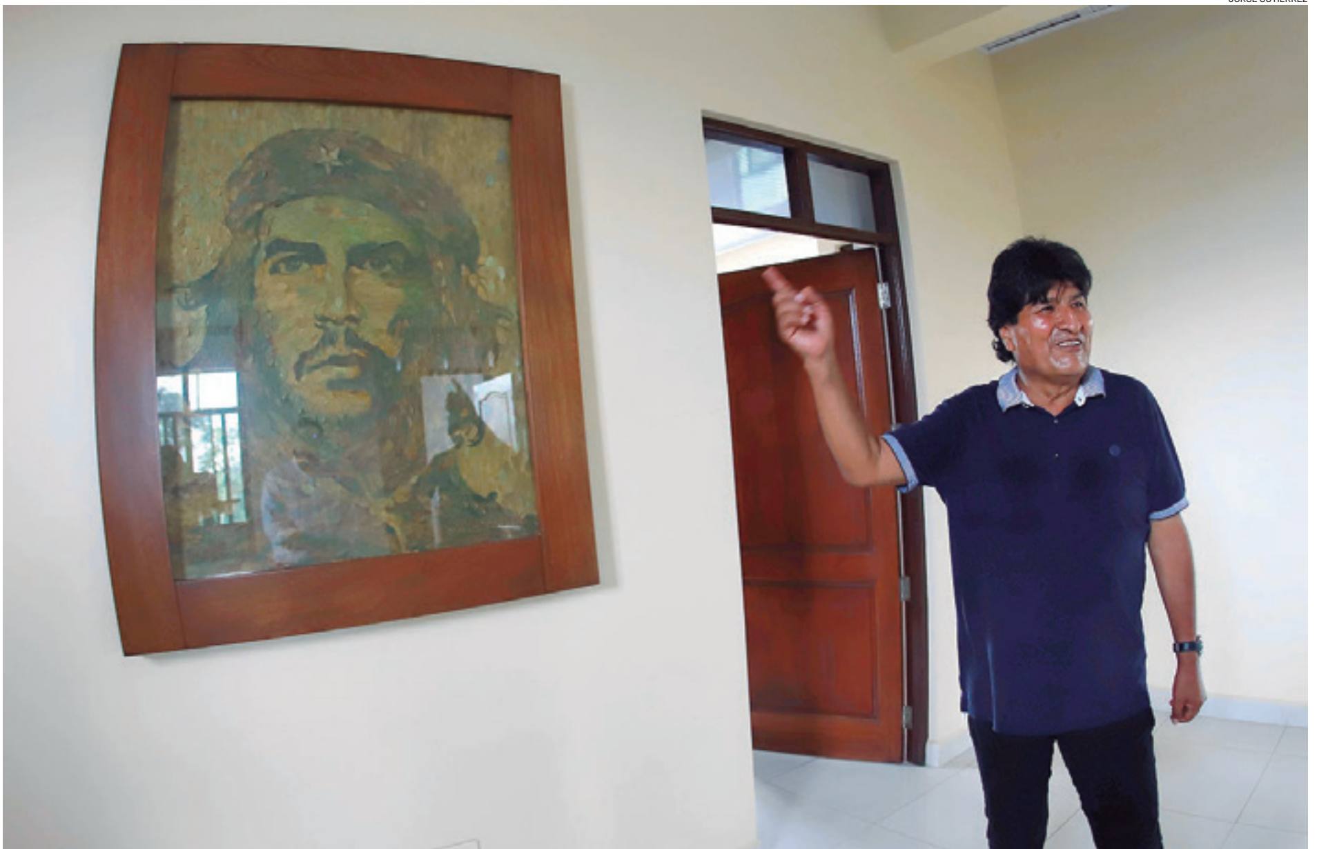
El expresidente Evo Morales, en su residencia del Chapare muestra a EL DEBER la obra El Che que el artista Gastón Ugalde la hizo con hojas de coca