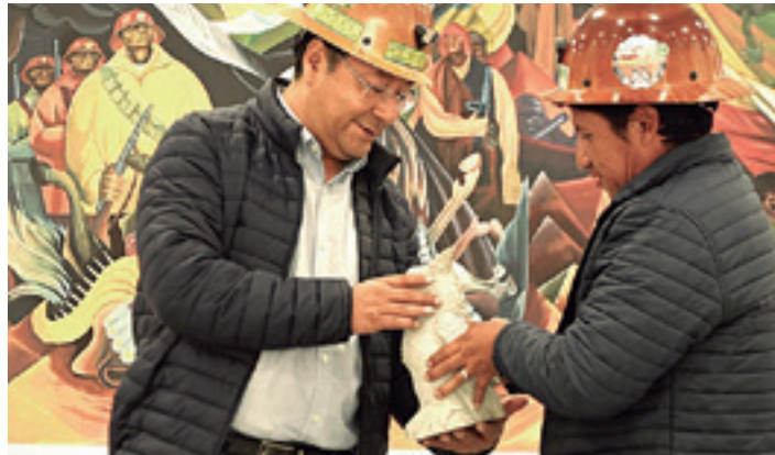
El presidente Luis Arce recibe un obsequio de un dirigente minero

Son al menos cuatro normas vigentes en Bolivia que prohíben a los servidores públicos aceptar regalos y sancionan con cárcel. La Ley 2027 del Estatuto del Funcionario Público del 27 de octubre de 1999, que prohíbe a los servidores públicos “aceptar, (...) obsequios, regalos, beneficios u otro tipo de dádivas”. La Ley 004 de Lucha contra la corrupción, Marcelo Quiroga Santa Cruz, que modifica el artículo 147 del Código Penal: “La servidora o el servidor público o autoridad que en consideración