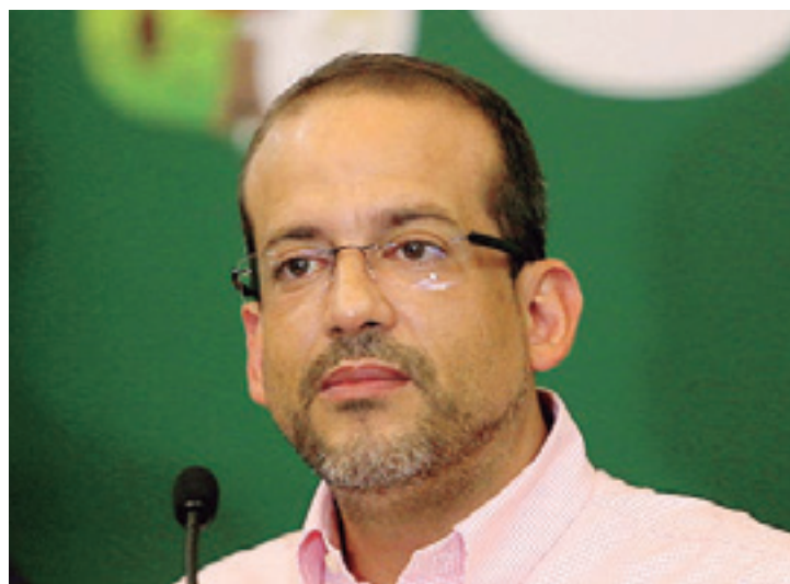
Camacho fue elegido gobernador en las elecciones subnacionales