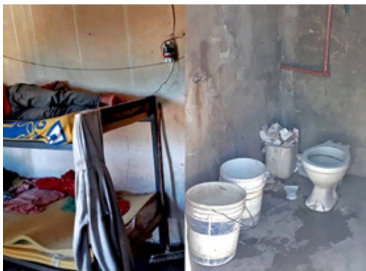
En estas condiciones vivían muchos bolivianos 'golondrinas'.