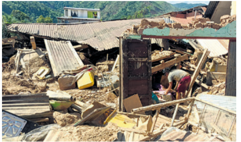
En medio del desastre en Tipuani, pobladores intentan rescatar sus pertenencias