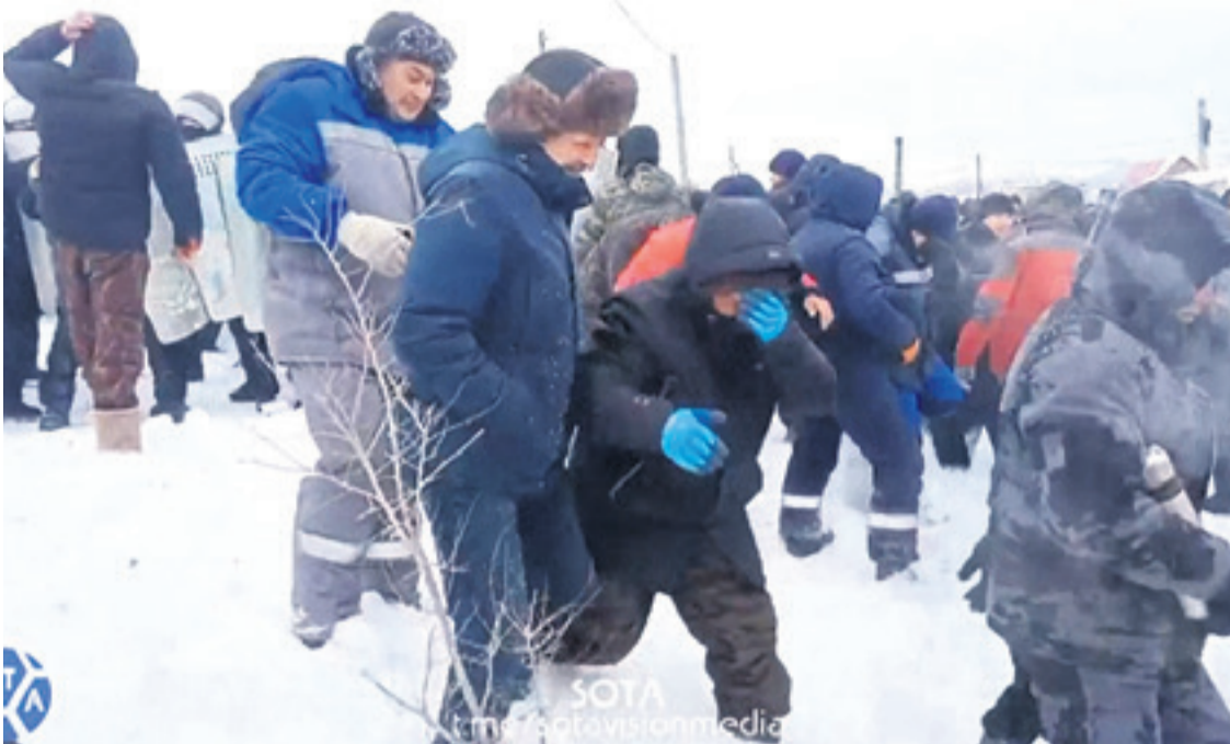
Pese al intenso frío los manifestantes protestaron en la ciudad de Baimak, en República de Baskortostán