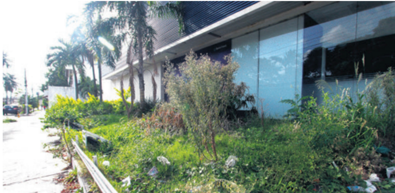
DAN MAL ASPECTO. Los vecinos se quejan de la basura que se acumula en las agencias abandonadas