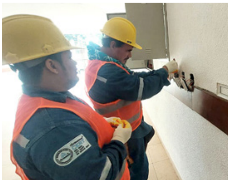
La parte estética se trabajará a lo largo de toda la gestión escolar

Ante las observaciones planteadas por la Defensoría del Pueblo por las precarias condiciones de infraestructura de tres o cuatro unidades educativas, Antelo aseguró que son colegios que aún no se han intervenido, pero que están