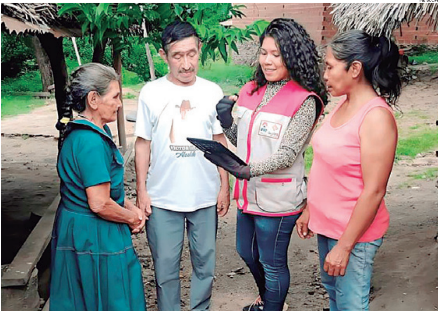
Los agentes censales que participaran en el Censo de Población y Vivienda son una parte importante del proceso de empadronamiento