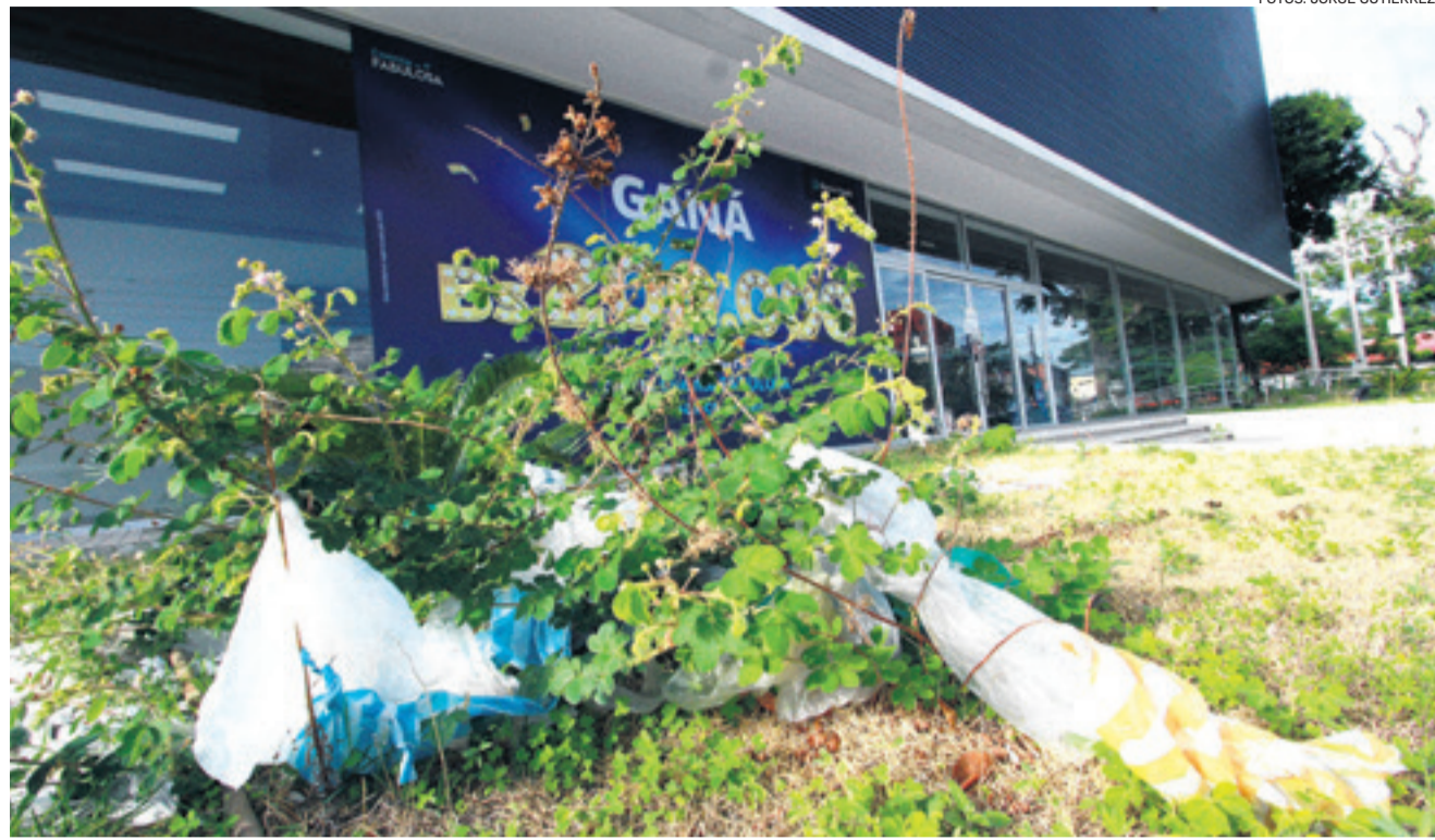
UN LUGAR EMBLEMÁTICO. En la esquina de la av. Cañoto y calle 21 de Mayo, el abandono deja sus huellas en el inmueble y los alrededores