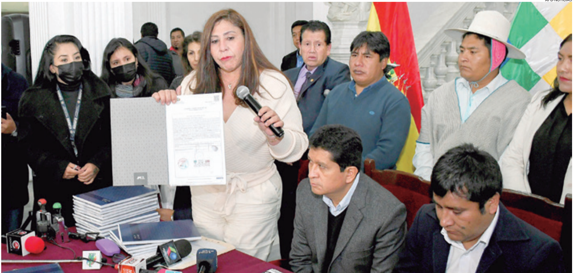
La Comisión Mixta de Constitución del Legislativo abre proceso de registro para precandidatos al Órgano Judicial, después de unos días, fue suspendido. Fue en abril de 2023

FINALIZA LA TERCERA SEMANA DE ENERO, SIN RESULTADOS