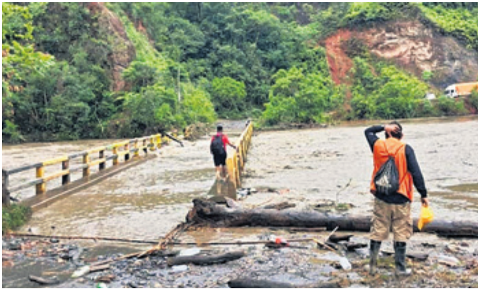
Pese a la emergencia, la gente se da modos para llegar al municipio del norte paceño