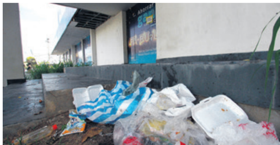
SE HAN VUELTO BASURALES. Frente a la plazuela del Estudiante, un lugar muy concurrido, hay basura en las afueras de la antigua agencia