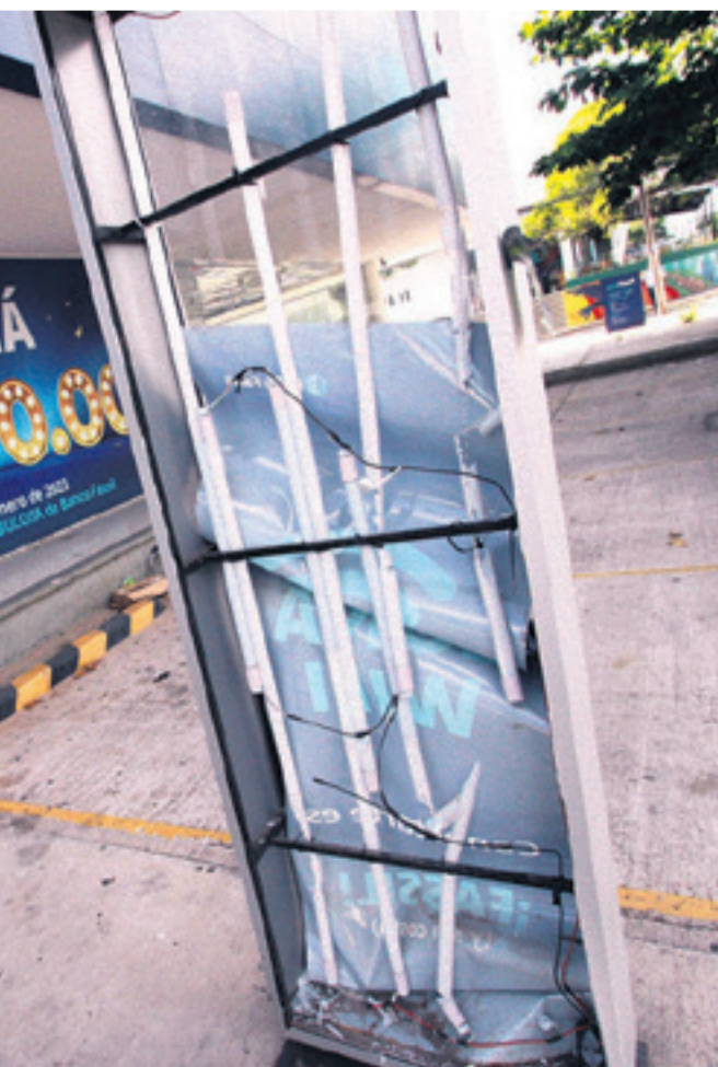
DAÑOS A LETREROS. Los malvivientes destrozaron los letreros de vidrio y metal, lo que puede provocar accidentes a los transeúntes