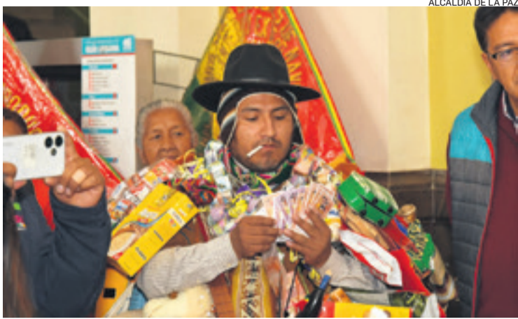
ALCALDÍA DE LA PAZ