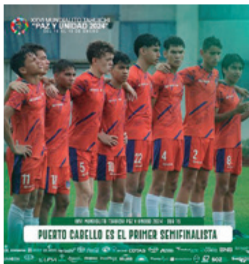
Puerto Cabello avanzó mediante tiros penales