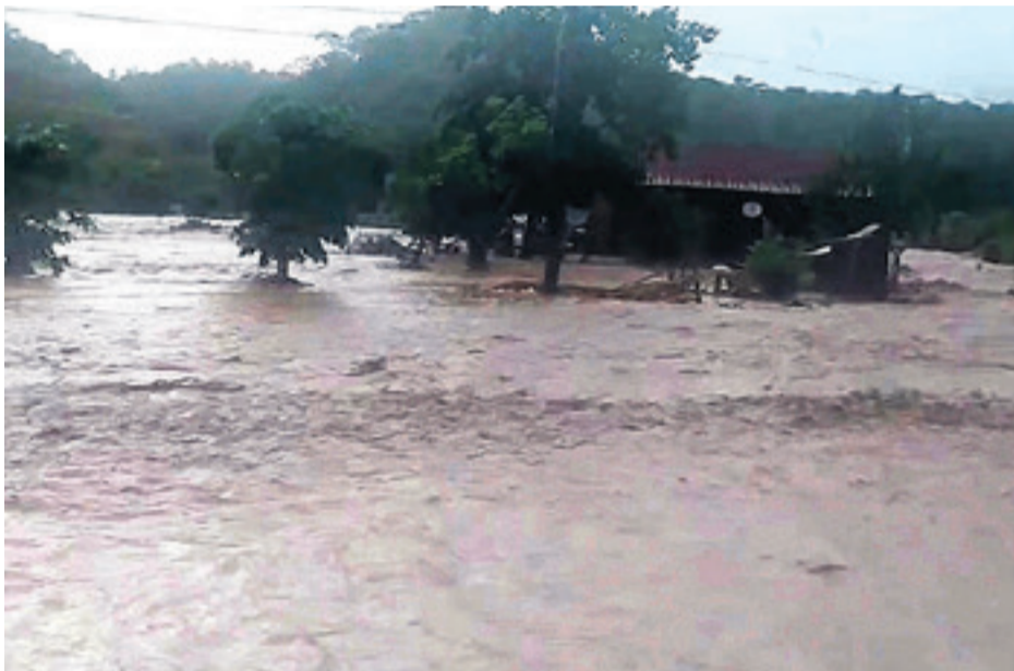
Calles de Tiquipaya, en el municipio de El Torno, donde también se anegaron viviendas