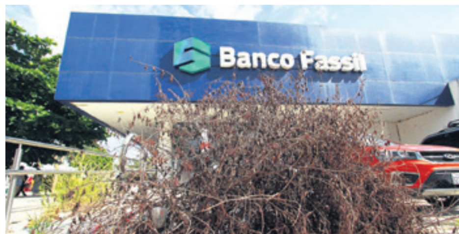
TAMBIÉN EN EQUIPETROL. Considerada una zona de gran flujo comercial, el inmueble de la Av. San Martín, entre Dalías y Claveles está descuidado