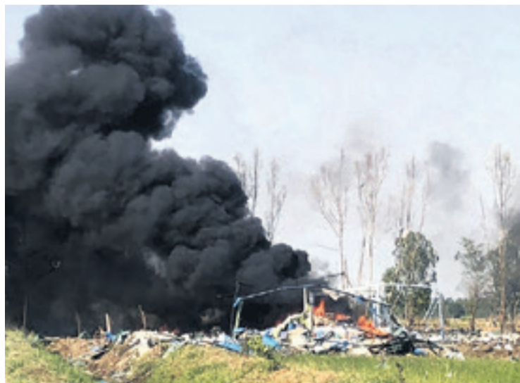
Una espesa columna de humo se observa en el lugar del suceso

Imágenes divulgadas por los rescatistas muestran escom-