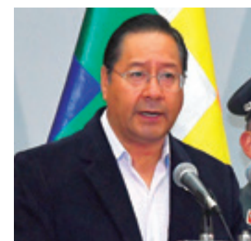
Arce durante la firma del convenio

YLB, tras la firma de convenio remarcó que se mantendrá un modelo de comercio soberano.