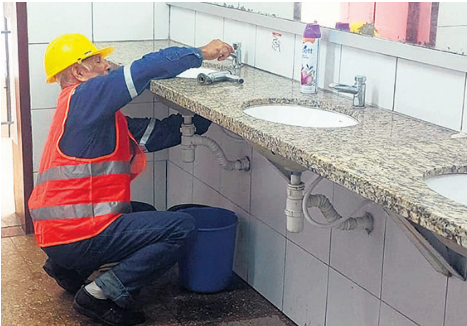
En esta primera etapa se ha priorizado el sistema hidrosanitario y el eléctrico, y también la cobertura y las canaletas

PREPARATIVOS PARA EL INICIO DE CLASES EL 5 DE FEBRERO