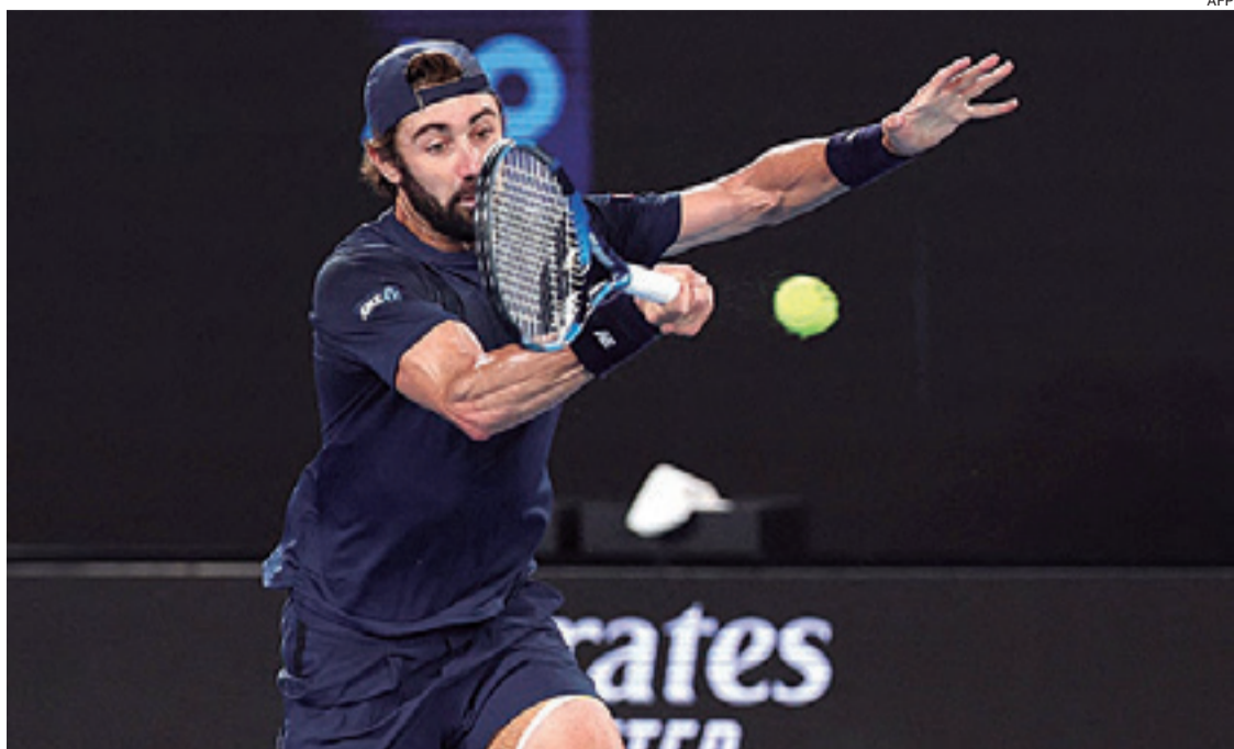
Stefanos Tsitsipas se impuso con dificultades al australiano Jordan Thompson y continúa en carrera en el Abierto de Australia

ESTÁN EN TERCERA RONDA DEL ABIERTO DE AUSTRALIA