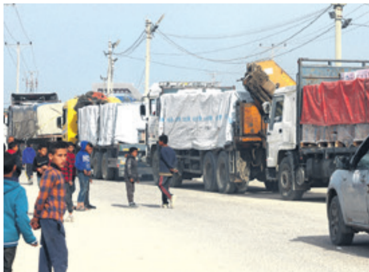
Las medicinas para rehenes y la ayuda humanitaria entraron a Gaza