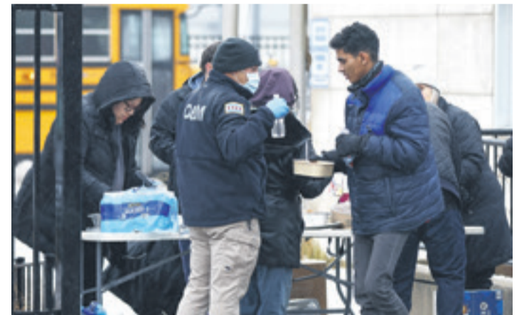
Gente solidaria reparte comida para los inmigrantes en Nueva York

Más de 160.000 personas, la mayoría latinas -sobre todo venezolanas-, han llegado a la ciudad desde el inicio de la crisis migratoria hace casi dos años, a menudo en buses fletados por gobernadores republicanos desde estados del sur, como el texano Greg Abbott, en protesta por la política migratoria de la administración del demócrata Joe Biden, en una batalla que tiene la vista puesta en los comicios de noviembre próximo. (AFP)