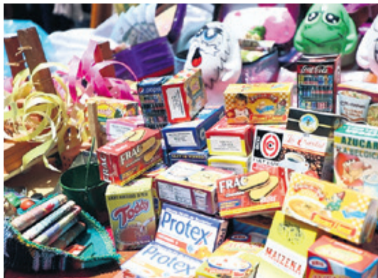
Las miniaturas representan a los deseos de abundancia de la gente.

En todo caso, el Ekeko ya camina por las calles de la sede de Gobierno. Este tradicional personaje trae los deseos que el ciudadano busca. Es conocido como 'el dios