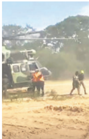
Se realizó rescate en helicóptero en el sector de La Guardia