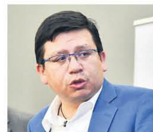
El ministro de Planificación

ra del aparato público". Especialistas ven que la medida no genera un impacto significativo en el gasto. A2Y3