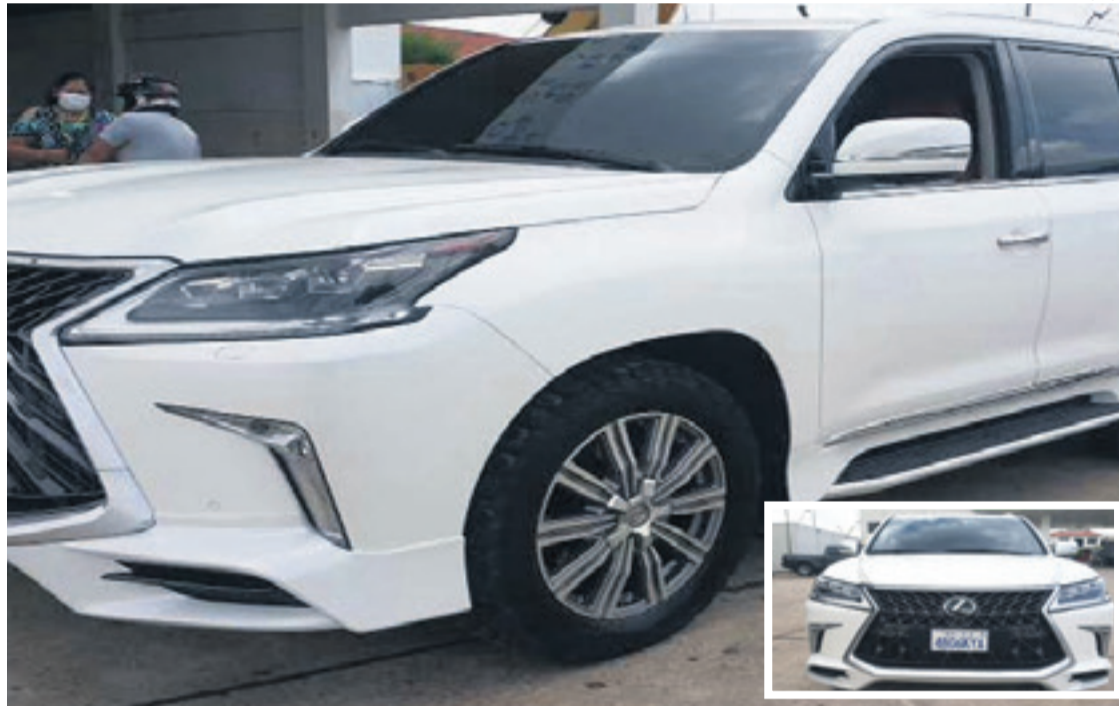
La vagoneta que fue interceptada por los policías y en la que viajaban dos jóvenes con el botín de dólares

Sin embargo, la Agencia Nacional de Hidrocarburos en su plataforma de control no registra el movimiento del vehículo y sus