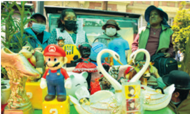
Los trabajos de los artesanos paceños se expusieron en la preferia.