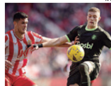
Girona, el equipo de Marcelo Claure, dejó en el camino al Rayo Vallecano

En los otros partidos destacó la despedida del Osasuna,