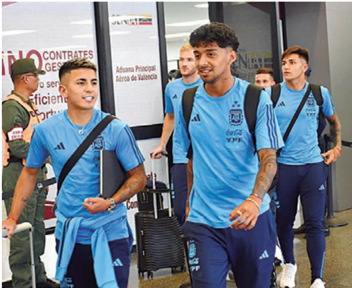
Integrantes del seleccionado argentino a su arribo a Venezuela, para participar en el Torneo Preolímpico que se inicia el sábado