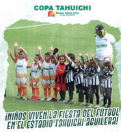
Los niños también compiten en la Copa Tahuichi