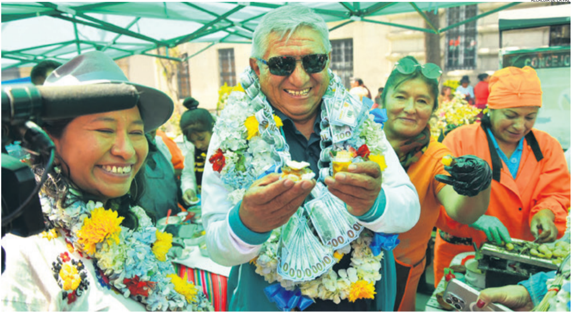
El alcalde de La Paz, Iván Arias, visitó la prefería de la Alasita y compartió con artesanos y del sector gastronómico de la feria. El 24 de enero inicia la fiesta de la abundancia.