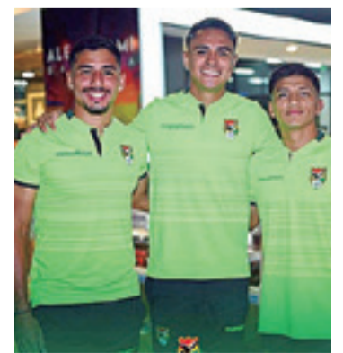
La Verde arribó a Caracas el mismo día que Perú y Colombia

Brasil fue campeón en siete ocasiones del certamen, seguida por la Argentina, que lo obtuvo en cinco oportunidades, y Paraguay, que la ganó una vez siendo anfitrión.