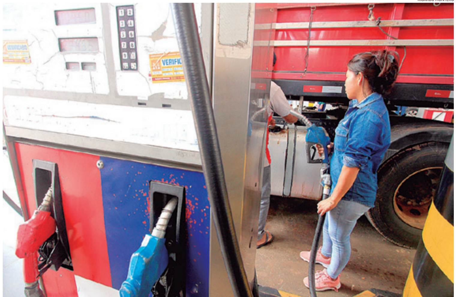
Los expertos sostienen que el mayor gasto del Estado se concentra en el subsidio sobre los combustibles como la gasolina y el diésel

"Recién hoy día está empezando a hacer el Poder Ejecutivo, el