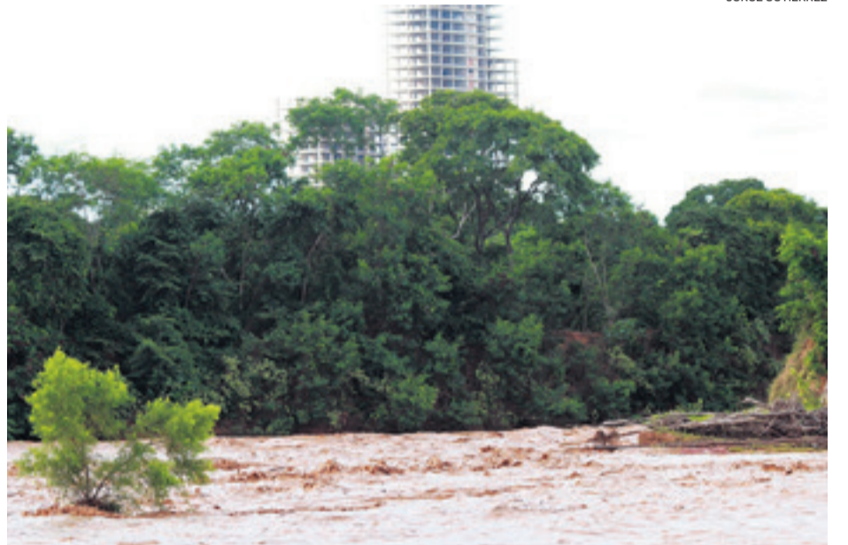
El turbión en el río Piraí. Se emitió la alerta para que no se realicen actividades