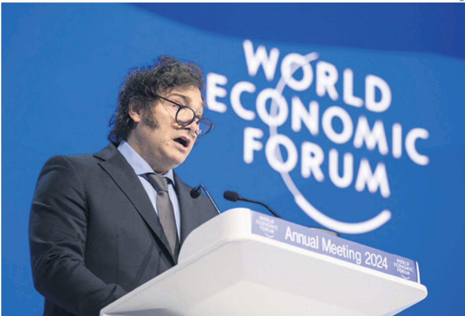
El mandatario argentino fue el principal orador en la jornada en el Foro Económico Mundial que se lleva a cabo en la ciudad suiza de Davos