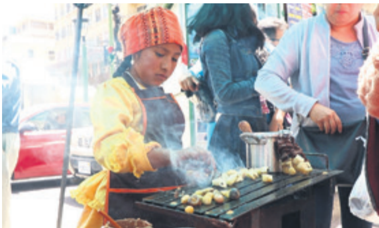
La gastronomía es parte fundamental de la feria de la Alasita.

zar el espacio agrícola”, relató el antropólogo Izaguirre.