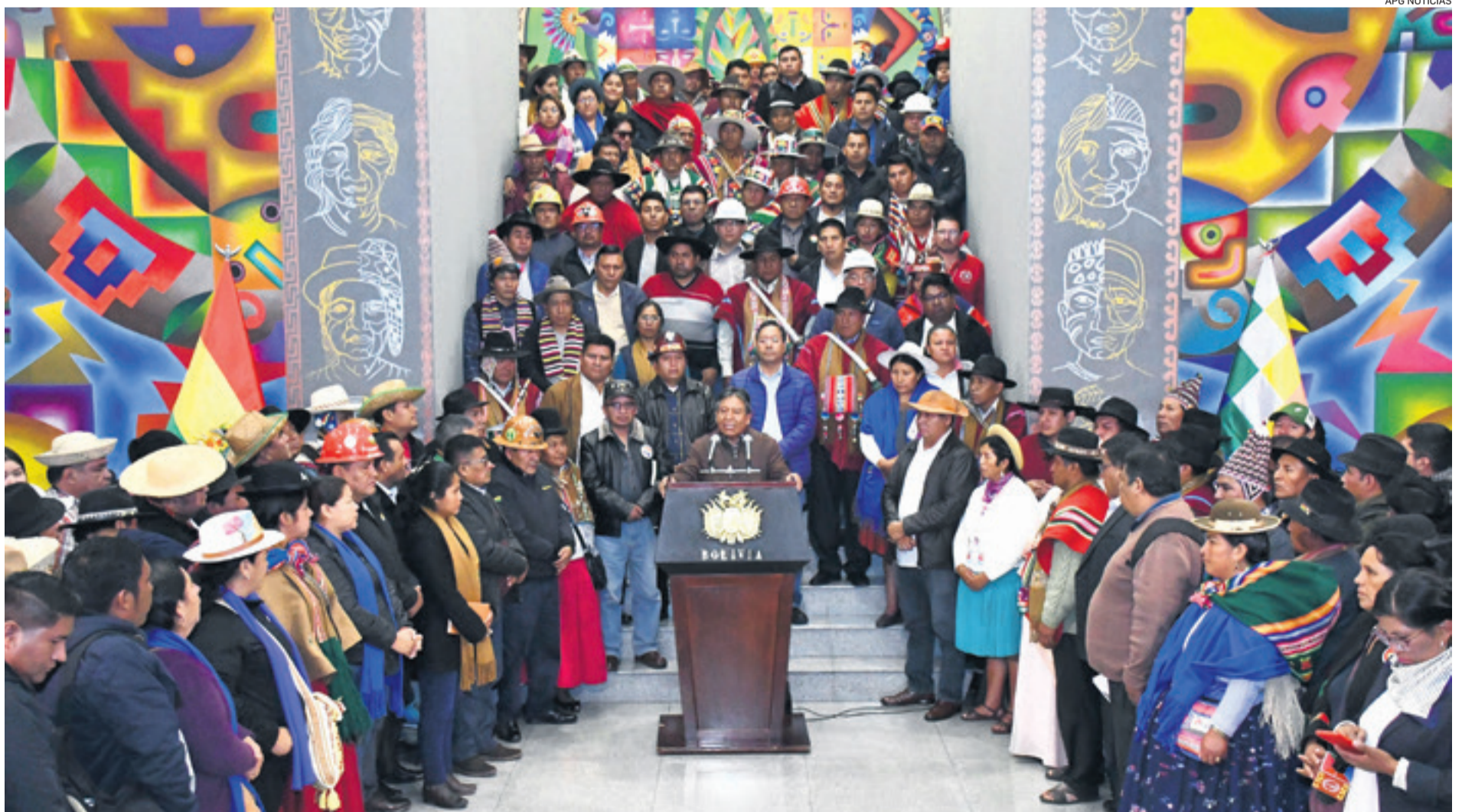
El pacto de unidad, afín al Gobierno, ya tiene los argumentos necesarios que les permitirán la convocatoria a congreso del MAS ante la negativa de su dirección nacional