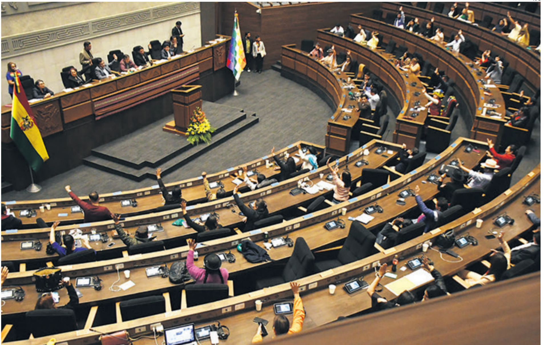
Sesión de la Asamblea Legislativa donde está pendiente el tratamiento de los proyectos de ley de las elecciones judiciales.

ANALISTA VE QUE EL BLOQUEO AFECTARÁ A LUIS ARCE