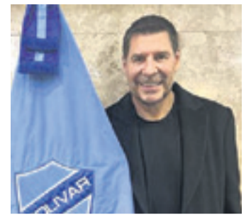
Marcelo Claure se queda un mes más