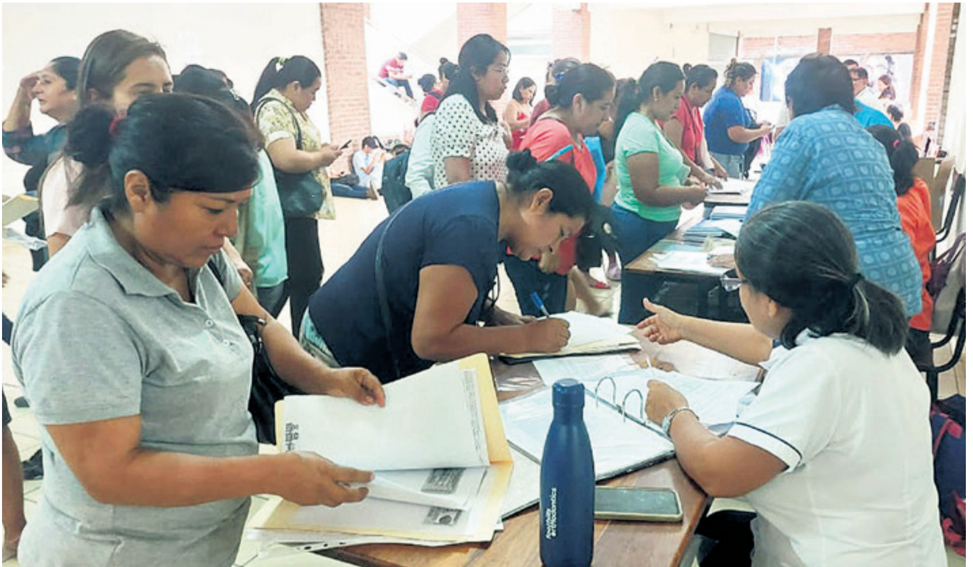
En el colegio Cástulo Chávez se lleva adelante la inscripción de los alumnos nuevos. El año pasado se hizo el proceso de preinscripción en este establecimiento