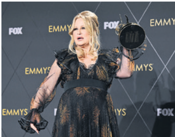
"No se den por vencidos con sus sueños", dijo Jennifer Coolidge