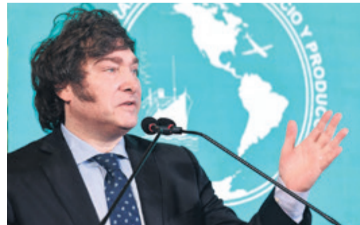
El mandatario argentino estará en el Foro Económico Mundial

Esa deuda es la más grande de un país con el organismo multilateral, un récord a dúo con una de las inflaciones más altas del mundo (211% en 2023). (AFP)