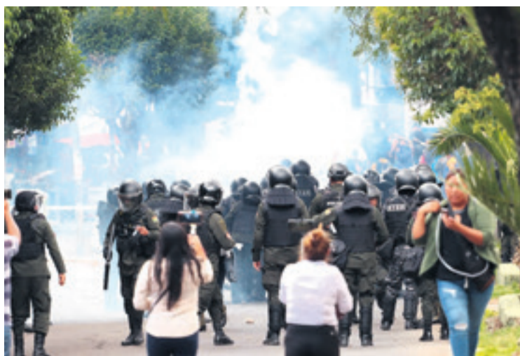
Los campesinos se enfrentaron a la Policía en las calles de Sucre