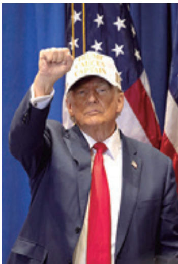
El exmandatario estadounidense es favorito para la nominación

El expresidente tiene amplia ventaja en los sondeos y se espera que gane holgadamente la primera etapa en el camino a convertirse nuevamente en el rival republicano del presidente demócrata Joe Biden en noviembre. (AFP)