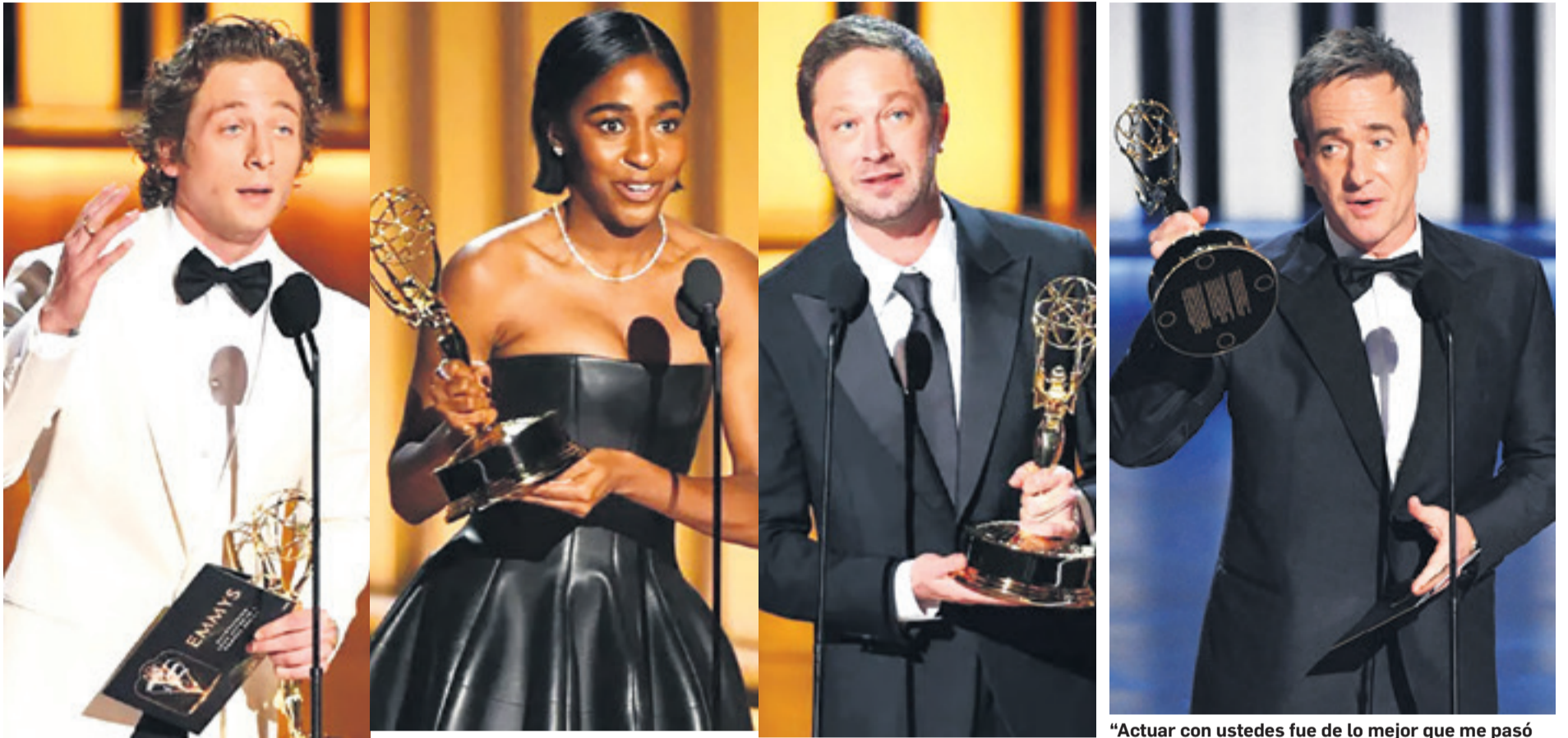
Jeremy Allen White, Ayo Edebiri y Ebon Moss-Bachrach, se llevaron las preciadas estatuillas por 'The Bear'