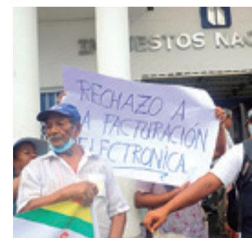
Malestar de los comerciantes

Entre diciembre de 2021 y diciembre de 2022 se emitieron 303,8 millones de facturas electrónicas, por un monto superior a Bs 391.000 millones, informaron desde el fisco a tiempo de lamentar las muestras de protesta de un sector de los gremialistas.