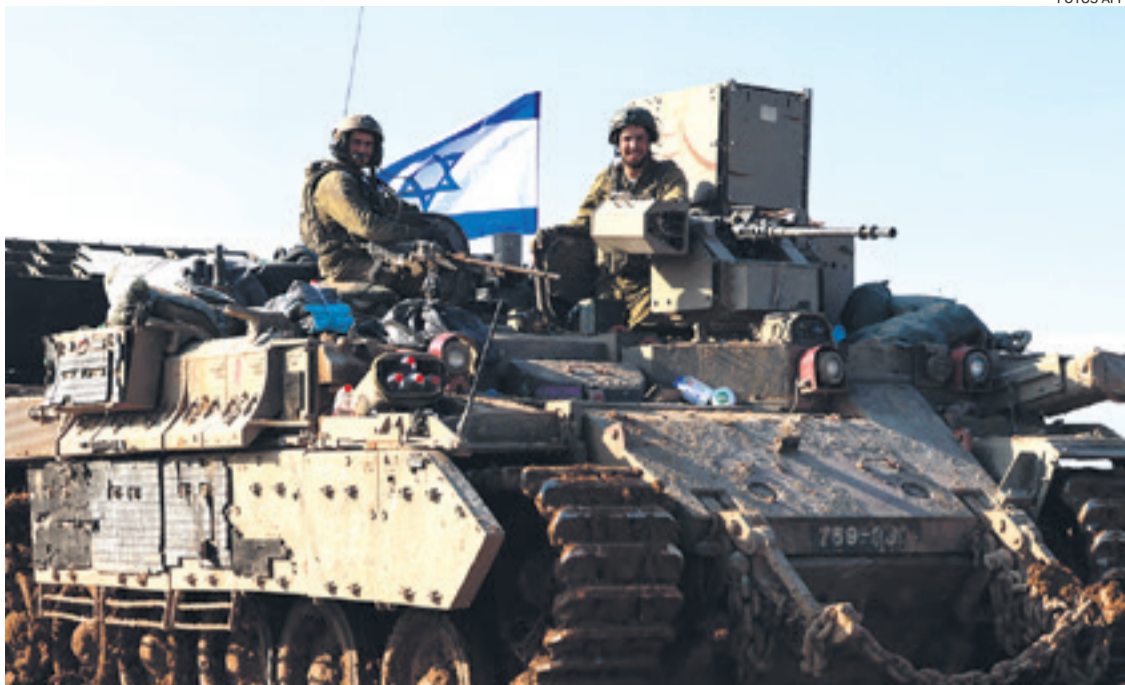
Israel continúa con sus ataques en la Franja de Gaza en busca de acabar con los combatientes de Hamás