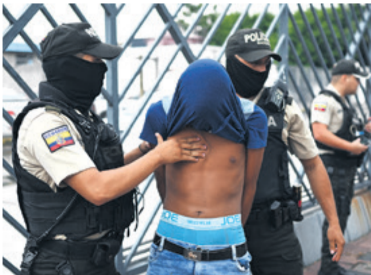
Las redadas de las fuerzas del orden continúan en Ecuador

Otálora anticipó que los gobiernos buscarán profundizar la coo-