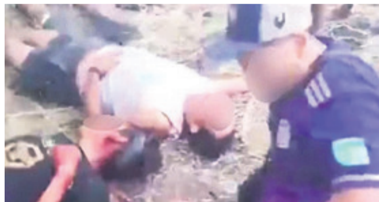
Otra de las víctimas de la disputa por tierras en Argentina

habitantes- que rodea a la capital argentina. Manuel Adorni, vocero del presidente Javier Milei, calificó como “penoso y lamentable” el episodio.