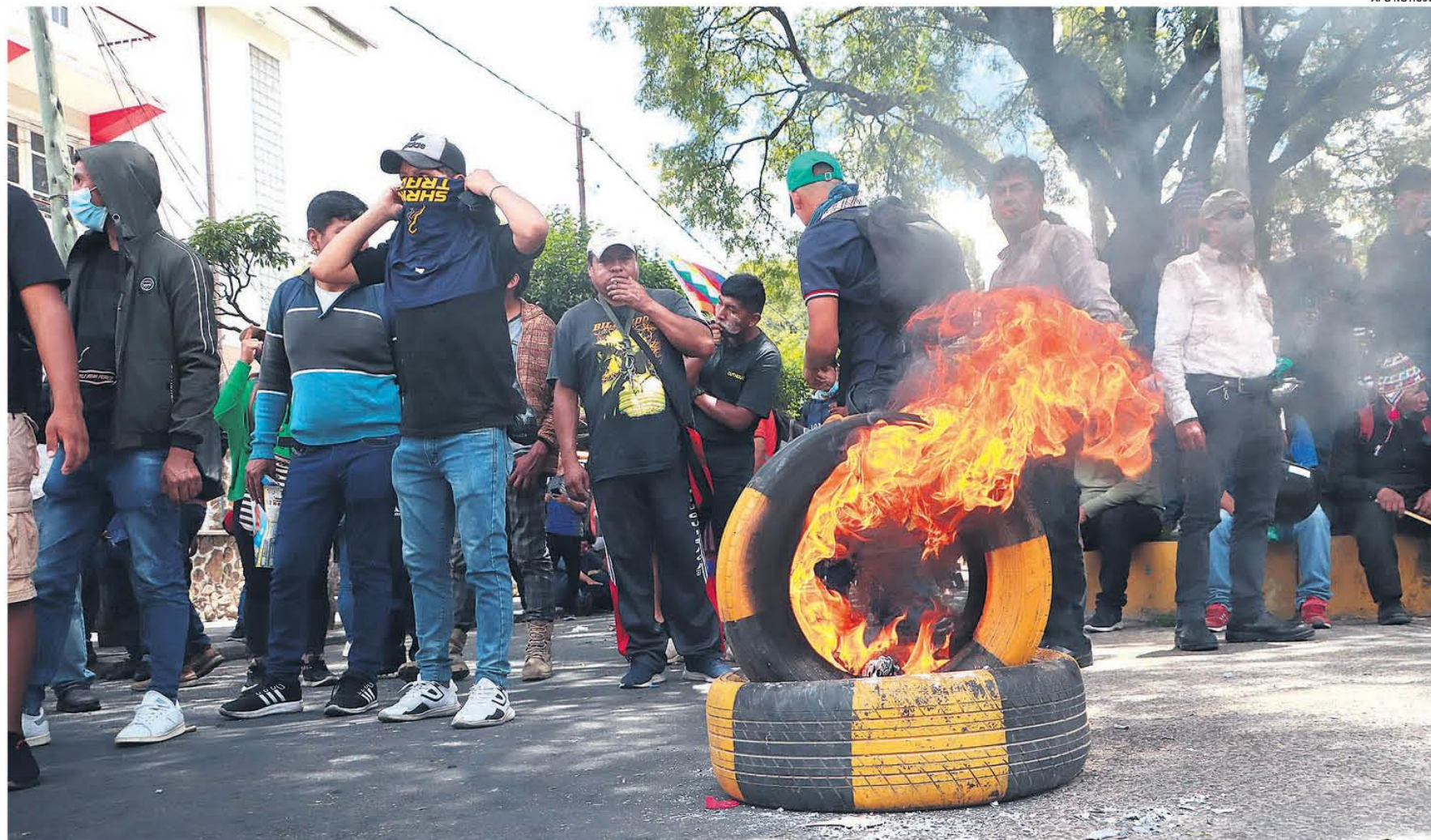
Bases afines al expresidente Evo Morales protestan en una zona cercana al TCP de Sucre para rechazar la prórroga de los magistrados. La policía se movilizó y utilizó gases