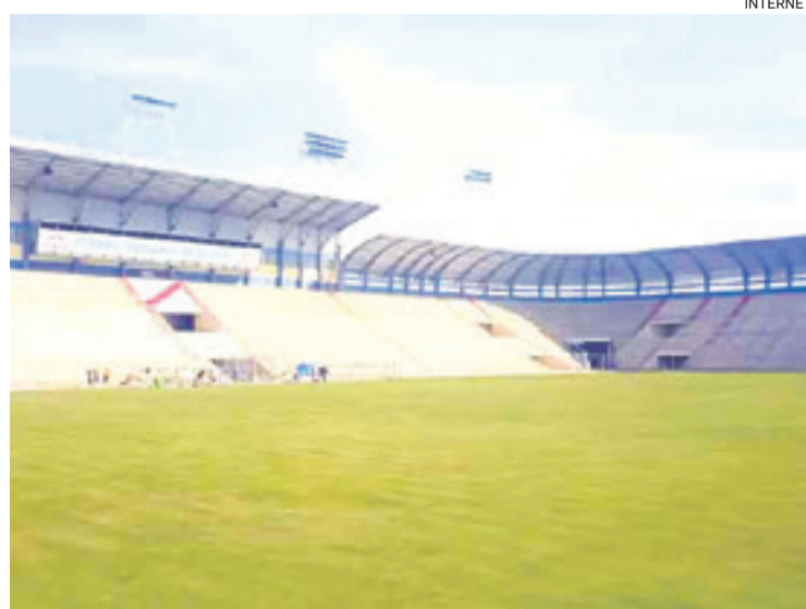
El nuevo césped natural del estadio Municipal de Villa Ingenio, en el Alto

La inspección de la entidad matriz del fútbol sudamericano será en los próximos días, y si aprueba, Always Ready podrá