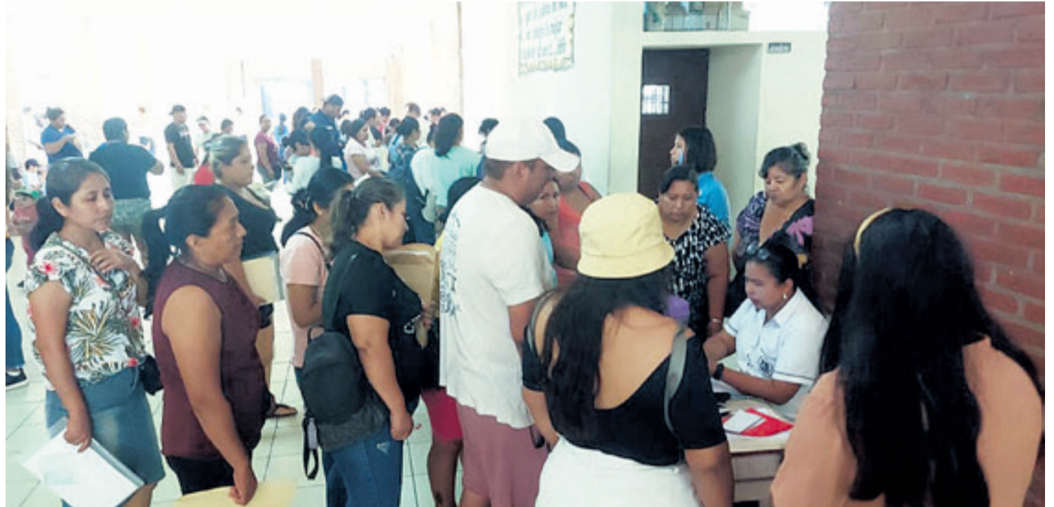
Los padres acudieron desde la madrugada. En algunos establecimientos las filas se mantuvieron con silla desde los primeros días de enero

El documento de Protocolo de Bioseguridad para el Retorno Seguro a Clases, elaborado por los ministerios de Salud y de Educación, establece las acciones que