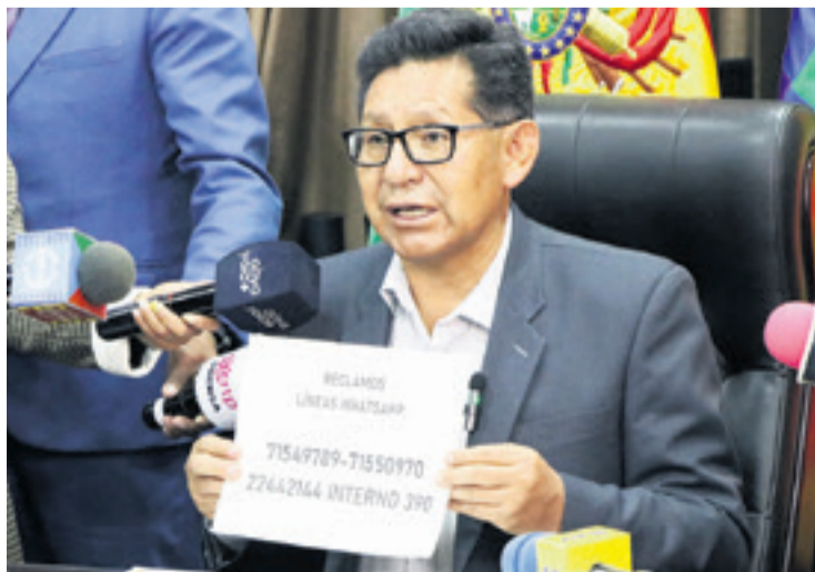
El Ministerio de Educación habilitó líneas para hacer los reclamos