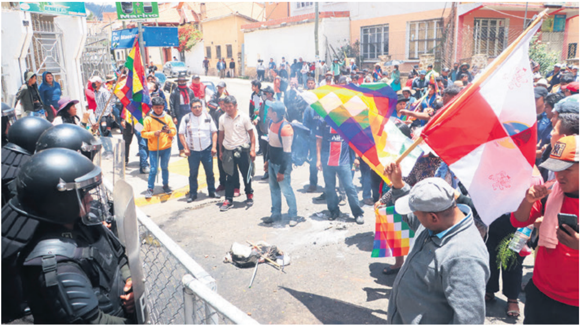
Los policías con equipos de reciente dotación custodian los accesos al TCP en Sucre ante la protesta de los seguidores de Evo Morales que rechaza la prórroga de magistrados

EL PACTO DE UNIDAD DE MORALES MIDE FUERZAS CON EL GOBIERNO