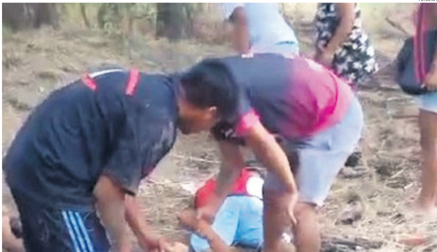
Después que ocurrió la balacera la gente trata de auxiliar a uno de los afectados por los disparos en la localidad de La Matanza

González Catán pertenece al municipio bonaerense de La Matanza, el más poblado del Gran Buenos Aires -1,83 millones de