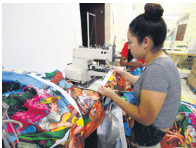
Parte del movimiento que hay en los locales en la calle Mercado

Y la hermosa Aitana I, reina del Carnaval 2024 fue la encargada de cerrar la noche con broche de oro, que llevó un traje majestuoso en los colores rojo y negro, acompañada de Los Ociosos, los coronadores de la presente gestión.