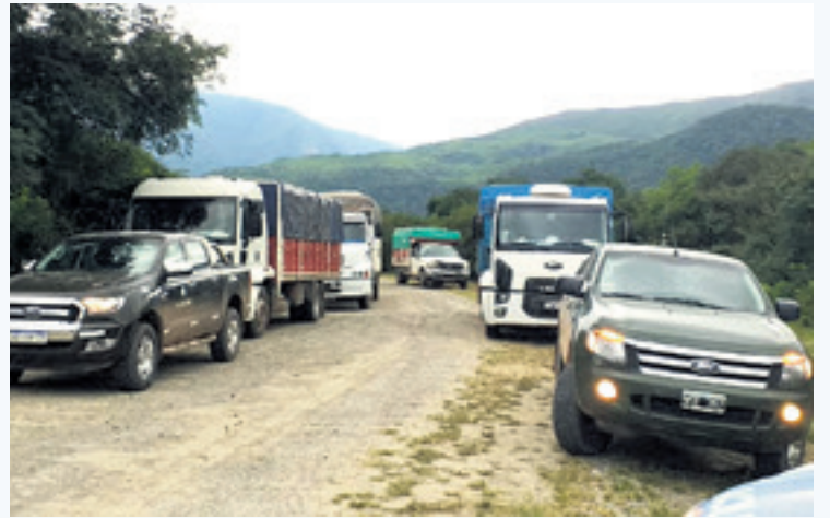
Los camiones que ingresan a la localidad argentina de Los Toldos.

"Se trata de una ruta experimental. Los Toldos