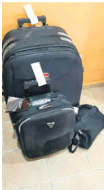
Fotos de equipaje, documentos de identidad que usan los delincuentes y hasta un pago realizado desde EEUU