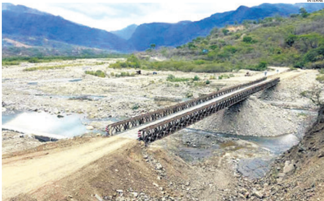
Este es el puente que une Los Toldos con La Mamora. Ahora, por la crecida del río, quedó inutilizado.

A Los Toldos se puede llegar desde otras regiones de Argentina por la construcción de la vía Los Toldos-Santa Victoria Este. Esa ruta es la utilizada por contrabandistas, quienes luego siguen su camino hacia La Mamora.