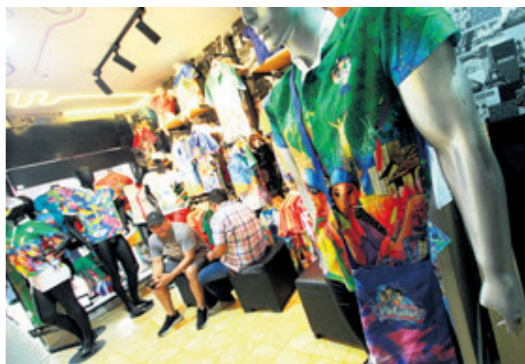
Amigos y familias también buscan casacas para el Carnaval 2024

Coincide con el Servicio Departamental de Salud (Sedes) en que hasta la primera semana de febrero se tenga el pico y a partir de la segunda semana comience el descenso. Indicó que se tienen que cumplir las medidas de bioseguridad para ayudar al descenso de este brote. Movilizarán brigadas de salud, que también harán pruebas, durante los días de Carnaval.