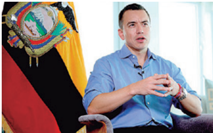
Noboa encara una de las peores crisis sociales en Ecuador

cha que el narco hubiera cruzado a su territorio, donde existen los mayores cultivos de coca del mundo.