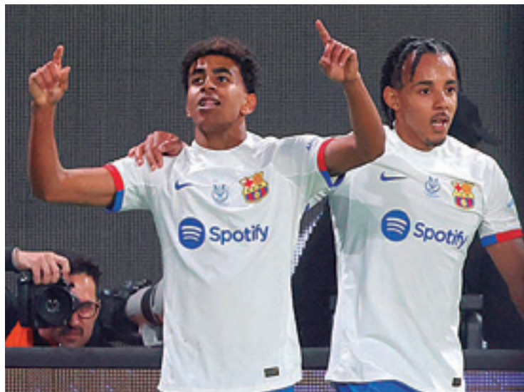
Barcelona defiende el título que le ganó al Real Madrid en la temporada pasada

El control del balón es la clave azulgrana para tratar de volver a repetir victoria sobre el Real Madrid, al que venció 3-1 en enero de 2023 en la capital saudí.