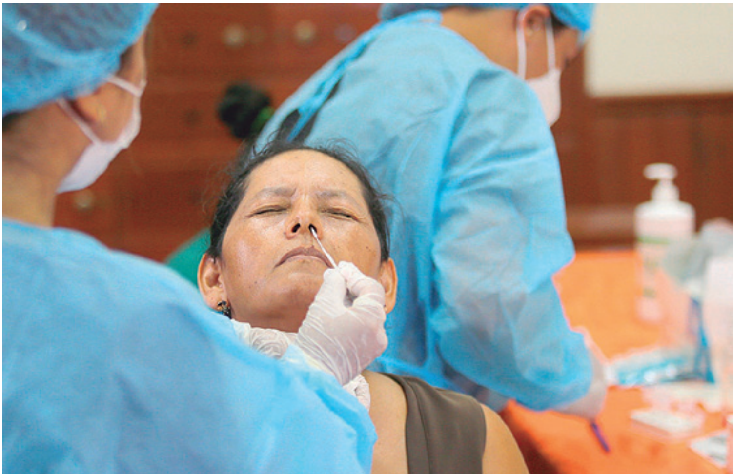
Santa Cruz acapara los casos de covid-19, se vienen el Carnaval y luego las clases. Se espera que para entonces las cifras bajen