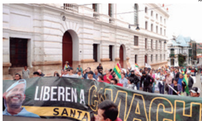
La segunda semana de enero fue de protestas y viglias en Sucre

Ante la ola de críticas, movilizaciones y denuncias contra los magistrados y consejeros del Órgano Judicial, el bando ‘arcista’ salió a responder a los ‘evistas’ al afirmar que “el primer prorrogado” es el propio expresidente Evo Morales que se valió de una sentencia constitucional, la 0084/2017 para optar por una reelección indefinida, sin respetar la Constitución Política del Estado. “El primer prorrogado ha sido Evo Morales desde el momento en el que incumplió la Constitución Política del Estado y actuó de la misma manera que (Mariano) Melgarejo, quien,