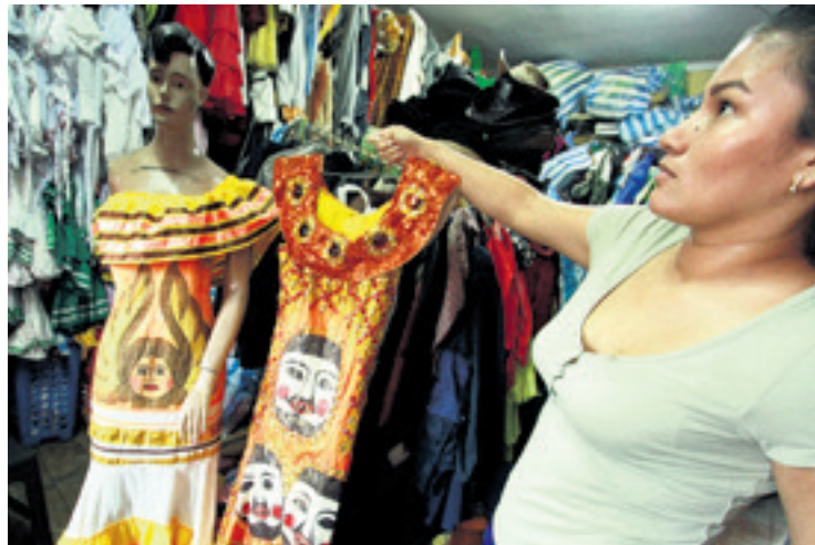
Los trajes típicos también tiene gran demanda en la calle Ballivián

Los precios van desde Bs 65 la unidad, para las opciones más