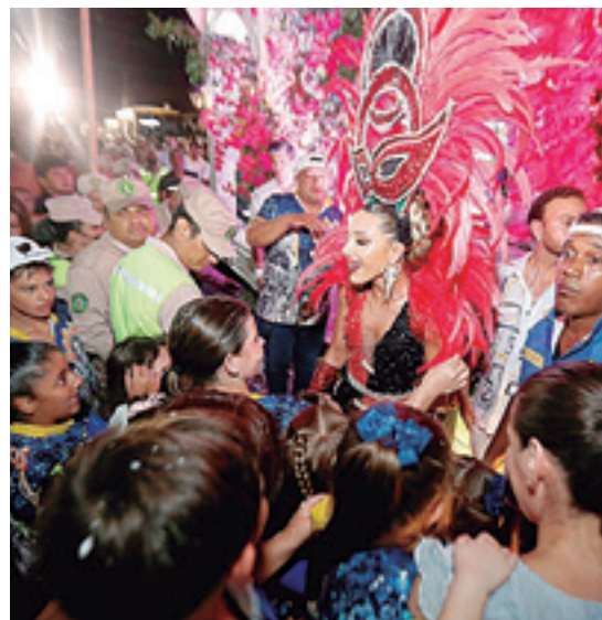
Aitana I disfrutó con el público la segunda preca