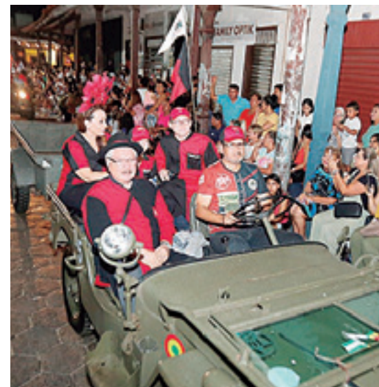
Los Tauras pasearon en los emblemáticos Willy's