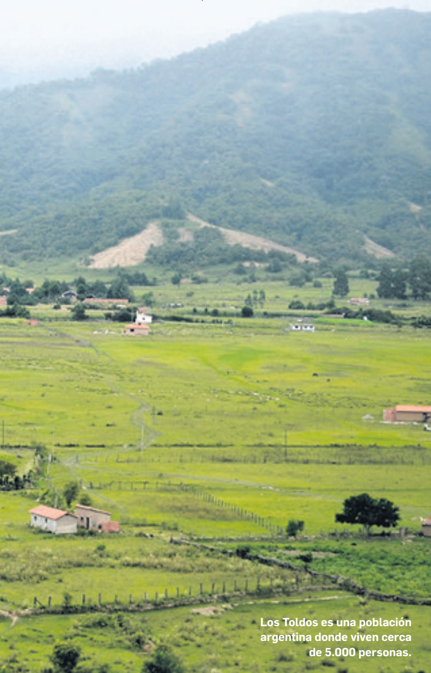
Los Toldos es una población argentina donde viven cerca de 5.000 personas.

"Se rompen las bases de soporte y queda inutilizado en forma temporal, causando el aislamiento total de los pobladores y poniendo en riesgo su vida. Es por ello que resulta indispensable el estudio y factibilidad técnica para poder proyectar y gestionar los recursos para la construcción de esta estructura de gran necesidad para esta población", dijo Acosta.