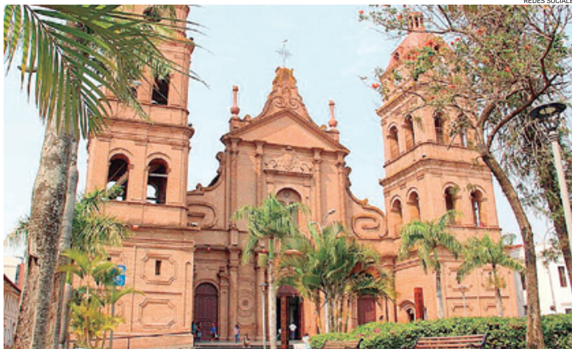
El edificio viene desde los tiempos del Virrey Francisco Álvarez de Toledo. Fue restaurado varias veces

Según el CIC-SC, la superficie total construida en el templo es de 3.981 m2 en sus dos niveles, donde se identificaron fisuras en el piso del atrio; deterioro en la cubierta de la nave principal, ahí