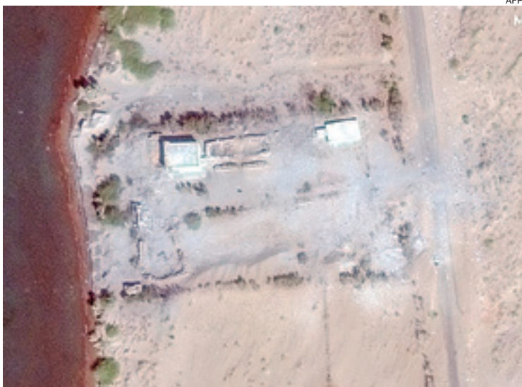
Imágenes de un nuevo ataque contra las posiciones hutíes en Yemen

Estados Unidos atacó a los hutíes, que a su vez dispararon contra los buques que cruzaban el mar Rojo