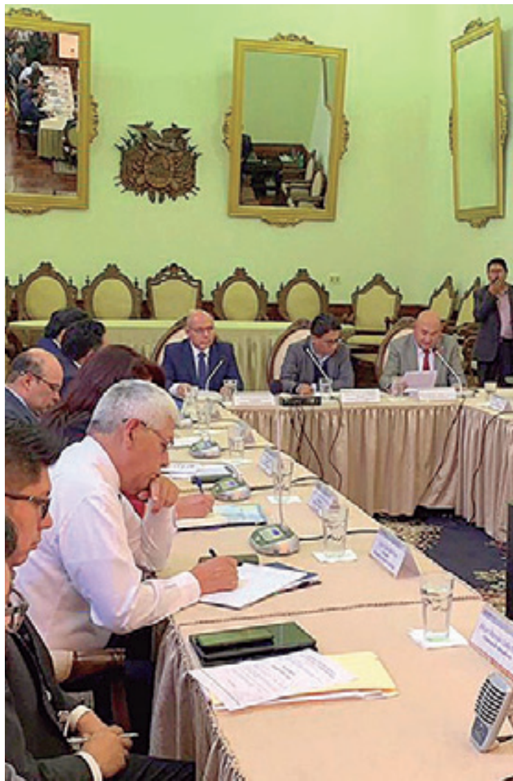
El ministro Iván Lima junto a los magistrados del Órgano Judicial

“Hay parlamentarios, diputados, senadores y líderes políticos, que quieren seguir con el cuoteo