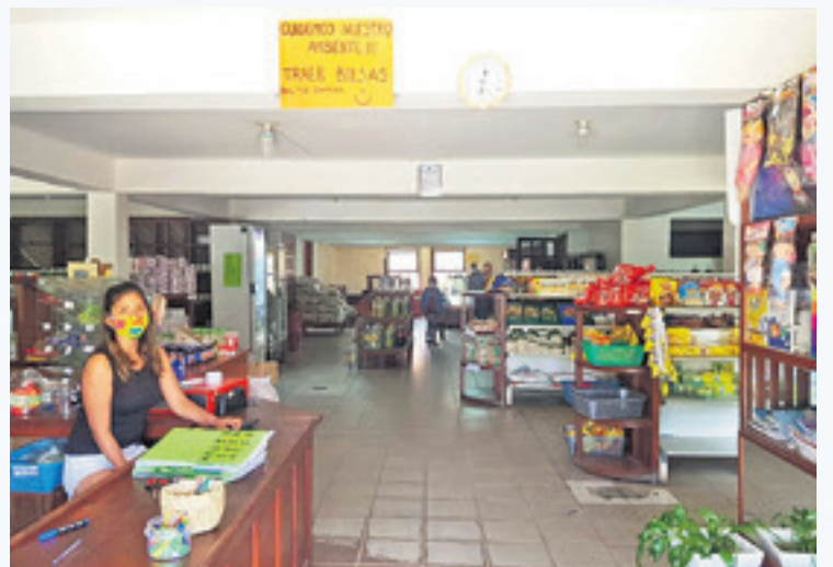
Un negocio en Los Toldos donde se venden productos bolivianos.