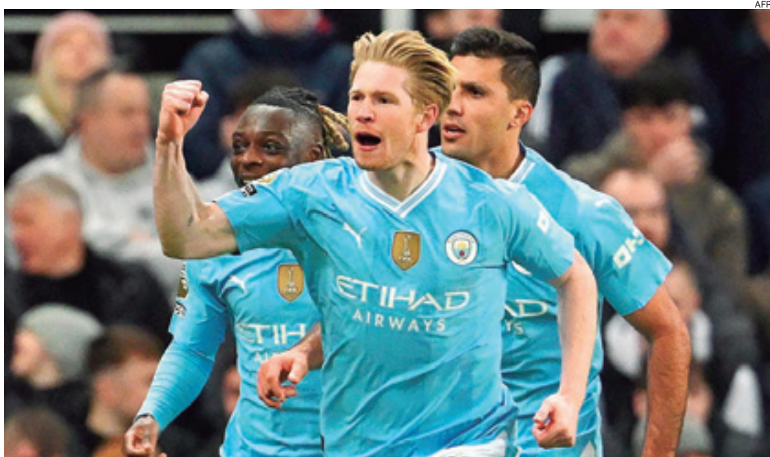
Kevin De Bruyne volvió con todo en el Manchester City, que ayer se impuso sobre la hora al Newcastle y quedó a dos puntos del Liverpool