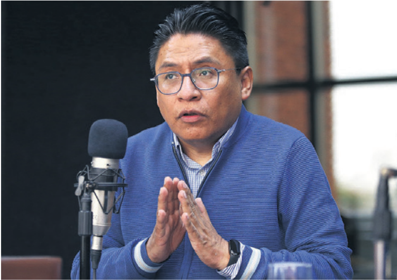
El ministro Iván Lima visitó ayer los estudios de EL DEBER Radio y habló sobre la crisis de la justicia boliviana y las elecciones judiciales.

ENTREVISTA / IVÁN LIMA MINISTRO DE JUSTICIA