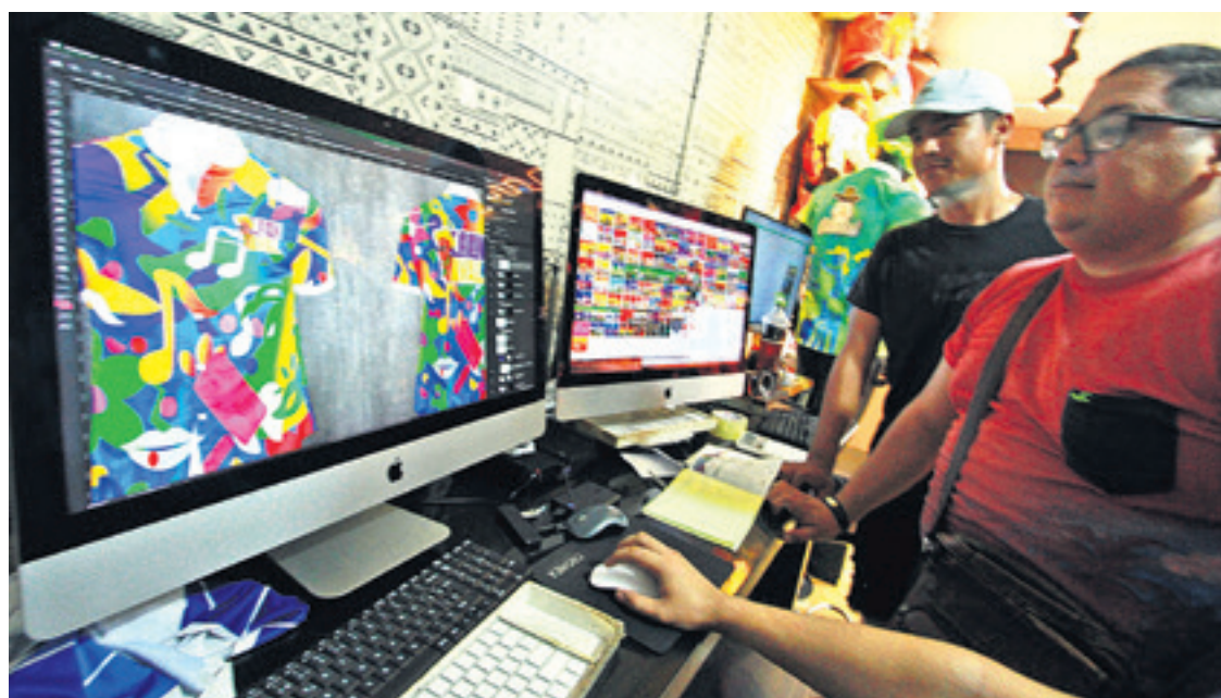
Las personas solicitan diseños personalizados y cotizan precios al por mayor para abaratar costos

Fernández indicó que hay mucha expectativa de personas que quieren visitar la capital cruceña durante los días de Carnaval, por lo que se está prevé una reunión con los representantes hoteleros para ver algunos incentivos.