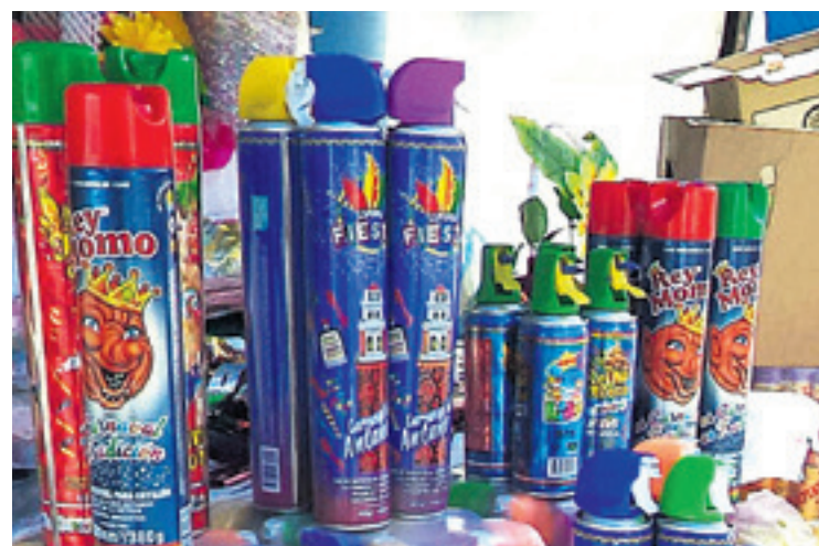
La Alcaldía pide comprar espumas de las marcas autorizadas