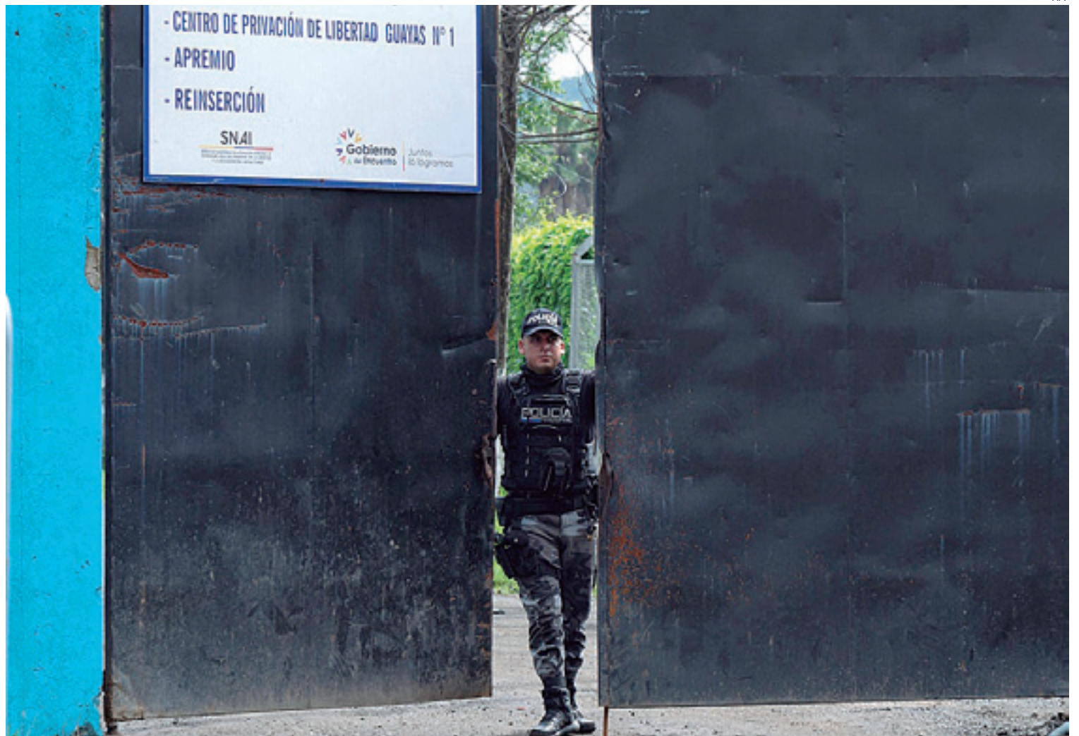
Todavía quedan más de cien funcionarios del sistema penitenciario de ese país secuestrados por los delincuentes