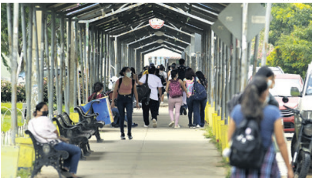
En la universidad pública cruceña realizan auditorías a todas las facultades por indicios de corrupción.

El presidente Arce fue muy claro. Nosotros no nos vamos a callar ya, y vamos a decir con total veracidad lo que está ocurriendo en este país. Y lo afirmamos con argumentos, con pruebas y con documentos. Lo que está pasando en Sucre no es una posición del pueblo boliviano, no es una posición que tenga el país, es una posición de Evo Morales sobre la reelección. Seamos claros, acá lo que necesita Evo Morales es un nuevo Tribunal Constitucional para habilitar su reelección, que es inconstitucional. El (artículo) 203 de la Constitución dice que esa sentencia que emitió el Tribunal Constitucional es definitiva y causa Estado. Y esa sentencia ha dicho que la Constitución boliviana prevé una sola reelección. Esta es la intención de Evo Morales de desestabilizar y destruir el Órgano Judicial, que no haya elecciones judiciales y que entremos en un vacío institucional. Acá hay intereses, y el interés de la movilización y del problema en este momento solo es de Evo Morales y es por la reelección.