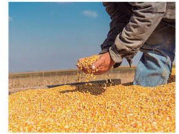
Maíz, trigo y arroz se subvencionan

Directo. El ministro de Justicia dice que parlamentarios y líderes políticos quieren seguir con el cuoteo de la justicia. A2-5