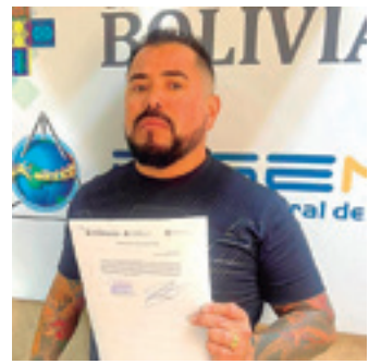
Riola fue detenido en Bolivia

Como estas, hay otras historias en las que personas sin escrúpulos se comunican desde Santa Cruz para operar de esta manera con familiares de gente que radica muchos años en Estados Unidos.